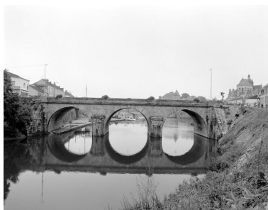
Vue d'amont.