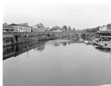
Vue d'aval.