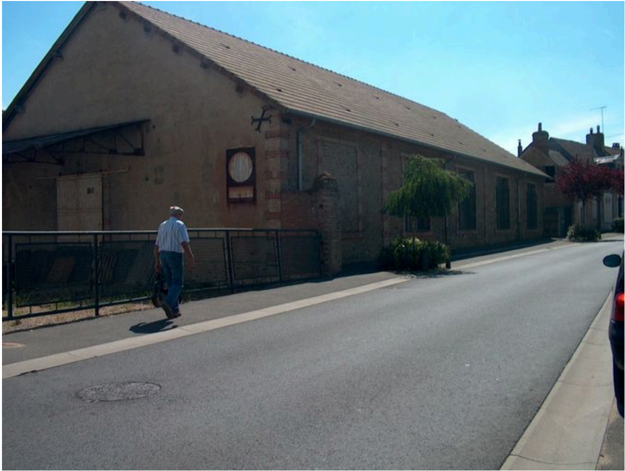
Vue d'ensemble de l'usine.