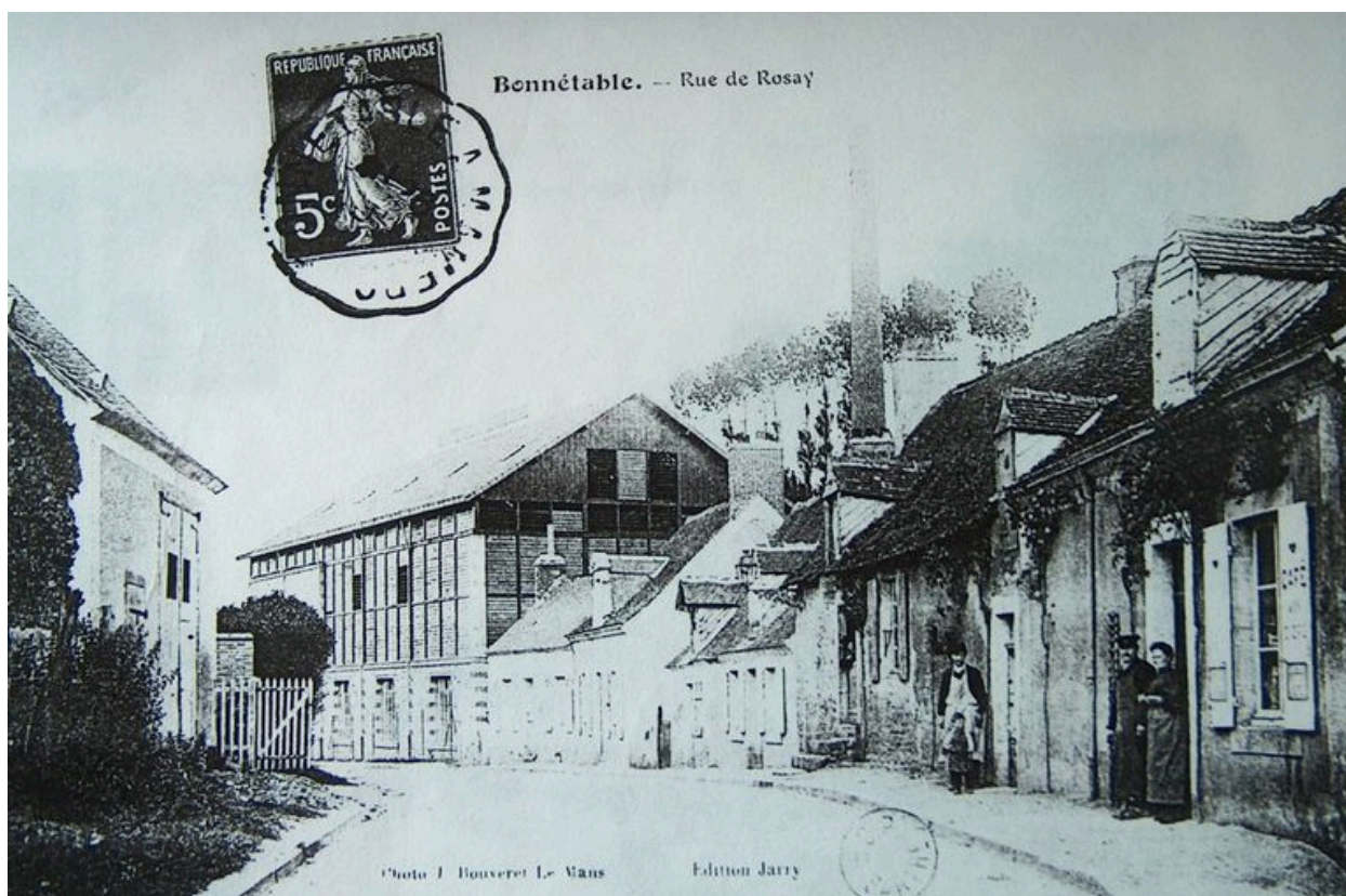
Vue d'ensemble de la tannerie.