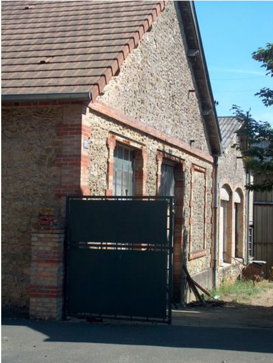
Vue d'ensemble de l'atelier de fabrication de la tannerie.