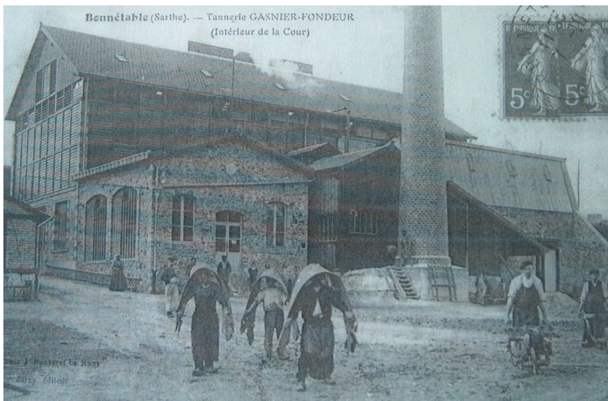
Vue d'ensemble de la tannerie.