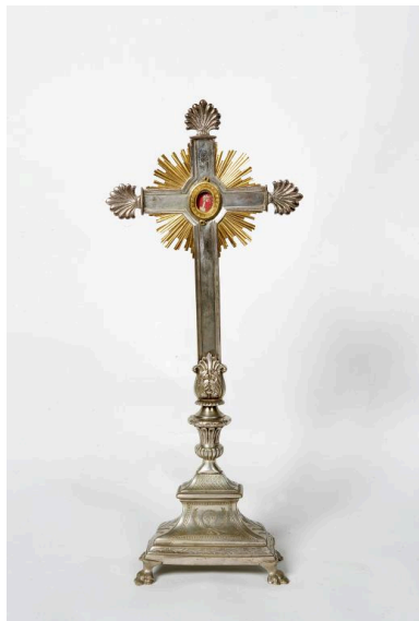
La croix-reliquaire de la vraie croix.