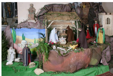
La crèche. IVR52_20075301019NUCA