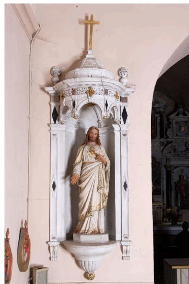
La statue du Sacré Cœur et sa niche néo-Renaissance. IVR52_20065302773NUCA