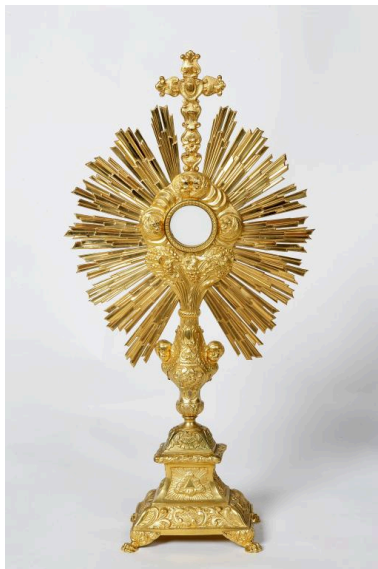
L'ostensoir. IVR52_20075301023NUCA