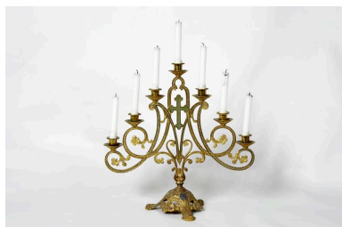
Chandelier à sept bobèches. IVR52_20075301024NUCA