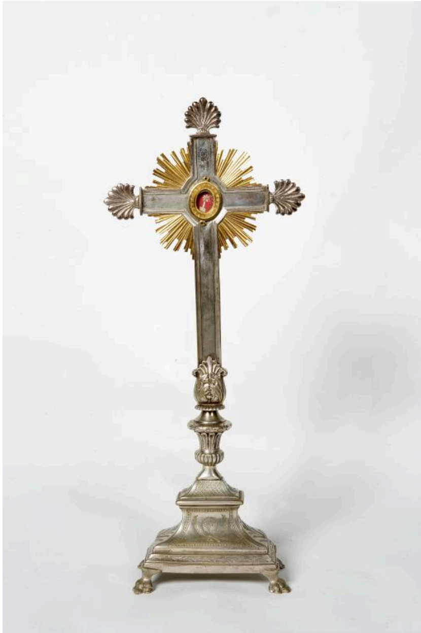
La croix-reliquaire de la vraie croix.