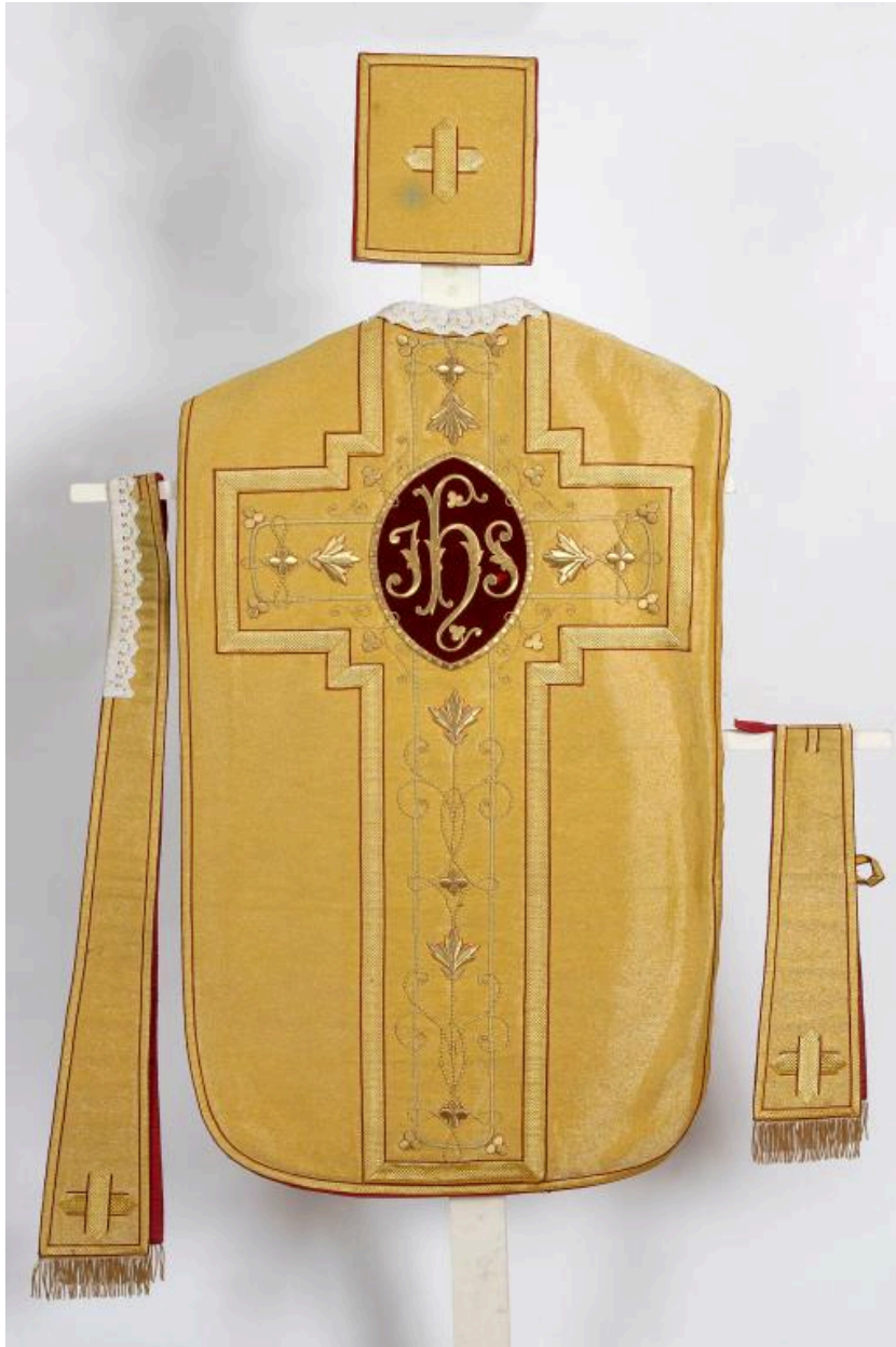
L'ornement doré signé Vanpoule.