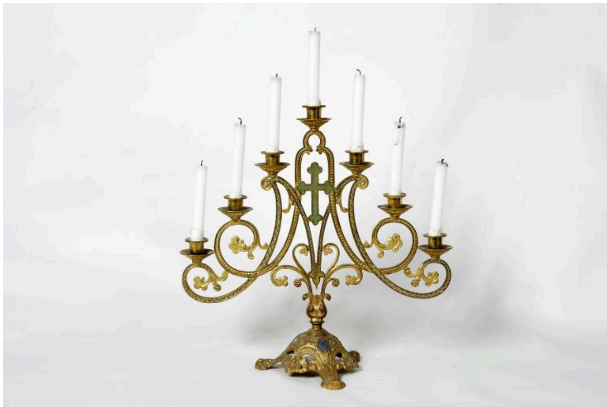
Chandelier à sept bobèches.