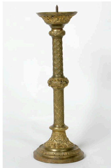
Chandelier néo-roman.