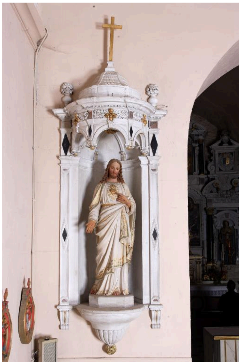
La statue du Sacré Cœur et sa niche néo-Renaissance.