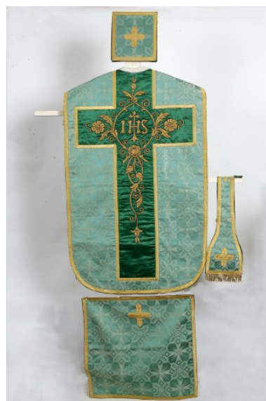
Ornement vert. IVR52_20075302551NUCA