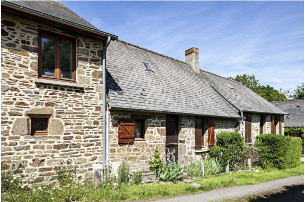
Façade est de la maison centrale.