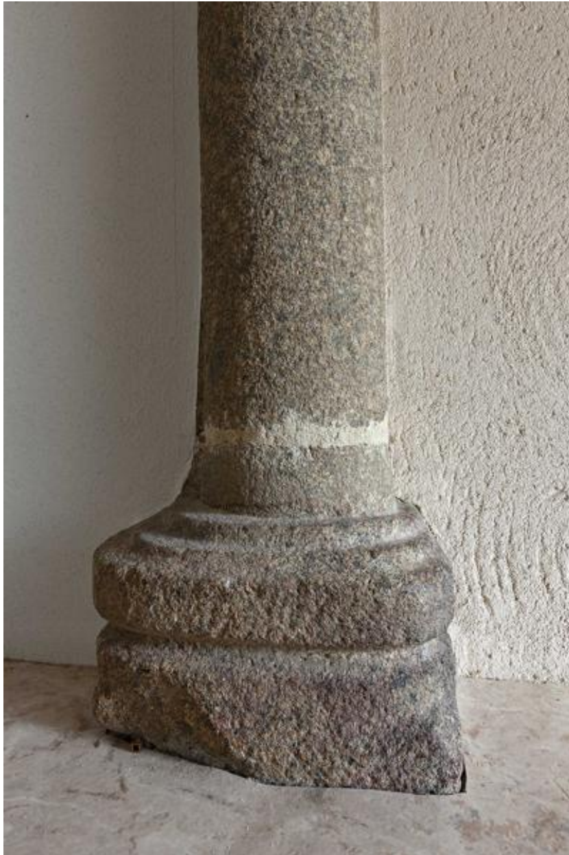
Base du piédroit de la cheminée du premier niveau, ornée d'une moulure torique.