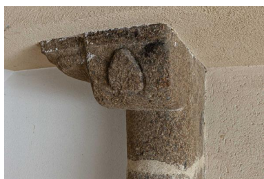
Corbeau orné d'un écu de la cheminée du premier étage.