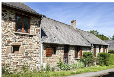
Façade est de la maison centrale. IVR52_20215300670NUCA