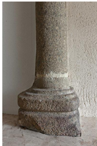
Base du piédroit de la cheminée du premier niveau, ornée d'une moulure torique.

Cheminée du premier étage, maison nord.