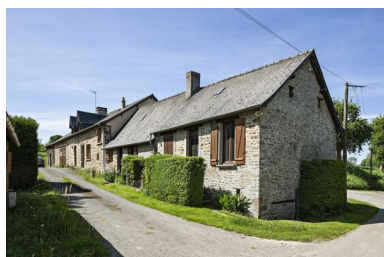
Alignement de 3 maisons, hameau de la Beslinière.