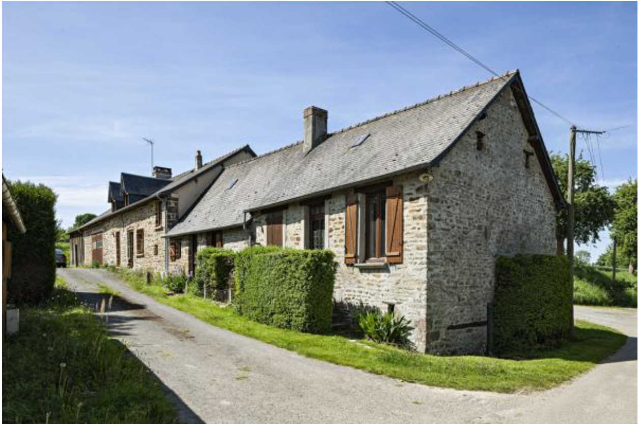
Alignement de 3 maisons, hameau de la Beslinière.