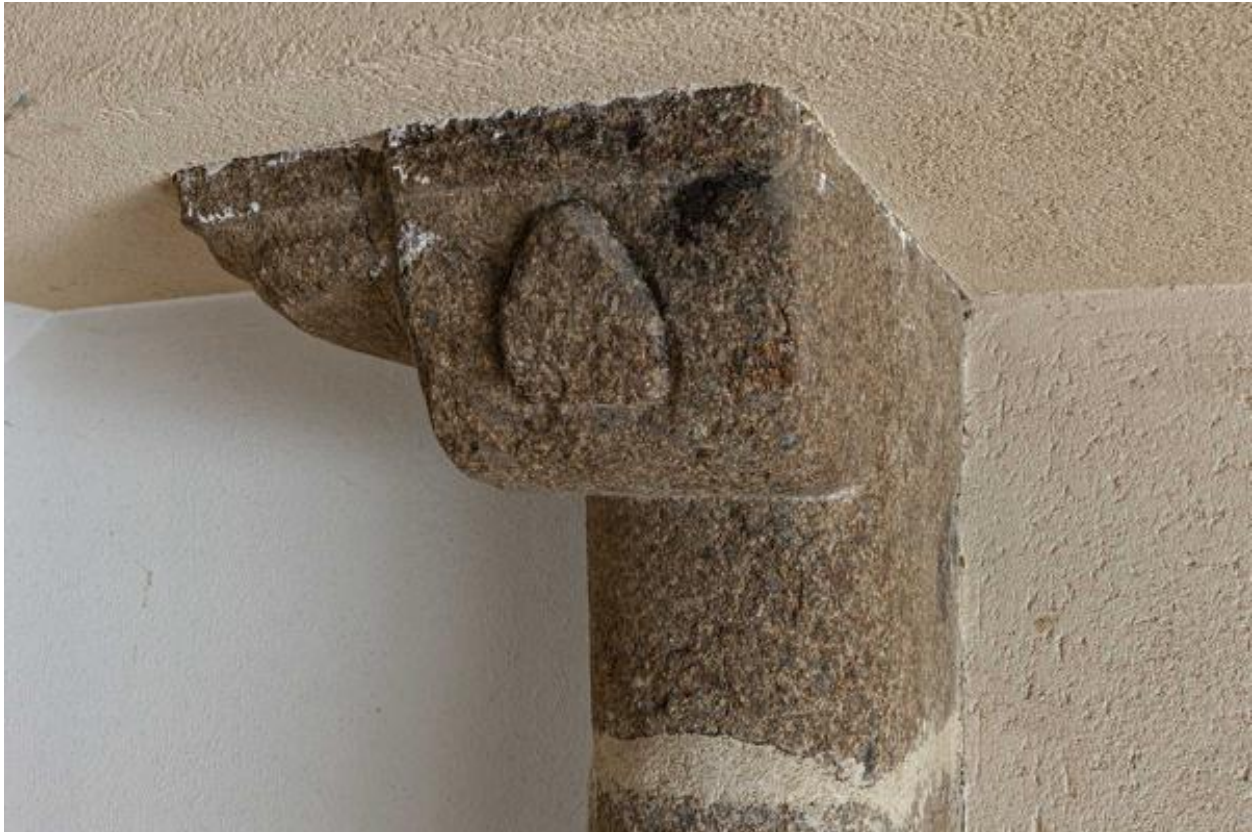
Corbeau orné d'un écu de la cheminée du premier étage.