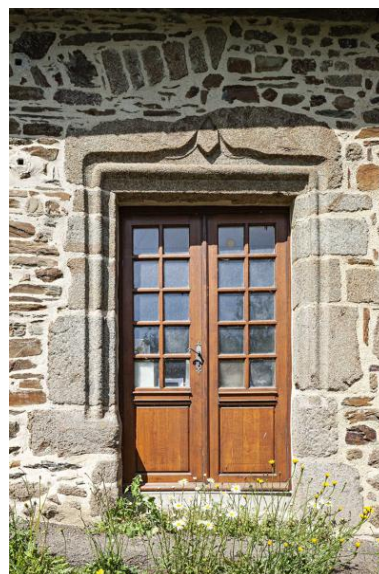
Porte est de la maison sud. IVR52_20215300669NUCA