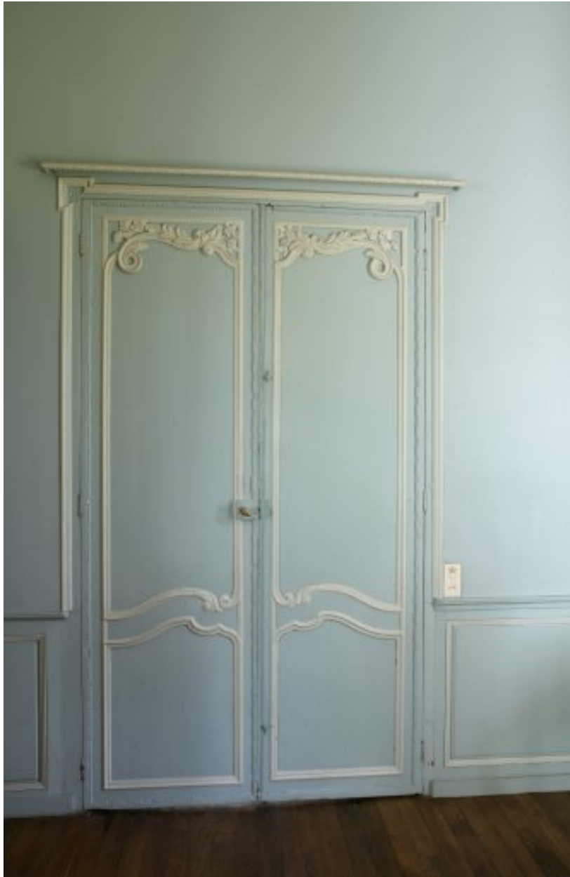
Porte du salon à droite du couloir d'entrée.