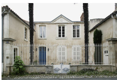
Façade donnant sur la cour antérieure, rue Alexis-Vinçonneau.