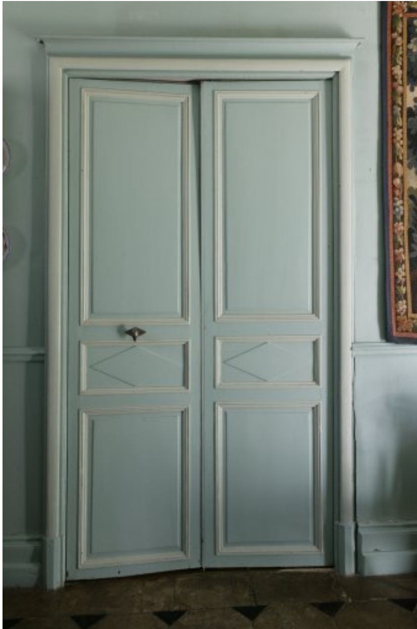
Porte donnant accès au salon à gauche du couloir.