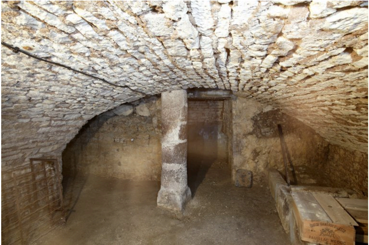
Vue prise du fond du sous-sol.