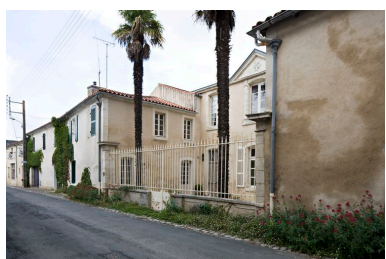
Façade est, donnant sur la rue Alexis-Vinçonneau.