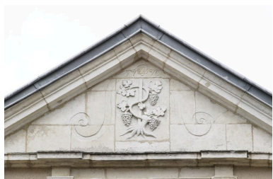
Fronton de la façade sur cour, portant la date 1776 et les armes des Guillebot (propriétaires de