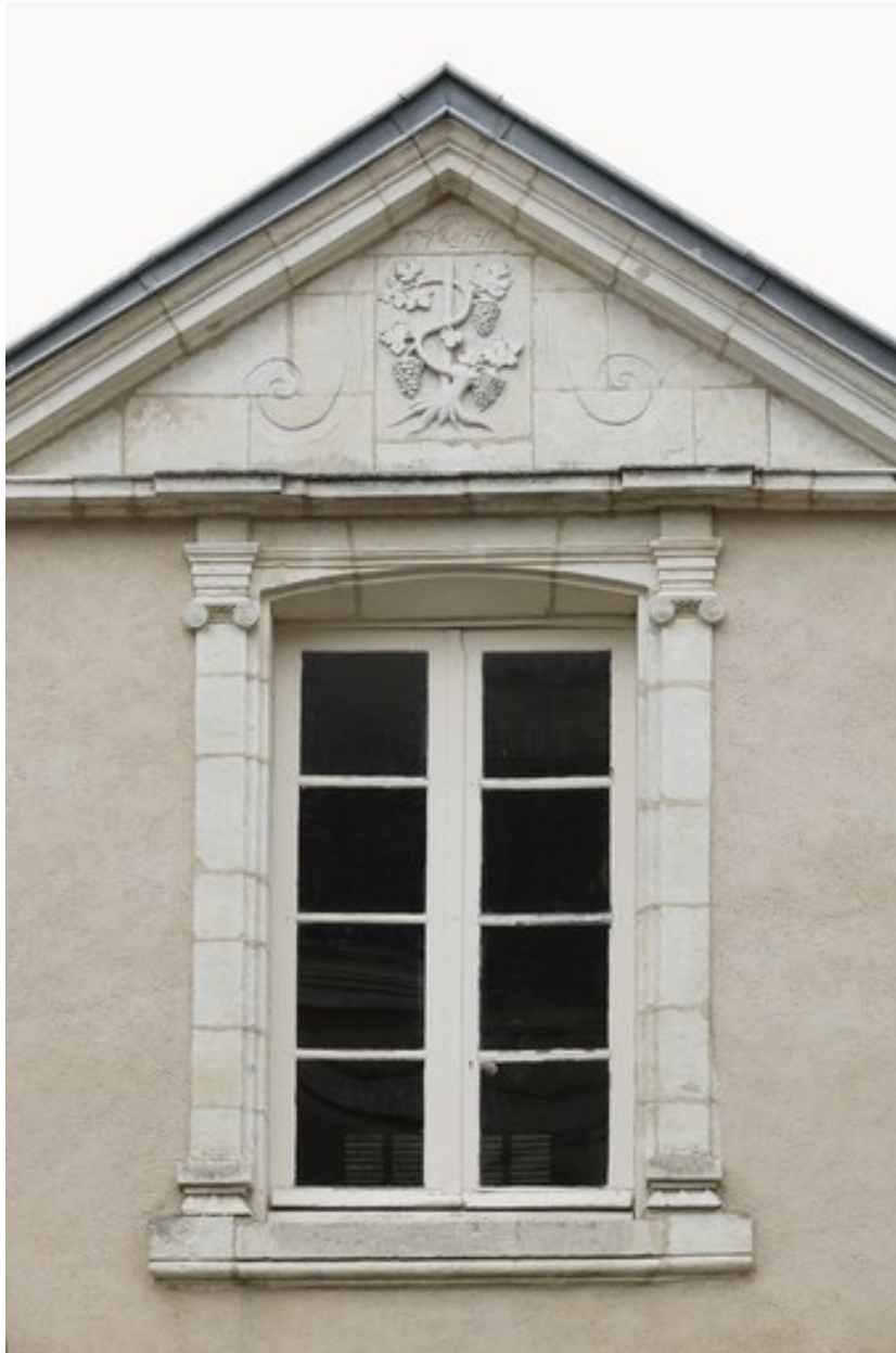
Détail de la partie centrale de la façade sur cour.