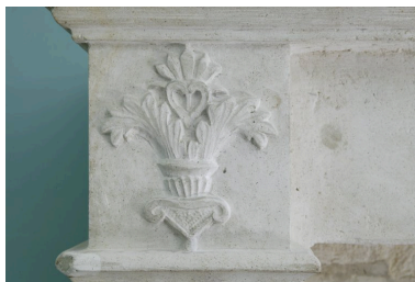
Détail de l'un des piédroits de la cheminée de la fig. précédente. IVR52_20078500406NUCA