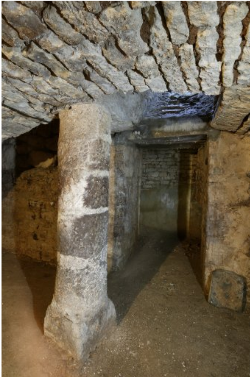
Vue prise du sous-sol, montrant la colonne remployée.