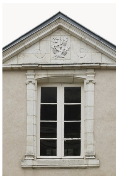
Détail de la partie centrale de la façade sur cour. IVR52_20088500861NUCA