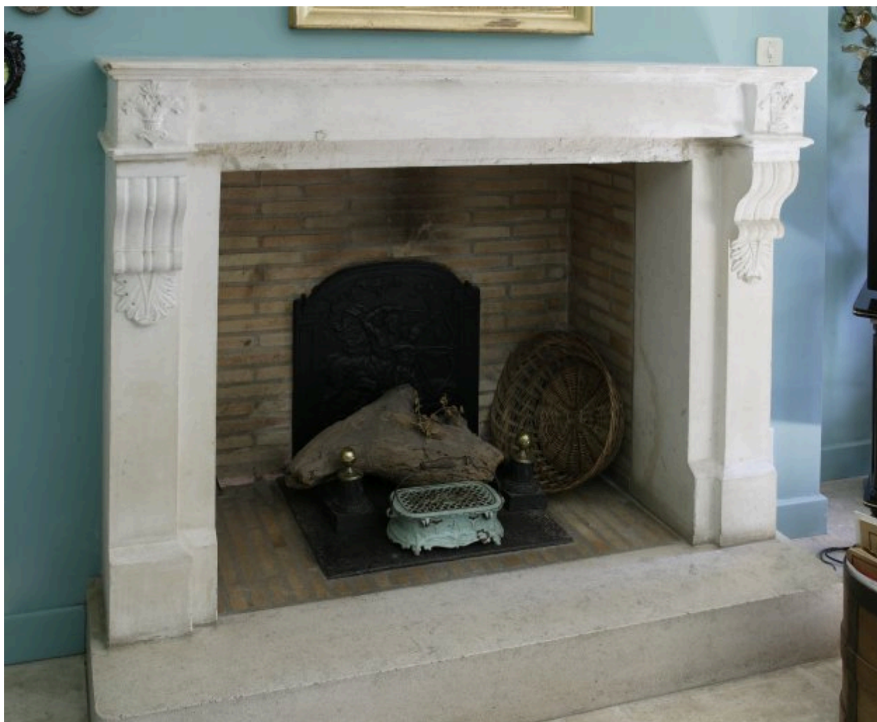
Cheminée de la 2e moitié du XIXe siècle, dans la pièce la plus au sud sur jardin. Elle est identique à celle du petit bâtiment à l'est de l'entrée, au collège Richelieu.