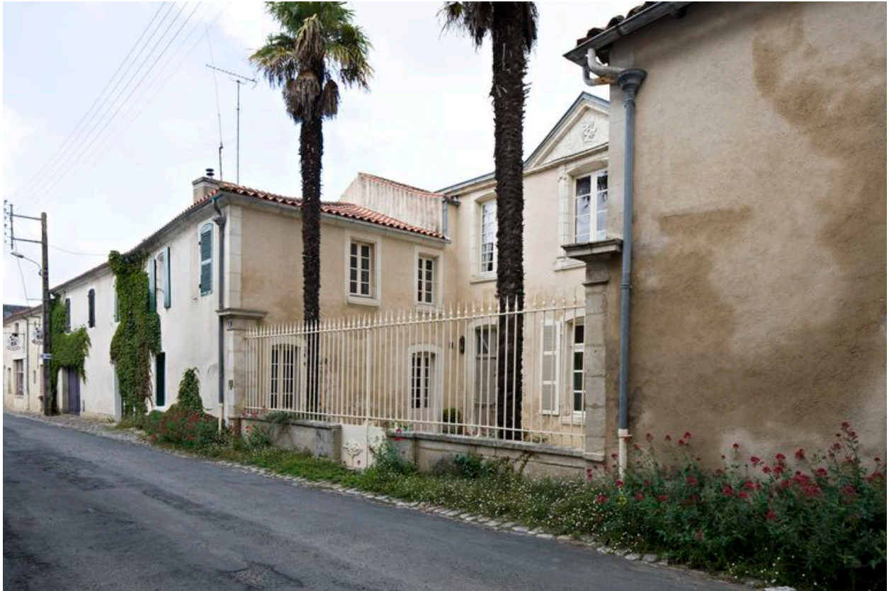
Façade est, donnant sur la rue Alexis-Vinçonneau.