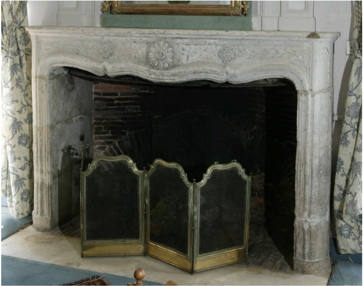
Cheminée du salon situé à gauche du couloir.