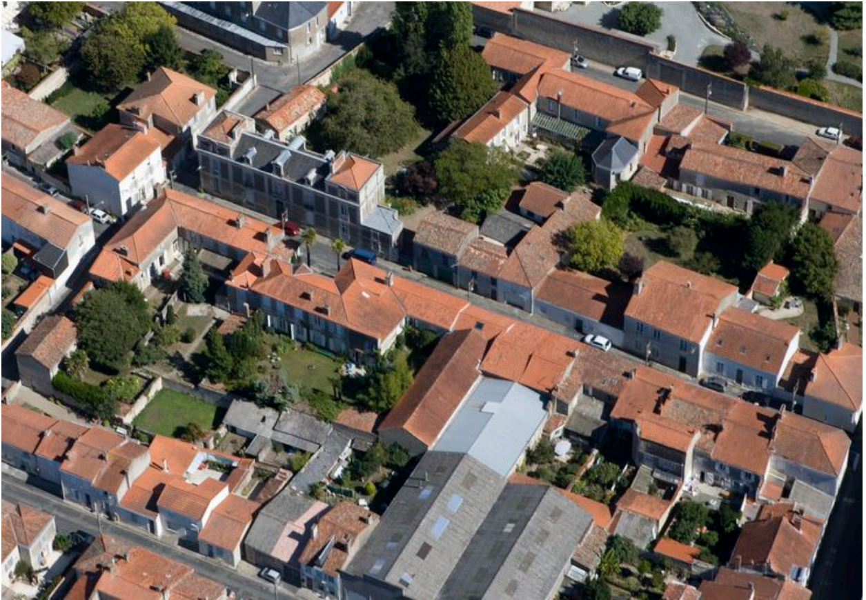
Vue aérienne prise de l'ouest, montrant l'hôtel (deuxième maison à l'angle supérieur gauche du grand îlot).