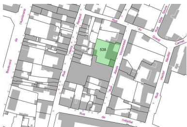
L'hôtel sur le plan cadastral actuel. IVR52_20118500924NUCA