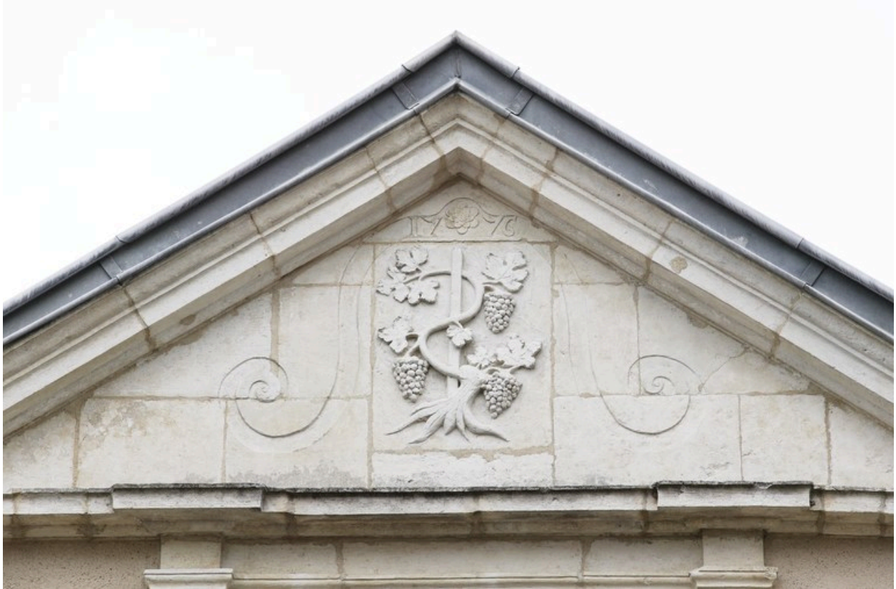
Fronton de la façade sur cour, portant la date 1776 et les armes des Guillebot (propriétaires de l'hôtel au cours de la 1ère moitié du XVIIIe), sculptées en 1992.