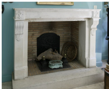
Cheminée de la 2e moitié du XIXe siècle, dans la pièce la plus au sud sur jardin. Elle est identique à celle du petit bâtiment à l'est de l'entrée, au collège Richelieu. IVR52_20078500405NUCA