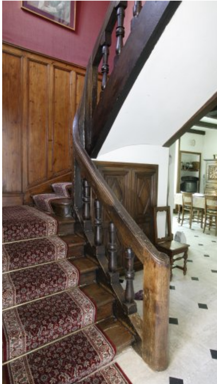
Vue de l'escalier en bois.