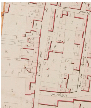
L'hôtel en 1816 : détail de la section M du plan cadastral (parcelles 246-247).