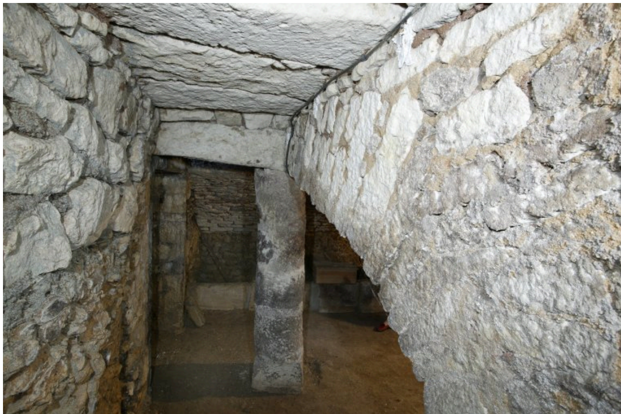
Vue de l'accès au sous-sol.