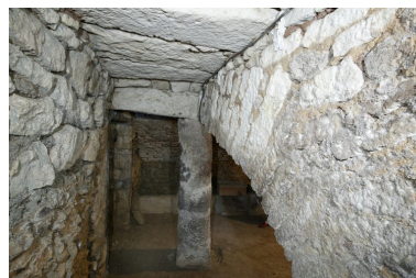
Vue de l'accès au sous-sol. IVR52_20078500407NUCA