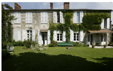
Façade sur jardin. IVR52_20078500400NUCA