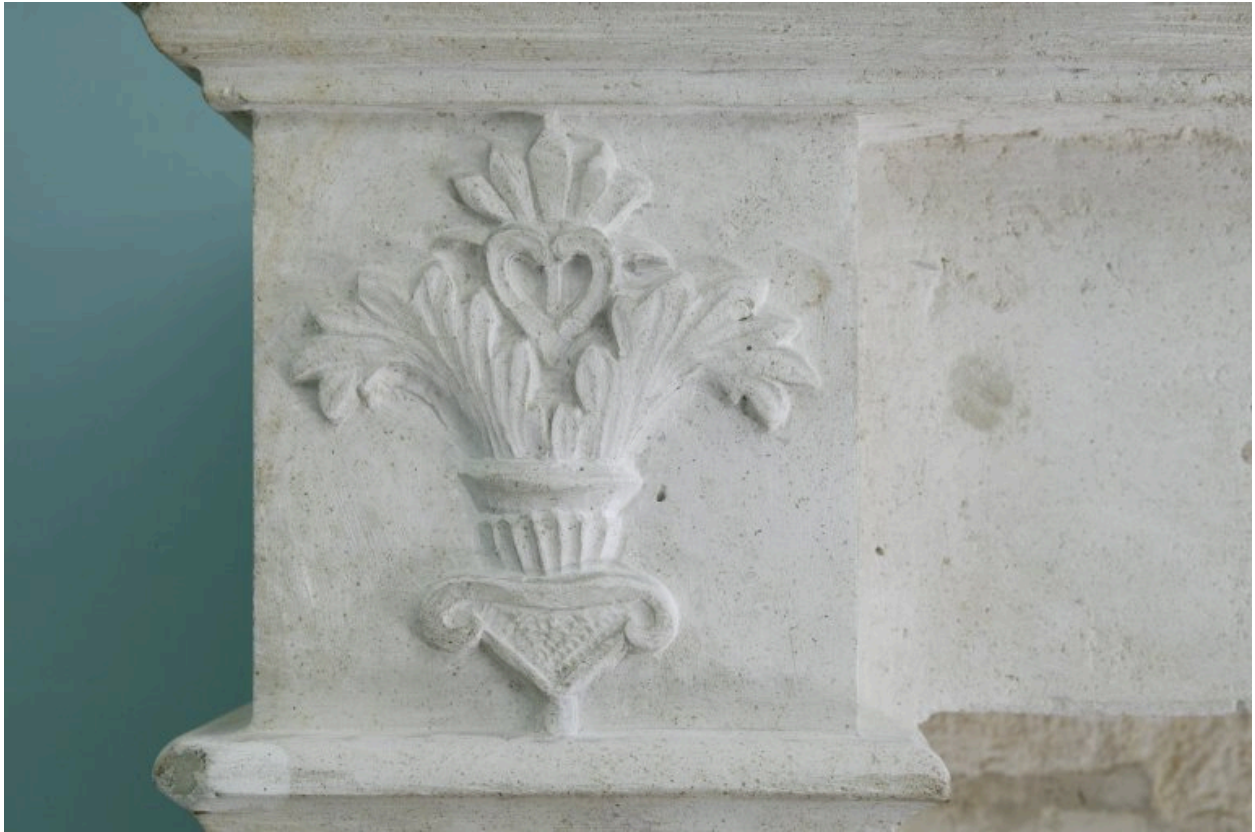
Détail de l'un des piédroits de la cheminée de la fig. précédente.