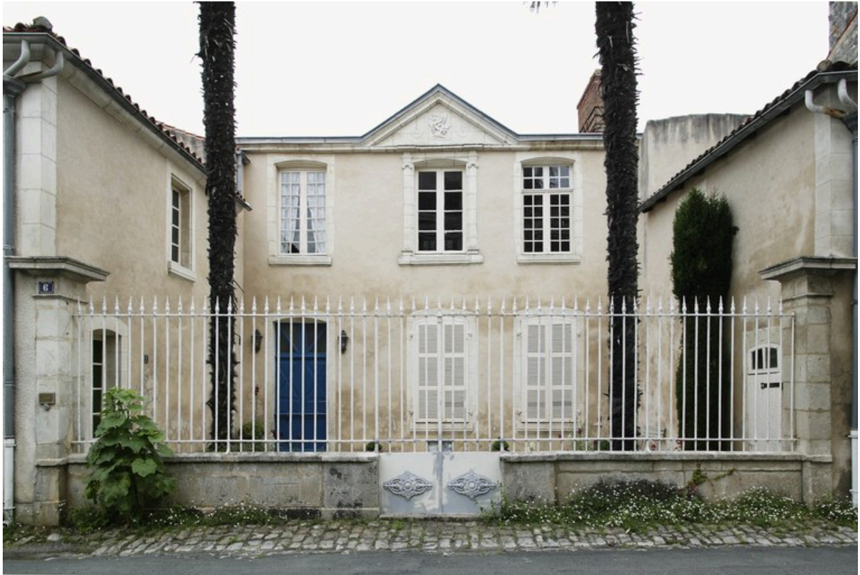
Façade donnant sur la cour antérieure, rue Alexis-Vinçonneau.