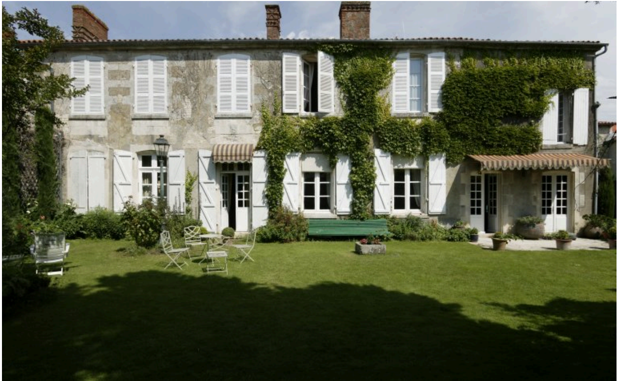
Façade sur jardin.