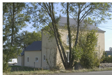
Vue depuis de sud-ouest.