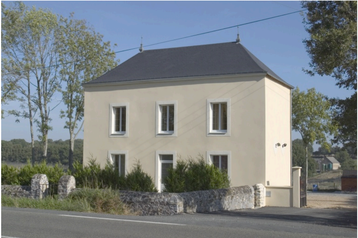
Vue depuis le sud.