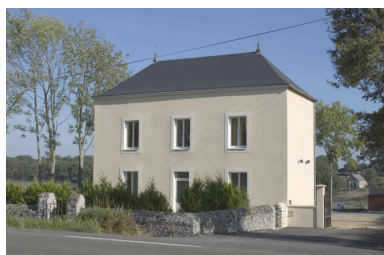
Vue depuis le sud. IVR52_20045302535NUCA