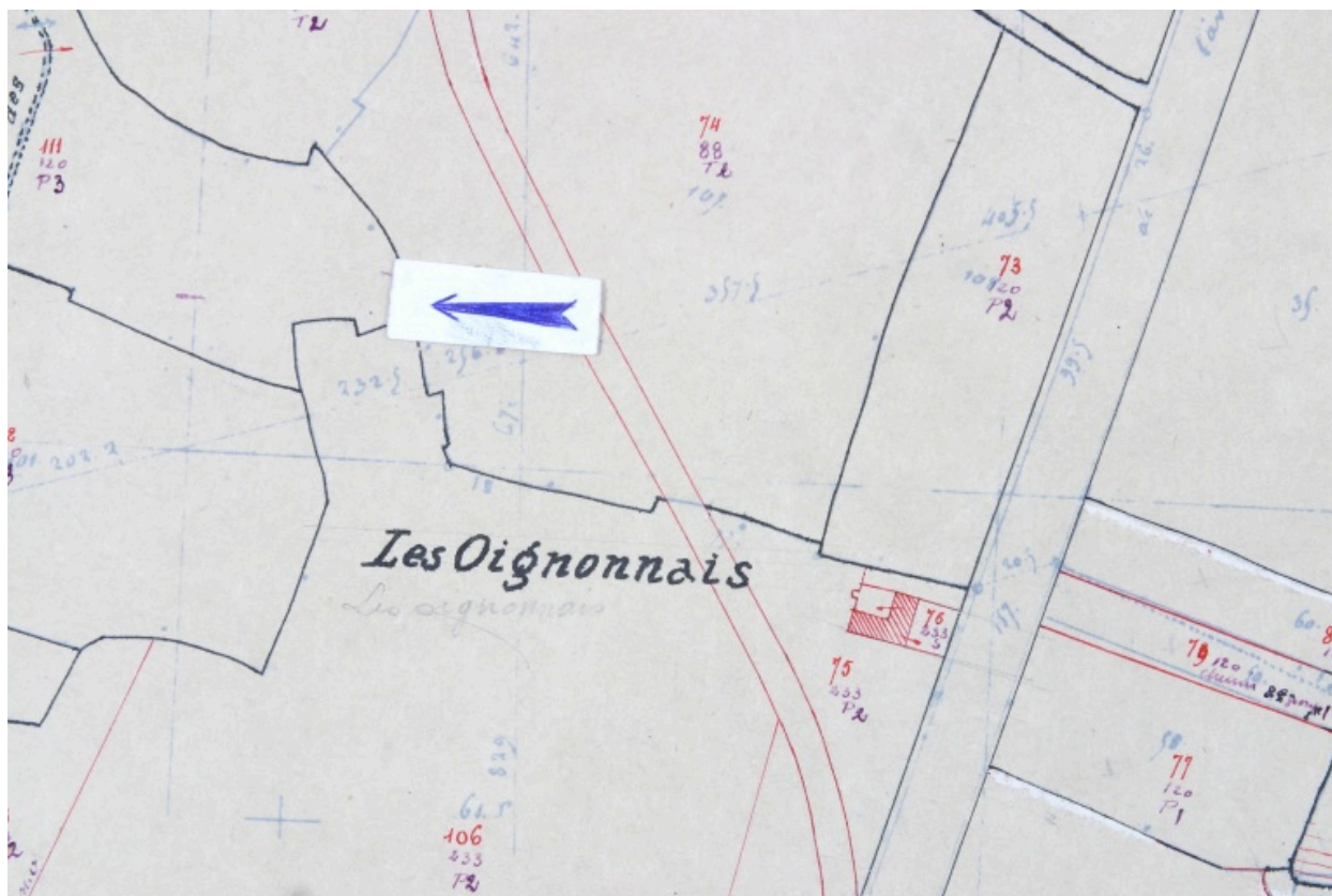
Extrait du plan cadastral de 1936, section K1.