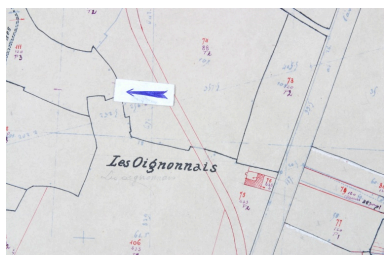
Extrait du plan cadastral de 1936, section K1.