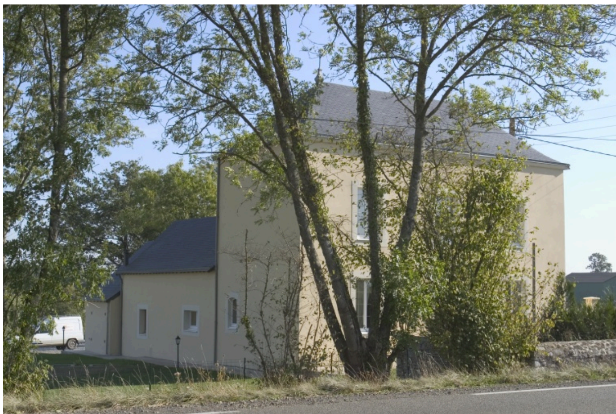
Vue depuis de sud-ouest.