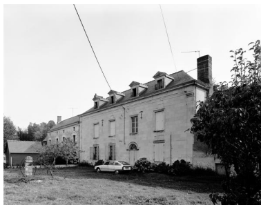
Façade antérieure. IVR52_19854901625V