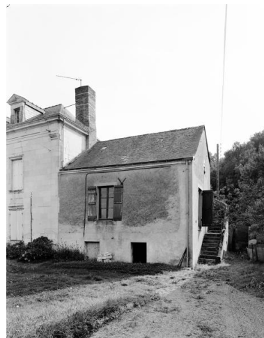
Façade antérieure du bâtiment accolé au logement principal.