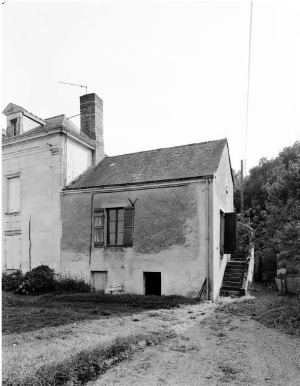
Façade antérieure du bâtiment accolé au logement principal.