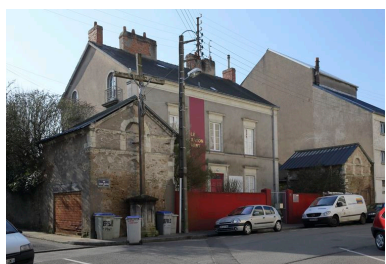
Presbytère. IVR52_20134401261NUCA