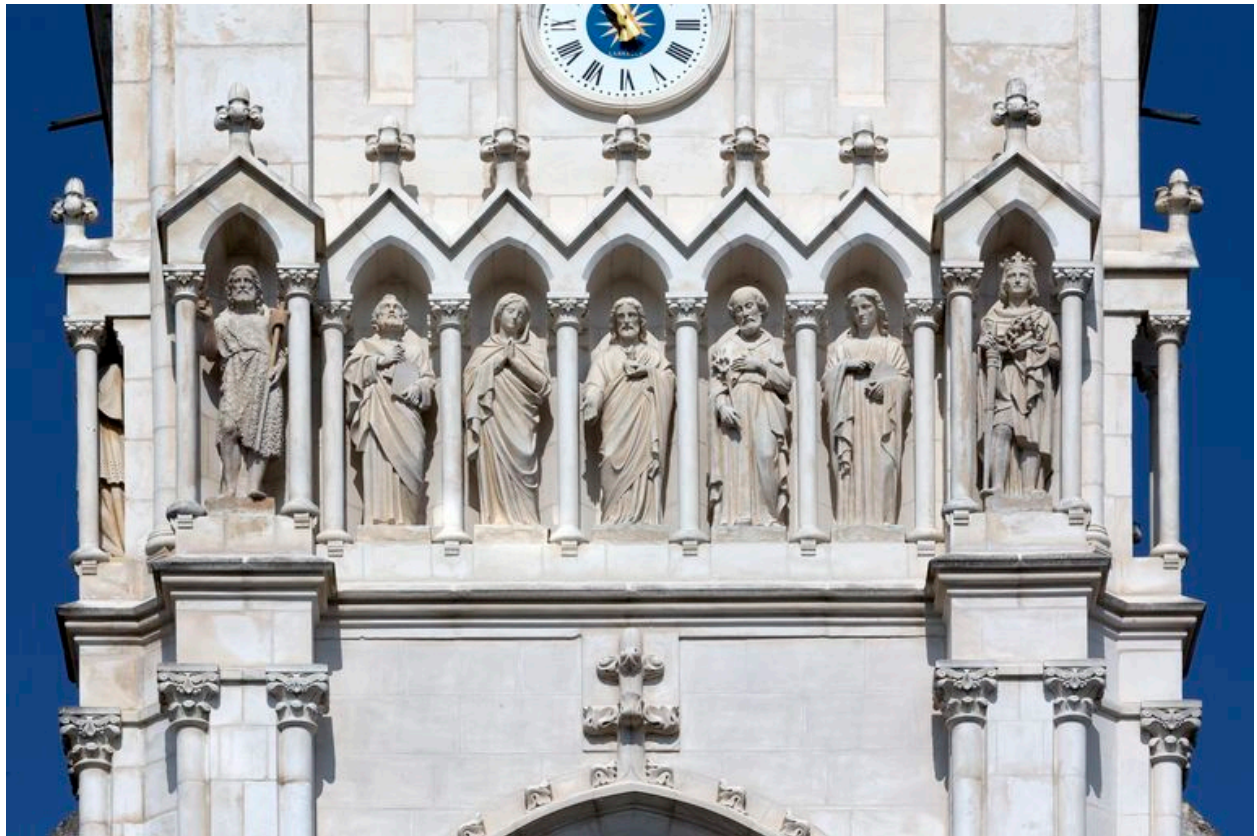
Sculptures au dessus du tympan.