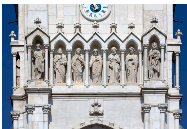
Sculptures au dessus du tympan.