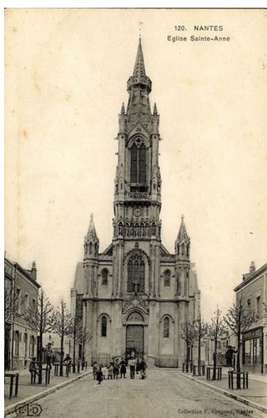
Eglise Sainte-Anne, début du 20e siècle.

IVR52_20134400852NUCA