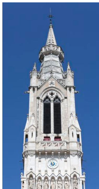
Clocher.