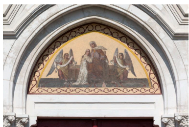
Tympan.