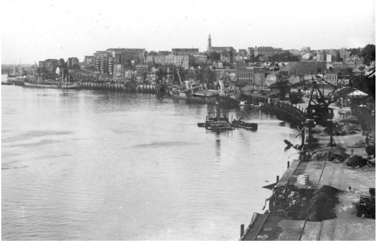
Eglise Sainte-Anne dominant la butte Sainte-Anne, début du XXe siècle.