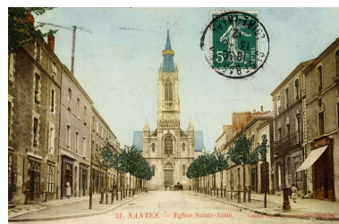
Eglise et avenue Sainte-Anne, début du 20e siècle.

IVR52_20134400856NUCA