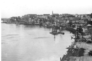
Eglise Sainte-Anne dominant la butte Sainte-Anne, début du XXe siècle.

IVR52_20134400825NUCA