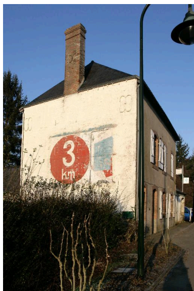
Vue de trois quarts de la maison avec la peinture publicitaire.