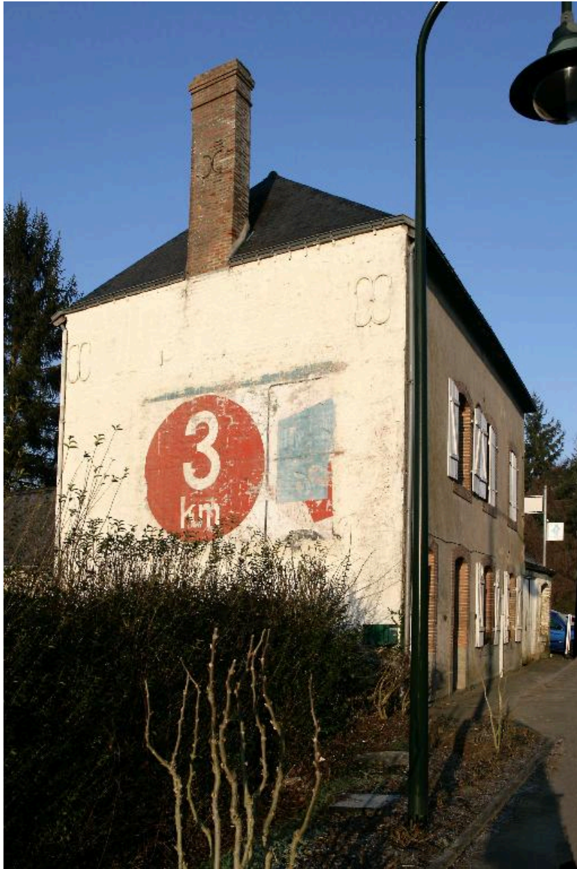
Vue de trois quarts de la maison avec la peinture publicitaire.