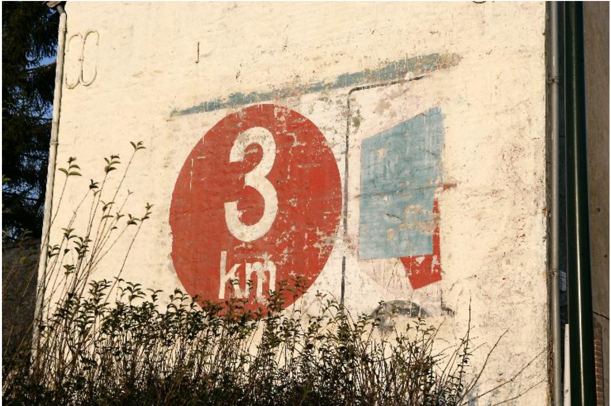
Façade sud-est : peinture publicitaire pour une station de carburant de la marque Elf.