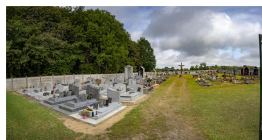
Intérieur du cimetière.

Plan du nouveau cimetière, 1899.