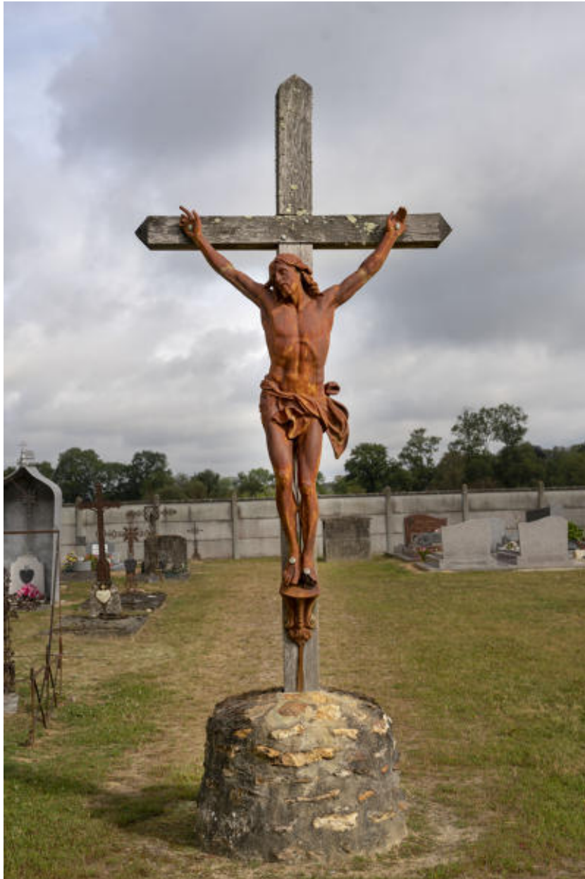
Croix du cimetière.