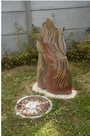
Flamme d'incinération.