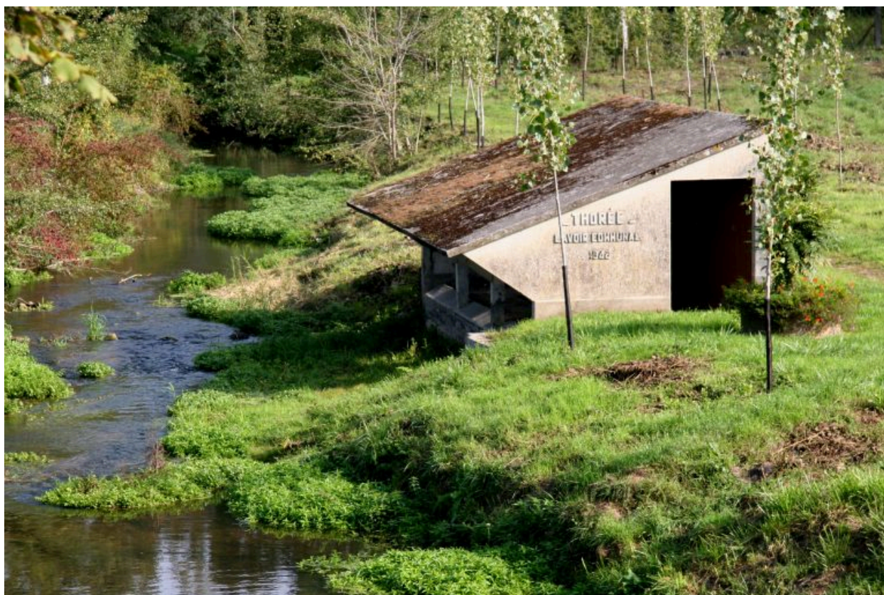
Vue d'ensemble prise du pont.