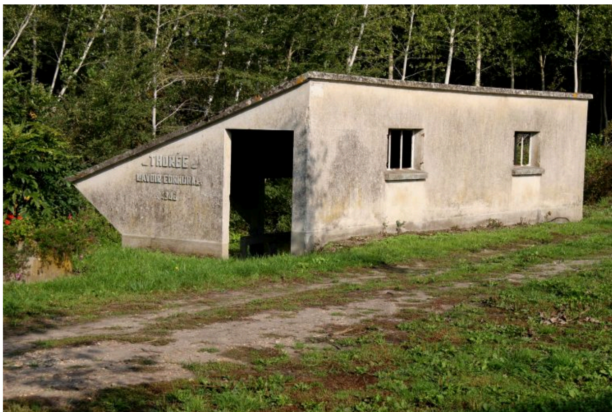
Façade antérieure : lavoir communal, 1942.