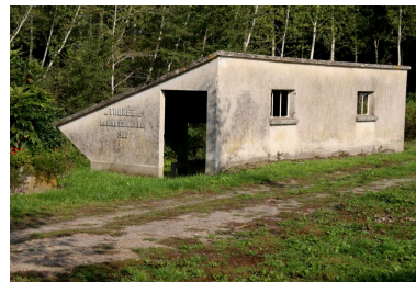
Façade antérieure : lavoir communal, 1942. IVR52_20067207514NUCA