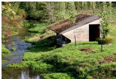
Vue d'ensemble prise du pont. IVR52_20067207512NUCA