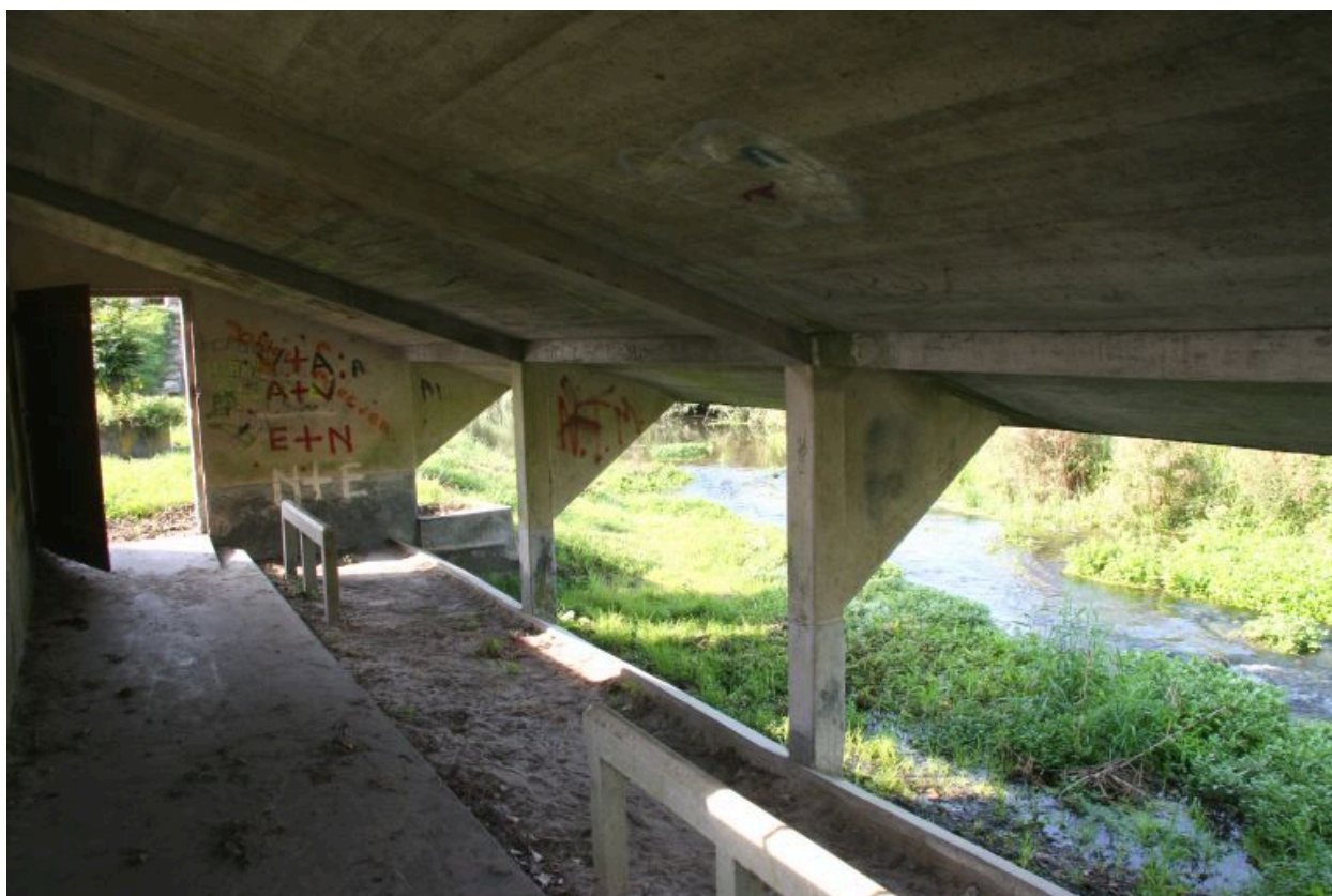
Intérieur en béton décoffré.