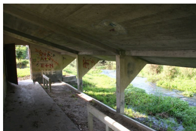
Intérieur en béton décoffré. IVR52_20067207515NUCA