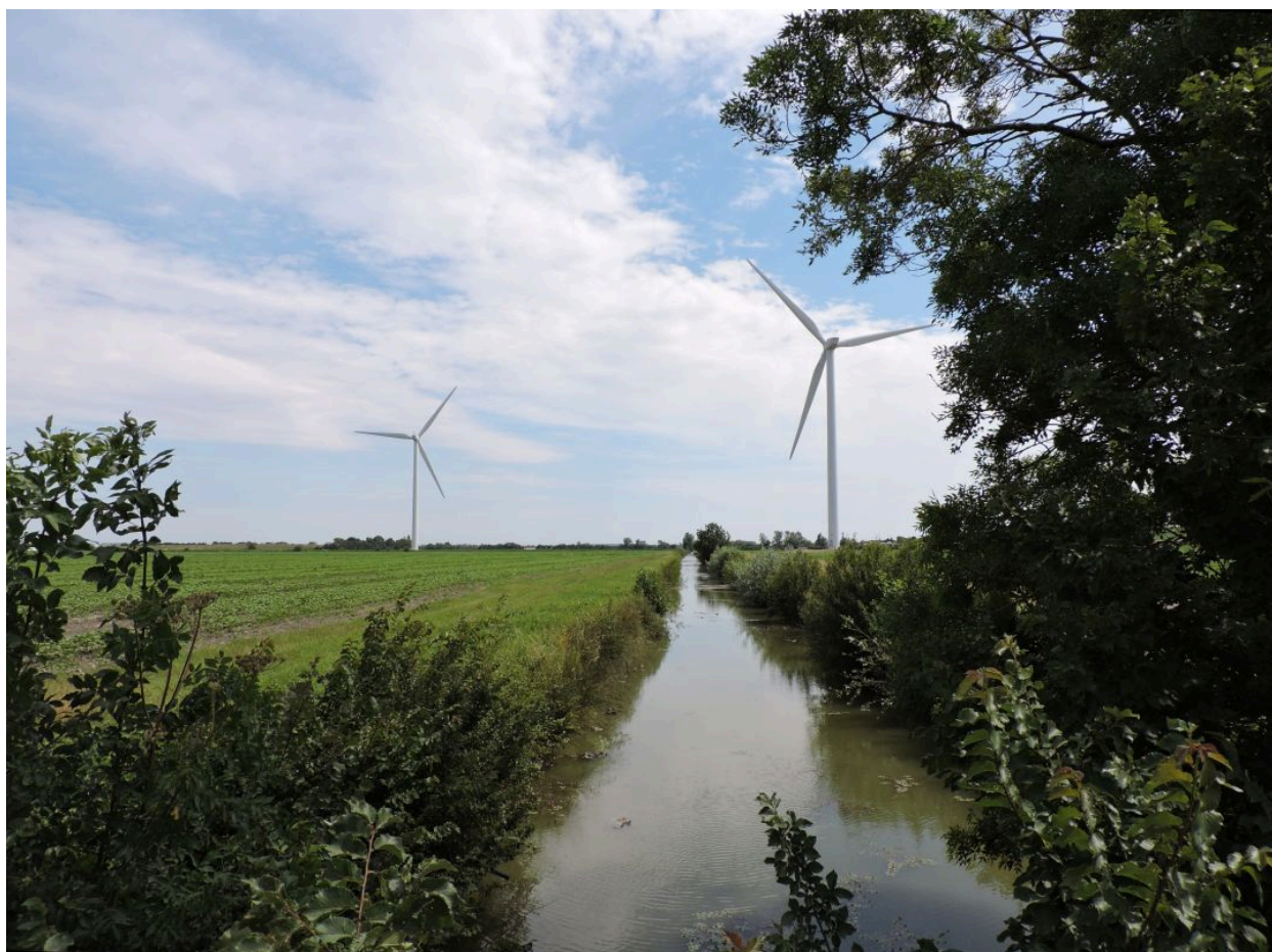
Le canal de Gargouilleau à l'ouest de la Chaume, vu en direction du sud.