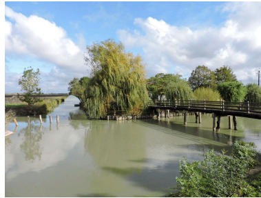
Le canal de la Grange, à gauche, se jettant dans le canal de Vix, vu depuis le sud.

IVR52_20198503452NUCA