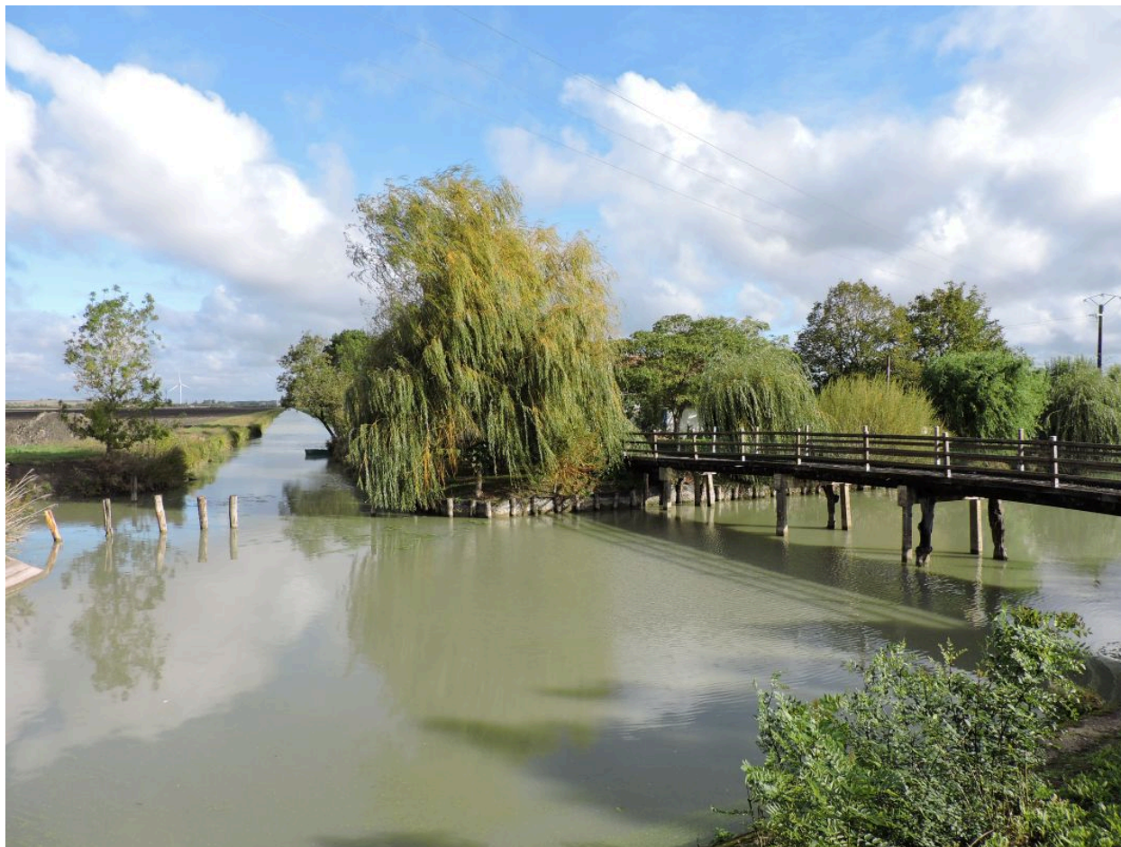
Le canal de la Grange, à gauche, se jettant dans le canal de Vix, vu depuis le sud.