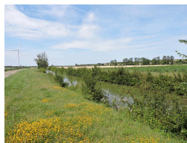
Le canal de Gargouilleau à l'ouest de la Chaume, vu en direction du nord.