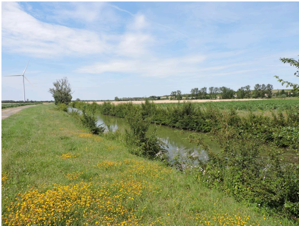
Le canal de Gargouilleau à l'ouest de la Chaume, vu en direction du nord.