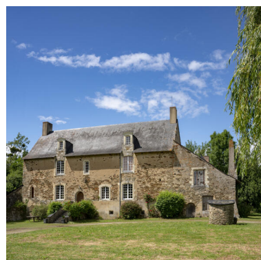
La façade antérieure du logis.