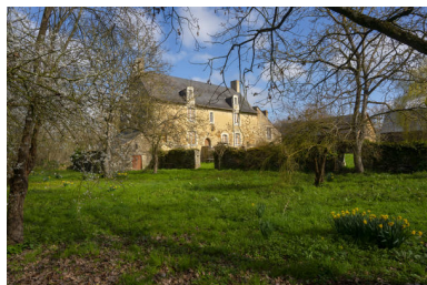
L'enclos de l'ancien potager. IVR52_20225300300NUCA