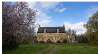
Une vue générale. IVR52_20225300330NUCA