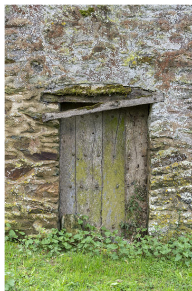
Une porte d'une grange-étable. IVR52_20225300310NUCA