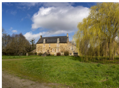
Le logis. IVR52_20225300301NUCA