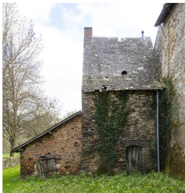
Le bâtiment abritant le four.