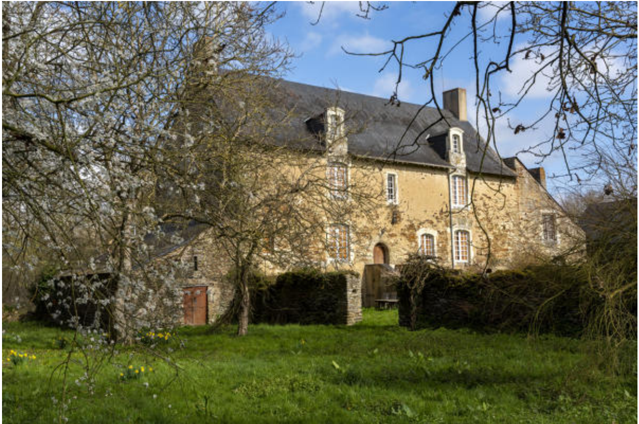
La façade antérieure du logis.