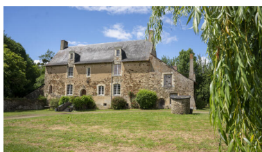
La façade antérieure du logis.