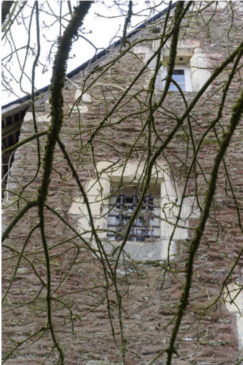
La tour d'escalier, détail des ouvertures.