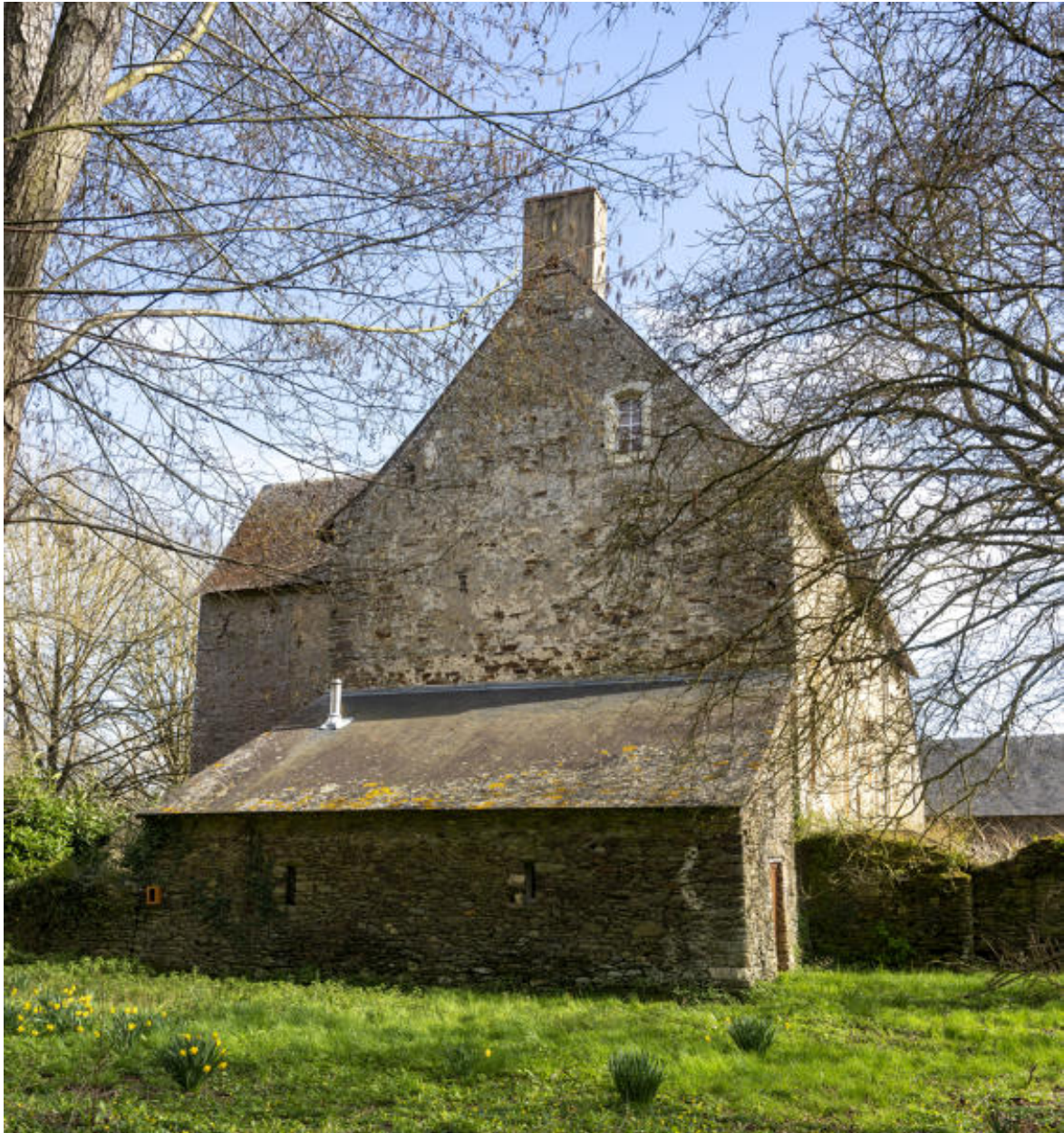
Le mur-pignon du logis.