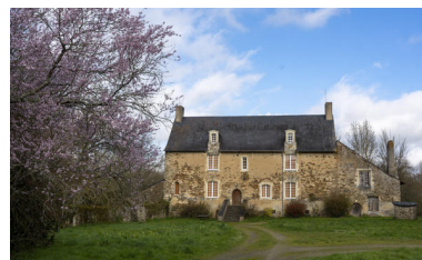
Le logis.