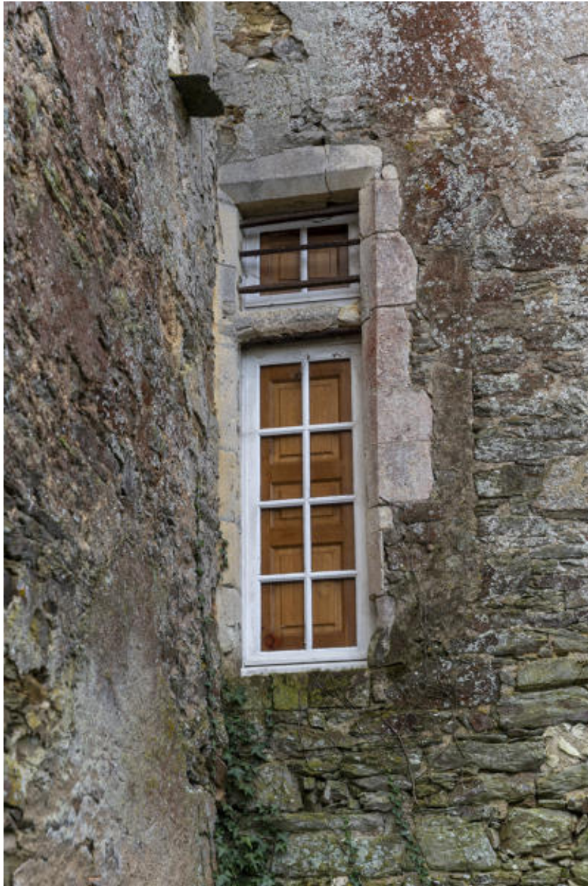
Une demi-croisée de la façade postérieure.