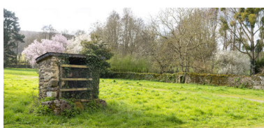
Le puits. IVR52_20225300307NUCA