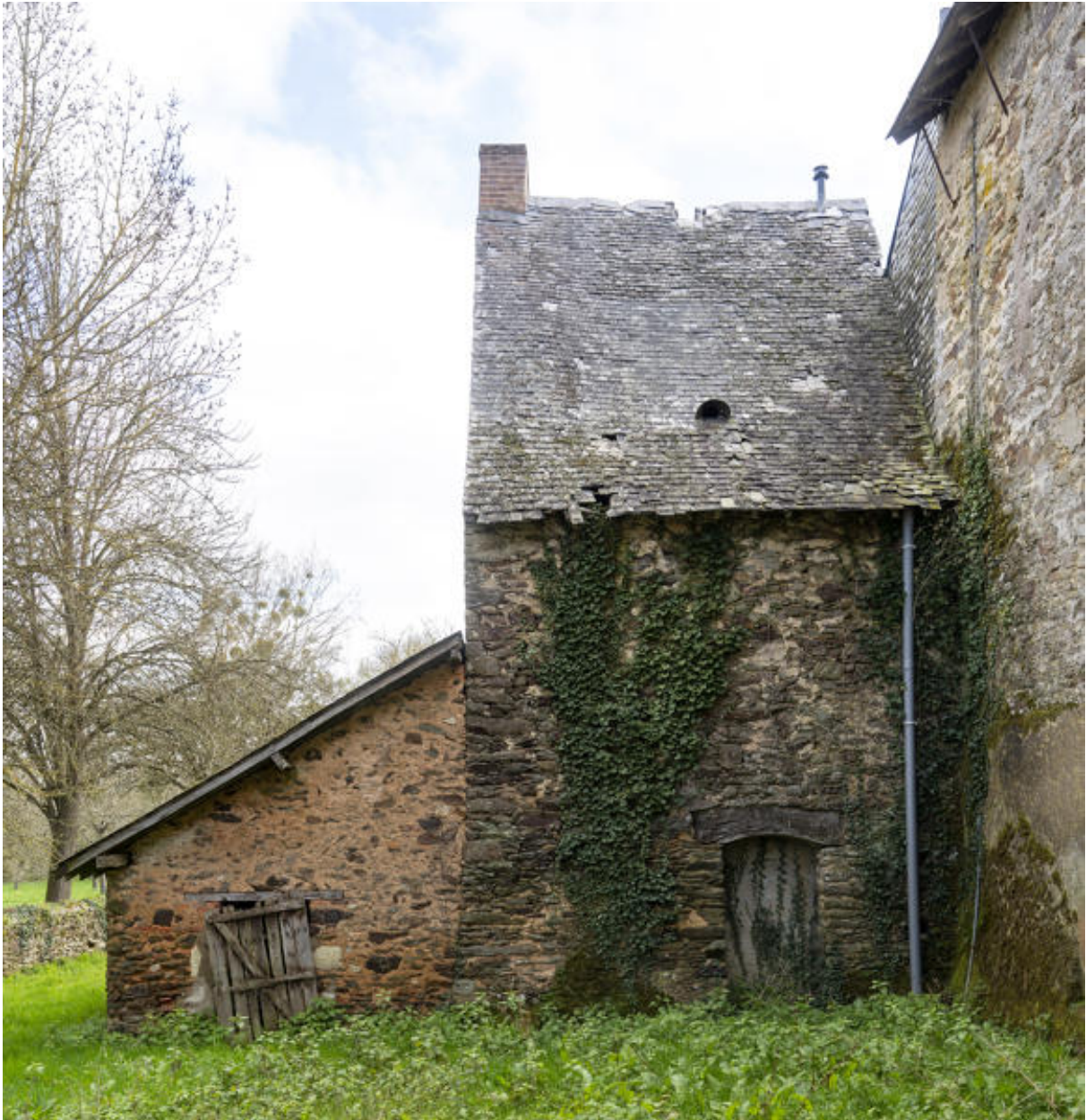
Le bâtiment abritant le four.