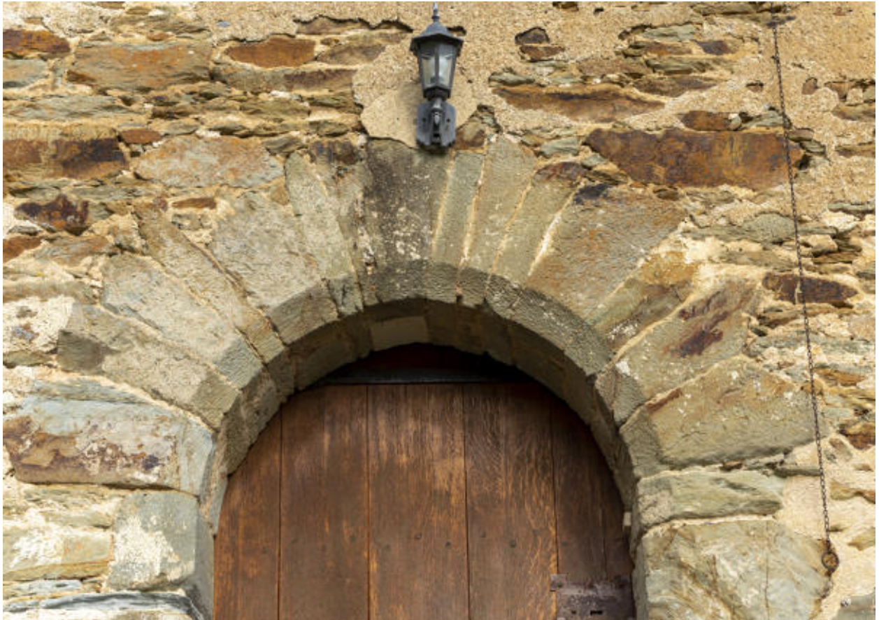
Un détail de l'arc de la porte principale.