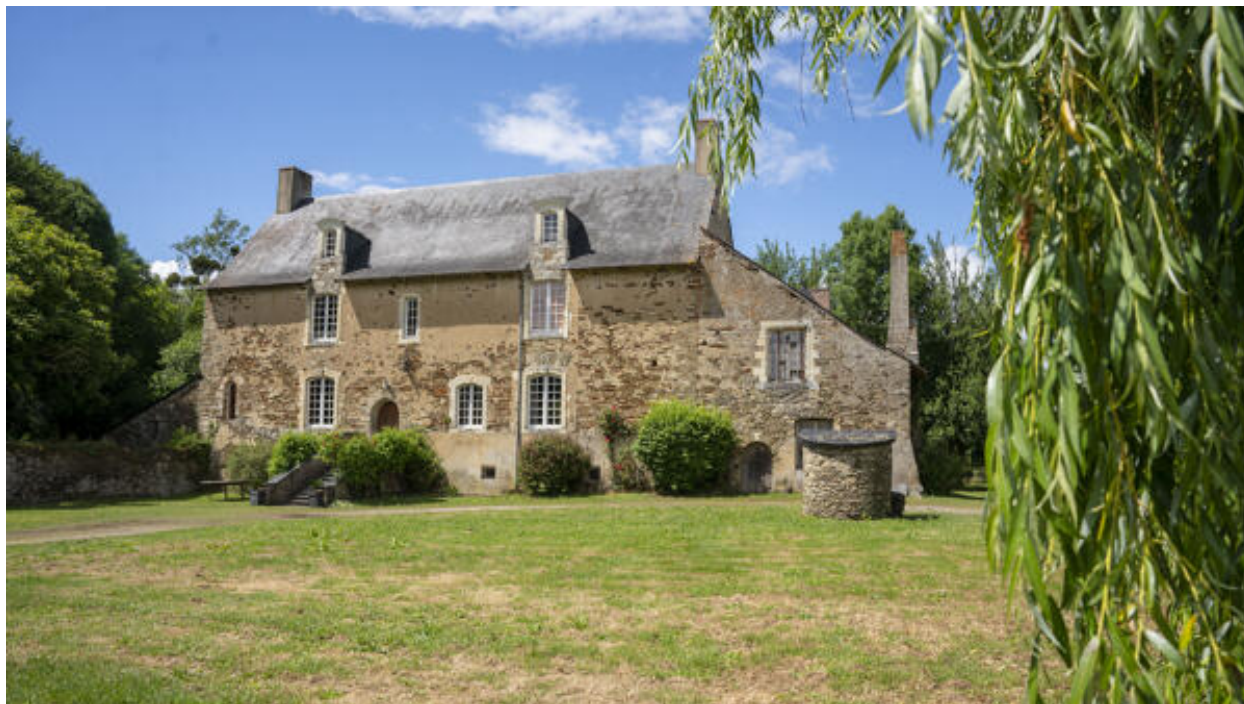
La façade antérieure du logis.