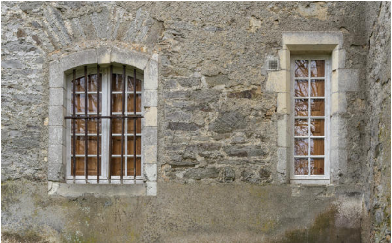
Des fenêtres de la façade postérieure.