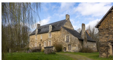
La façade antérieure et l'appentis. IVR52_20225300319NUCA