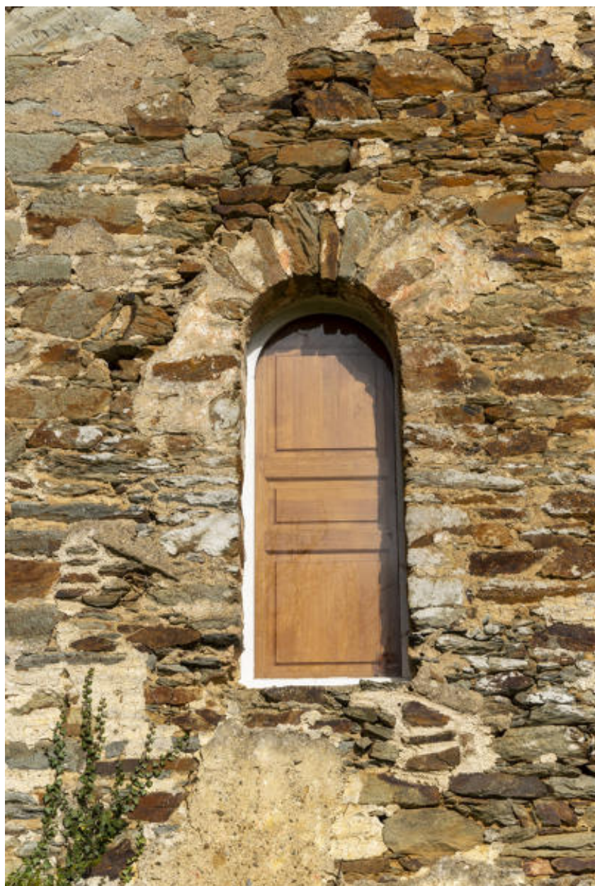
L'accès à l'ancienne chapelle.