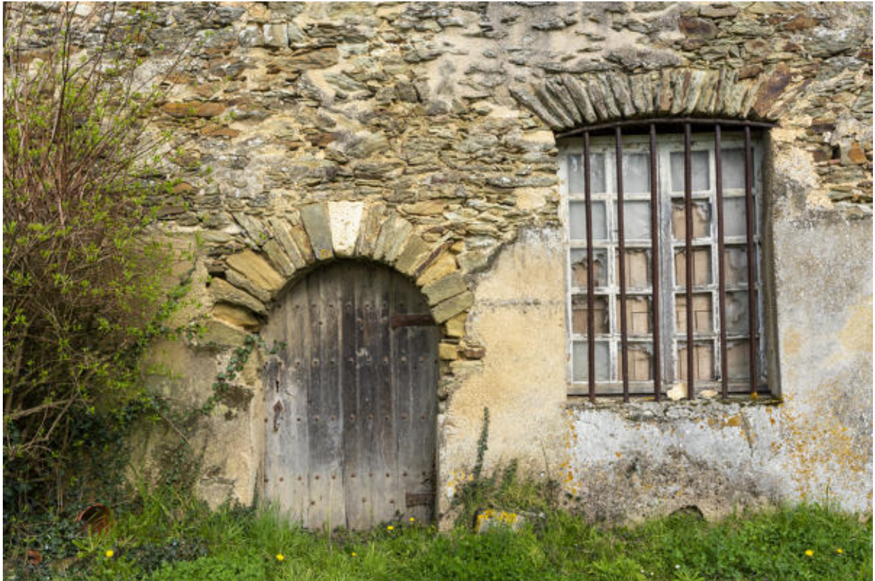
Les ouvertures du rez-de-chaussée de l'appentis.