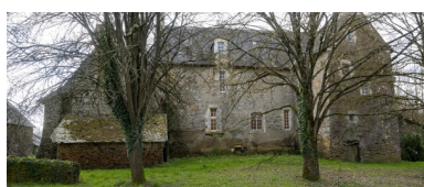
L'élévation postérieure. IVR52_20225300316NUCA