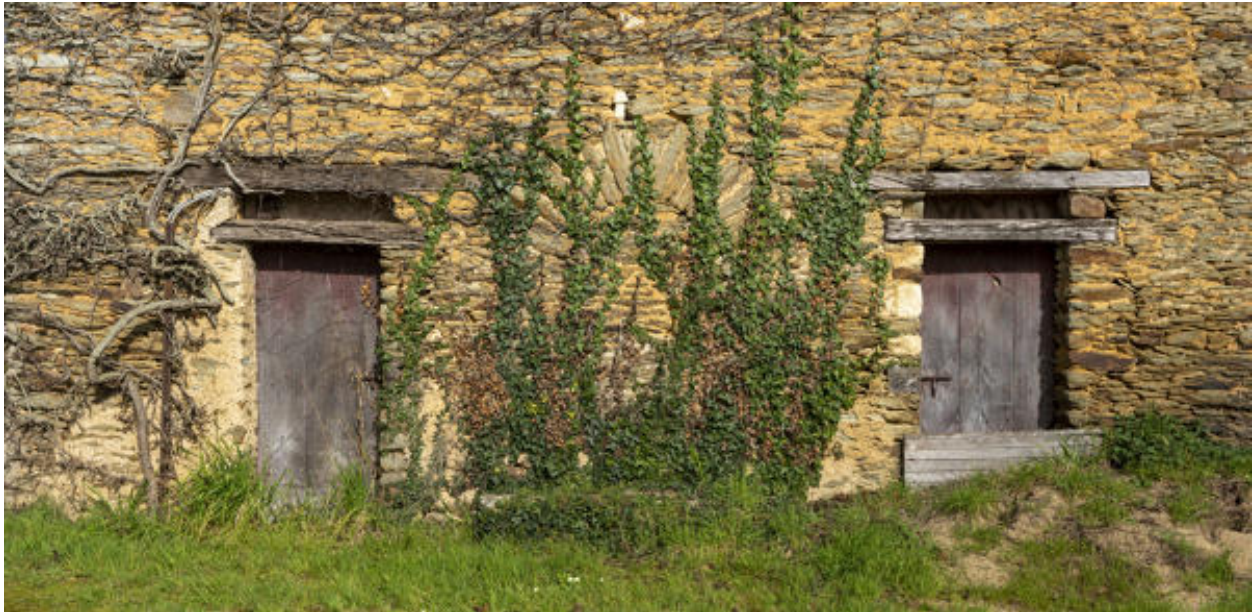
Un détail des portes d'une grange-étable.