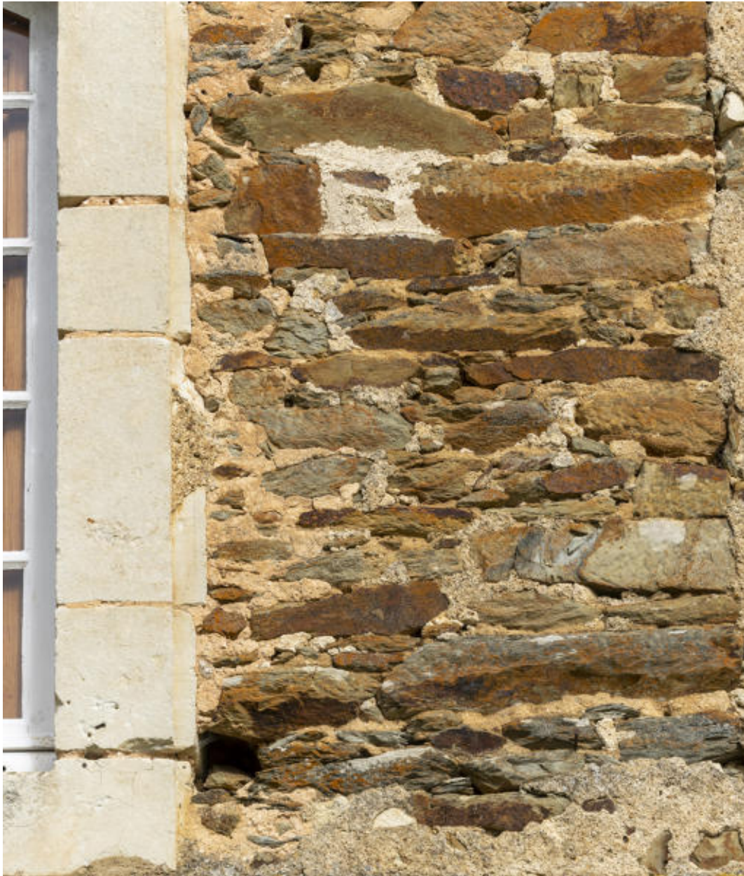
Un détail de la maçonnerie.