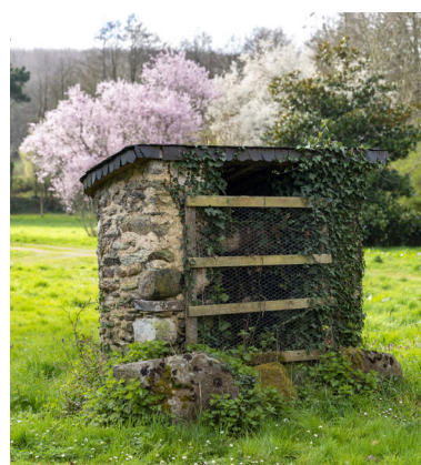
Le puits. IVR52_20225300308NUCA