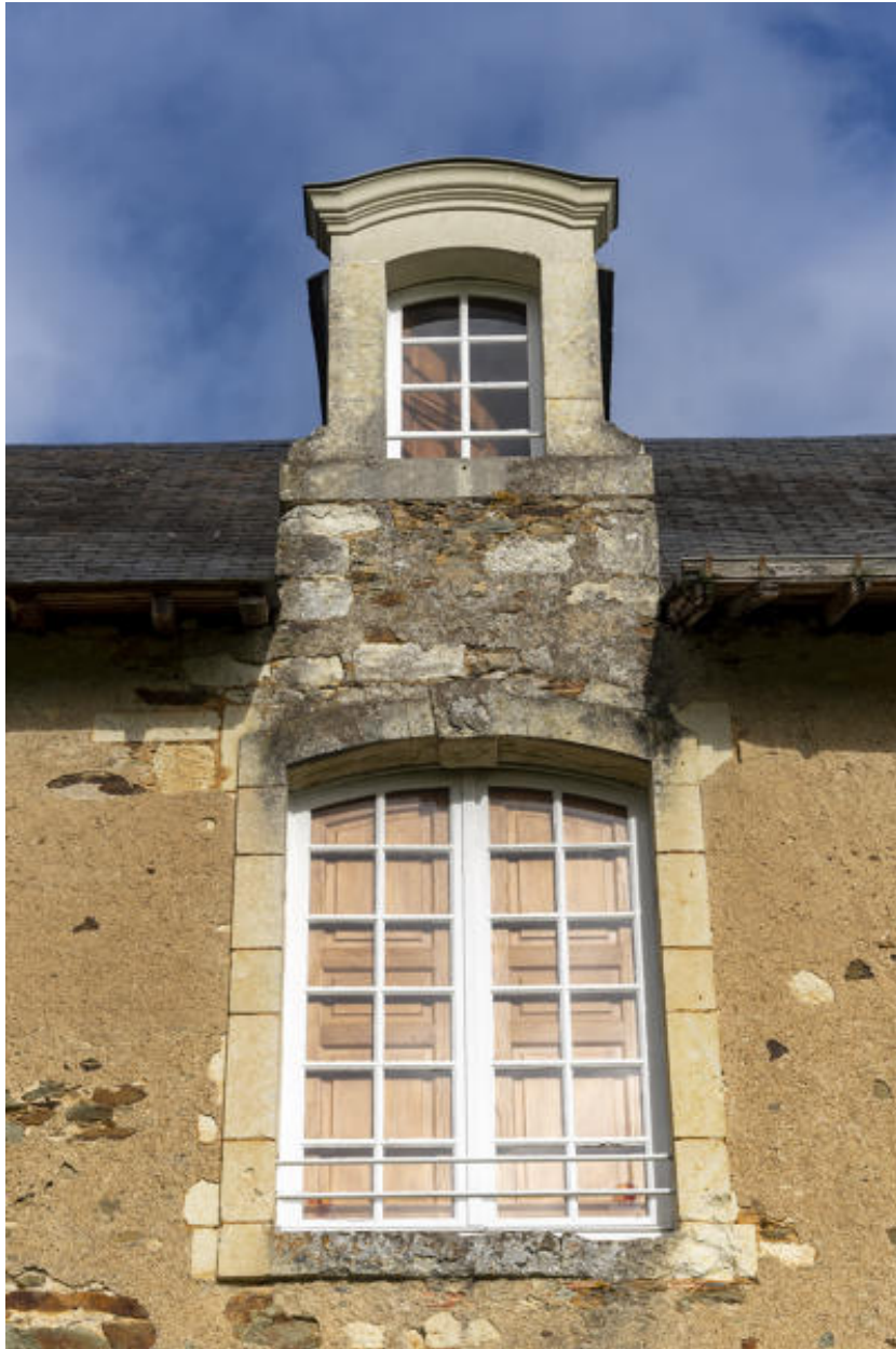
Une fenêtre et une lucarne de la façade antérieure.