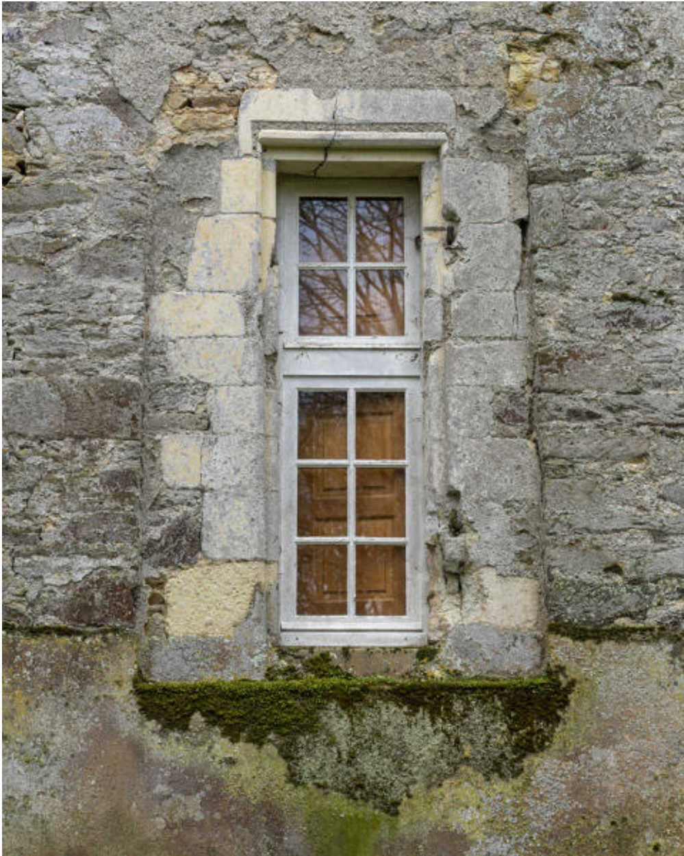
Une fenêtre de la façade postérieure.