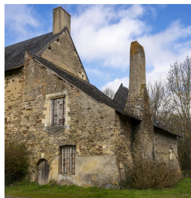
L'appentis. IVR52_20225300320NUCA