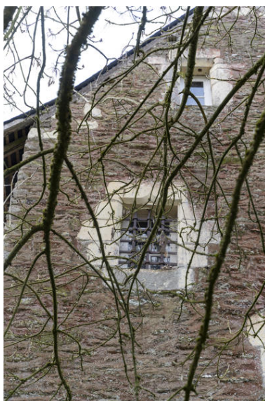
La tour d'escalier, détail des ouvertures.