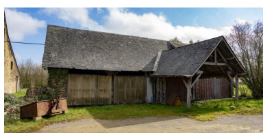
Le hangar. IVR52_20225300303NUCA