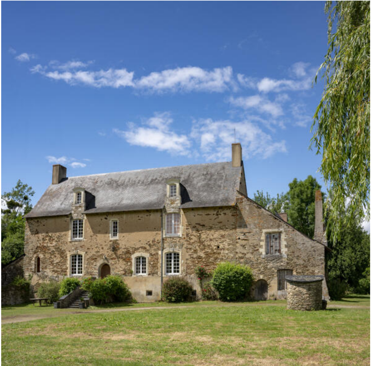
La façade antérieure du logis.