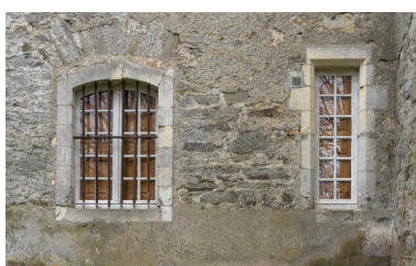
Des fenêtres de la façade postérieure.