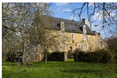
La façade antérieure du logis.