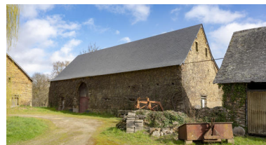
Une grange-étable. IVR52_20225300304NUCA