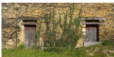
Un détail des portes d'une grange-étable.