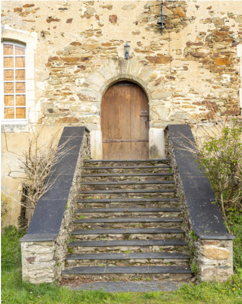
La porte principale et le perron.