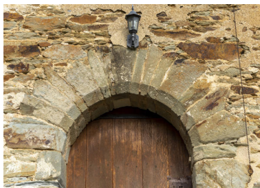
Un détail de l'arc de la porte principale.