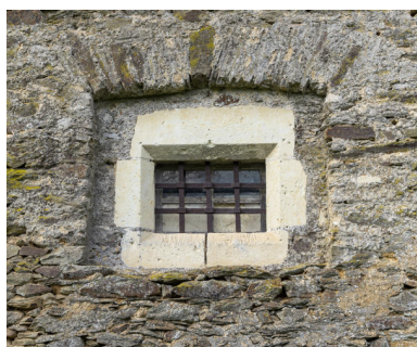
Une fenêtre de l'appentis. IVR52_20225300318NUCA