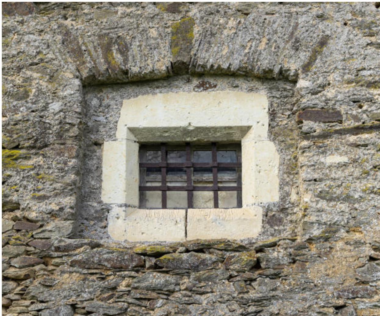
Une fenêtre de l'appentis.