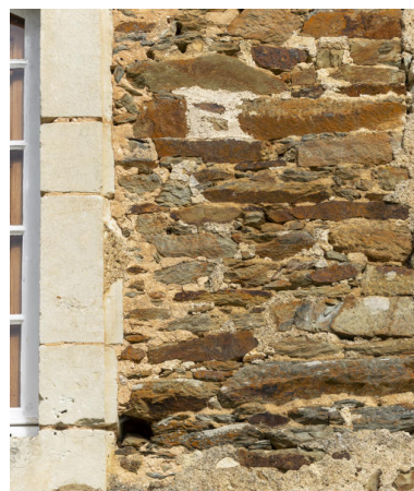
Un détail de la maçonnerie. IVR52_20225300323NUCA