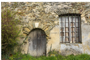
Les ouvertures du rez- de-chaussée de l'appentis.