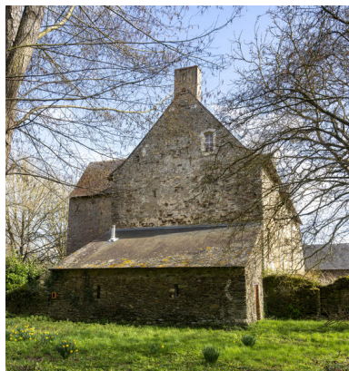
Le mur-pignon du logis.