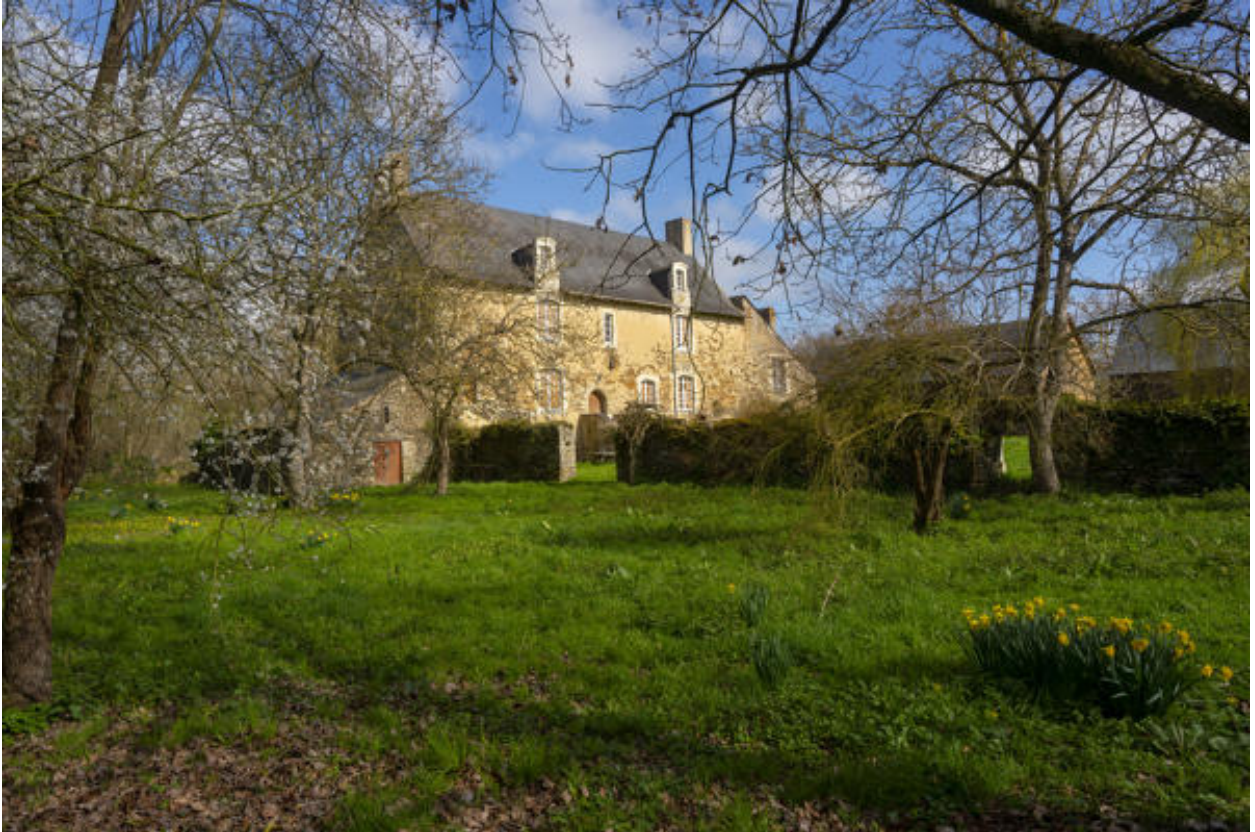
L'enclos de l'ancien potager.