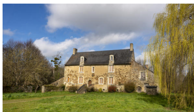
Le logis. IVR52_20225300302NUCA