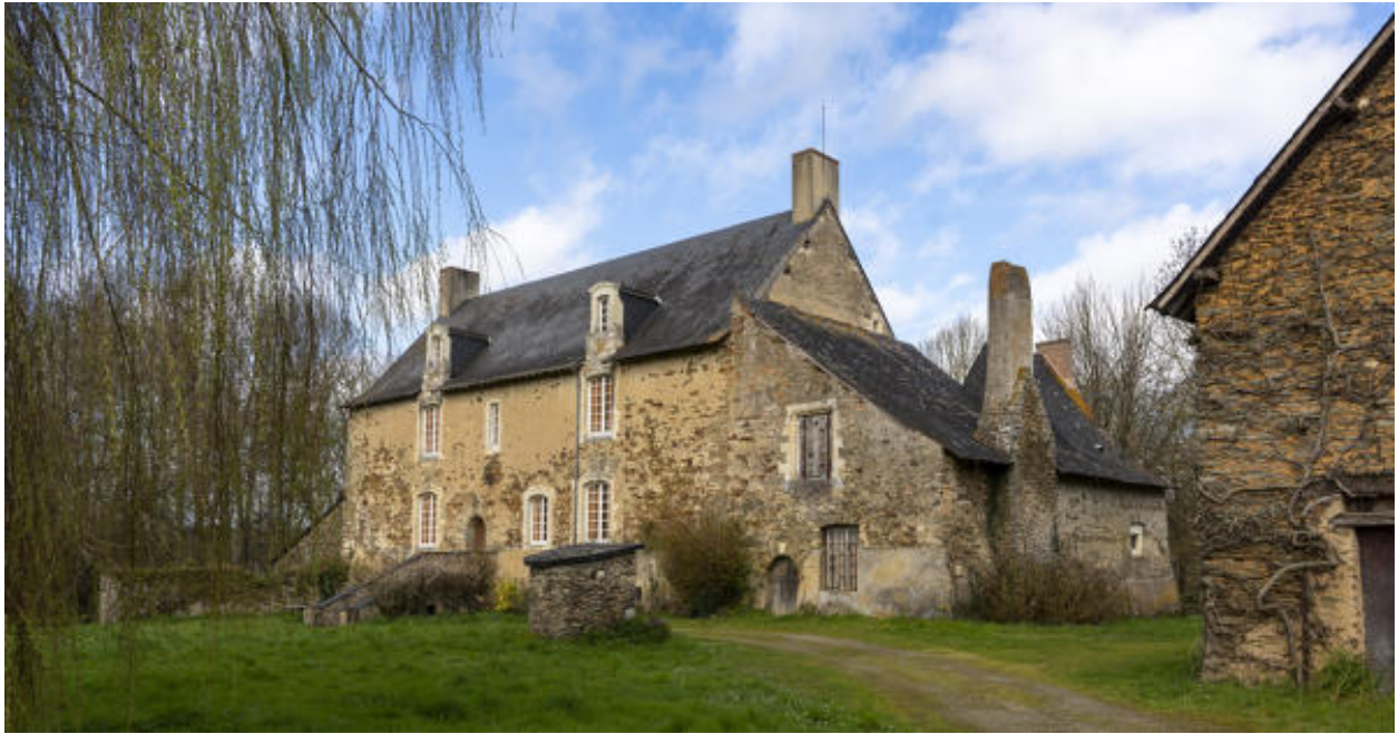
La façade antérieure et l'appentis.