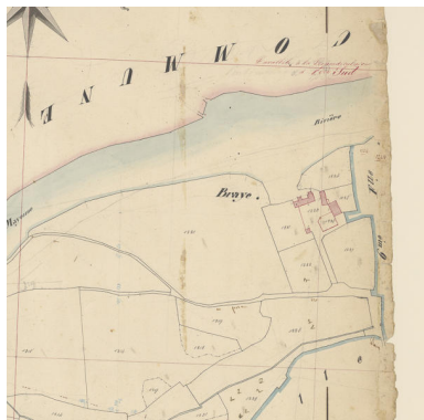
Braye sur le cadastre napoléonien de 1833. IVR52_20225300215NUCA