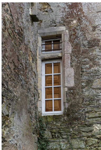
Une demi-croisée de la façade postérieure.