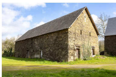
Une grange-étable. IVR52_20225300306NUCA