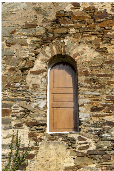
L'accès à l'ancienne chapelle. IVR52_20225300325NUCA