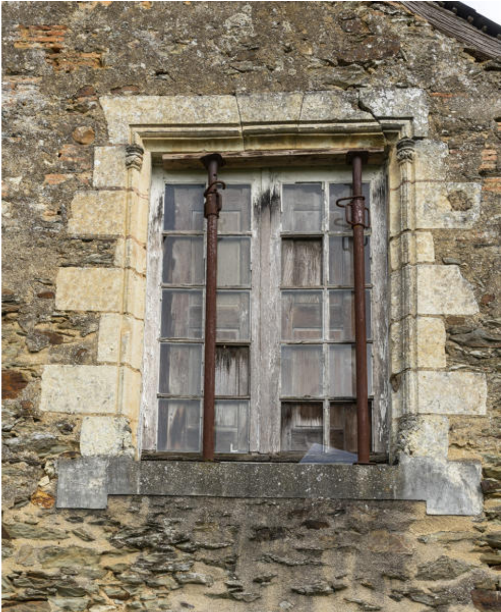
La fenêtre de l'étage de l'appentis.