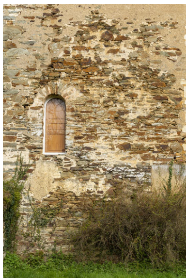
L'accès et l'empreinte de l'ancienne chapelle.