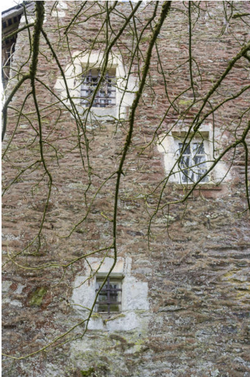
La tour d'escalier, détail des ouvertures.