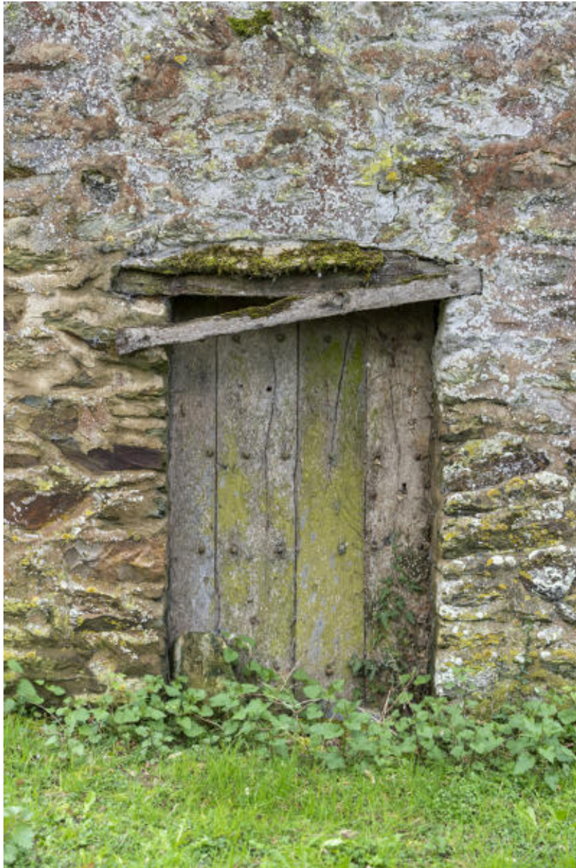
Une porte d'une grange-étable.