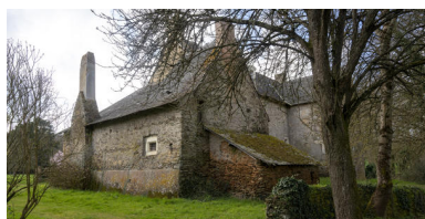
L'appentis. IVR52_20225300317NUCA