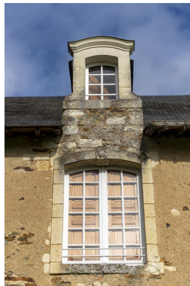
Une fenêtre et une lucarne de la façade antérieure. IVR52_20225300324NUCA