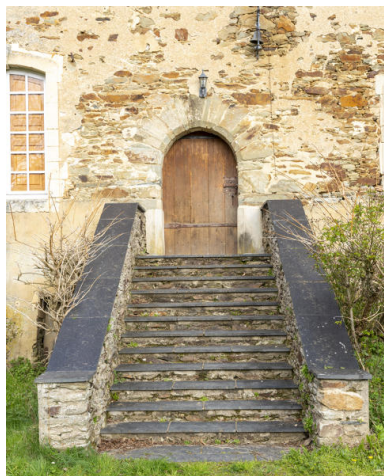
La porte principale et le perron.