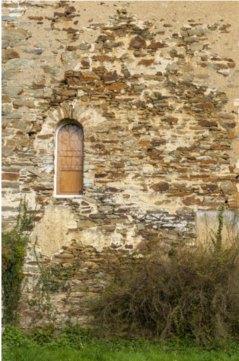
L'accès et l'empreinte de l'ancienne chapelle.