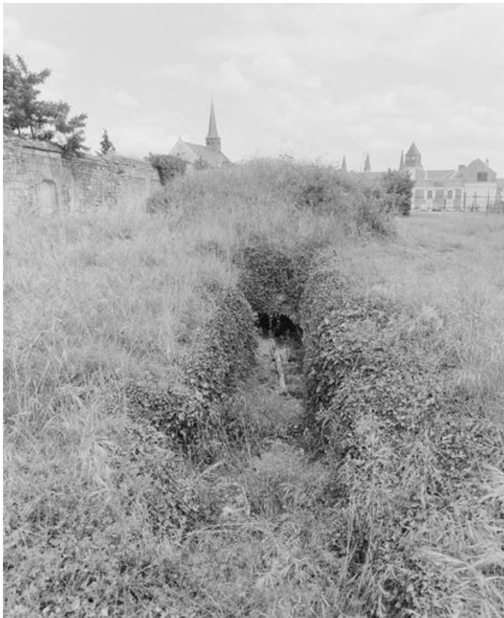
Vestiges de la chapelle Notre-Dame-de-Liesse : ruines de la chapelle, dans le Clos Bourbon, vue depuis l'ouest (vue prise en 1996).