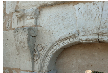
Détail du couvrement de la porte.