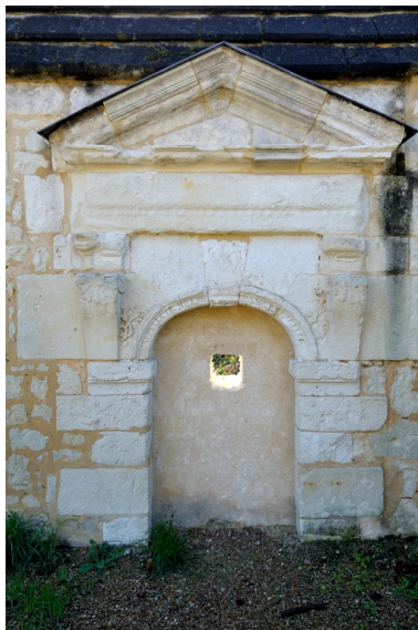
Vue générale. IVR52_20124901860NUCA