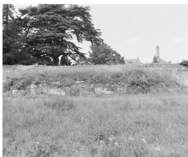
Vestiges de la chapelle Notre-Dame-de-Liesse : ruines de la chapelle, dans le Clos Bourbon, assises basses du mur sud (vue prise en 1996).