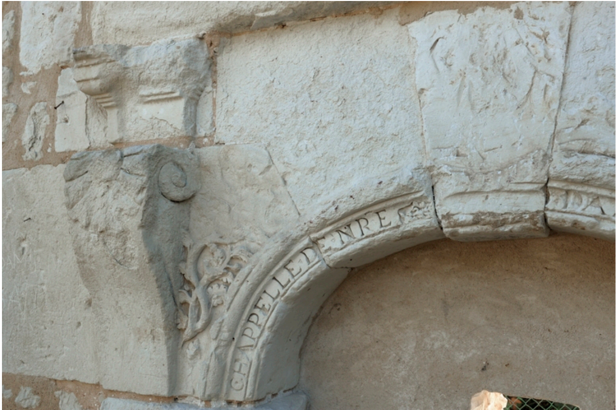
Détail du couvrement de la porte.