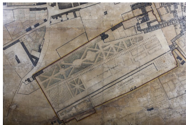
Plan dit de 1762 de l'abbaye de Fontevraud, détail : le Clos-Bourbon, avec au nord, au centre, la chapelle Notre-Dame-de-Liesse.