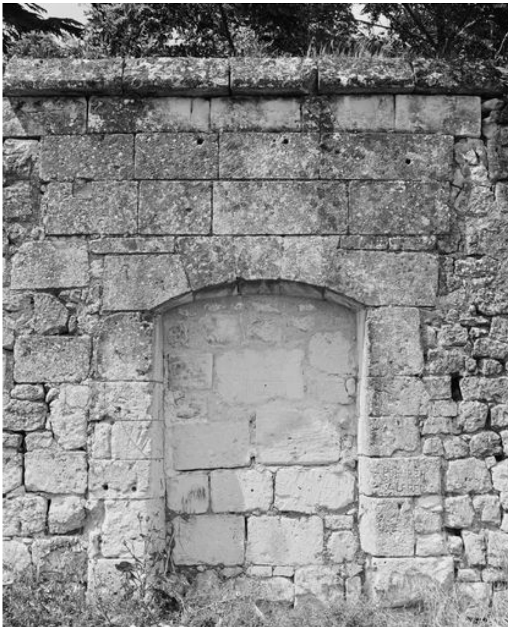
Vestiges de la chapelle Notre-Dame-de-Liesse : revers de la porte d'accès au choeur, côté Clos Bourbon (vue prise en 1996).