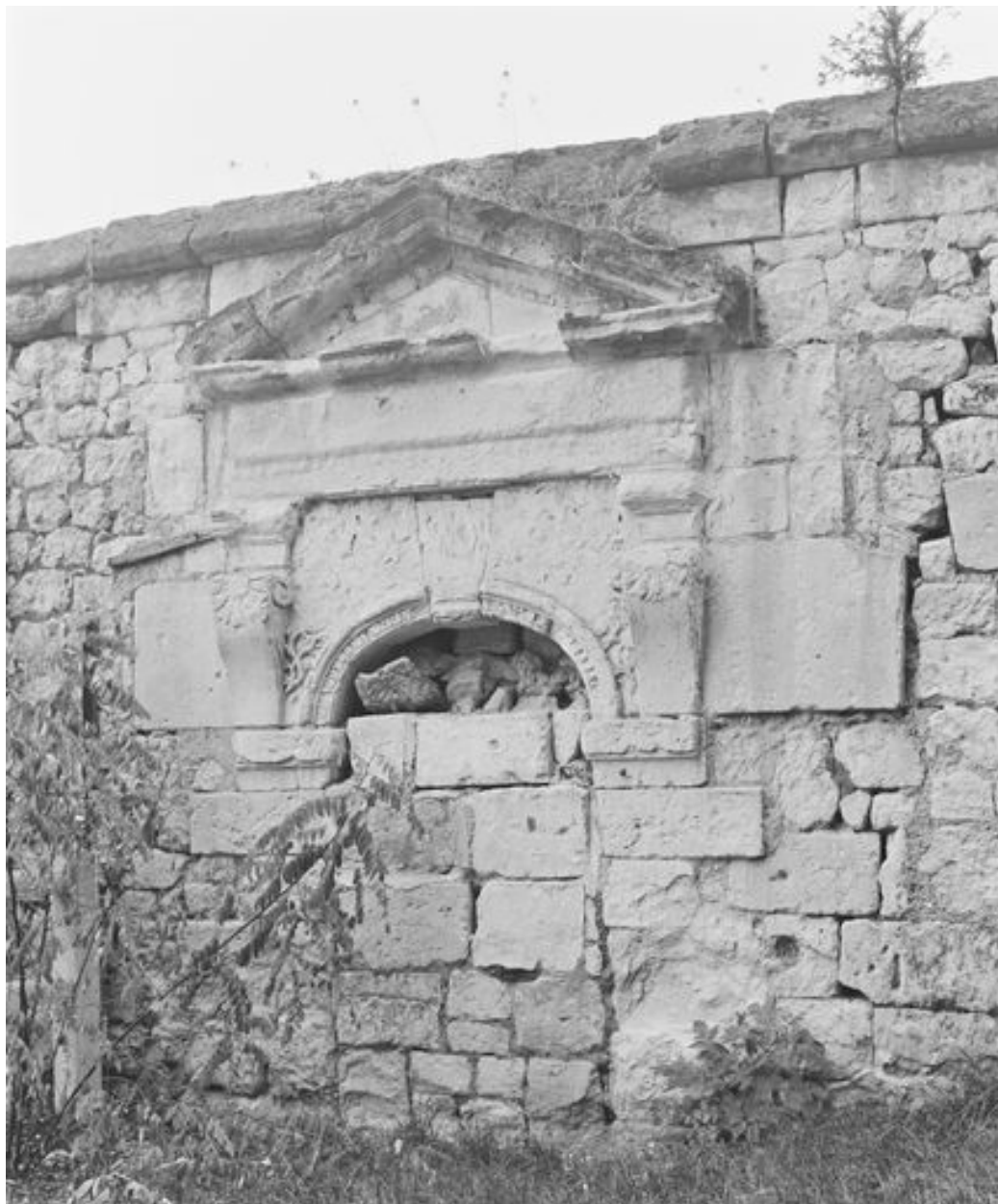
Vestiges de la chapelle Notre-Dame-de-Liesse : porte d'accès au choeur depuis l'ancien cimetière (vue prise en 1991).