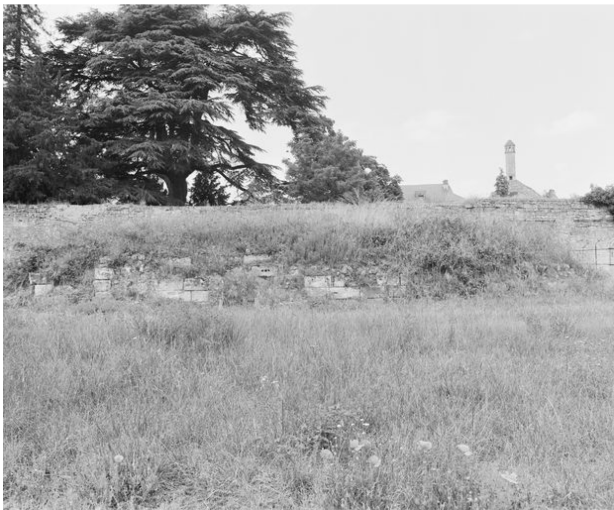
Vestiges de la chapelle Notre-Dame-de-Liesse : ruines de la chapelle, dans le Clos Bourbon, assises basses du mur sud (vue prise en 1996).