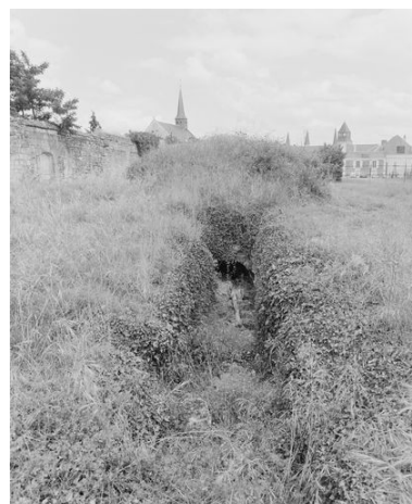
Vestiges de la chapelle Notre-Dame-de-Liesse : ruines de la chapelle, dans le Clos Bourbon, vue depuis l'ouest (vue prise en 1996). IVR52_19964900931X