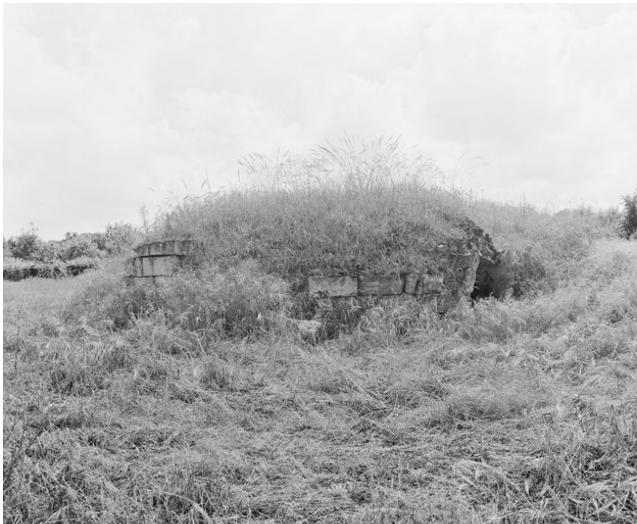
Vestiges de la chapelle Notre-Dame-de-Liesse : ruines de la chapelle, dans le Clos Bourbon, assises basses du chevet vues depuis l'est (vue prise en 1996).