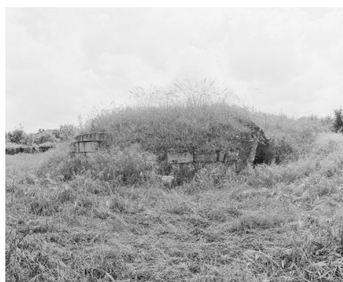
Vestiges de la chapelle Notre-Dame-de-Liesse : ruines de la chapelle, dans le Clos Bourbon, assises basses du chevet vues depuis l'est (vue prise en 1996).