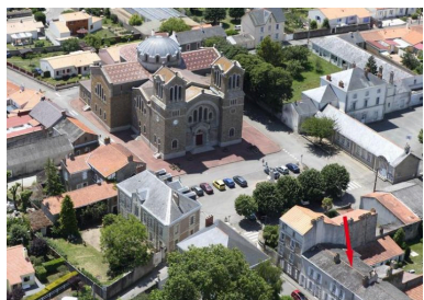
Situation sur la vue aérienne, 2010.