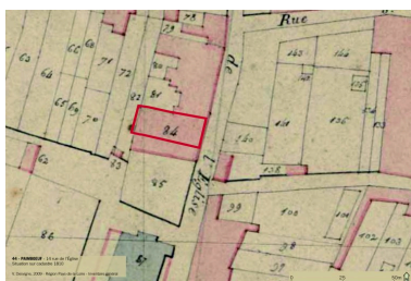
Situation sur cadastre 1810. IVR52_20094400341NUDA