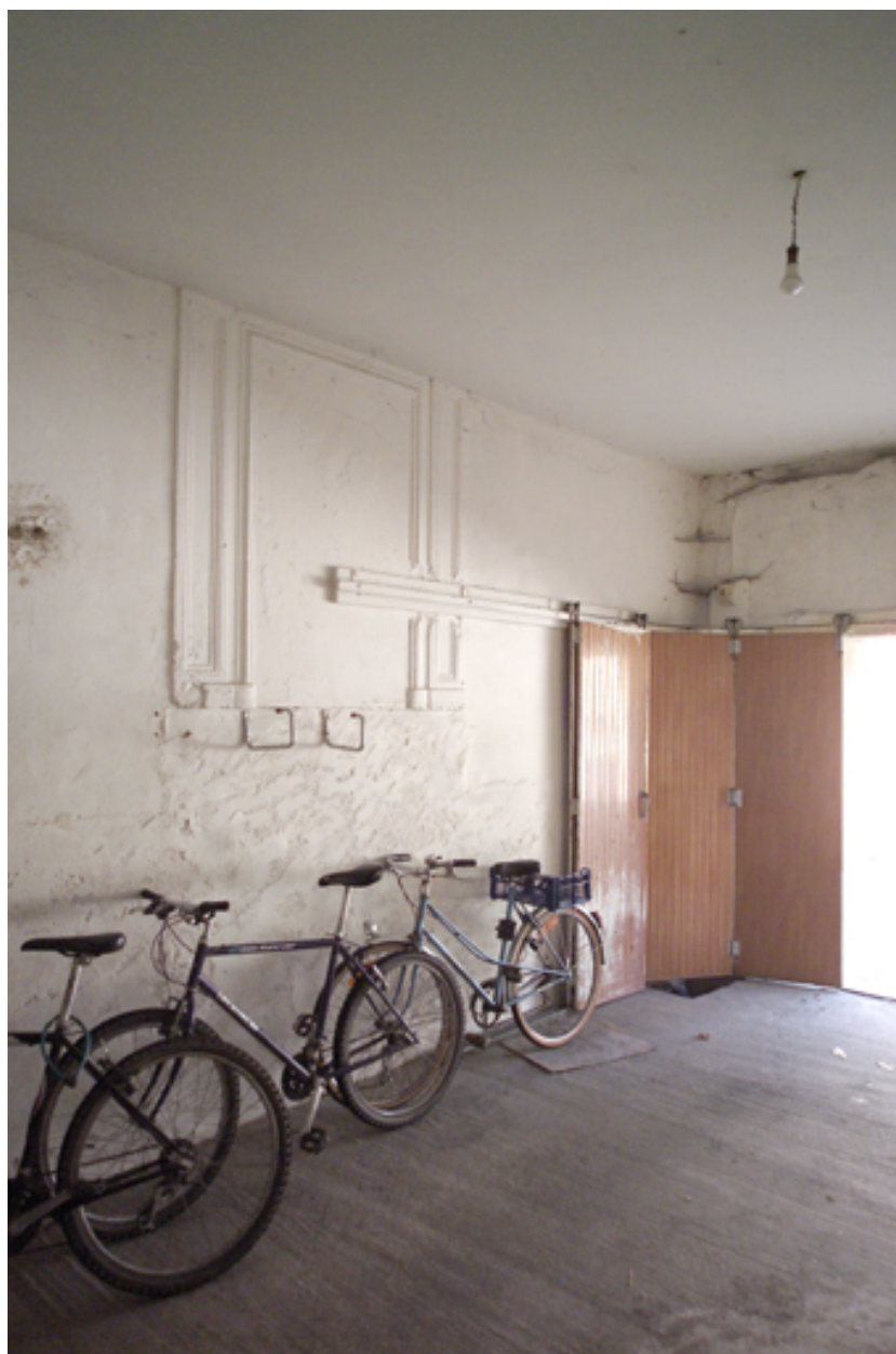
La pièce située au nord, détail du trumeau de la cheminée.