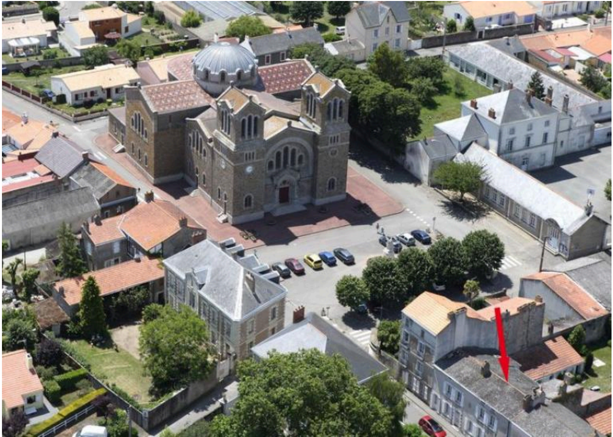
Situation sur la vue aérienne, 2010.