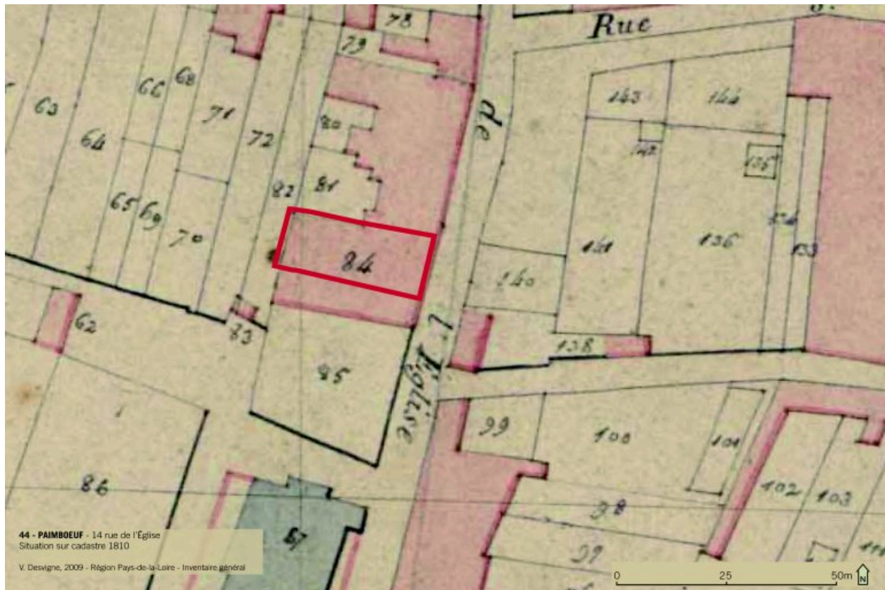
Situation sur cadastre 1810.