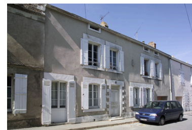
Vue d'ensemble depuis la rue. IVR52_20034401404NUCA