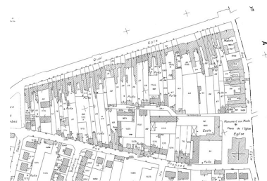
Plan cadastral, 1999, extrait. IVR52_20034400104NUCA