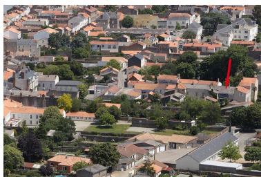
Situation sur la vue aérienne, 2010. IVR52_20104402709NUDA