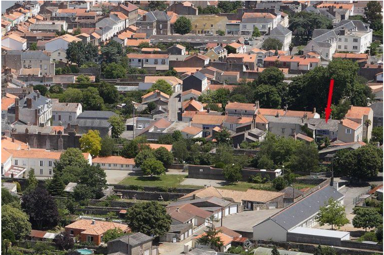
Situation sur la vue aérienne, 2010.