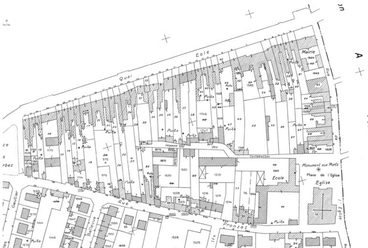
Plan cadastral, 1999, extrait.