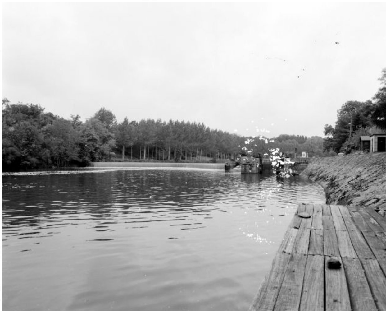
Vue d'ensemble du site d'écluse depuis le ponton situé en aval sur la rive gauche : barrage, centrale hydroélectrique, écluse, transformateur.