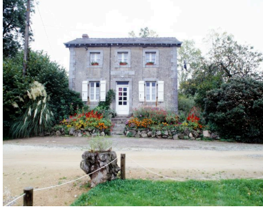
La maison éclusière.