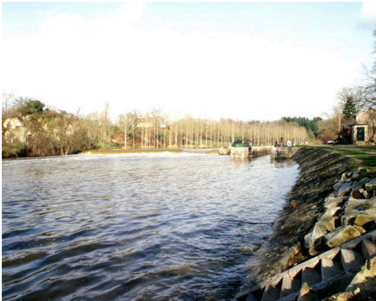
Vue d'ensemble du site d'écluse depuis le ponton situé en aval sur la rive gauche : barrage, centrale hydroélectrique, écluse, transformateur.