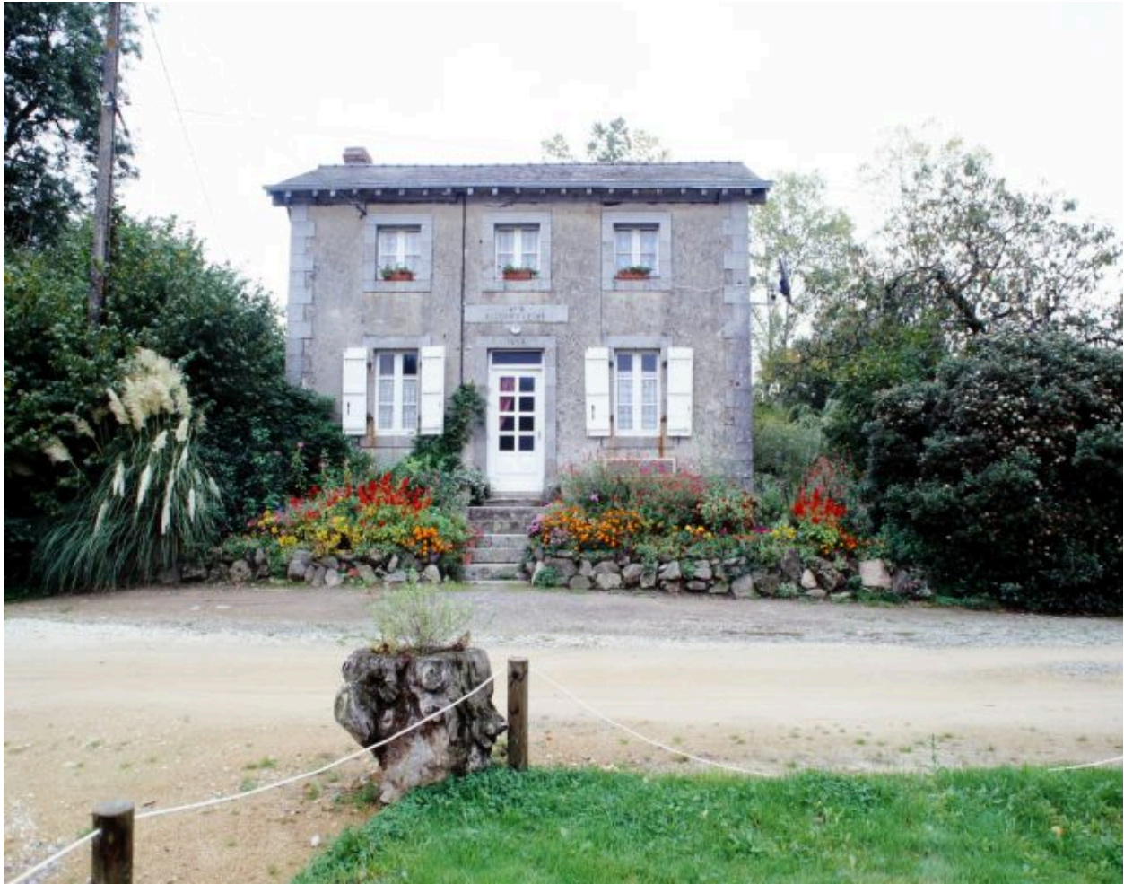
La maison éclusière.