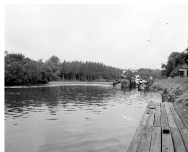
Vue d'ensemble du site d'écluse depuis le ponton situé en aval sur la rive gauche : barrage, centrale hydroélectrique, écluse, transformateur.