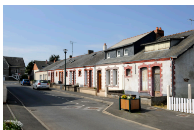
Maisons ouvrières de la Société Anonyme de Chaussures : rue Montmartre. IVR52_20114901326NUCA