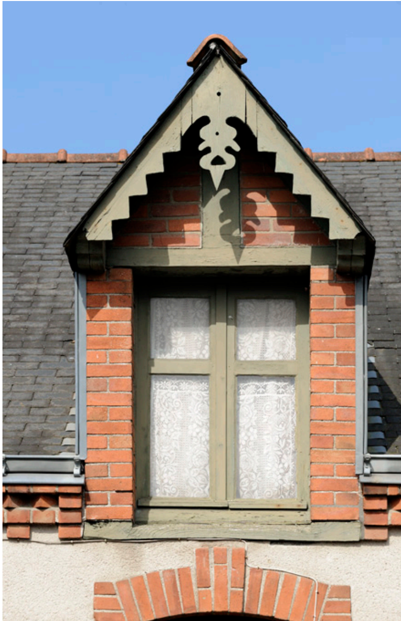
Maisons ouvrières de la Société Anonyme de Chaussures, rue Jeanne d'Arc : détail d'une lucarne.