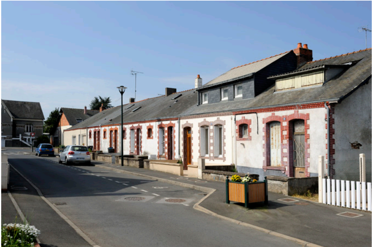
Maisons ouvrières de la Société Anonyme de Chaussures : rue Montmartre.