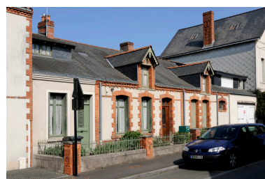
Maisons ouvrières de la Société Anonyme de Chaussures : rue Jeanne d'Arc. IVR52_20114901323NUCA