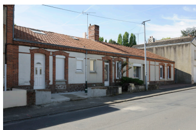
Maisons ouvrières de la Société Anonyme de Chaussures : rue de Bretagne.