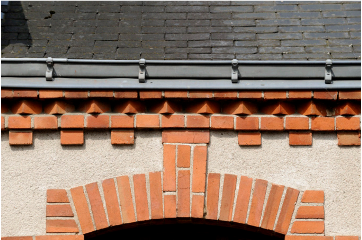
Maisons ouvrières de la Société Anonyme de Chaussures, rue Jeanne d'Arc : détail de la corniche et de l'encadrement d'une baie.