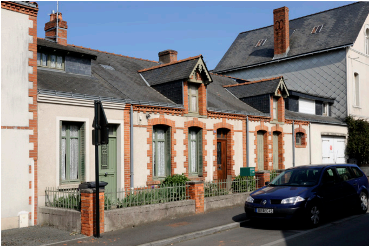
Maisons ouvrières de la Société Anonyme de Chaussures : rue Jeanne d'Arc.