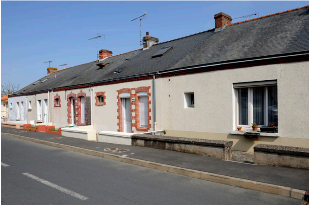
Maisons ouvrières de la Société Anonyme de Chaussures : rue Victor Hugo.