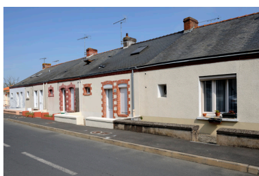
Maisons ouvrières de la Société Anonyme de Chaussures : rue Victor Hugo.