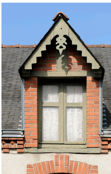
Maisons ouvrières de la Société Anonyme de Chaussures, rue Jeanne d'Arc : détail d'une lucarne.