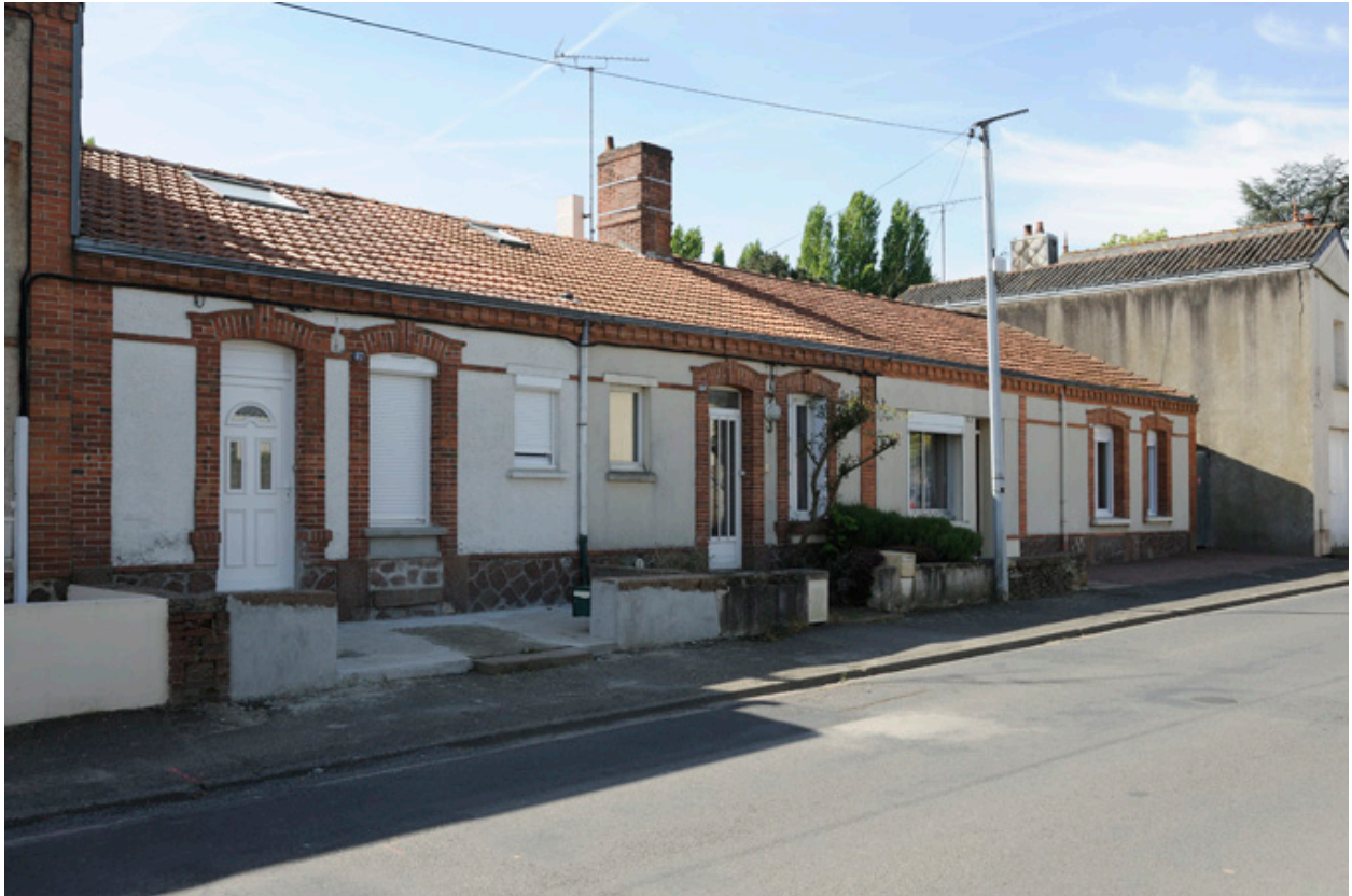
Maisons ouvrières de la Société Anonyme de Chaussures : rue de Bretagne.