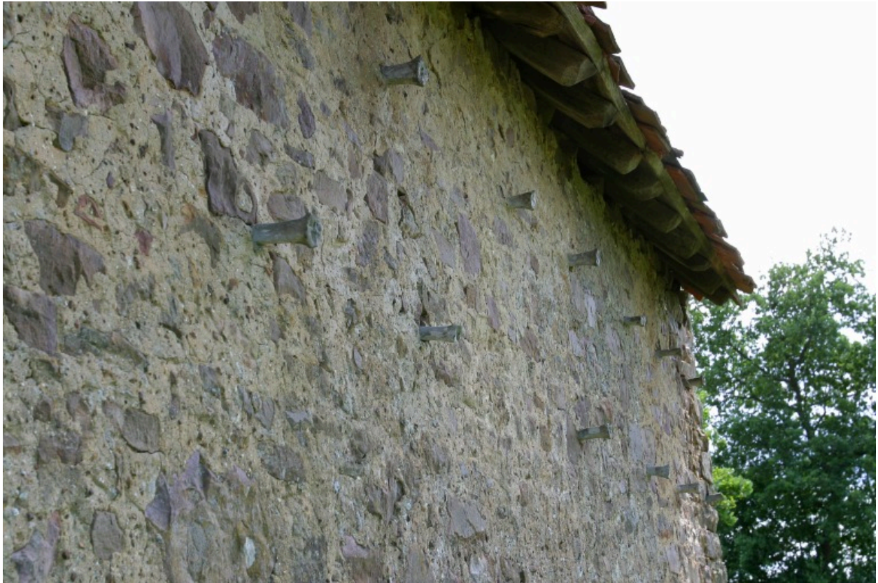
Détail du mur sud de l'étable : attaches en os.