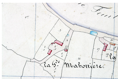
Extrait du plan cadastral de 1842, section E1. IVR52_20025301817NUCA