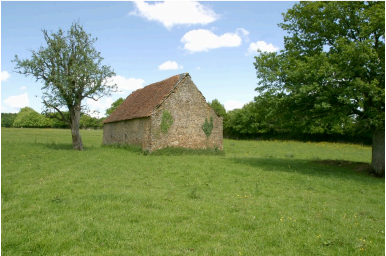
L'étable vue depuis le nord.