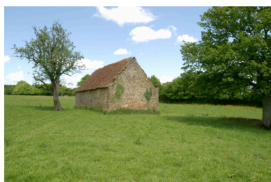
L'étable vue depuis le nord. IVR52_20035301753NUCA