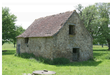
L'étable vue depuis le sud.