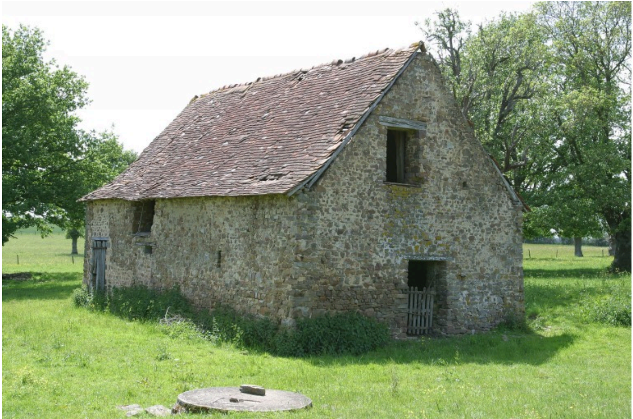
L'étable vue depuis le sud.