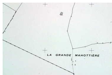
Extrait du plan cadastral renouvelé en 1982 et régulièrement mis à jour entre 1982 et 2002, section ZD. IVR52_20035302512NUCA