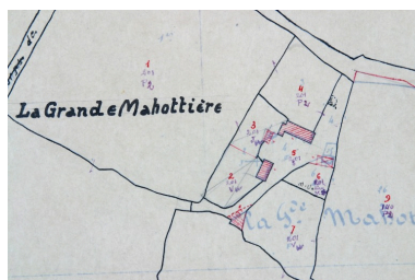
Extrait du plan cadastral de 1937, section E1. IVR52_20035301651NUCA