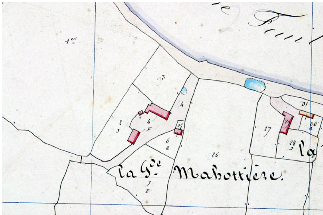
Extrait du plan cadastral de 1842, section E1.