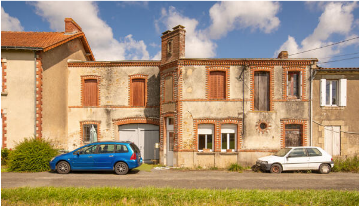
Vue générale des bâtiments depuis le sud.