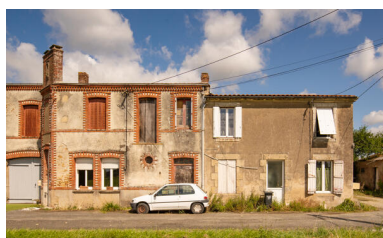
Vue générale des bâtiments depuis le sud. IVR52_20234400178NUCA