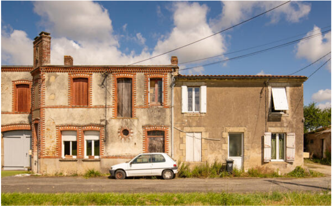
Vue générale des bâtiments depuis le sud.