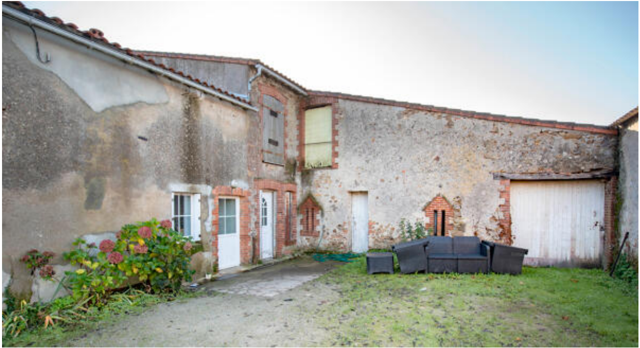
Chai, vue générale.