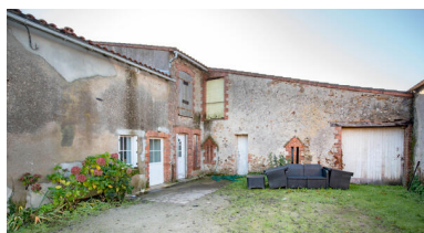
Chai, vue générale.