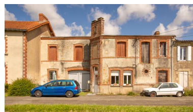
Vue générale des bâtiments depuis le sud.