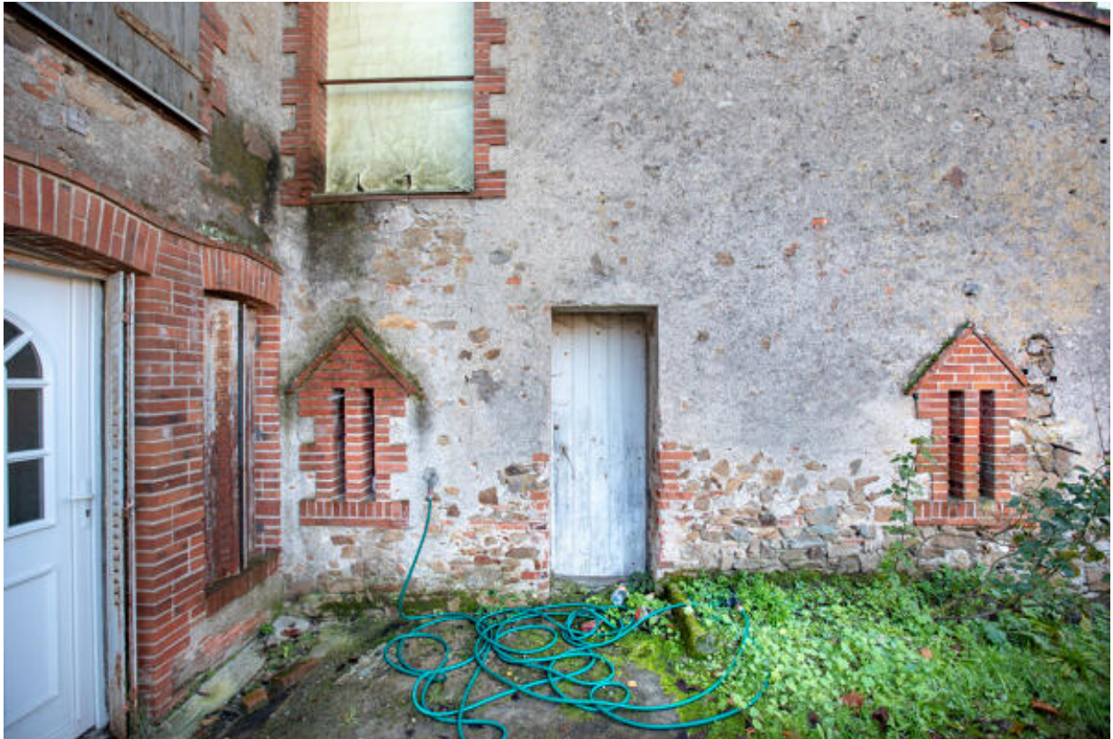
Détails des baies en archère.