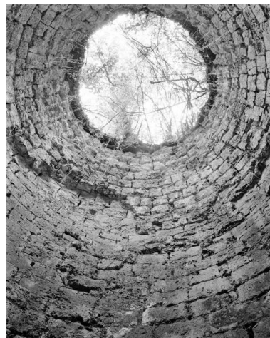
Vue verticale de bas en haut de la chambre de combustion, four à chaux du Cerisier, chemin du Croissement, Montjean-sur-Loire.