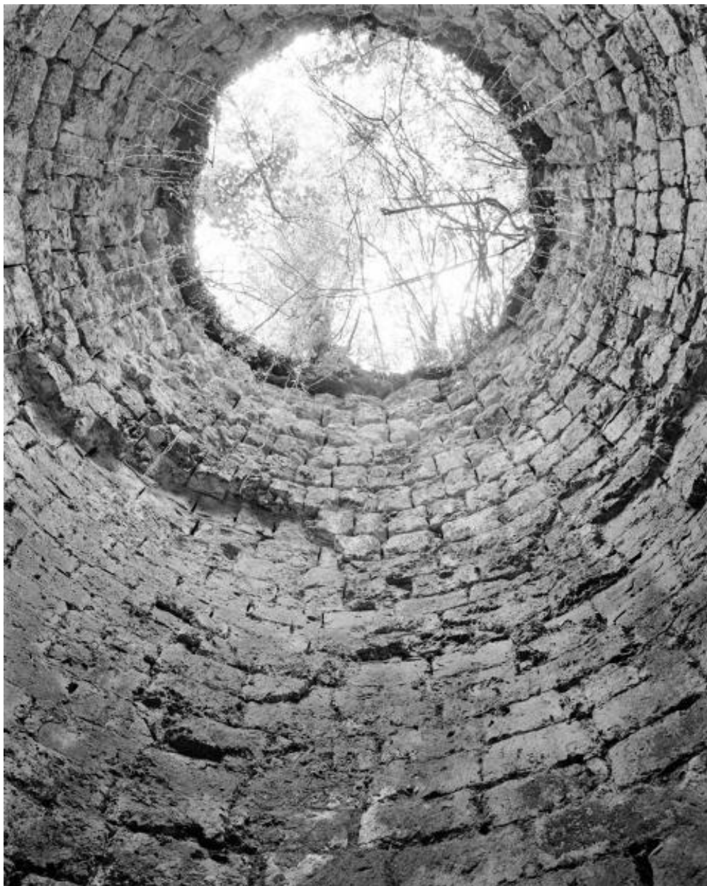
Vue verticale de bas en haut de la chambre de combustion, four à chaux du Cerisier, chemin du Croissement, Montjean-sur-Loire.