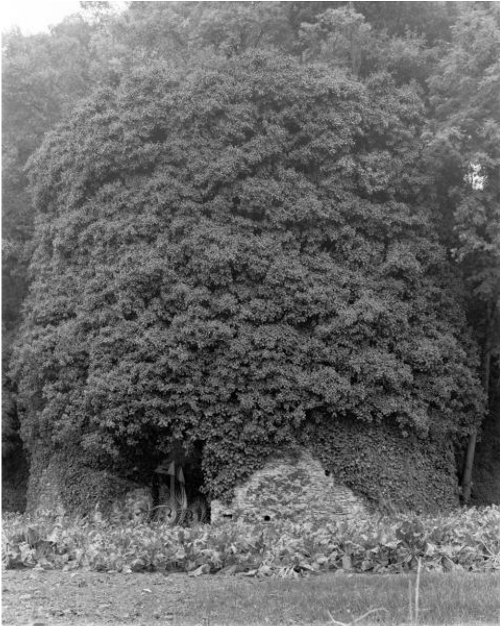
Vue d'ensemble du four à chaux du Cerisier depuis le Nord, chemin du Croissement, Montjean-sur-Loire.