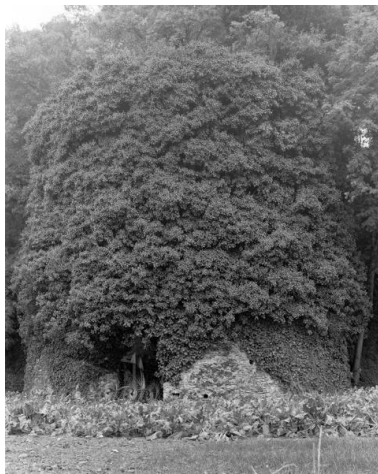
Vue d'ensemble du four à chaux du Cerisier depuis le Nord, chemin du Croissement, Montjean-sur-Loire.