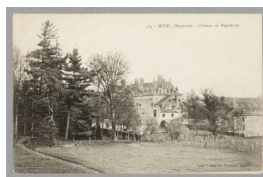
Le parc à l'anglaise, carte postale du début du XXe siècle.

IVR52_20215300134NUCA