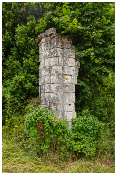
Un pilier de l'ancien portail.