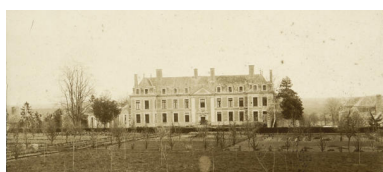
Le jardin en carrés, photographie de la fin du XIXe siècle.

Repro. Morgane Acou-Le Noan IVR52_20215300186NUCA