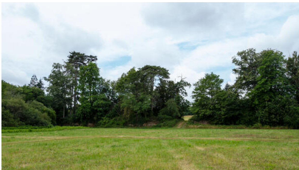
L'espace clos au-devant du château et le terrassement ouest.