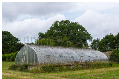
La serre.