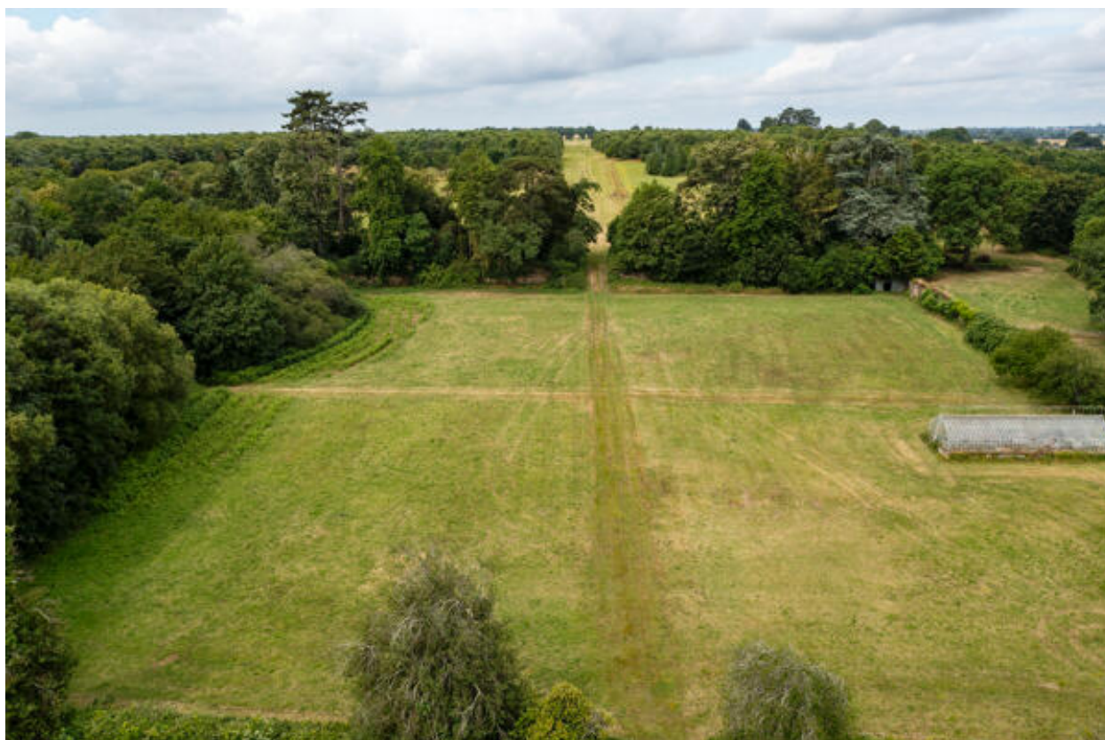
L'espace clos au-devant du château.