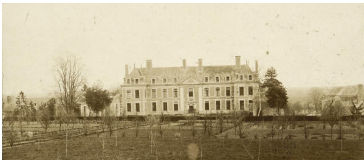
Le jardin en carrés, photographie de la fin du XIXe siècle.