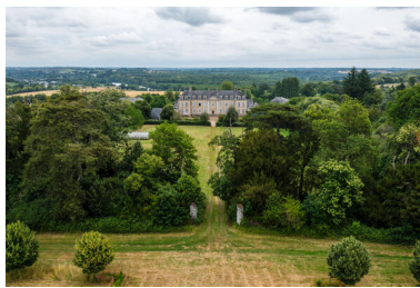
L'espace clos au-devant du château. IVR52_20235300906NUCA