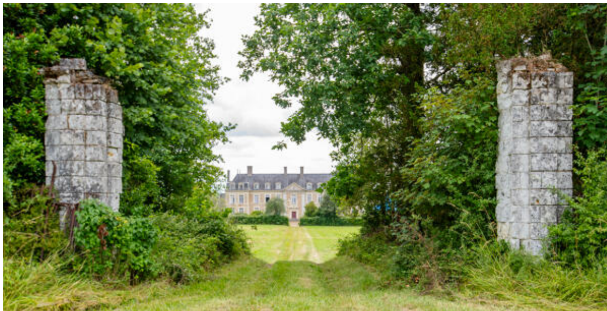
Les piliers de l'ancien portail.