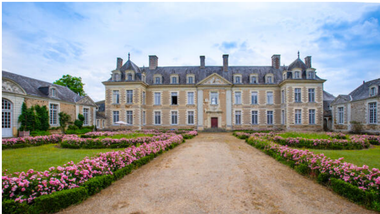
Les parterres devant la façade ouest.