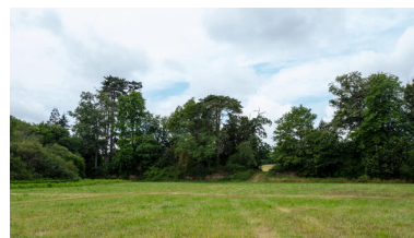
L'espace clos au-devant du château et le terrassement ouest. IVR52_20235300943NUCA