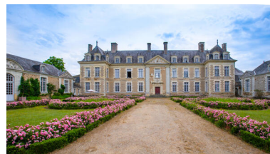
Les parterres devant la façade ouest.