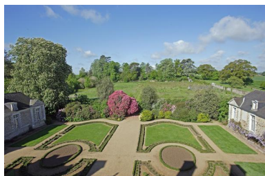
Les parterres devant la façade ouest. IVR52_20065300221NUCA