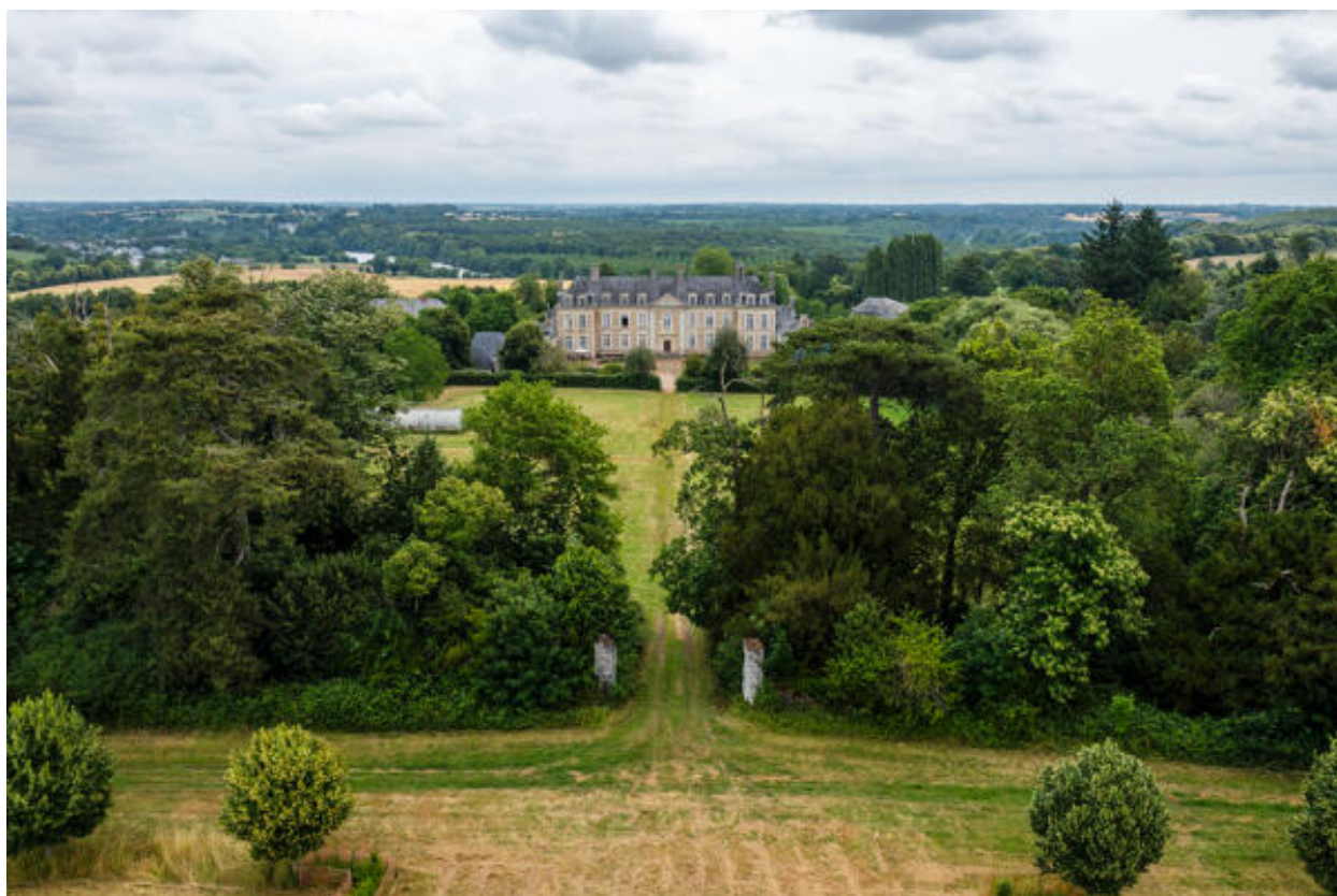
L'espace clos au-devant du château.