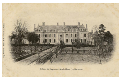
Le jardin en carrés, carte postale du début du XXe siècle.

IVR52_20215300186NUCA