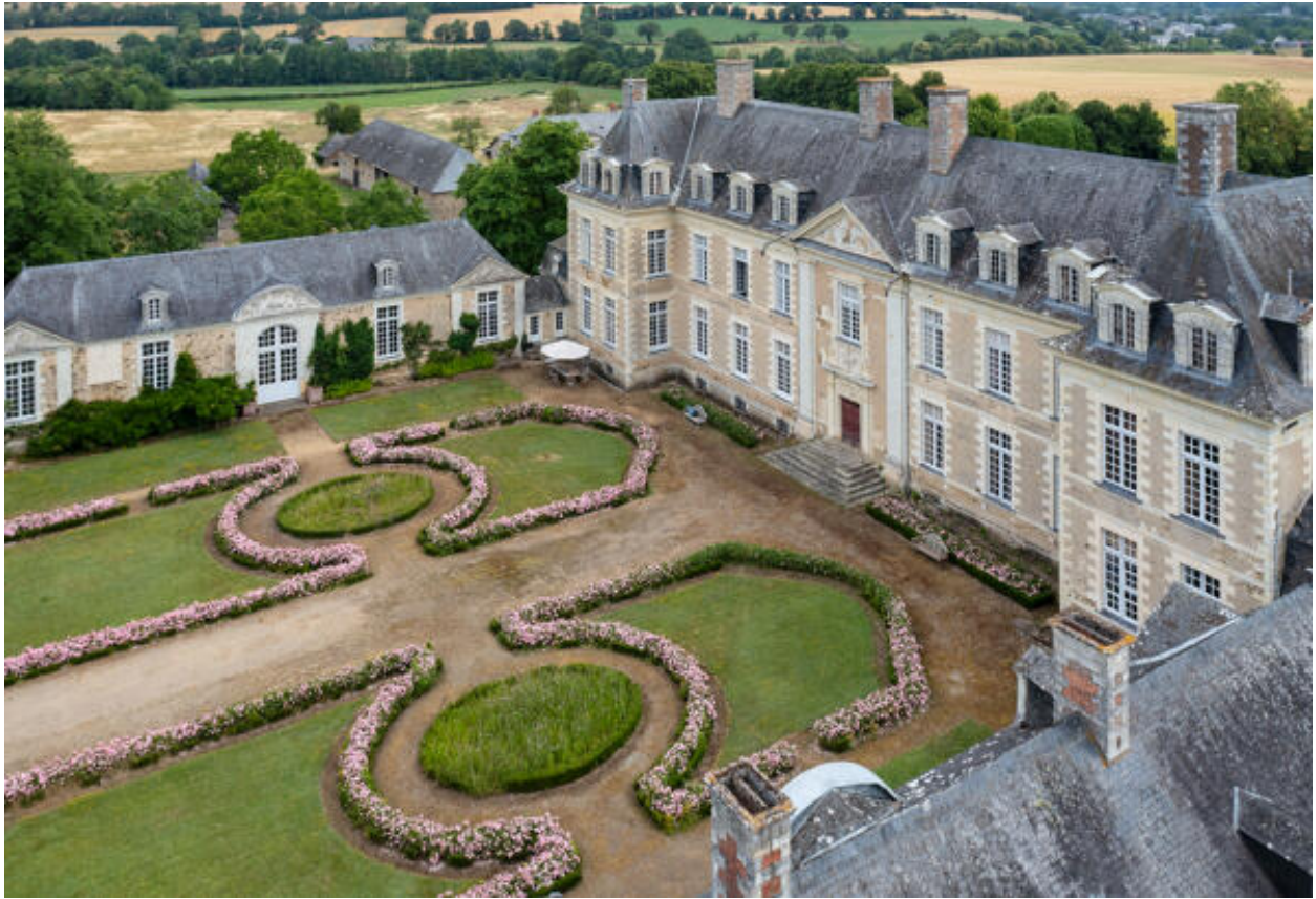
Les parterres devant le château.