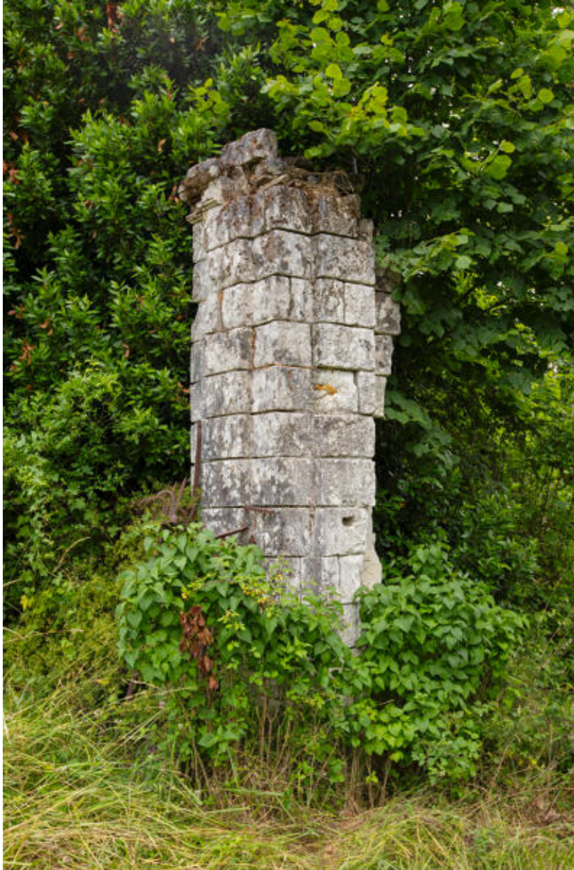
Un pilier de l'ancien portail.