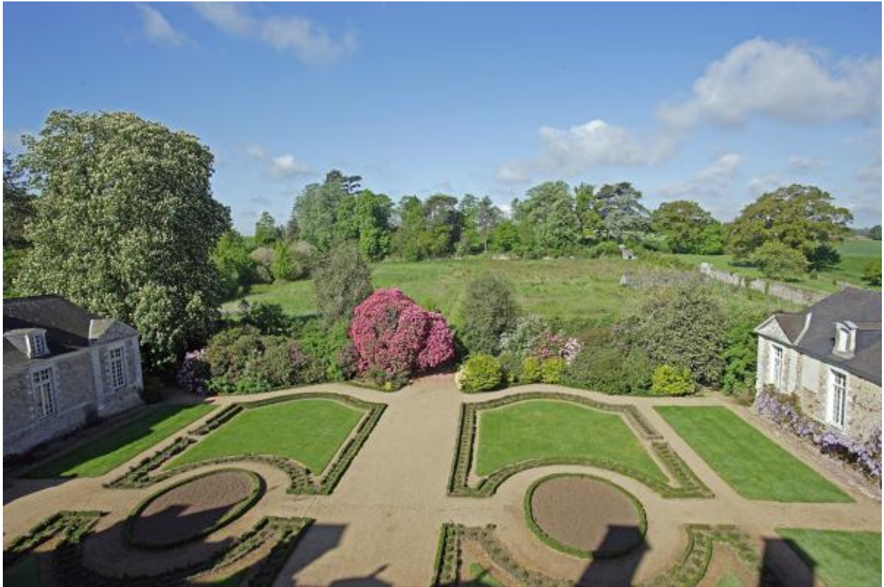
Les parterres devant la façade ouest.