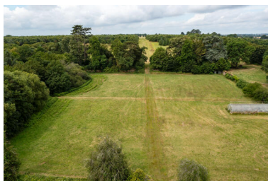
L'espace clos au-devant du château.