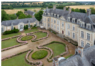
Les parterres devant le château.