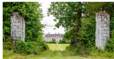
Les piliers de l'ancien portail.