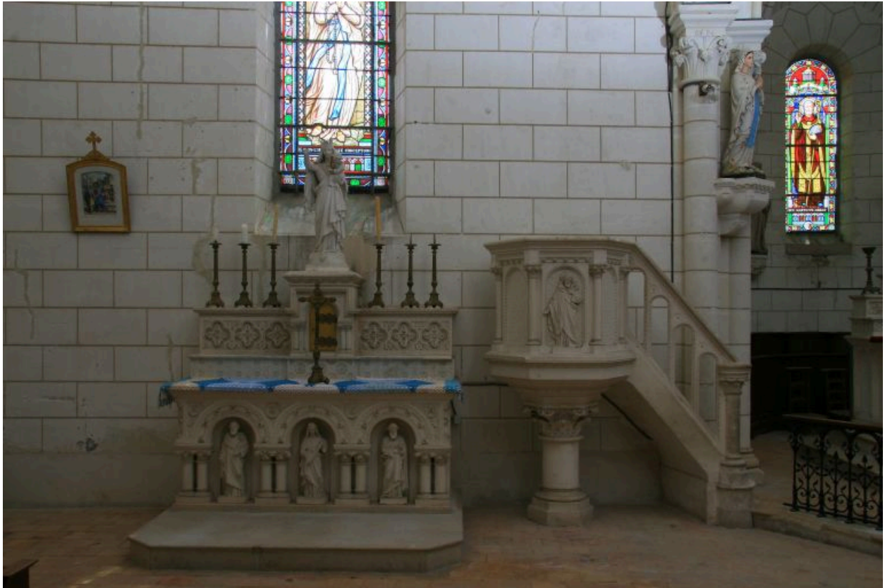
Autel de la Vierge et la chaire à prêcher.