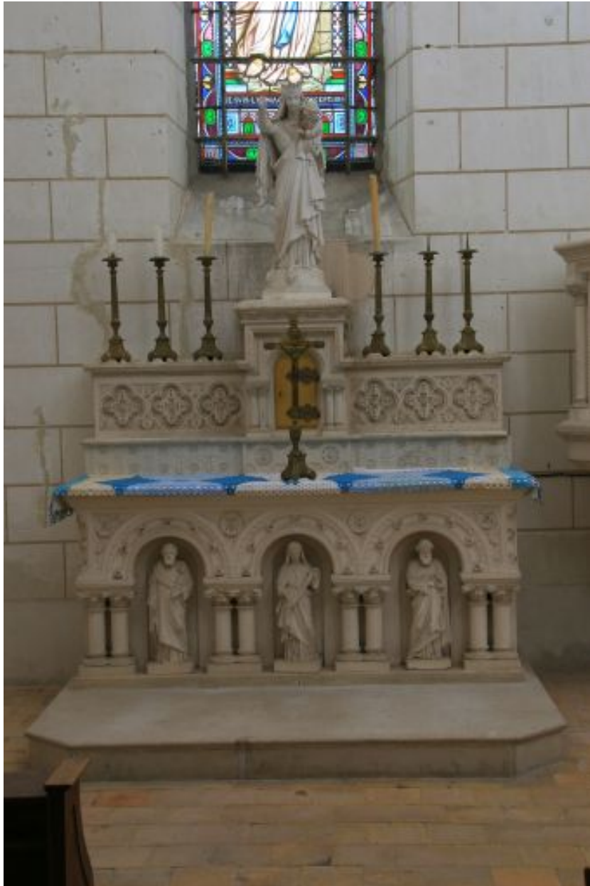
Autel de la Vierge.