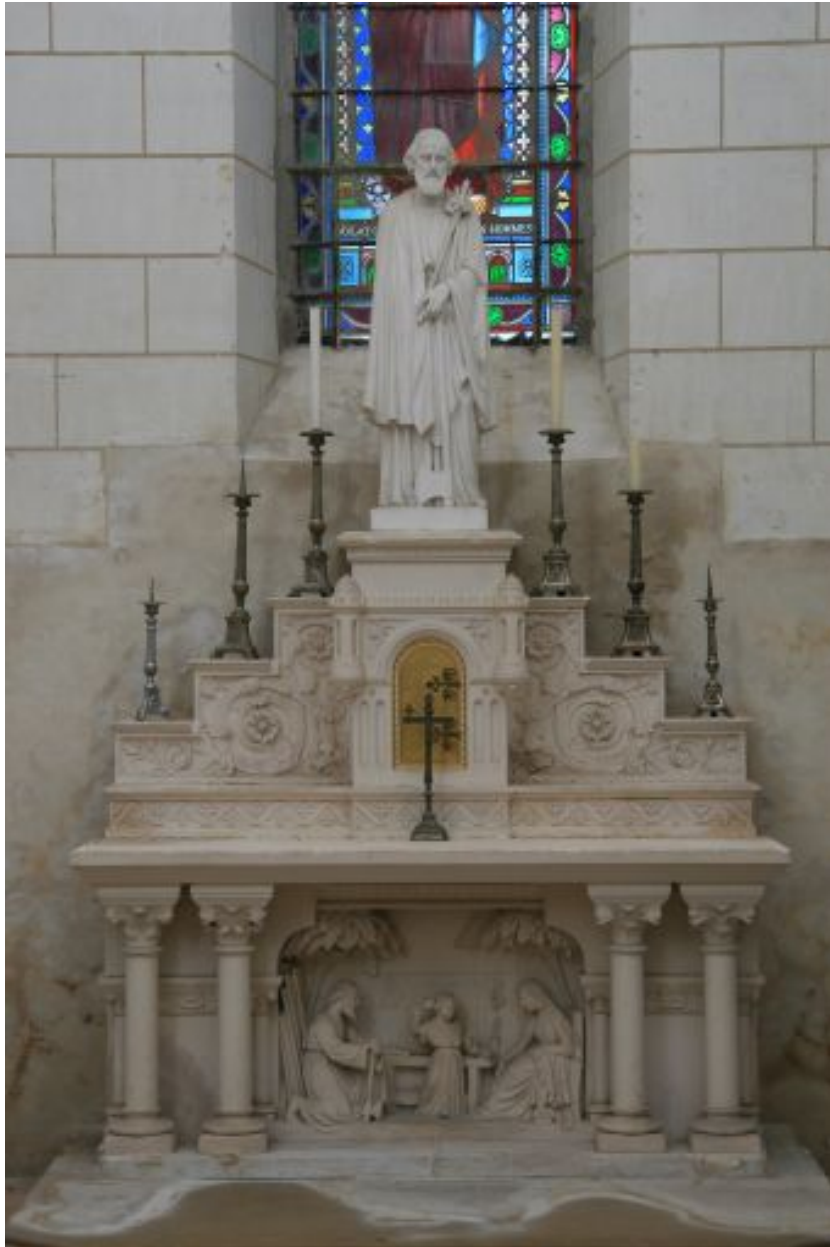
Autel de Saint-Joseph.