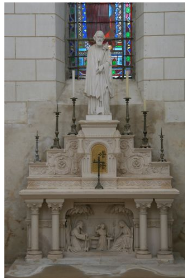
Autel de Saint-Joseph.

IVR52_20087200927NUCA