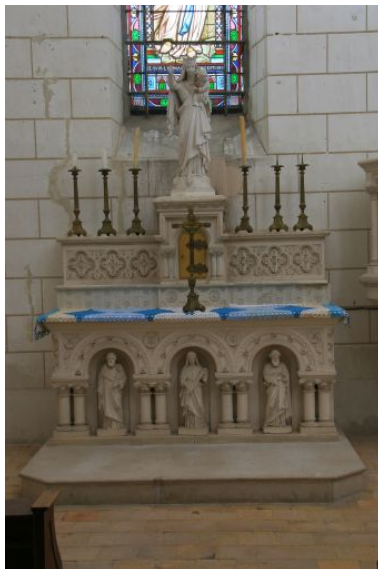
Autel de la Vierge.

Phot. Jean-Baptiste Darrasse IVR52_20087200918NUCA