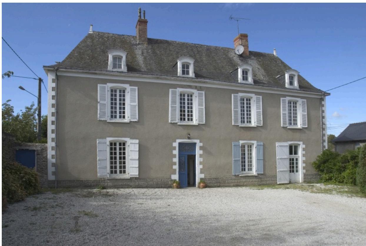
La maison du 26, rue Robert-Glétron.