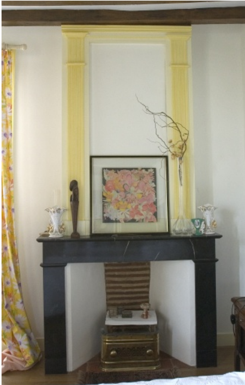
Cheminée d'une maison de Vaiges, 2e moitié du 19e siècle.