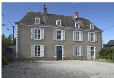
La maison du 26, rue Robert-Glétron. IVR52_20045303136NUCA