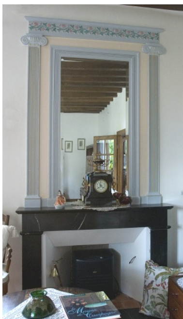
Cheminée d'une maison de Vaiges, 2e moitié du 19e siècle. IVR52_20045302162NUCA