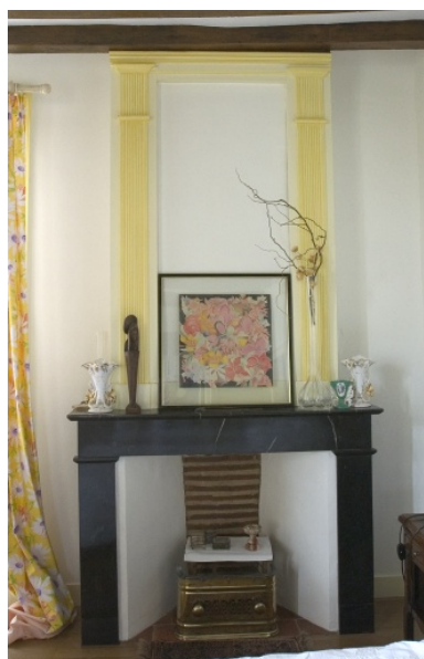
Cheminée d'une maison de Vaiges, 2e moitié du 19e siècle.