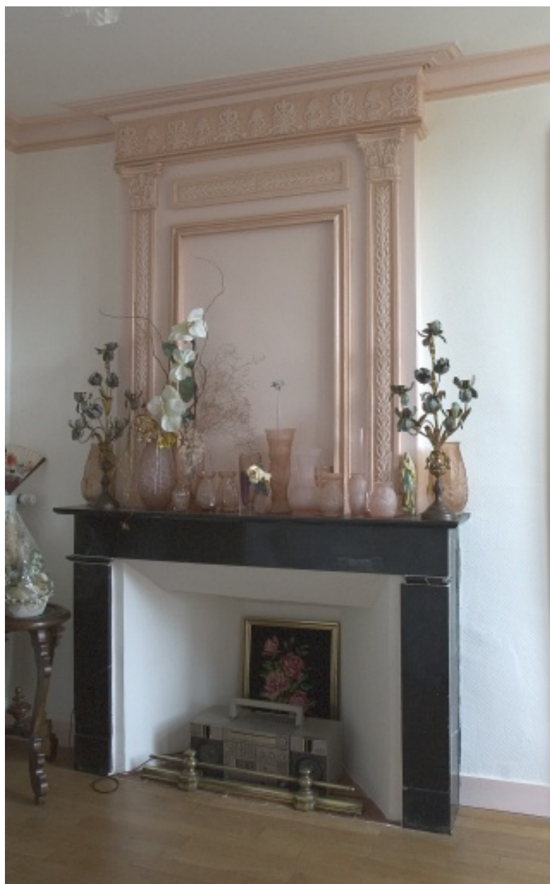
Cheminée d'une maison de Vaiges, 2e moitié du 19e siècle.