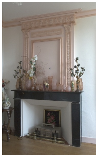
Cheminée d'une maison de Vaiges, 2e moitié du 19e siècle. IVR52_20045302160NUCA