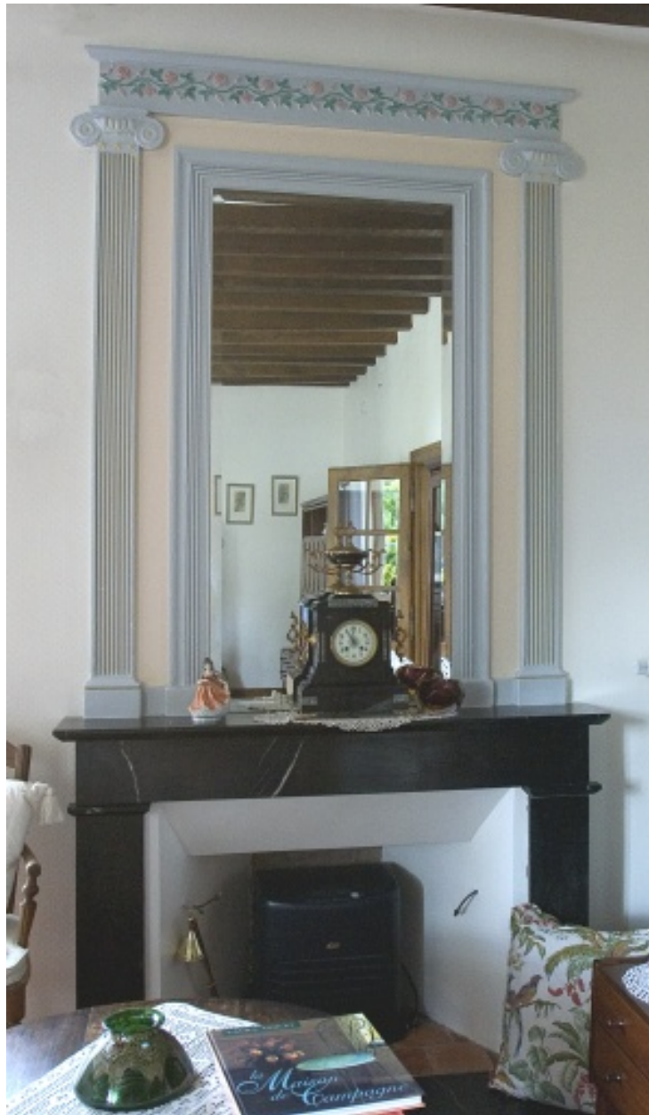
Cheminée d'une maison de Vaiges, 2e moitié du 19e siècle.