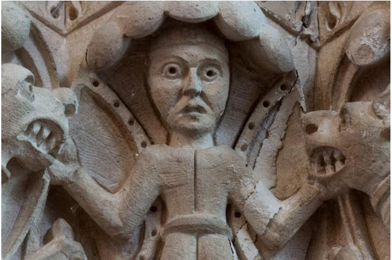
Chapiteaux de la pile sud-ouest de la croisée, détail.