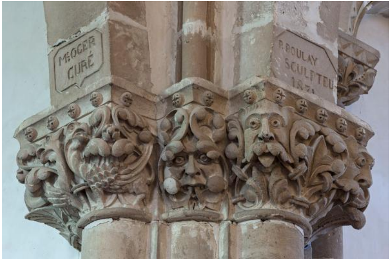
Chapiteaux sculptés de la pile nord-ouest de la croisée, signature du sculpteur Boulay et du commanditaire, le curé Oger, représentation de figures fantastiques.