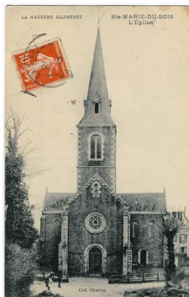
Carte postale de l'église de Sainte-Marie-du-Bois. IVR52_20205300497NUCA