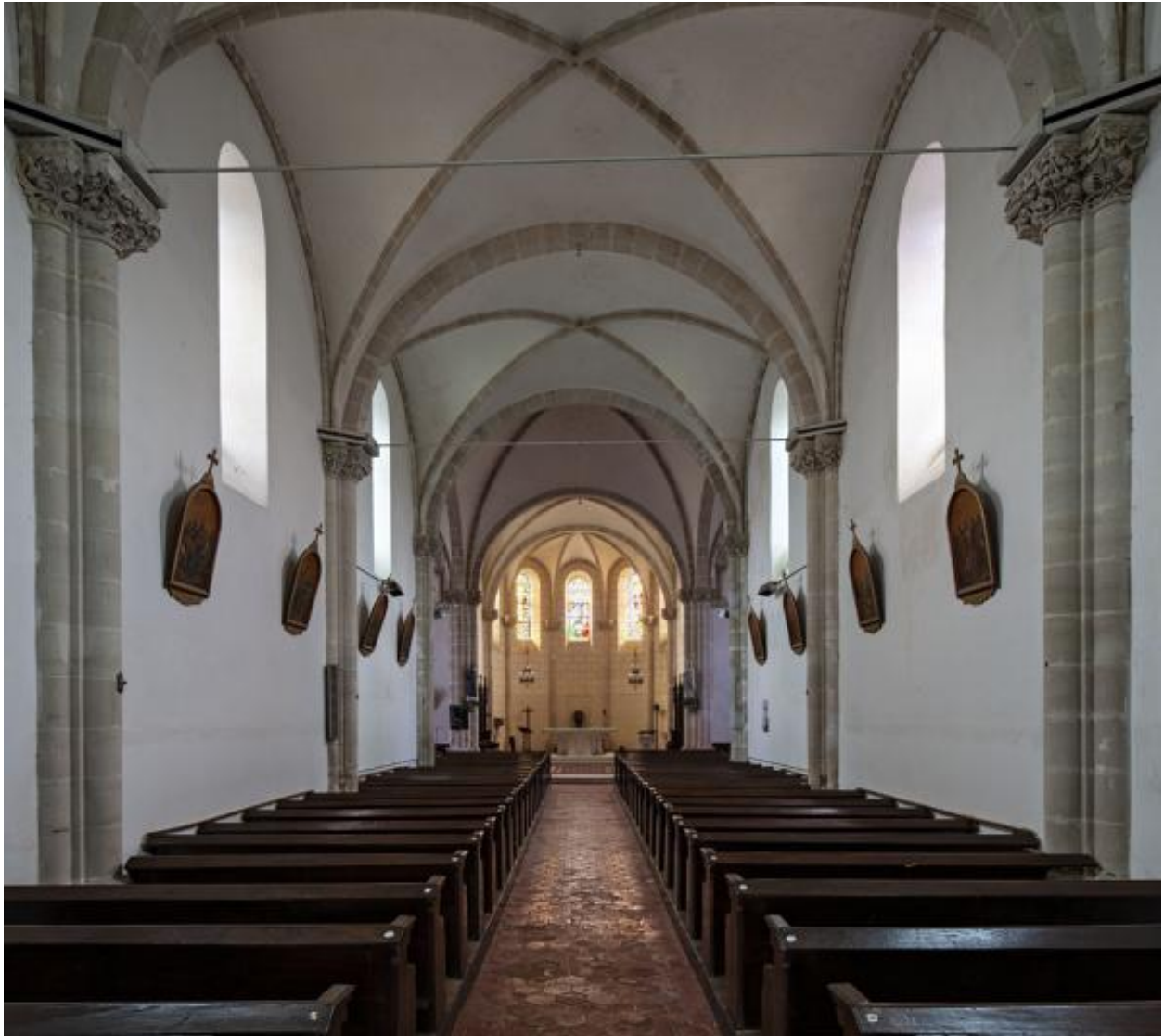
Nef et chœur.