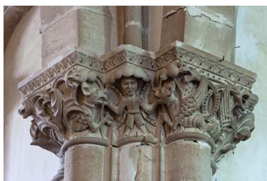
Chapiteaux de la pile sud-ouest de la croisée.