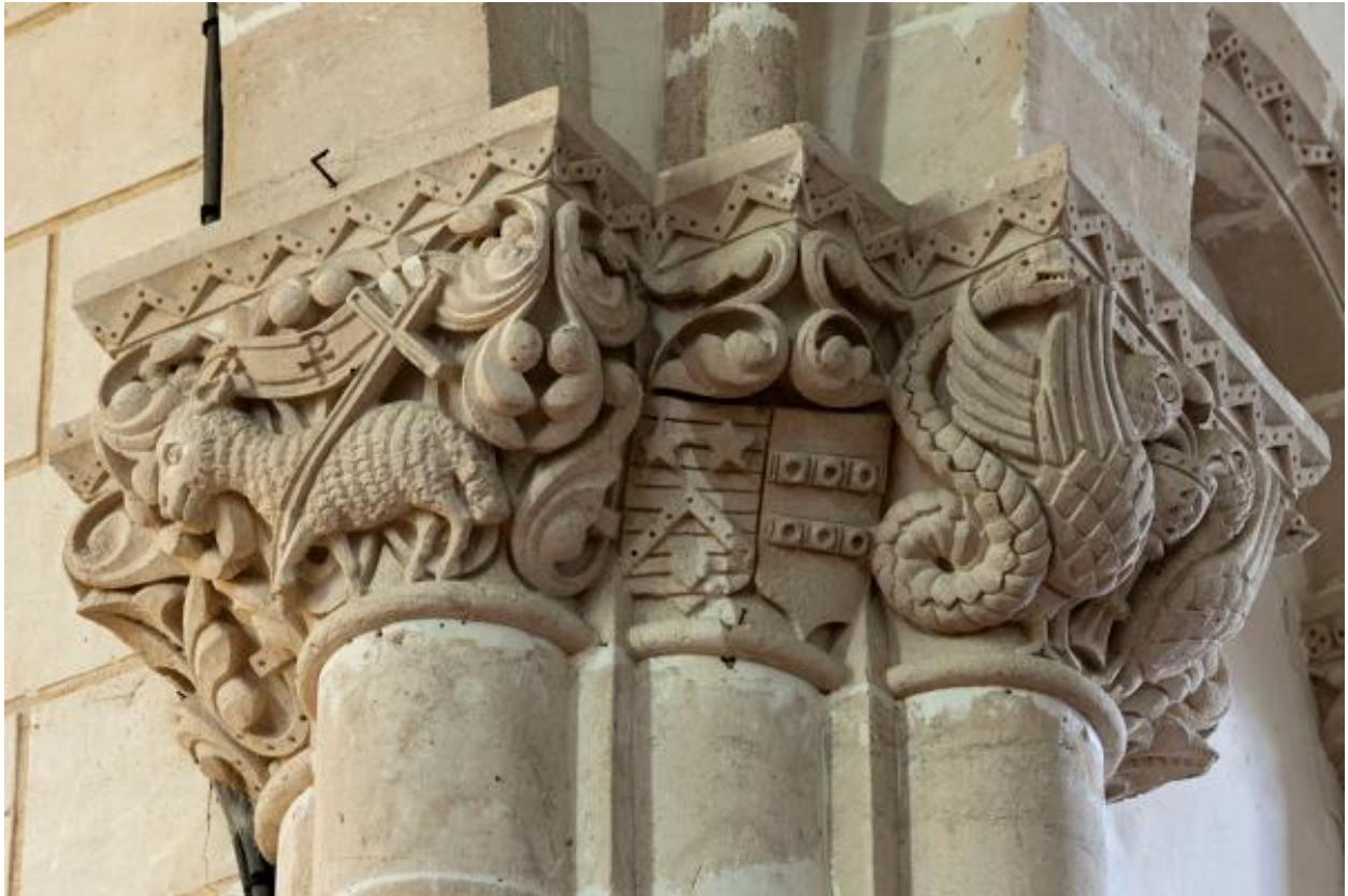
Chapiteaux sculptés de la pile sud-est de la croisée.