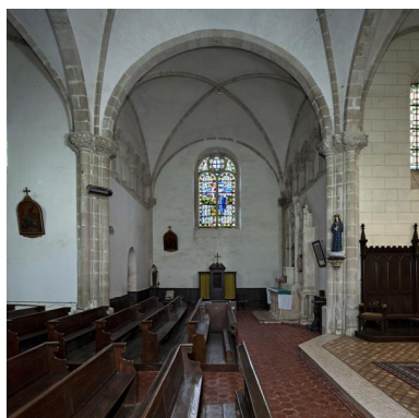
Bras nord du transept.