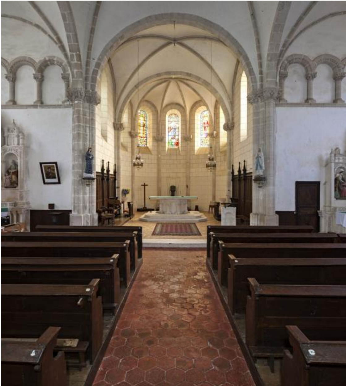
Croisée et chœur.