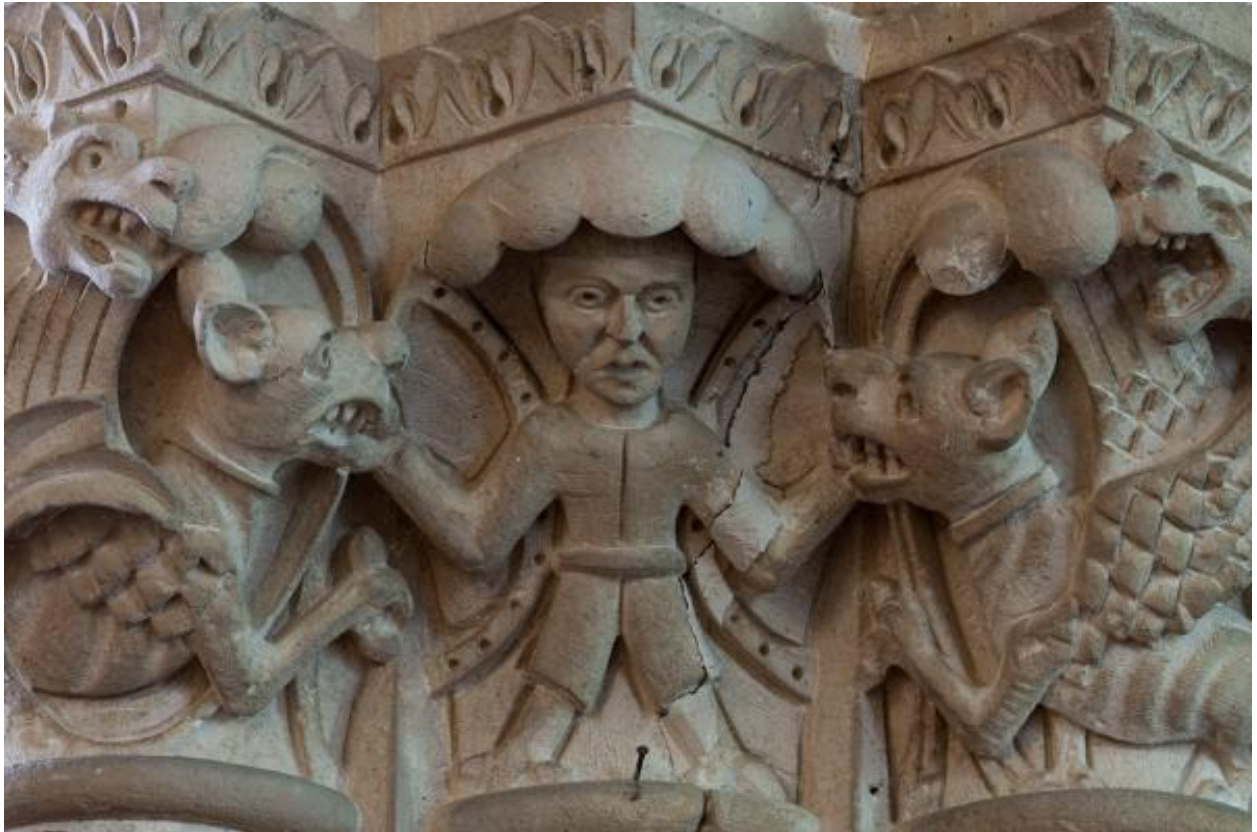
Chapiteaux de la pile sud-ouest de la croisée du transept de l'église de Sainte-Marie-du-Bois, détail.