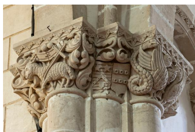
Chapiteaux sculptés de la pile sud-est de la croisée.