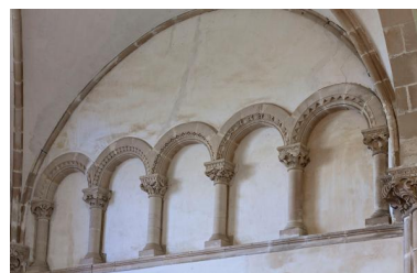
Arcades décoratives du bras nord du transept.