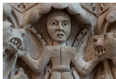
Chapiteaux de la pile sud-ouest de la croisée, détail. IVR52_20195300539NUCA