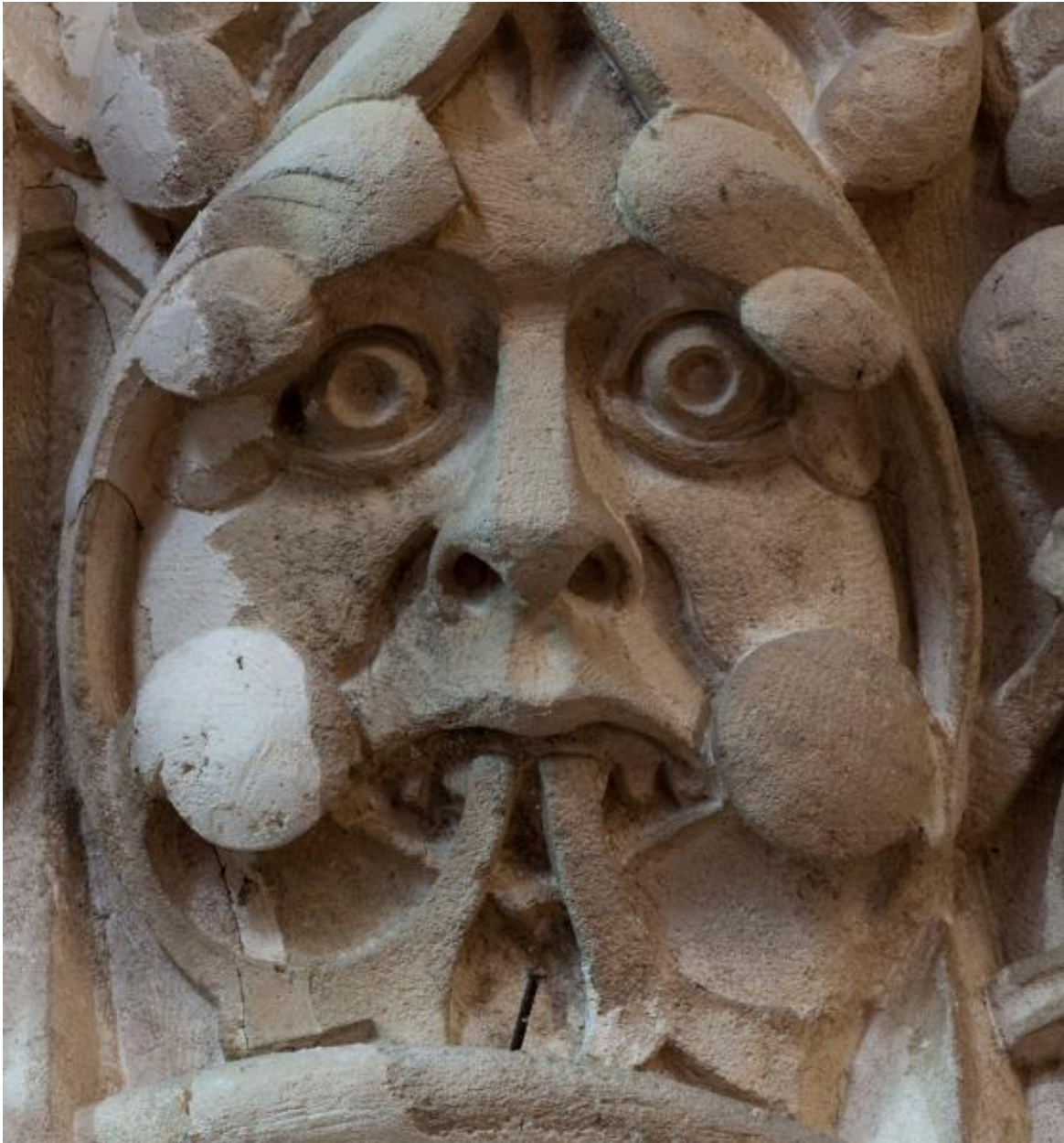
Chapiteaux sculptés de la pile nord-ouest de la croisée, détail.