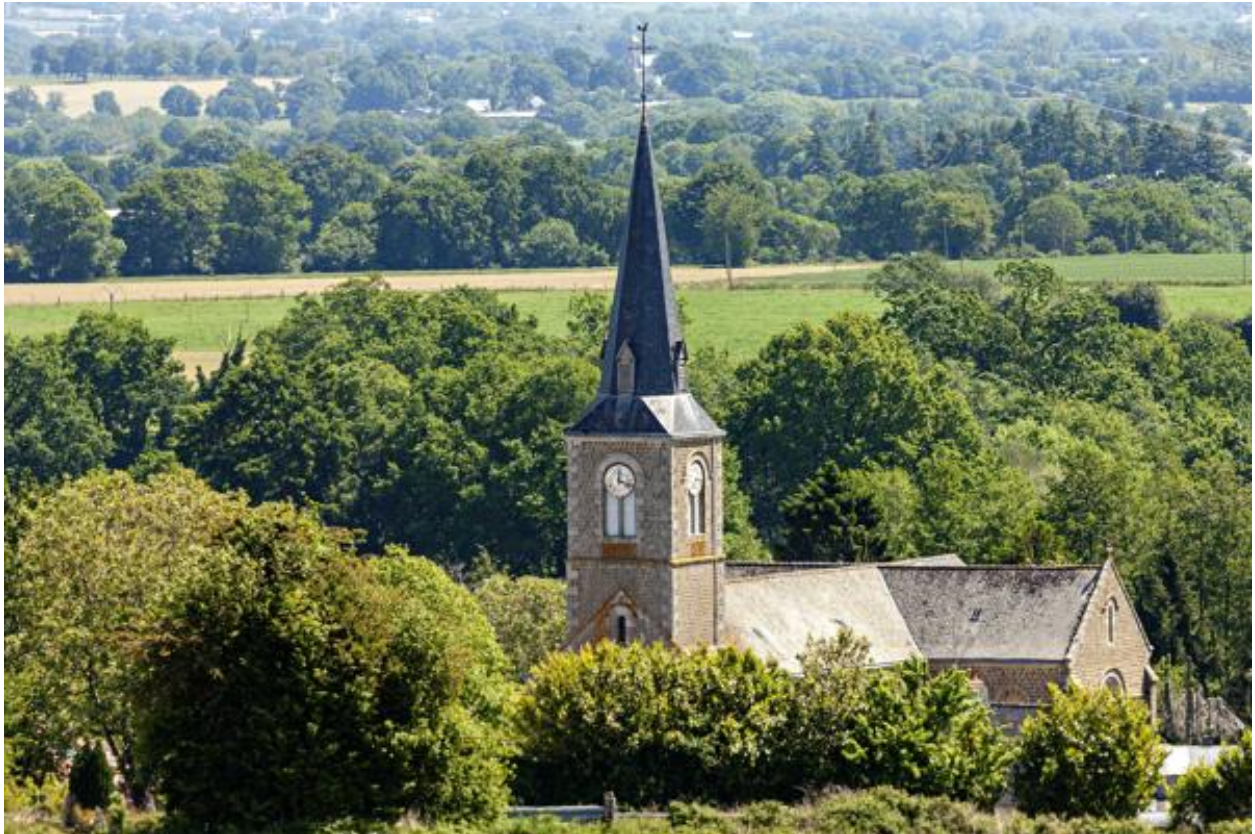
L'église de Sainte-Marie-du-Bois, vue depuis l'ouest.