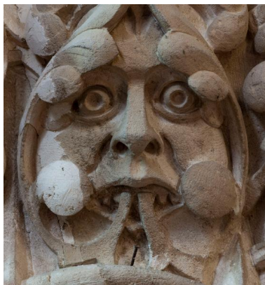
Chapiteaux sculptés de la pile nord-ouest de la croisée, détail.