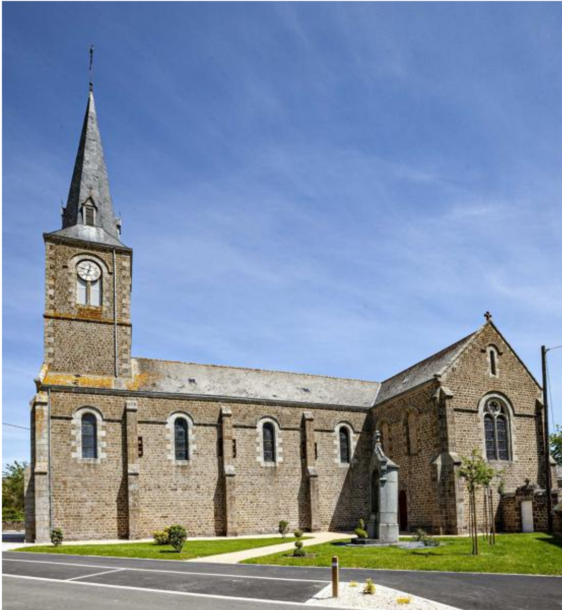
Flanc sud de l'église.