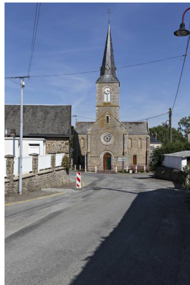
Façade occidentale de l'église de Sainte-Marie-du-Bois.