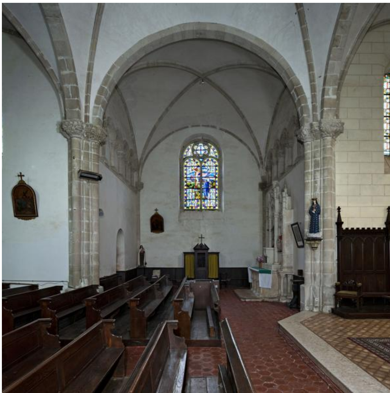
Bras nord du transept.