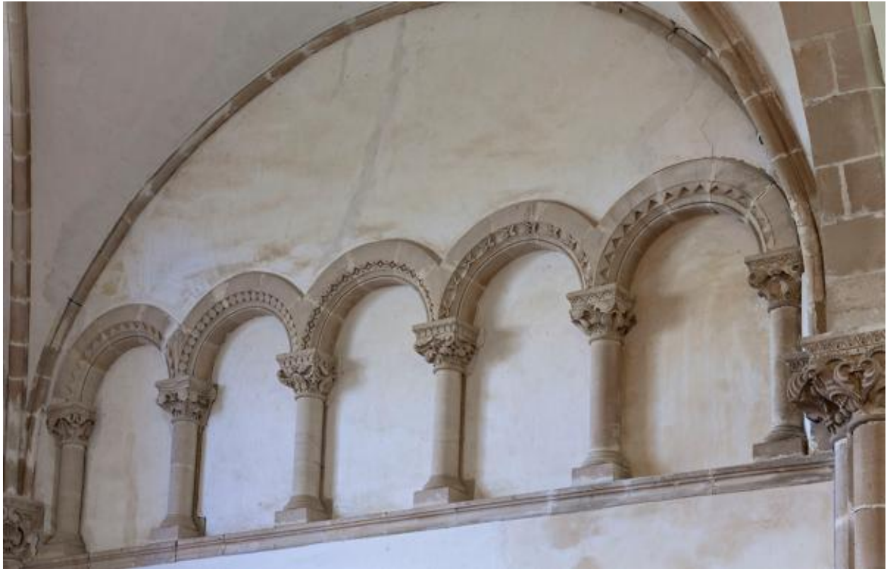
Arcades décoratives du bras nord du transept.