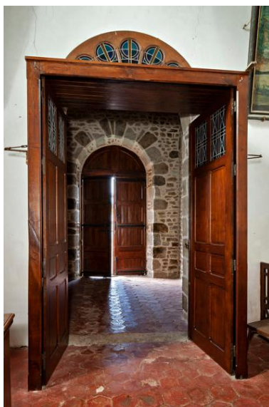
Vue de l'intérieur de la tour-clocher depuis la nef.