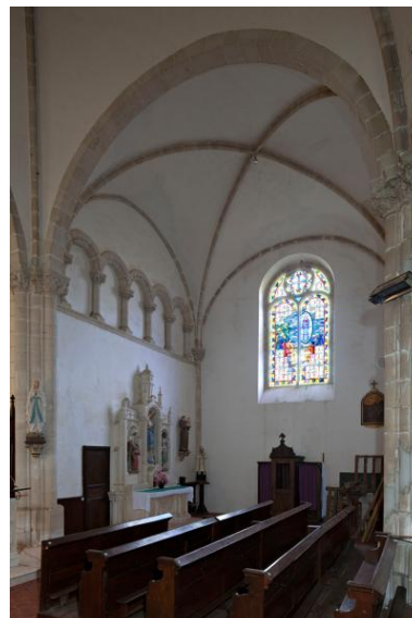
Bras sud du transept. IVR52_20195300533NUCA