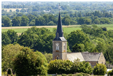
L'église de Sainte-Marie- du-Bois, vue depuis l'ouest.