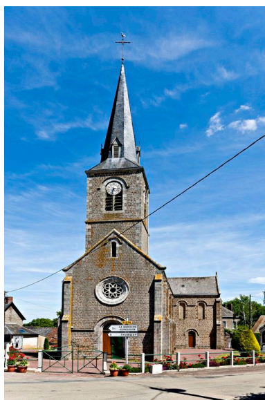
Vue d'ensemble. IVR52_20155300079NUCA