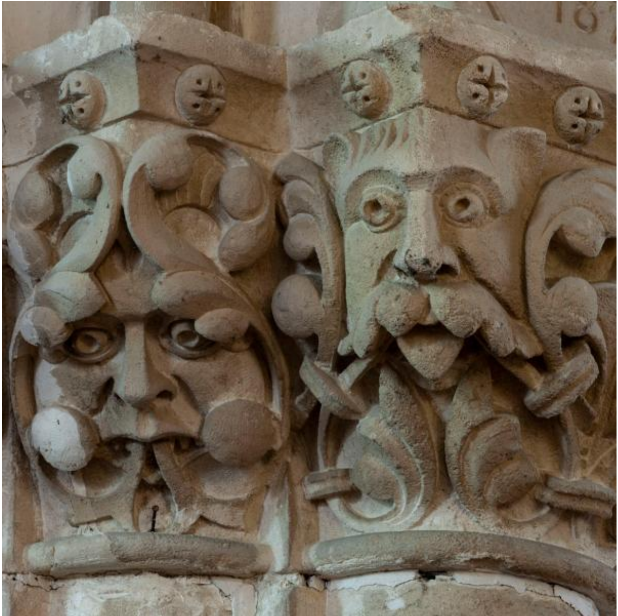
Chapiteaux sculptés de la pile nord-ouest de la croisée, détail.