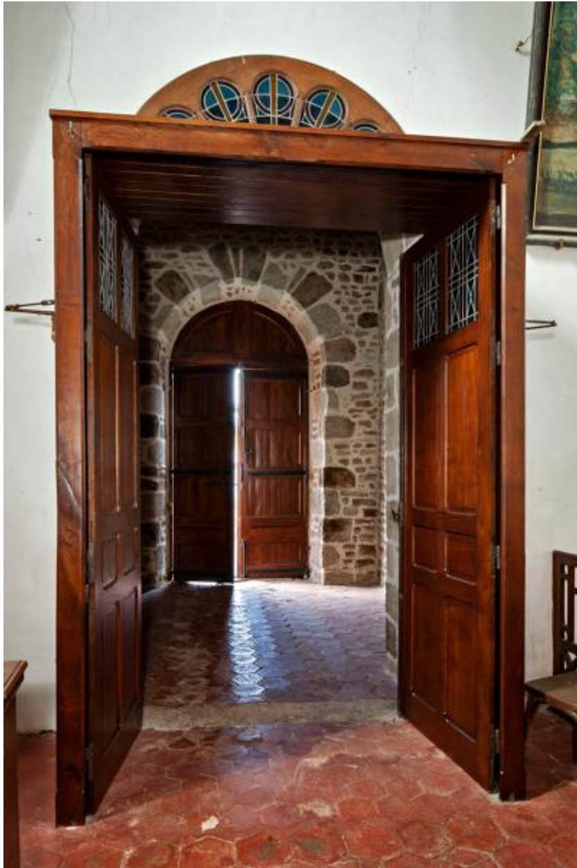
Vue de l'intérieur de la tour-clocher depuis la nef.