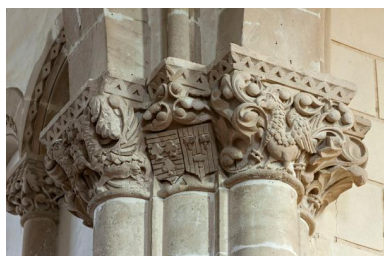
Chapiteaux sculptés de la pile nord-est de la croisée.