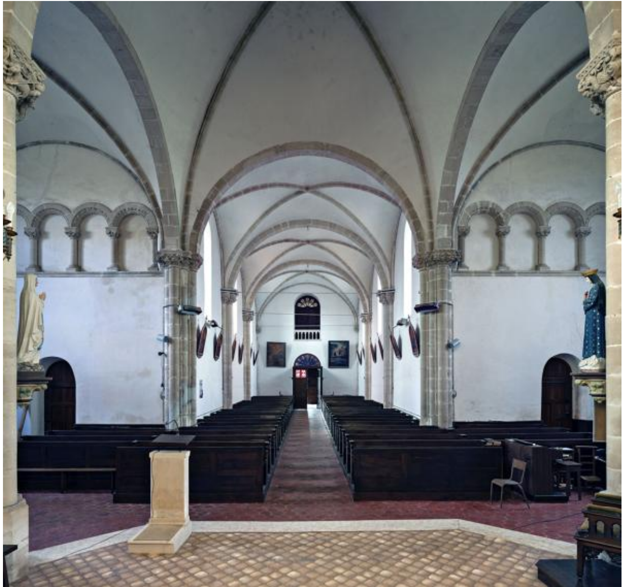
Croisée et nef, vues depuis le chœur.