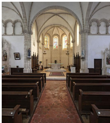
Croisée et chœur.