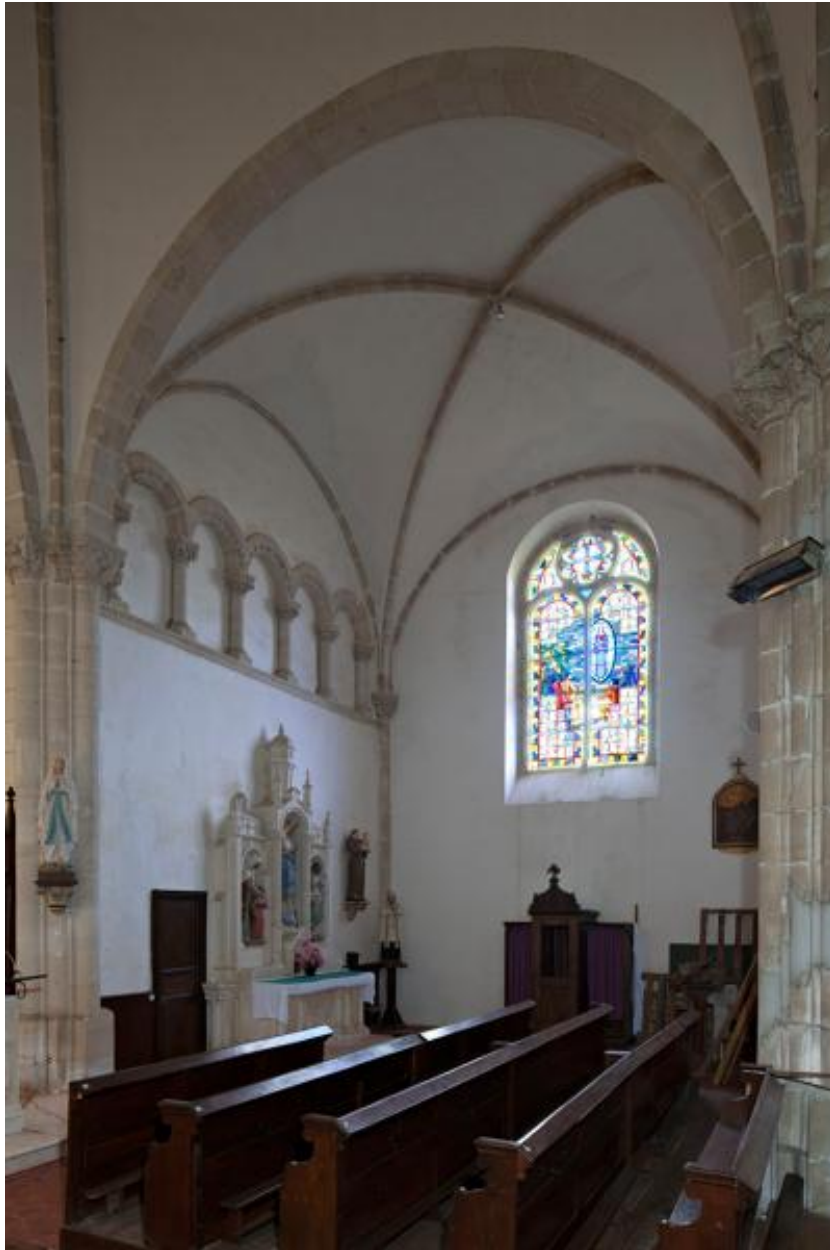
Bras sud du transept.