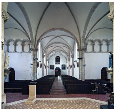
Croisée et nef, vues depuis le chœur.