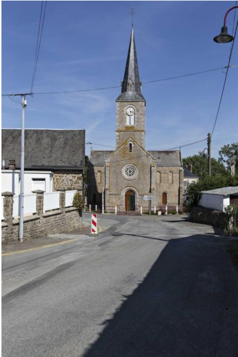
Façade occidentale de l'église de Sainte-Marie-du-Bois.