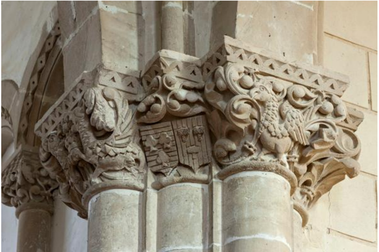
Chapiteaux sculptés de la pile nord-est de la croisée.