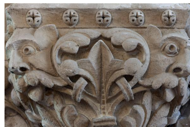
Chapiteaux sculptés de la pile nord-ouest de la croisée, détail. IVR52_20195300536NUCA