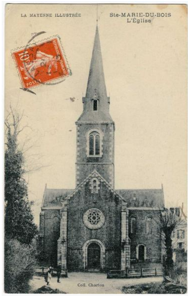
Carte postale de l'église de Sainte-Marie-du-Bois.