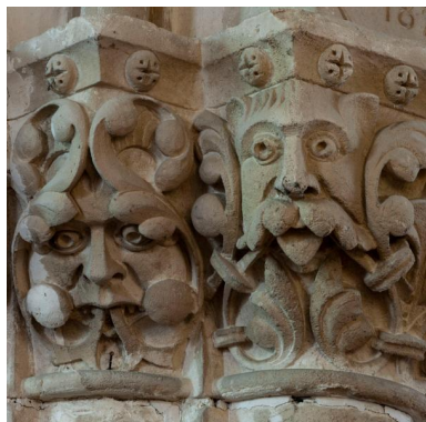
Chapiteaux sculptés de la pile nord-ouest de la croisée, détail. IVR52_20195300537NUCA