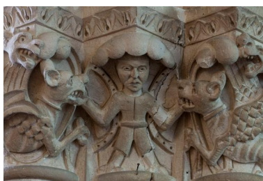
Chapiteaux de la pile sud-ouest de la croisée du transept de l'église de Sainte-Marie-du-Bois, détail. IVR52_20195300538NUCA