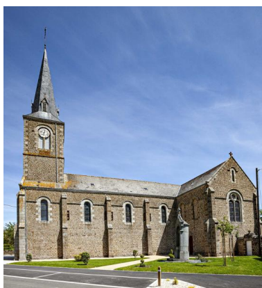
Flanc sud de l'église. IVR52_20215300685NUCA