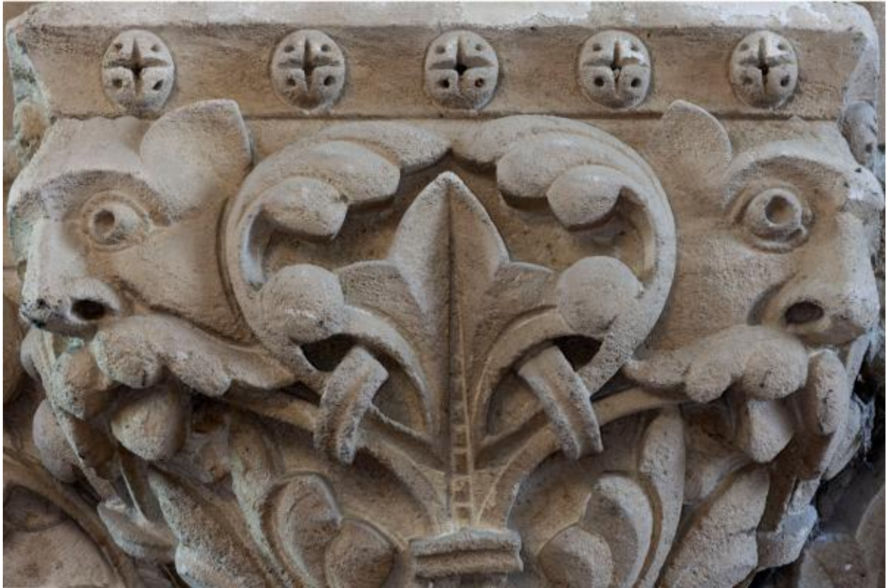
Chapiteaux sculptés de la pile nord-ouest de la croisée, détail.