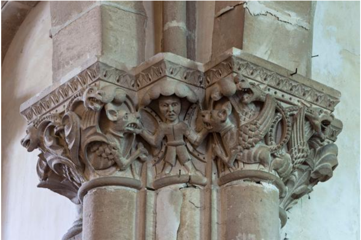
Chapiteaux de la pile sud-ouest de la croisée.