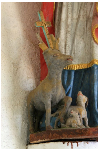
Statue de saint Hubert, détail.

IVR52_20087201218NUCA