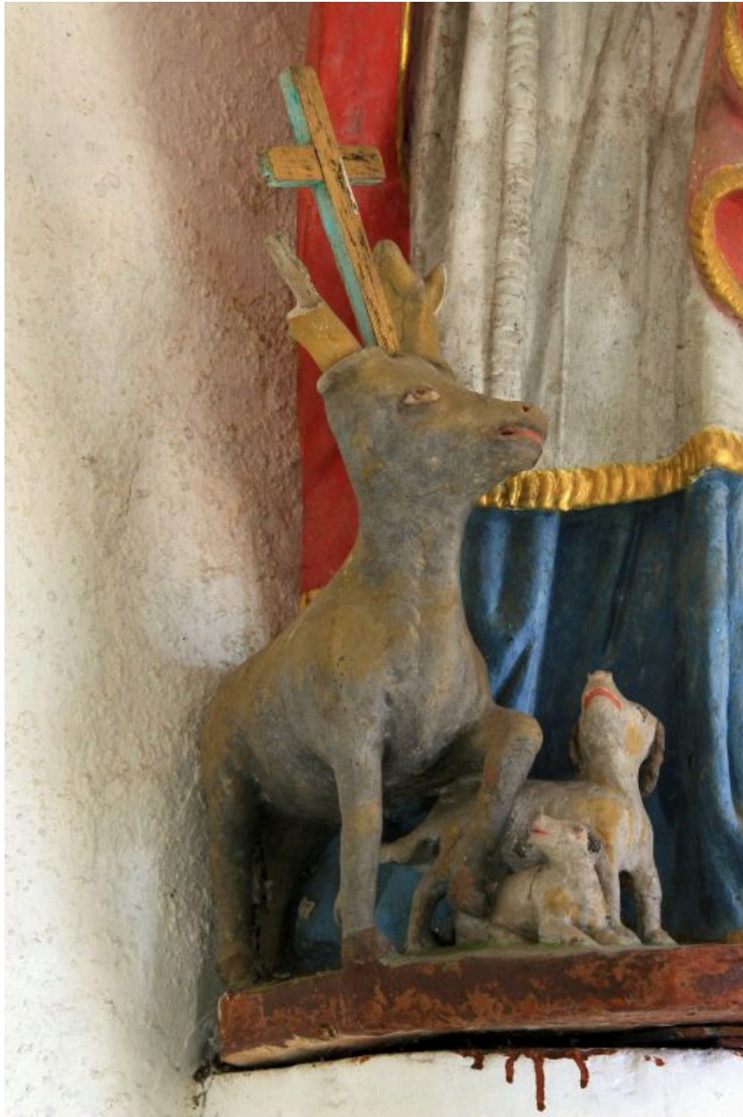
Statue de saint Hubert, détail.