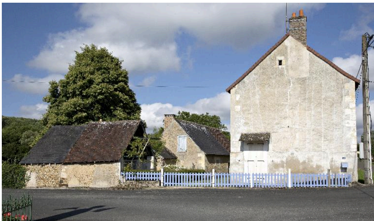
Vue de l'écart depuis la place de l'ancien grand cimetière.