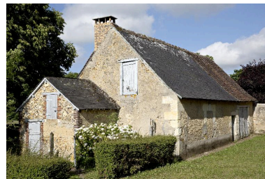
Vue de volume avec façade postérieure. IVR52_20147200445NUCA