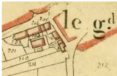
Extrait du plan cadastral de 1816, section B. IVR52_20147200920NUCA