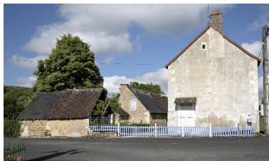
Vue de l'écart depuis la place de l'ancien grand cimetière. IVR52_20147200444NUCA