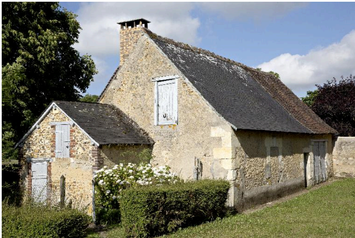
Vue de volume avec façade postérieure.