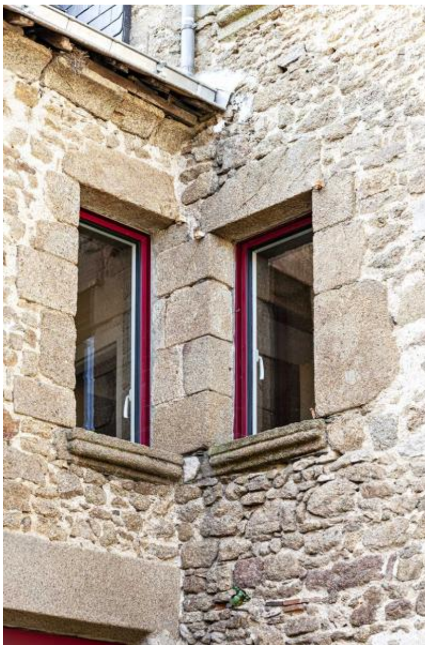
Angle formé par le corps de logis principal et la tour de logis, côté cour, détail.