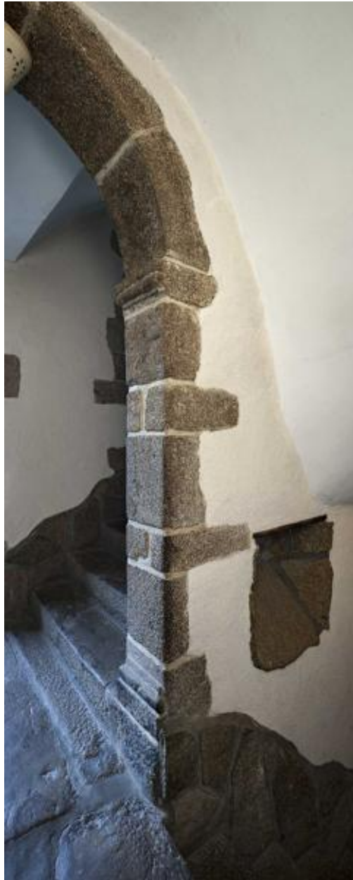
Départ de l'arcade prolongeant le mur-noyau de l'escalier rampe-sur-rampe.