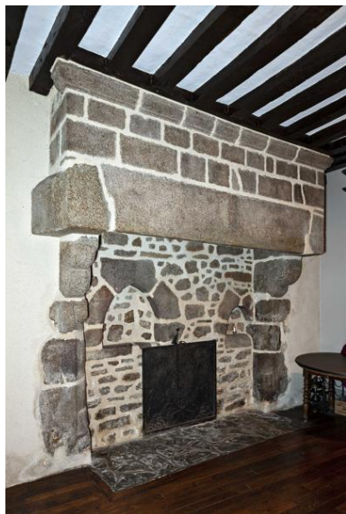
Cheminée, rez-de-chaussée, ancienne cuisine.