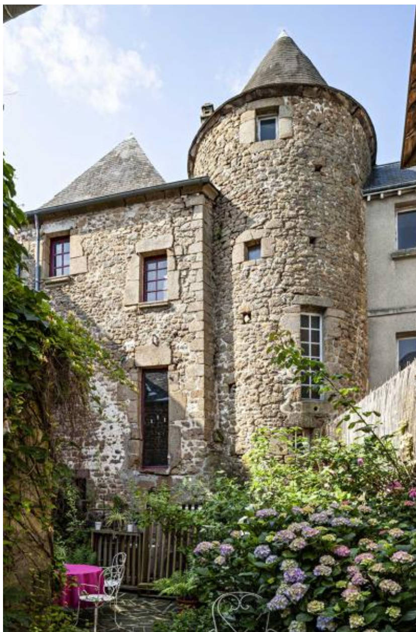
Tours d'escalier situées à l'arrière du 25 rue Dorée et du 7 Grande-Rue.