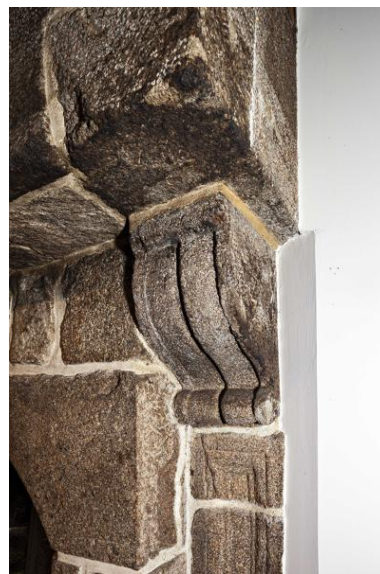
Corbeau orné d'une volute, détail de la cheminée de la pièce centrale du rez-de-chaussée. IVR52_20215301779NUCA