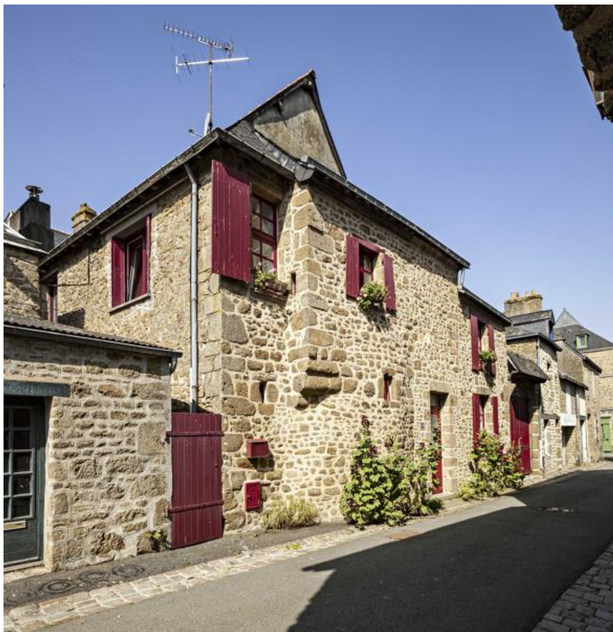
Façade rue Dorée.