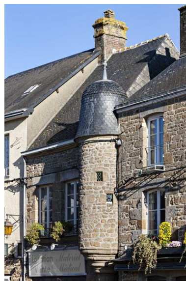
Echauguette en encorbellement au-dessus de la Grande-Rue.