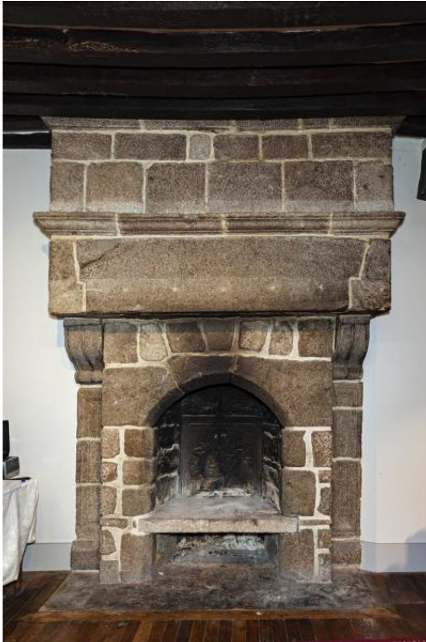
Cheminée, rez-de-chaussée, salle centrale.