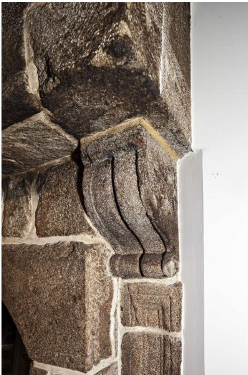
Corbeau orné d'une volute, détail de la cheminée de la pièce centrale du rez-de-chaussée.