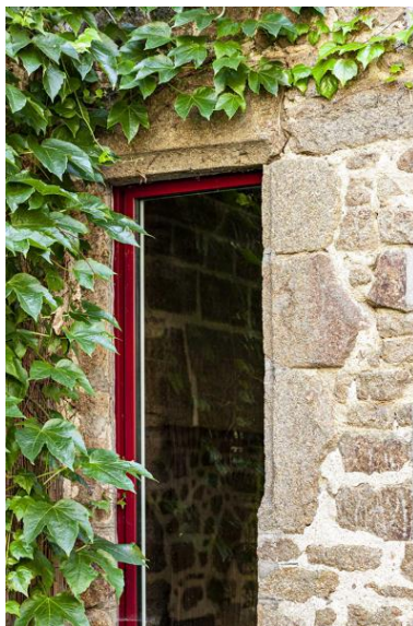
Baie chanfreinée, rez-de-chaussée corps de logis principal, façade sur cour, partie nord, vestige du XVI e siècle ?