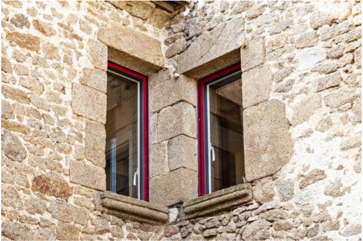
Angle formé par le corps de logis principal et la tour de logis, côté cour, détail.