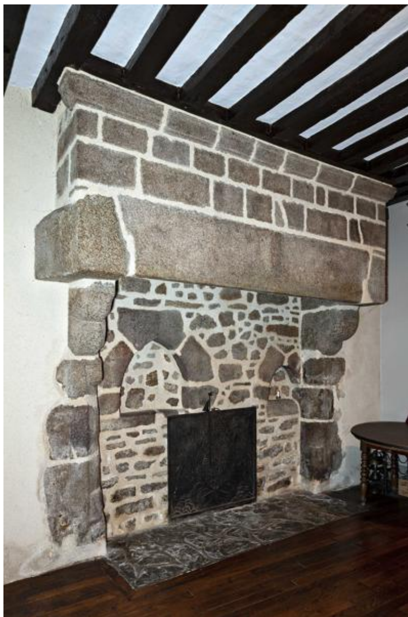
Cheminée, rez-de-chaussée, ancienne cuisine.