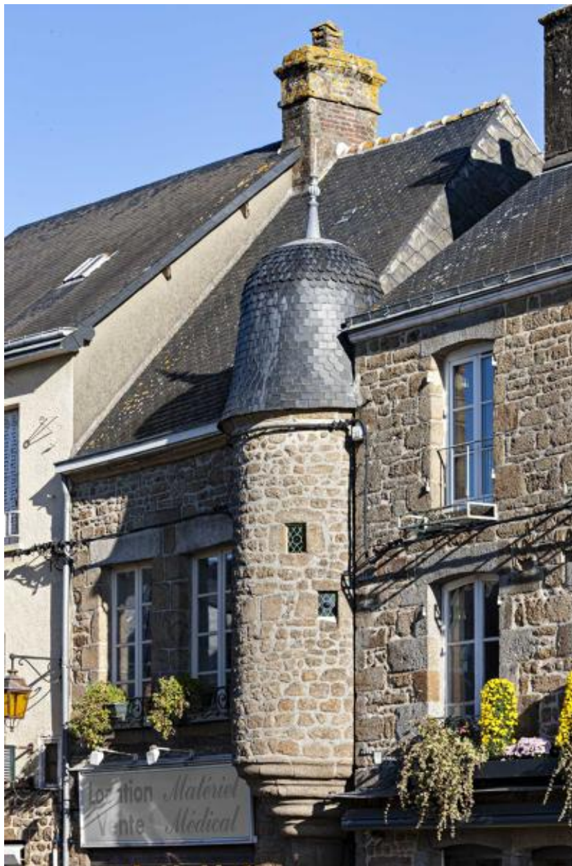
Echauguette en encorbellement au-dessus de la Grande-Rue.