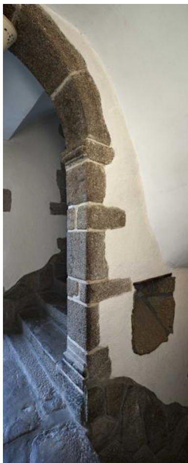
Départ de l'arcade prolongeant le mur-noyau de l'escalier rampe-sur-rampe.