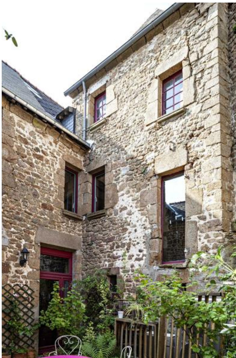
Angle formé par le corps de logis principal et la tour de logis, côté cour.