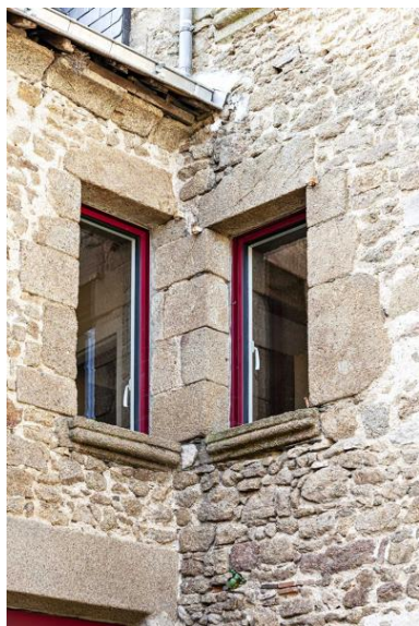
Angle formé par le corps de logis principal et la tour de logis, côté cour, détail. IVR52_20215300746NUCA