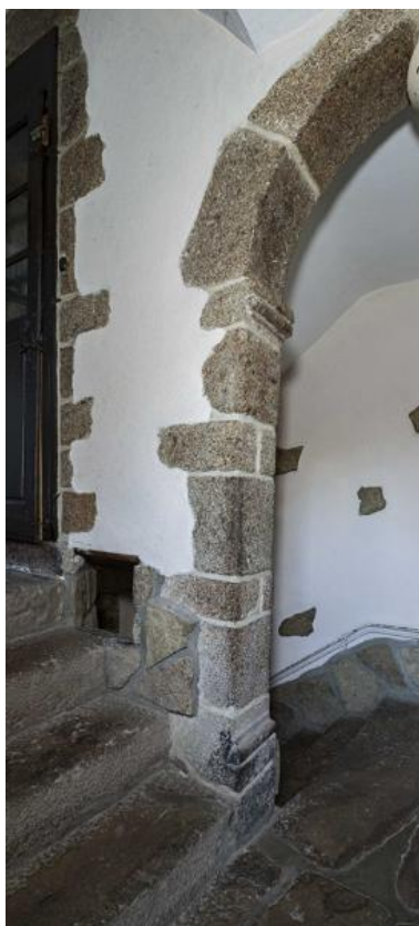
Départ de l'arcade prolongeant le mur-noyau de l'escalier rampe-sur-rampe. IVR52_20215301783NUCA