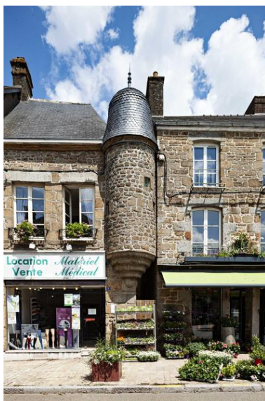
Façade côté Grande-Rue. IVR52_20215300781NUCA