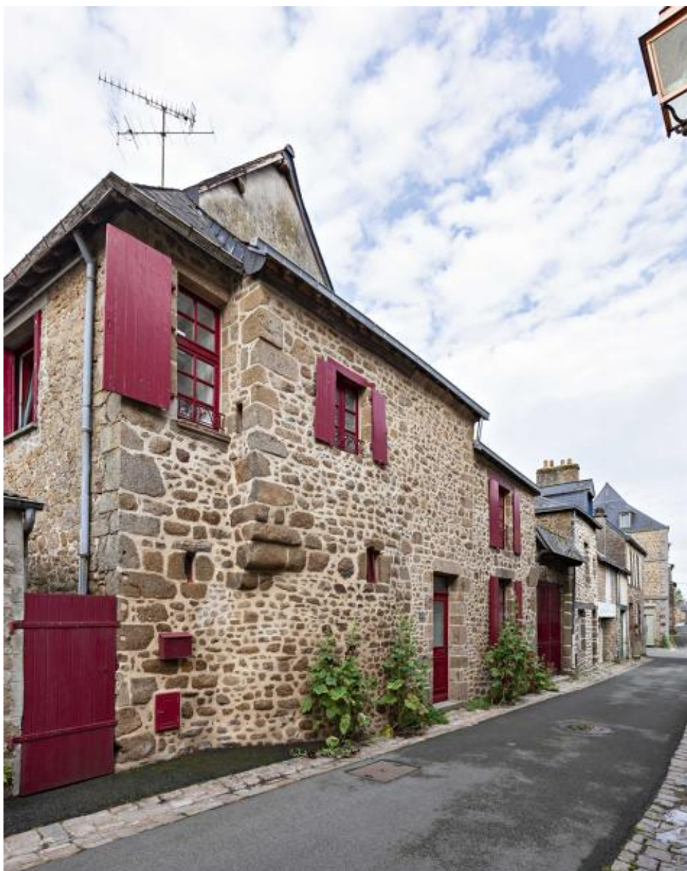
Façade rue Dorée.