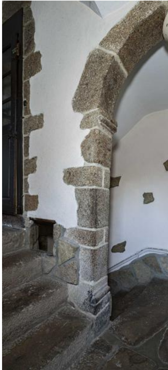
Départ de l'arcade prolongeant le mur-noyau de l'escalier rampe-sur-rampe.