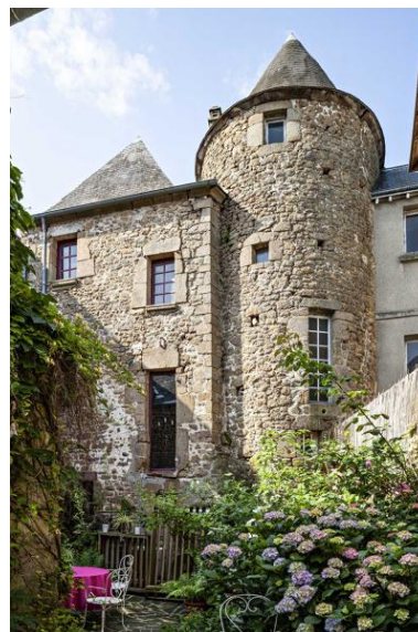
Tours d'escalier situées à l'arrière du 25 rue Dorée et du 7 Grande-Rue. IVR52_20215300744NUCA