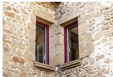
Angle formé par le corps de logis principal et la tour de logis, côté cour, détail.