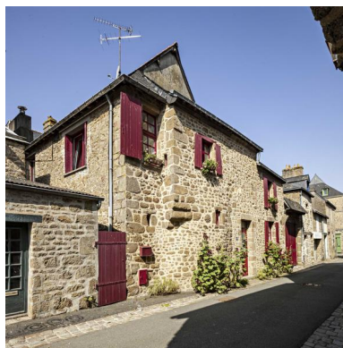
Façade rue Dorée. IVR52_20215300749NUCA