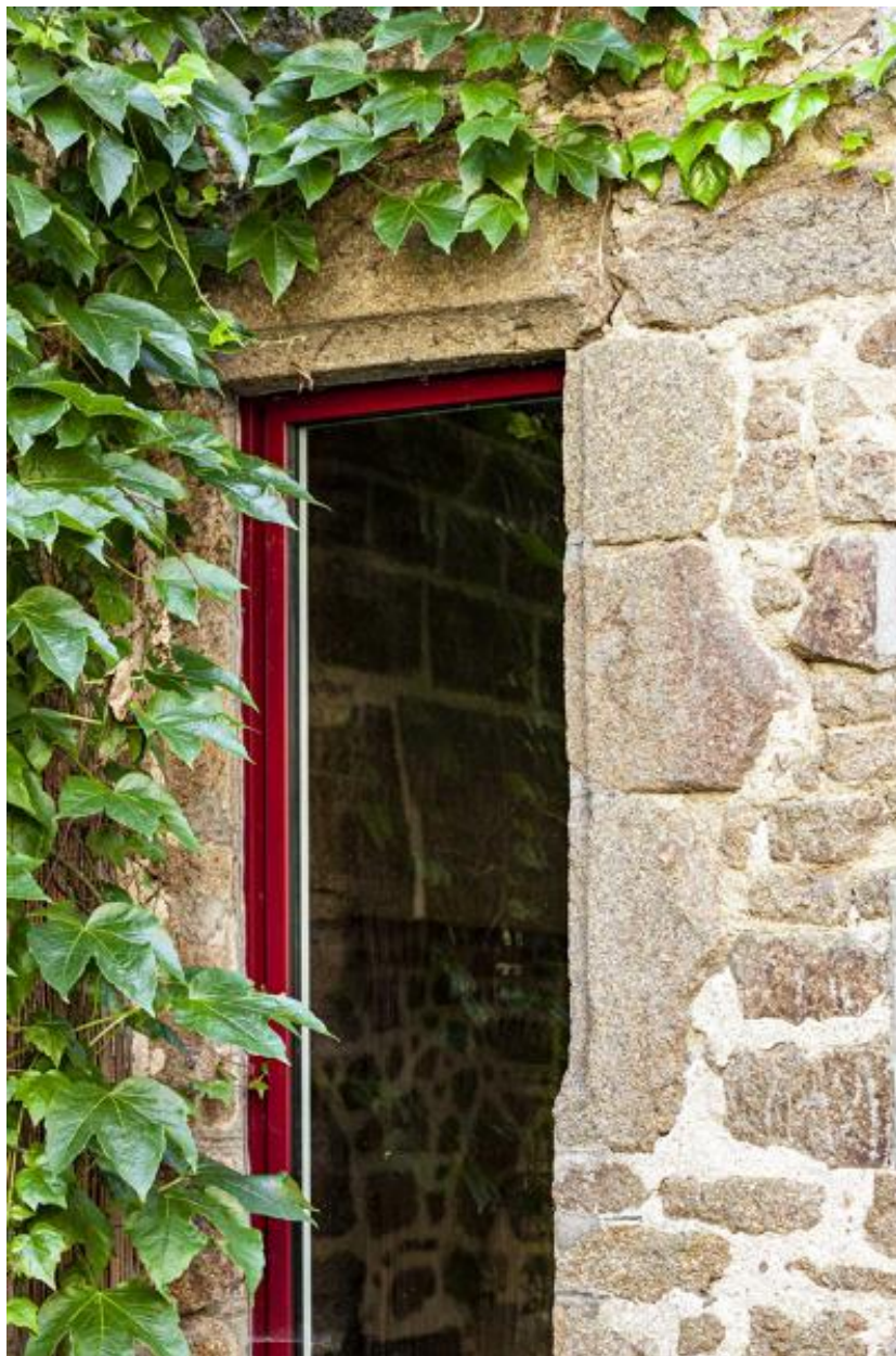
Baie chanfreinée, rez-de-chaussée corps de logis principal, façade sur cour, partie nord, vestige du XVIe siècle ?