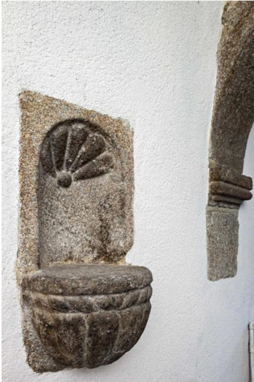
Niche ornant le mur occidental de la tour d'escalier.