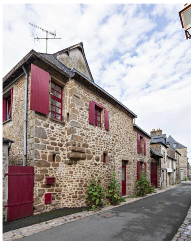
Façade rue Dorée.