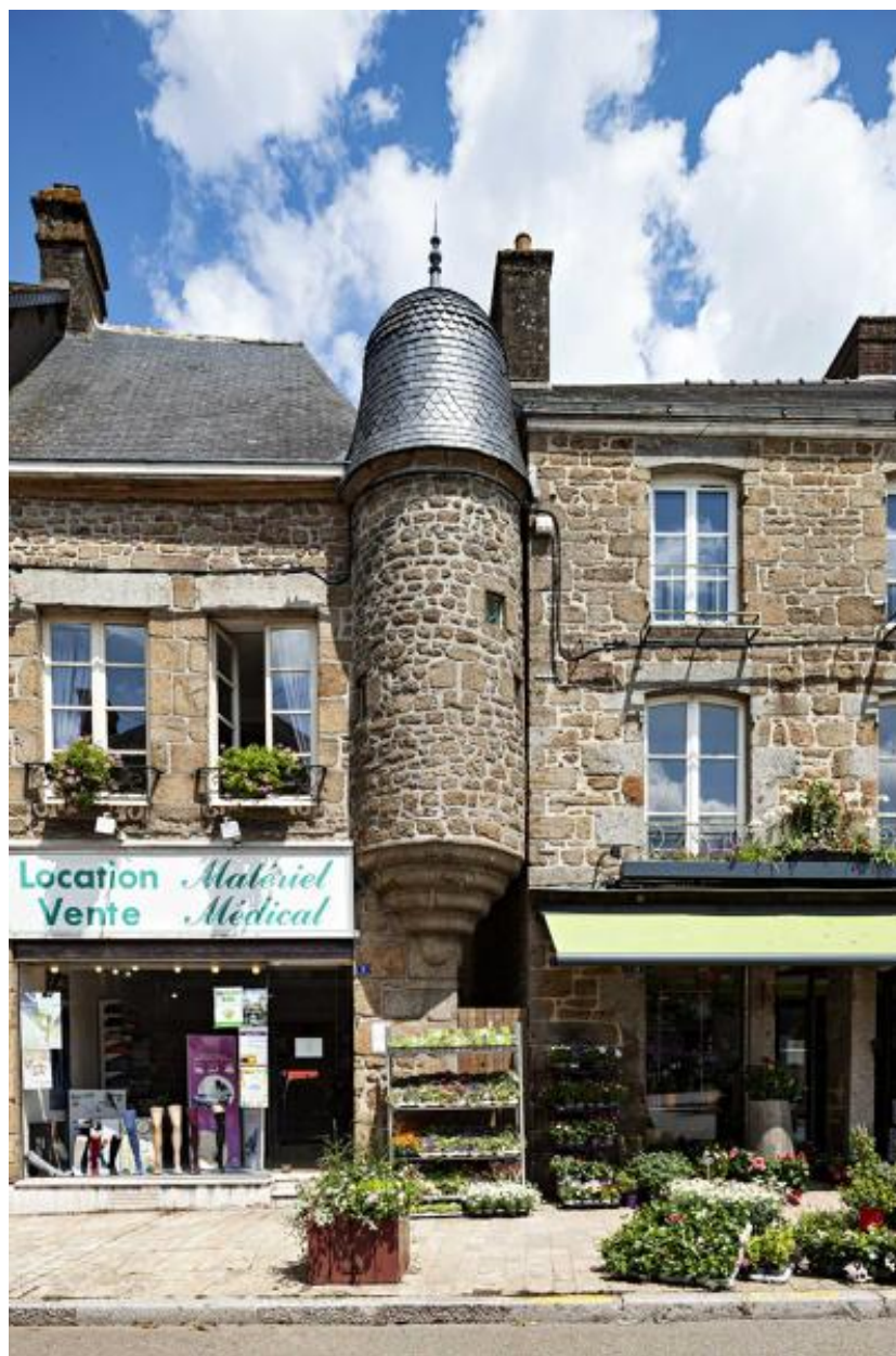
Façade côté Grande-Rue.