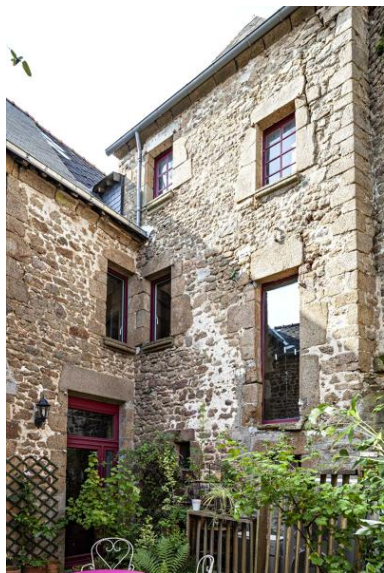
Angle formé par le corps de logis principal et la tour de logis, côté cour. IVR52_20215300745NUCA