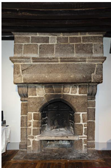
Cheminée, rez-de-chaussée, salle centrale. IVR52_20215301778NUCA