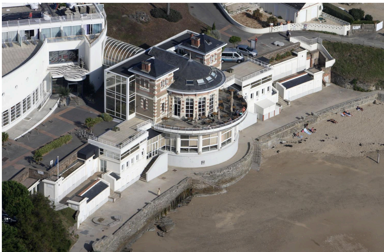
Casino-centre de thalassothérapie de Gourmalon, Pornic.