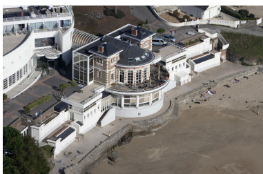
Casino-centre de thalassothérapie de Gourmalon, Pornic.