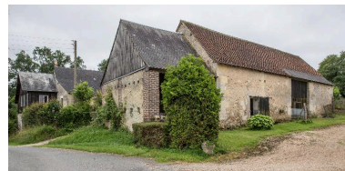
Grange-étable et hangar, de volume avec élévation sur cour.