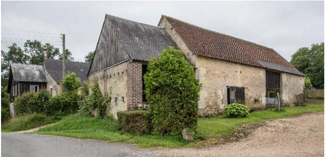
Grange-étable et hangar, de volume avec élévation sur cour.