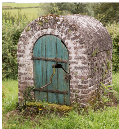
Puits. IVR52_20187200868NUCA