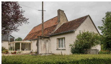
Maison ancienne et extension, de volume avec élévation sur cour.