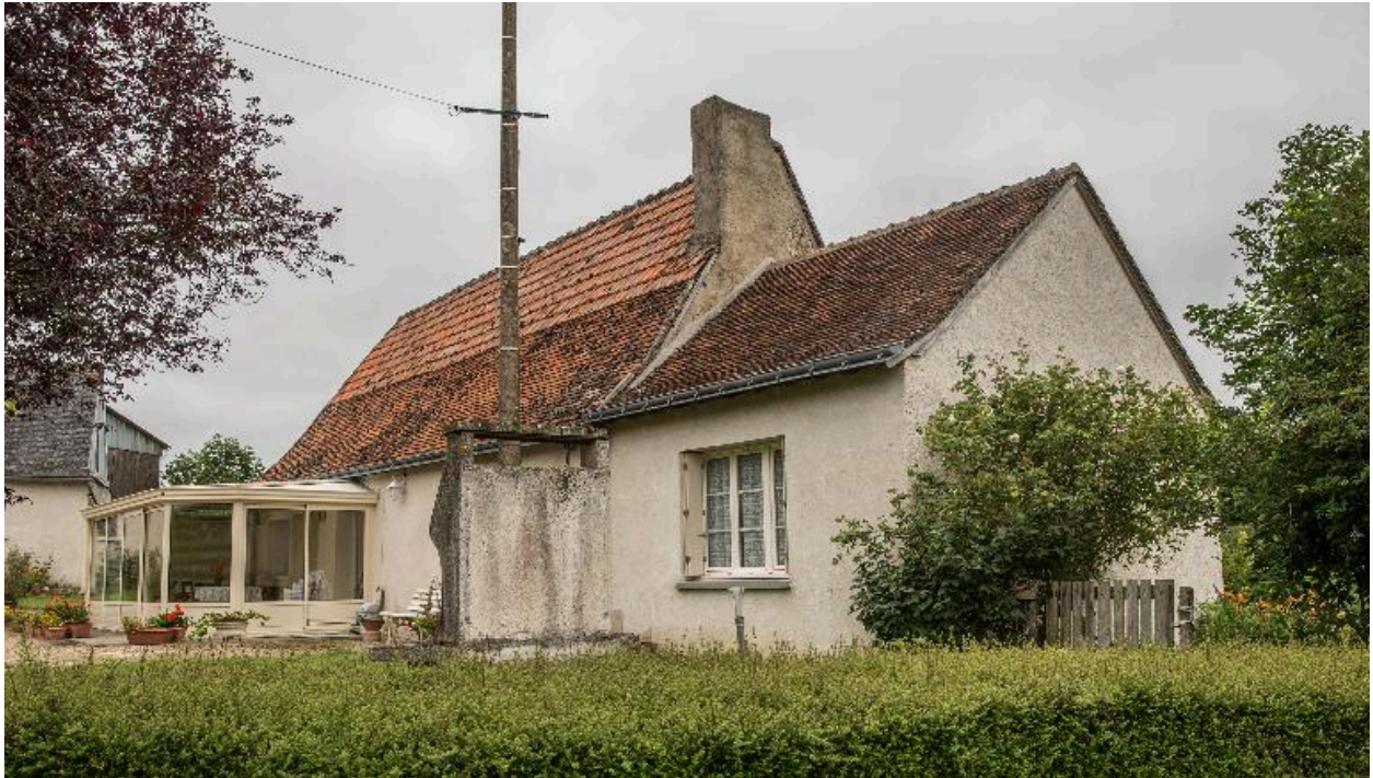
Maison ancienne et extension, de volume avec élévation sur cour.