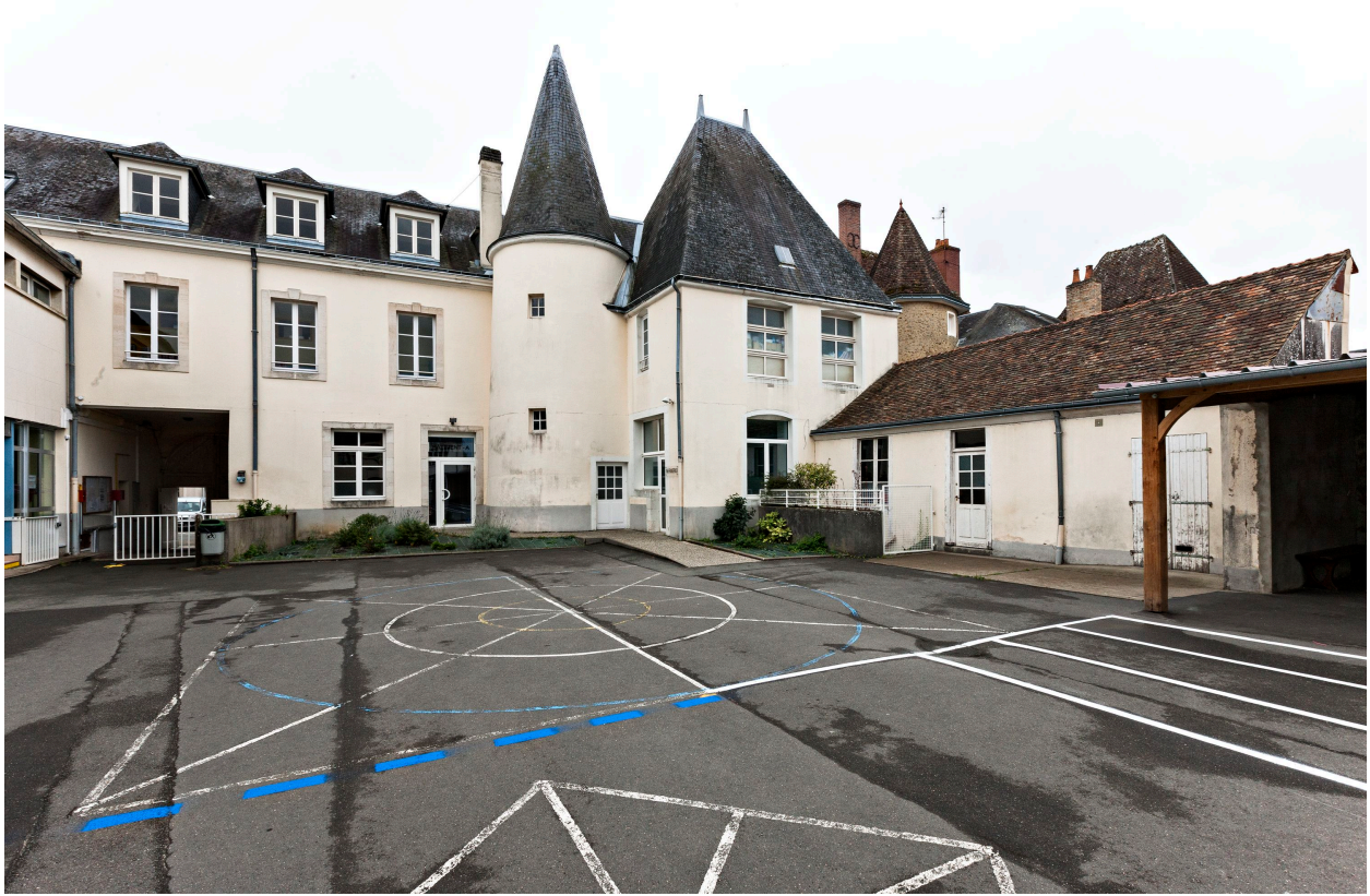
Elevations postérieures de l'ancienne maison.