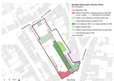
Plan chronologique IVR52_20167200044NUDA