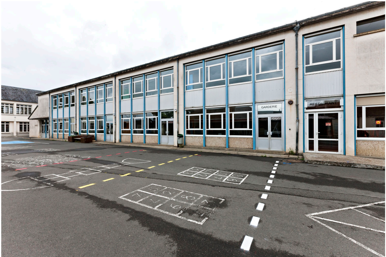
Bâtiment de l'ancien Collège d'Enseignement Général édifié en 1963.