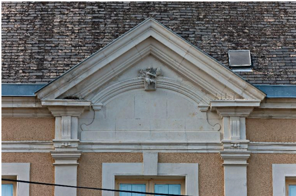
Détail du fronton de l'étage du n° 18, remanié en 1893-1894.