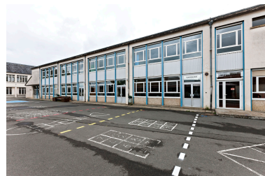
Bâtiment de l'ancien Collège d'Enseignement Général édifié en 1963.

IVR52_20177200760NUCA