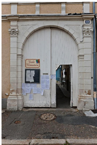
Détail du portail du XVIIIe siècle. IVR52_20147201937NUCA