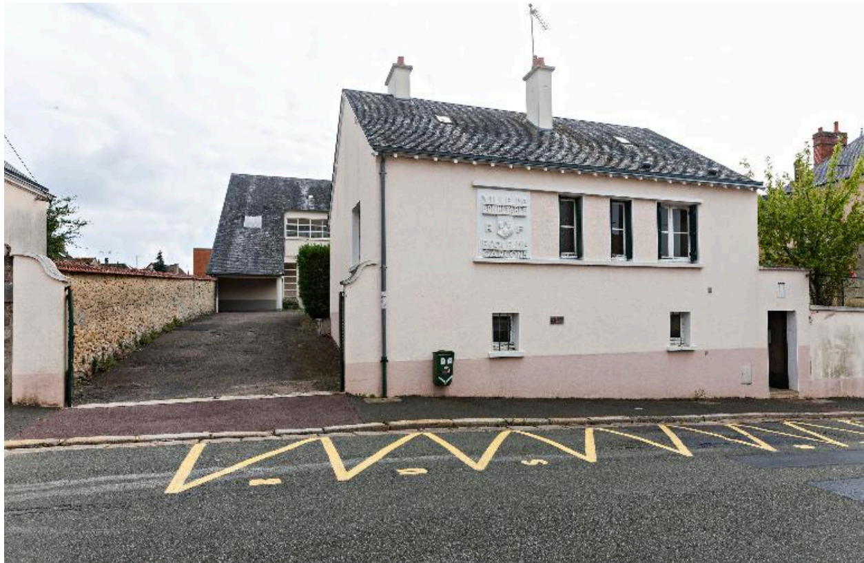
Logement de l'ancien groupe scolaire de garçons construit en 1953, vu depuis la rue Brombacher. Le bâtiment des classes est à l'arrière.