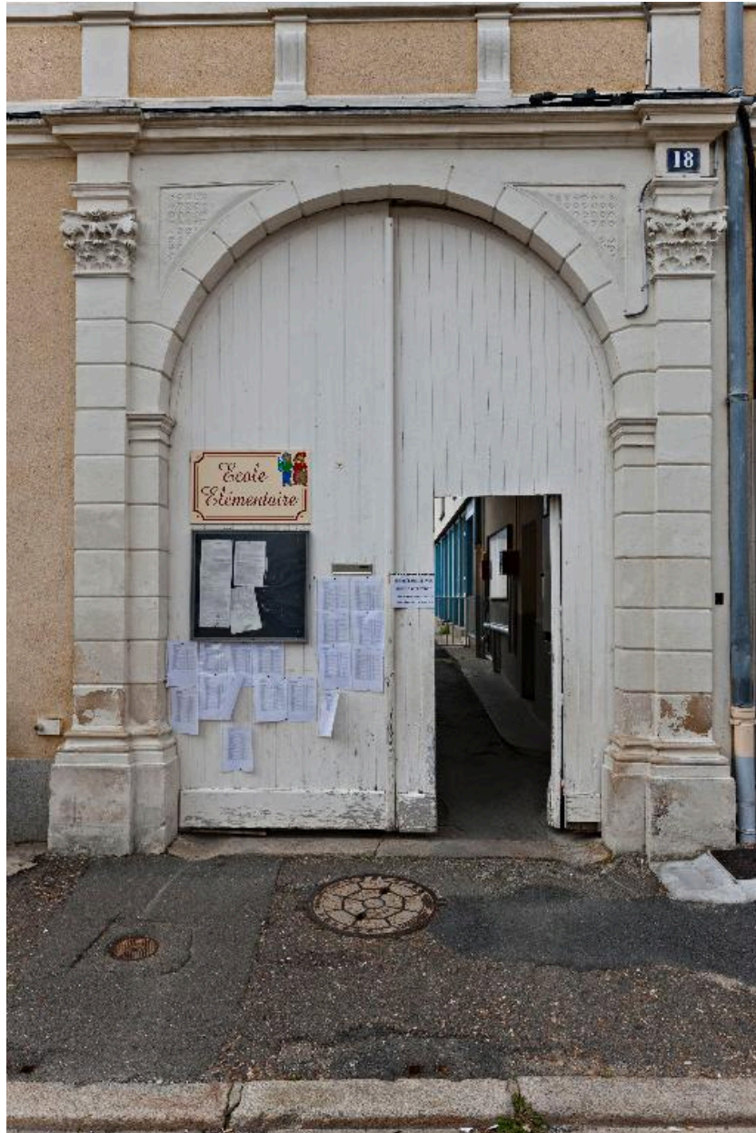
Détail du portail du XVIIIe siècle.