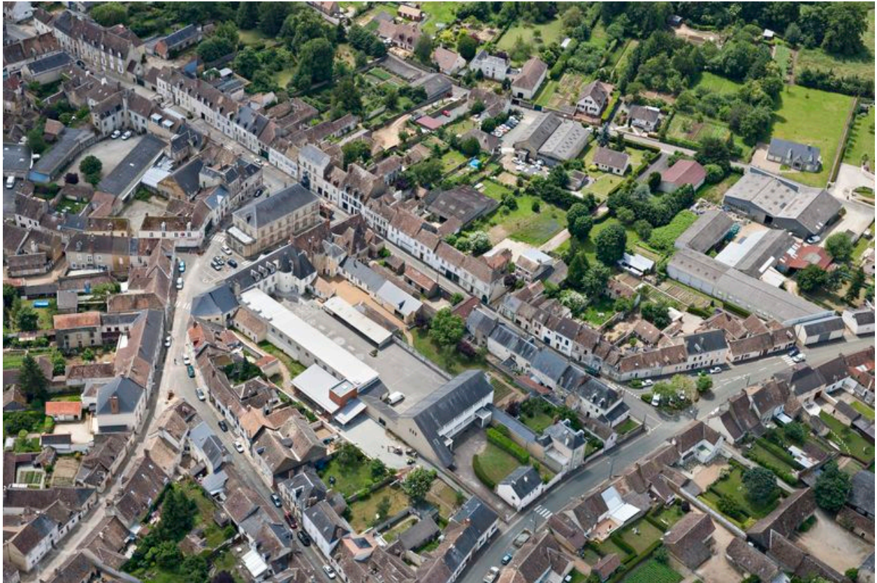
Vue aérienne depuis l'est.