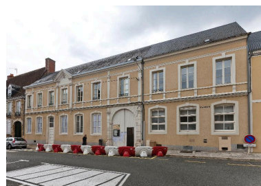
Élévation sur la Place d'Armes. La partie gauche incluant la porte cochère correspond à la maison n° 18 construite dans la 2e moitié du XVIIe s. et remaniée en 1893-1894, les trois travées de la partie droite à la maison n° 20 remanié vers 1963.