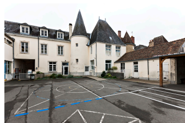
Elevations postérieures de l'ancienne maison.