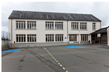
Bâtiment de classes du groupe scolaire de garçons édifié en 1953.

IVR52_20147202082NUCA