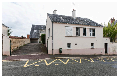
Logement de l'ancien groupe scolaire de garçons construit en 1953, vu depuis la rue Brombacher. Le bâtiment des classes est à l'arrière.

IVR52_20147202082NUCA