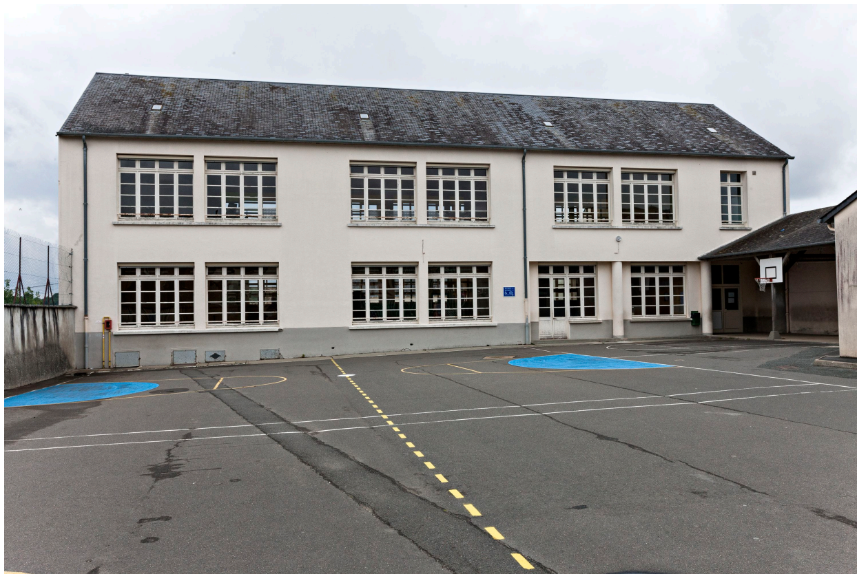
Bâtiment de classes du groupe scolaire de garçons édifié en 1953.