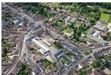
Vue aérienne depuis l'est.