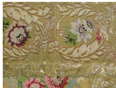
Détail des deux tissus. IVR52_20064401712NUCA