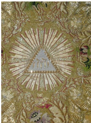
Motif à la croisée de l'orfroi.