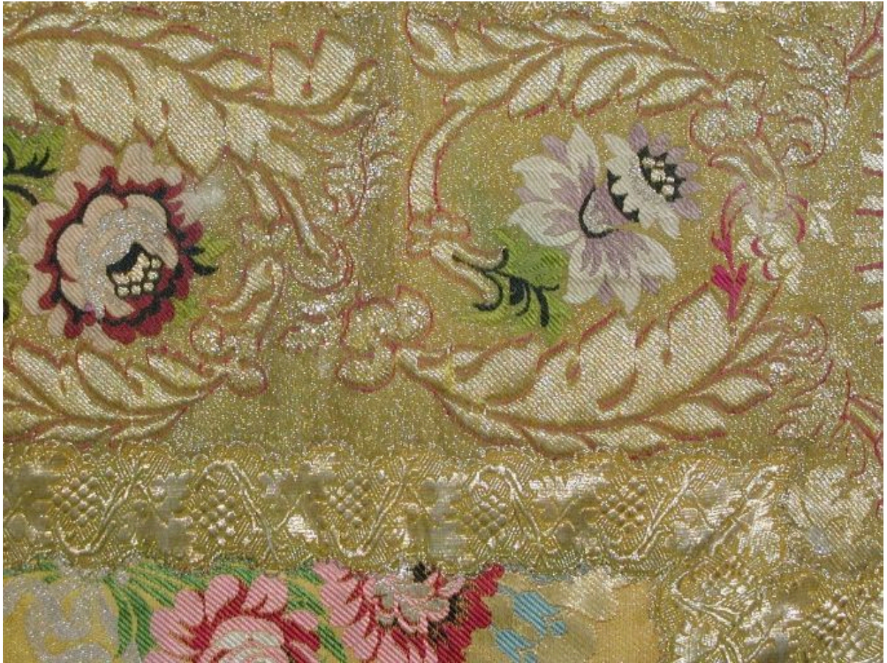
Détail des deux tissus.