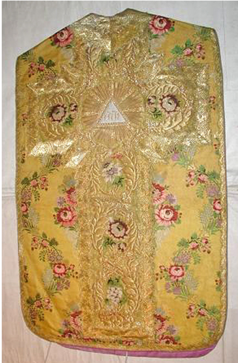
Vue générale, dos de la chasuble.