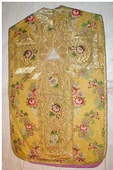
Vue générale, dos de la chasuble.