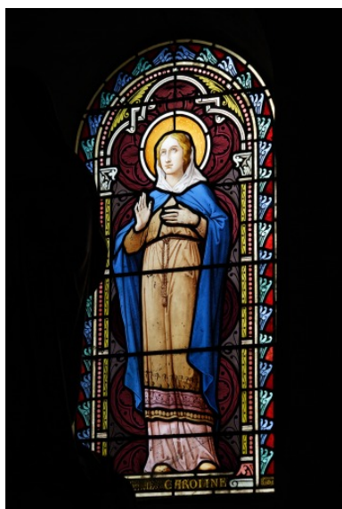
Verrière 5 : sainte Caroline