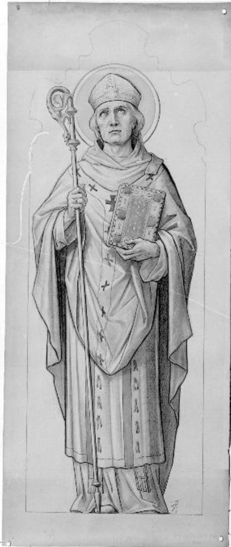
Carton de la verrière 6 : saint René.