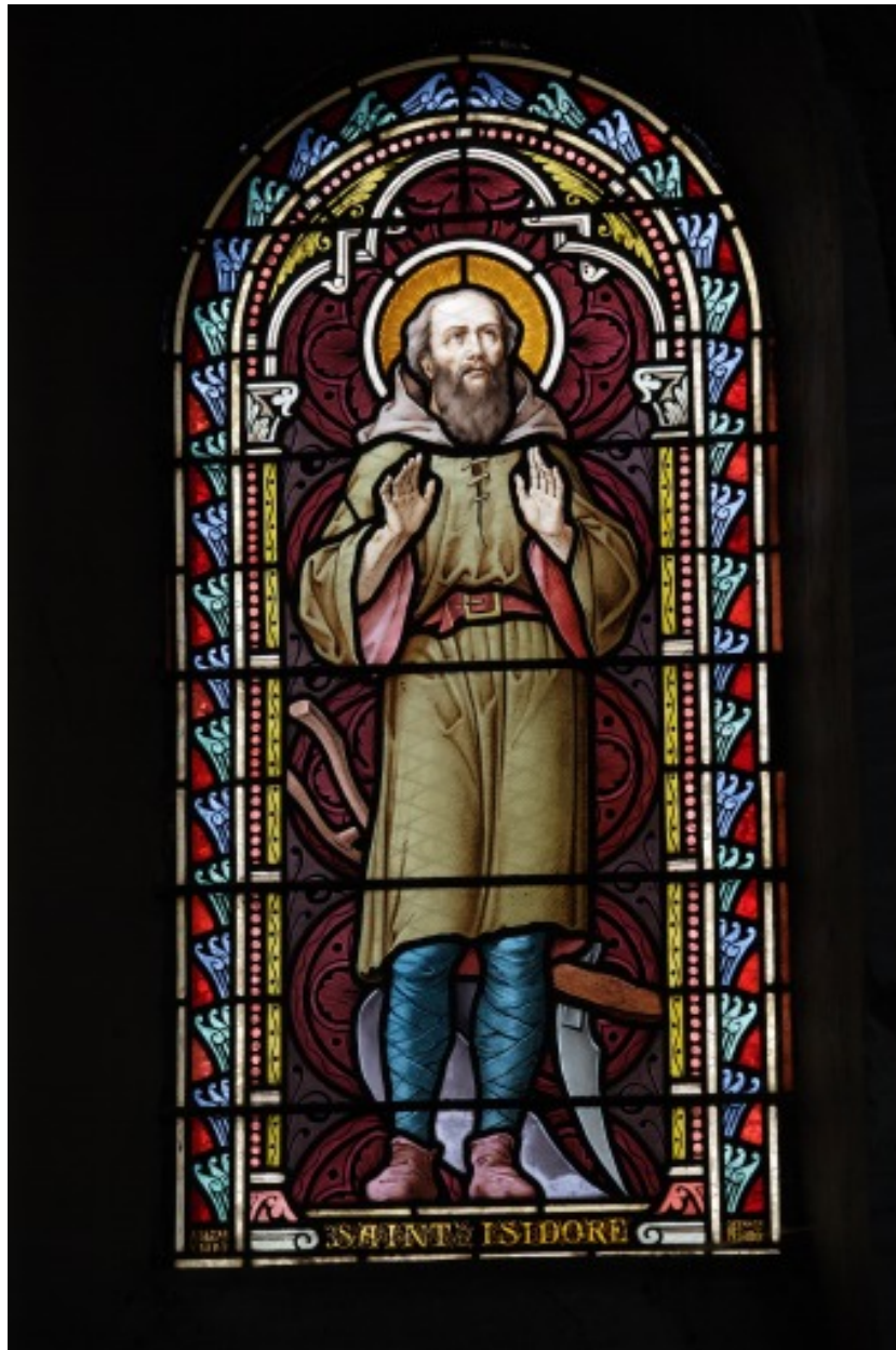
Verrière 8 : saint Isidore.