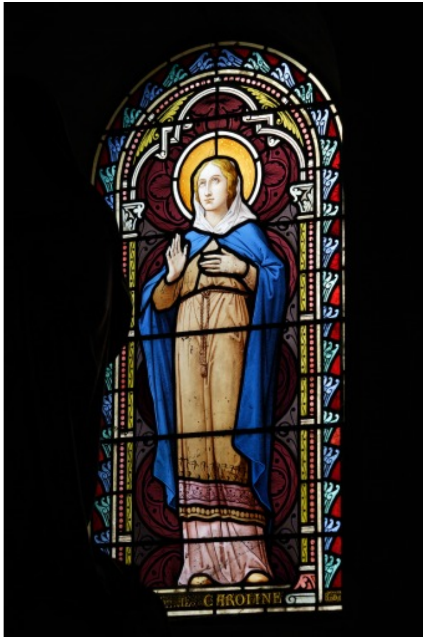
Verrière 5 : sainte Caroline