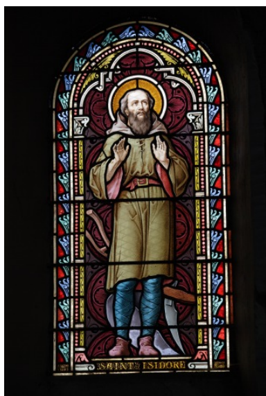
Verrière 8 : saint Isidore.