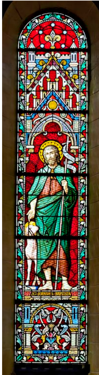
Verrière 0 : saint Jean-Baptiste.