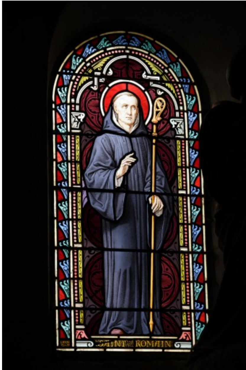
Verrière 7 : saint Romain.