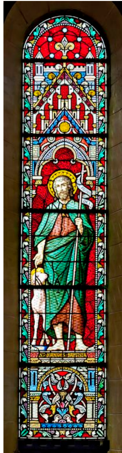
Verrière 0 : saint Jean-Baptiste.