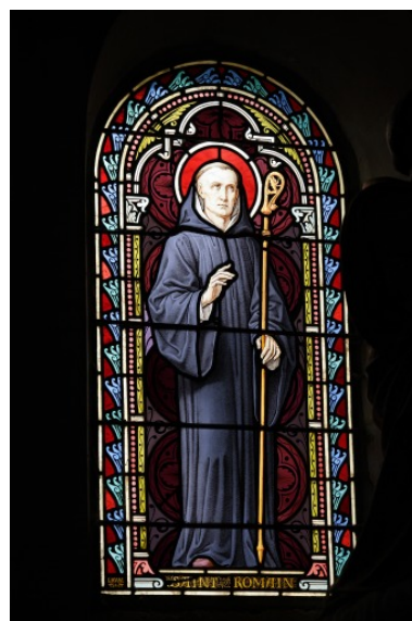
Verrière 7 : saint Romain.