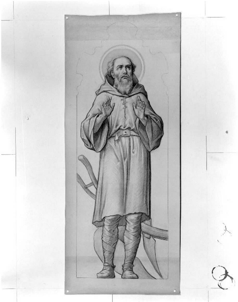
Carton de la verrière 8 : saint Isidore.