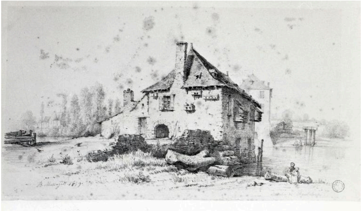
Le moulin d'Avesnières vu depuis l'ouest, en 1859.