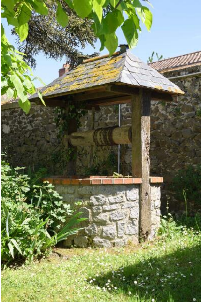
Vue du puits.