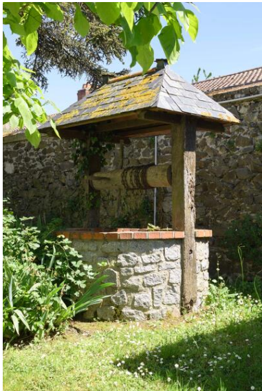
Vue du puits.