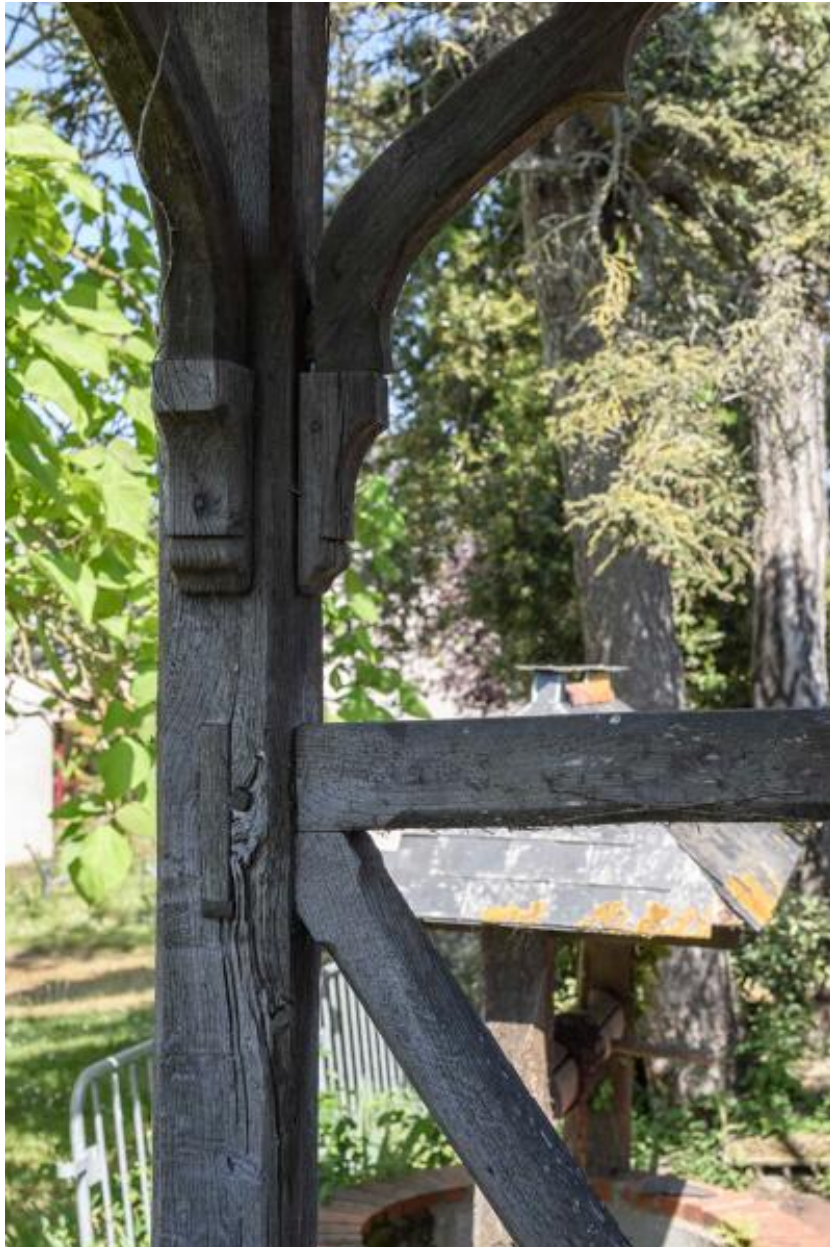
Pavillon de jardin. Détail du poteau cornier et de la balustrade.