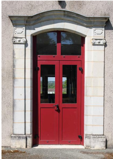
Façade sud. Détail de la porte d'entrée. IVR52_20254900730NUCA