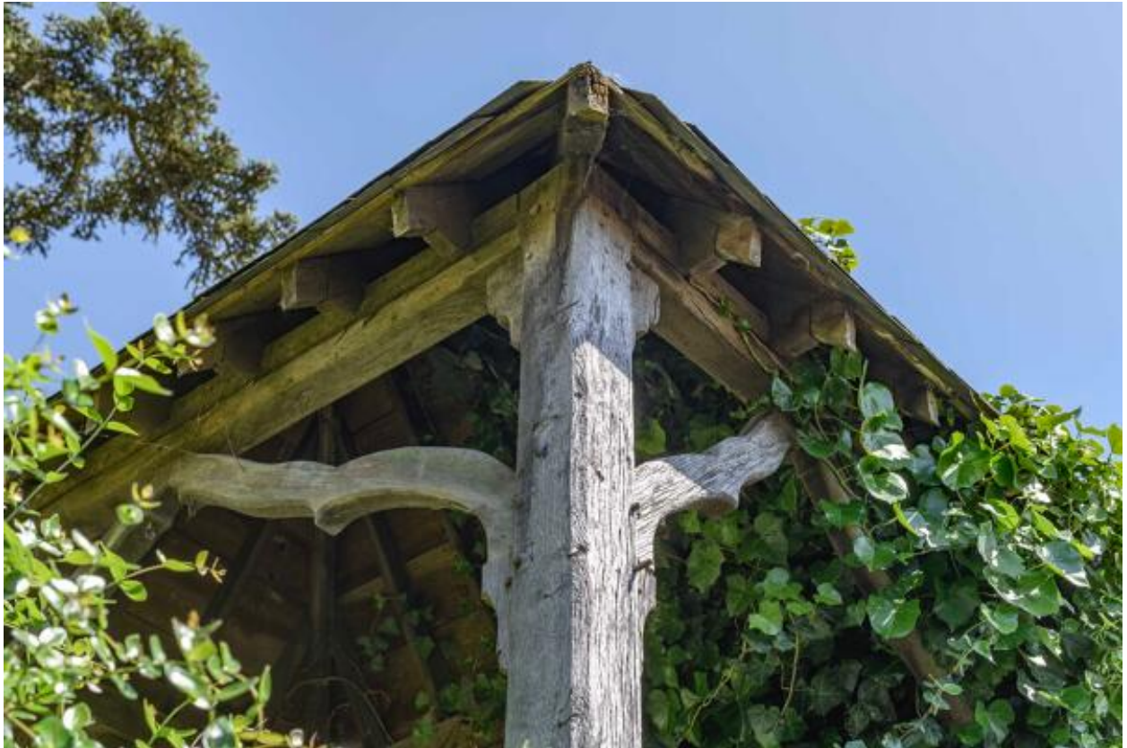
Pavillon de jardin. Détail du poteau cornier.