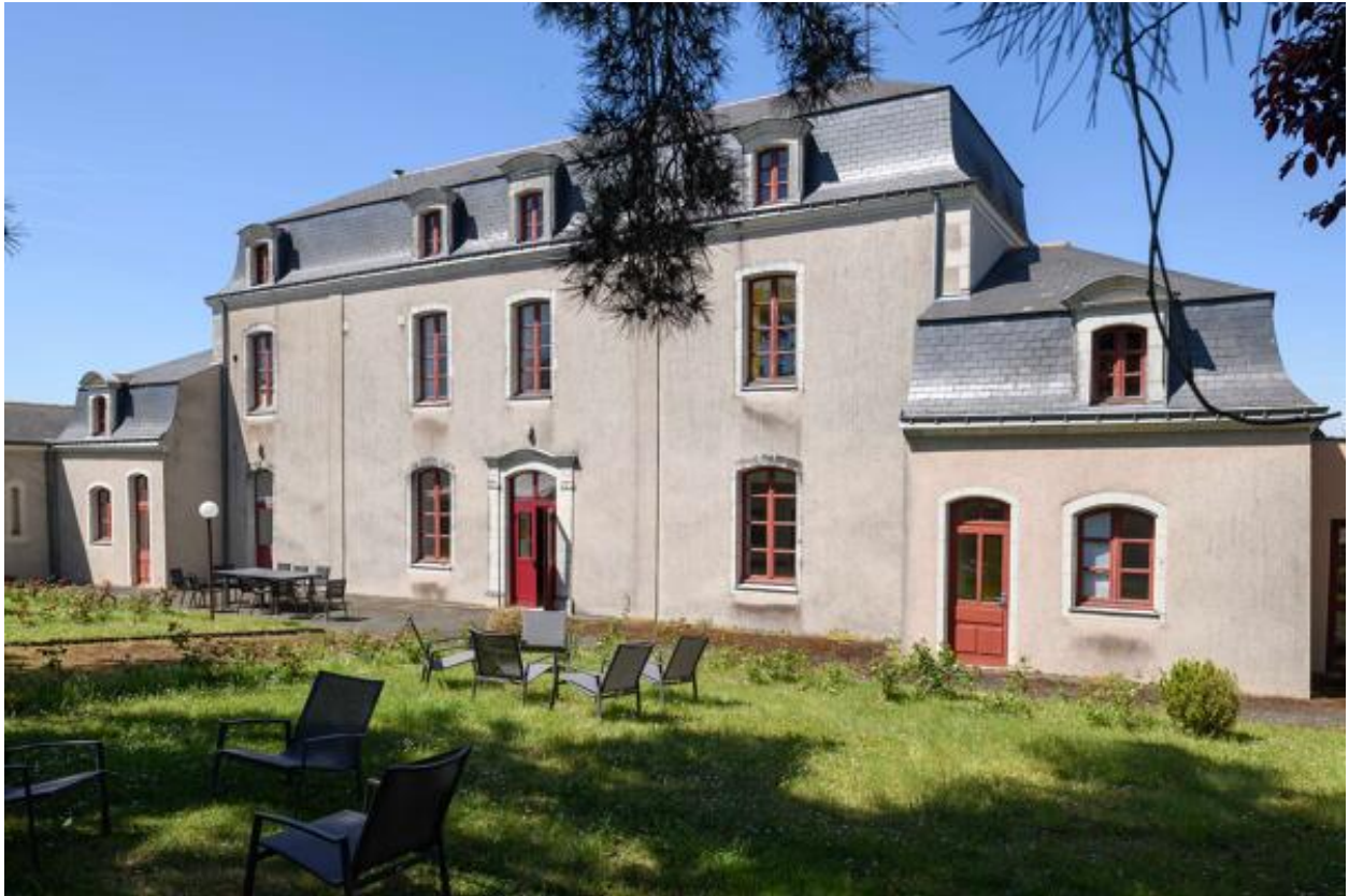
Vue de la façade sud.