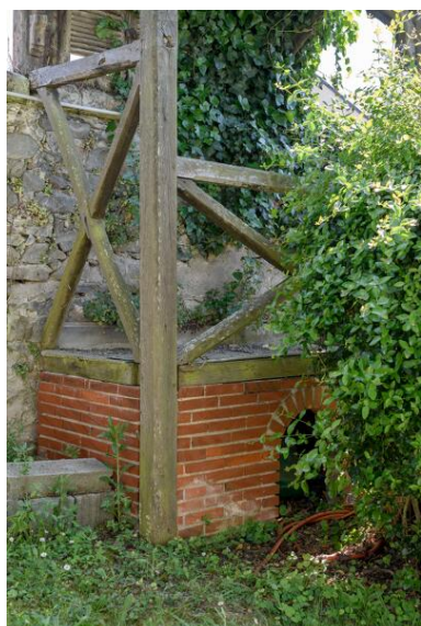
Pavillon de jardin. Détail de la niche. IVR52_20254900733NUCA