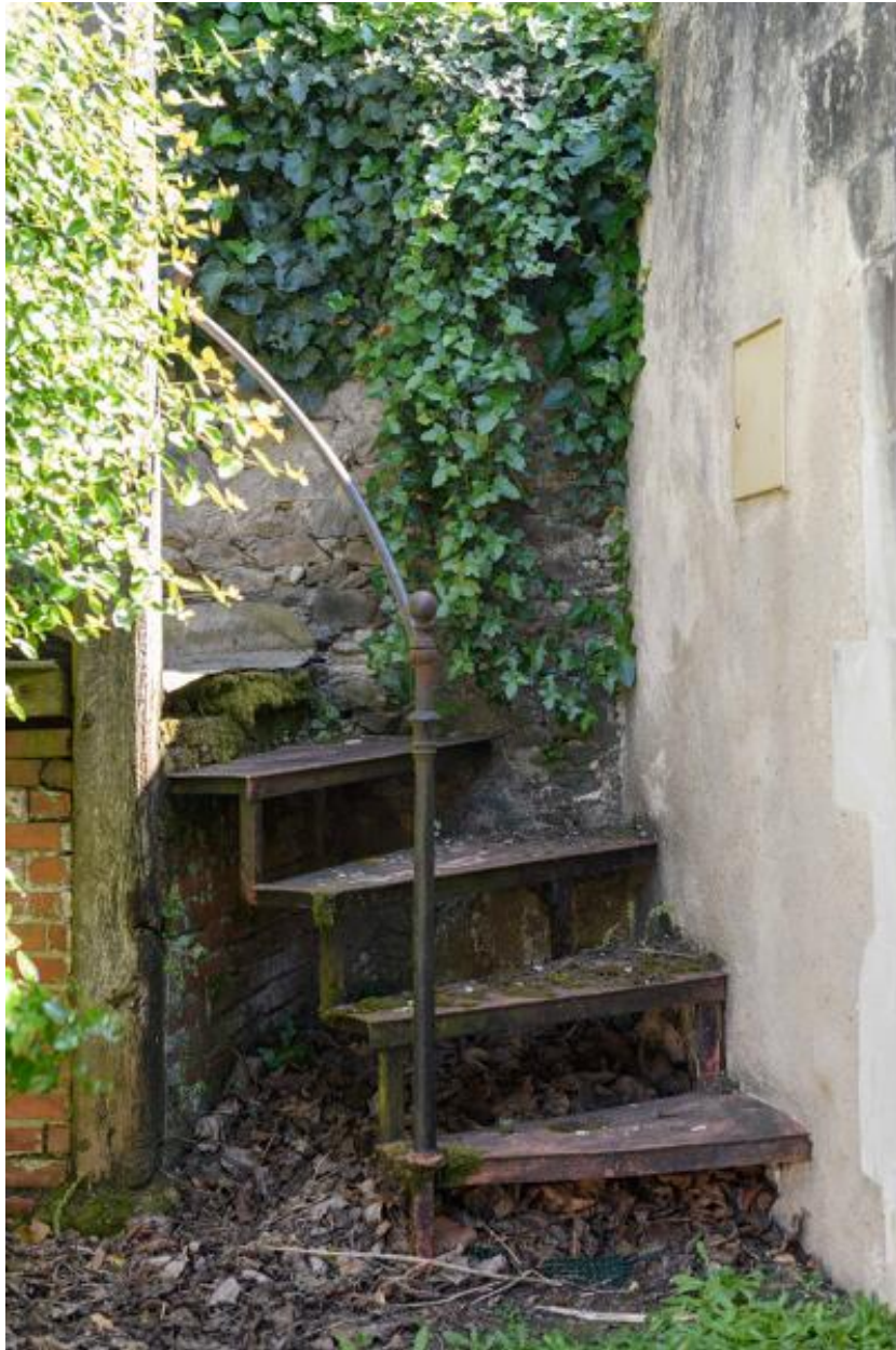
Pavillon de jardin. Détail de l'escalier.