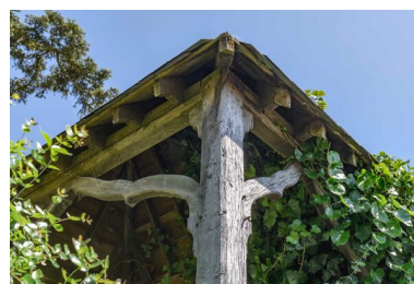
Pavillon de jardin. Détail du poteau cornier. IVR52_20254900737NUCA