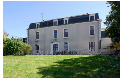
Vue de la façade nord. IVR52_20254900738NUCA