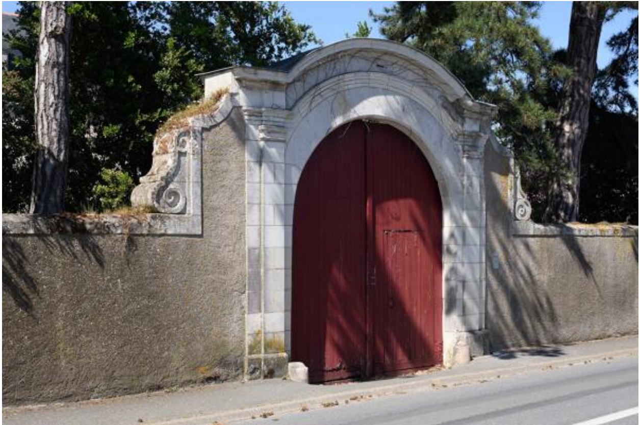
Vue du portail d'entrée depuis la rue.