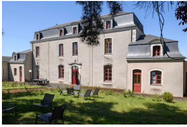
Vue de la façade sud.