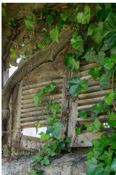
Pavillon de jardin. Détail des volets en bois. IVR52_20254900735NUCA