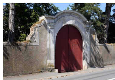
Vue du portail d'entrée depuis la rue.