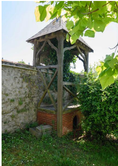
Pavillon de jardin. Vue d'ensemble.