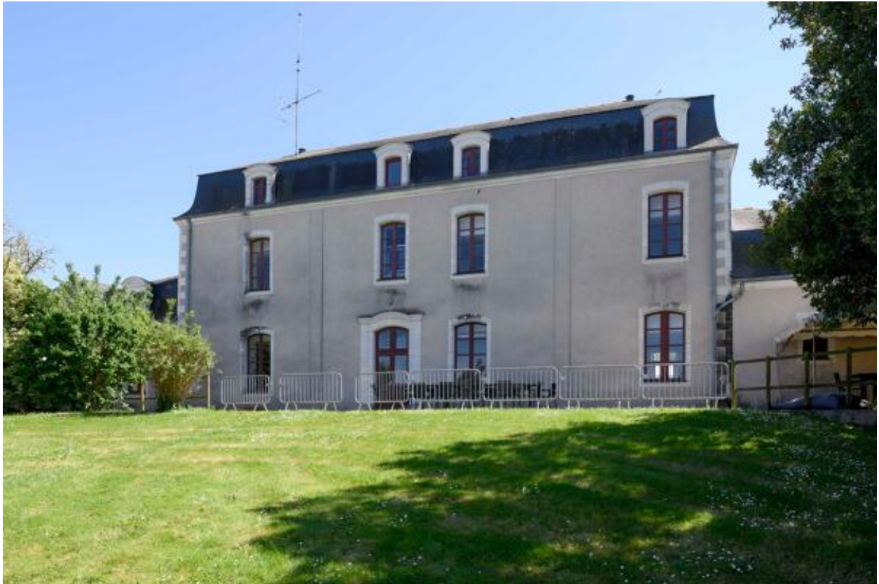
Vue de la façade nord.