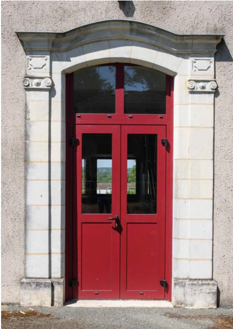
Façade sud. Détail de la porte d'entrée.