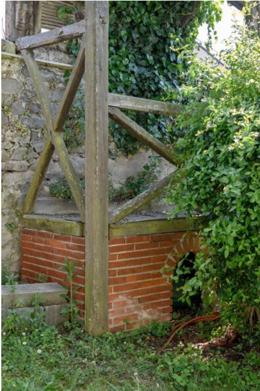
Pavillon de jardin. Détail de la niche.