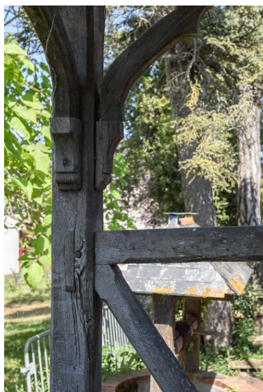
Pavillon de jardin. Détail du poteau cornier et de la balustrade. IVR52_20254900736NUCA