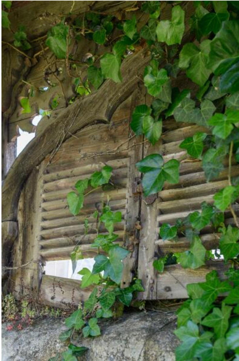
Pavillon de jardin. Détail des volets en bois.