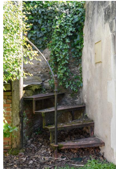
Pavillon de jardin. Détail de l'escalier. IVR52_20254900732NUCA