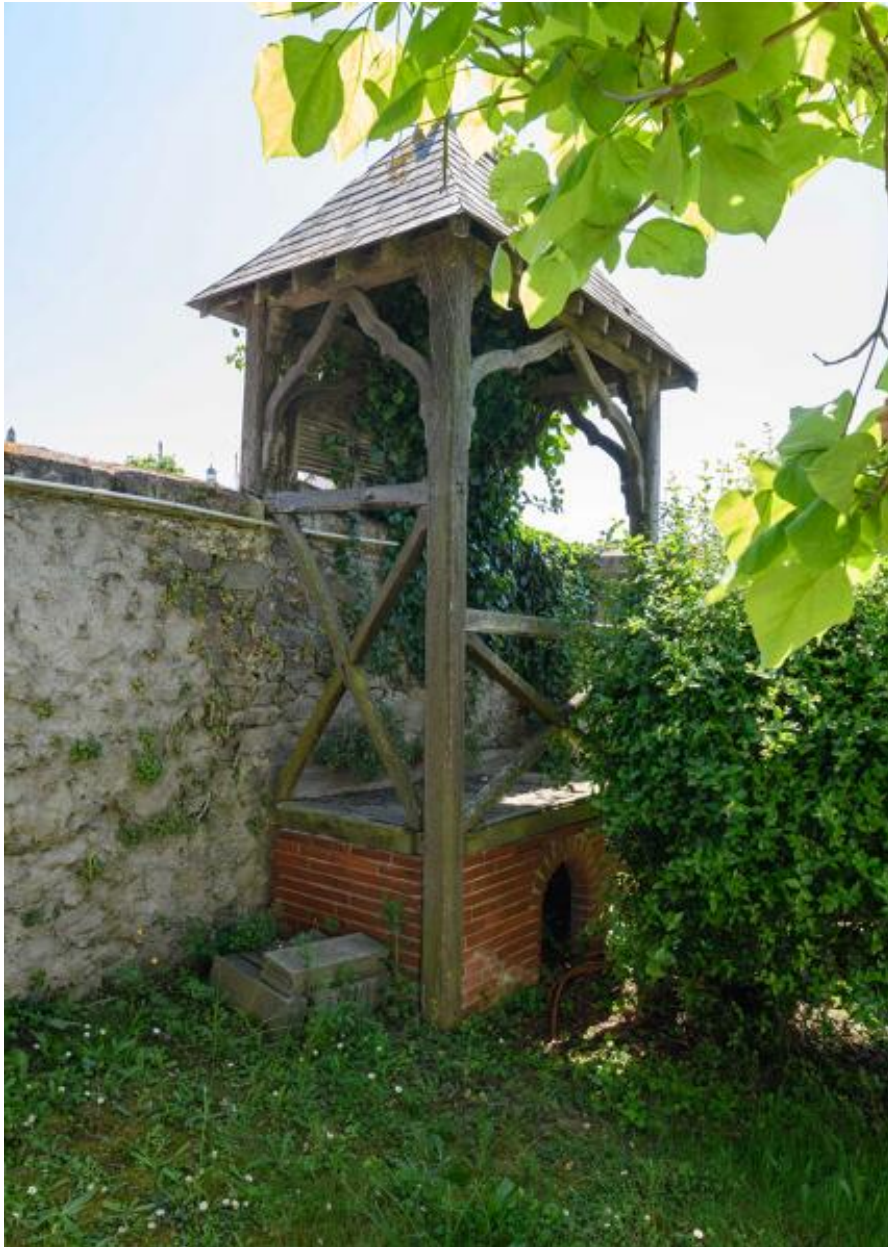
Pavillon de jardin. Vue d'ensemble.