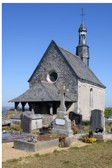
Vue de la chapelle depuis le sud-est.