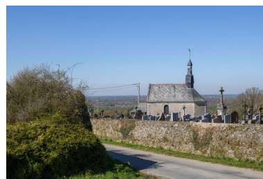
Vue d'ensemble du cimetière et de la chapelle depuis l'est. IVR52_20254900293NUCA