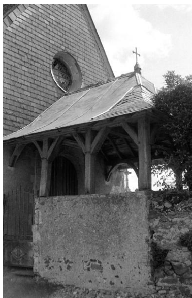
La chapelle funéraire de la famille Chauveau. Détail de l'avant-porche en 1972.