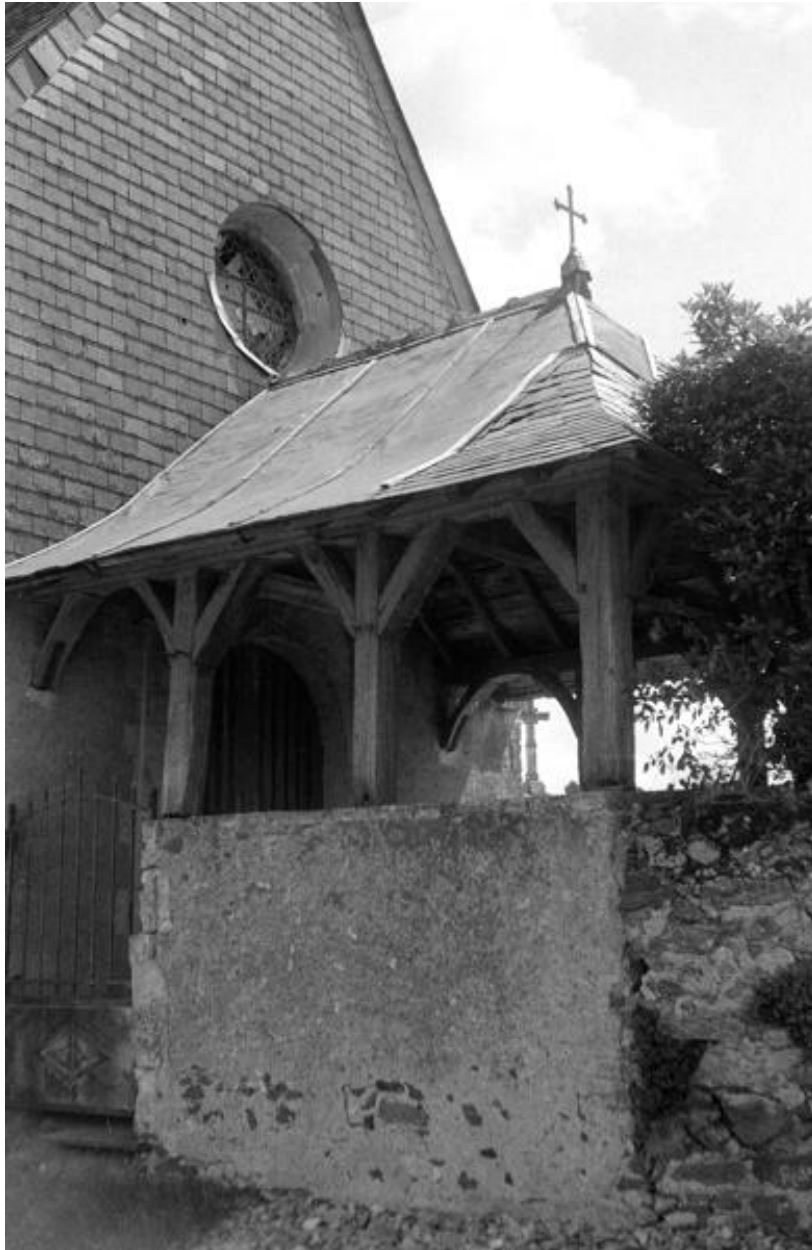
La chapelle funéraire de la famille Chauveau. Détail de l'avant-porche en 1972.