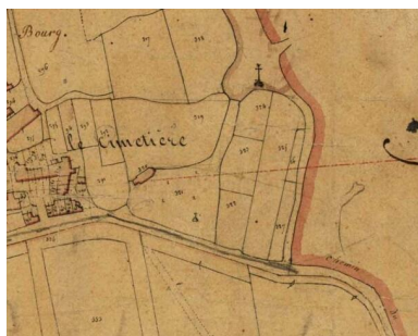
La chapelle funéraire de la famille Chauveau et le cimetière. Extrait du plan cadastral de 1827, section C (unique du bourg), parcelles n° 320 et 321. IVR52_20254900268NUCA