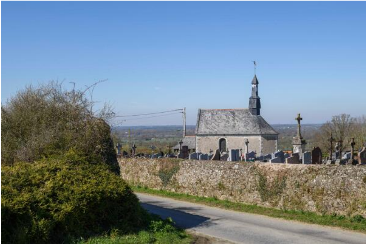
Vue d'ensemble du cimetière et de la chapelle depuis l'est.