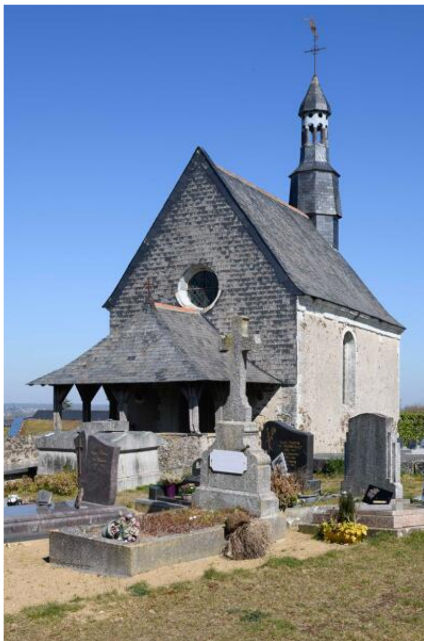
Vue de la chapelle depuis le sud-est.