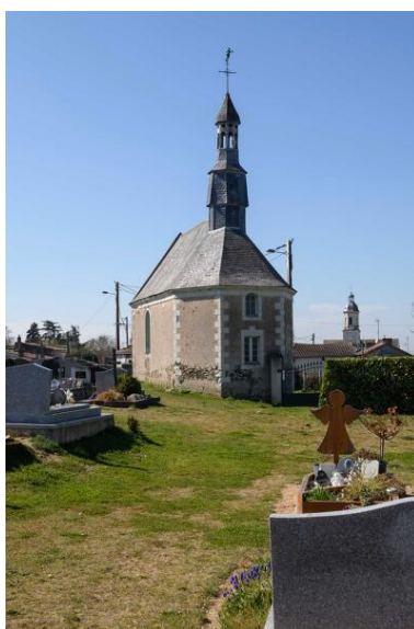
Vue d'ensemble depuis le nord-est. IVR52_20254900283NUCA