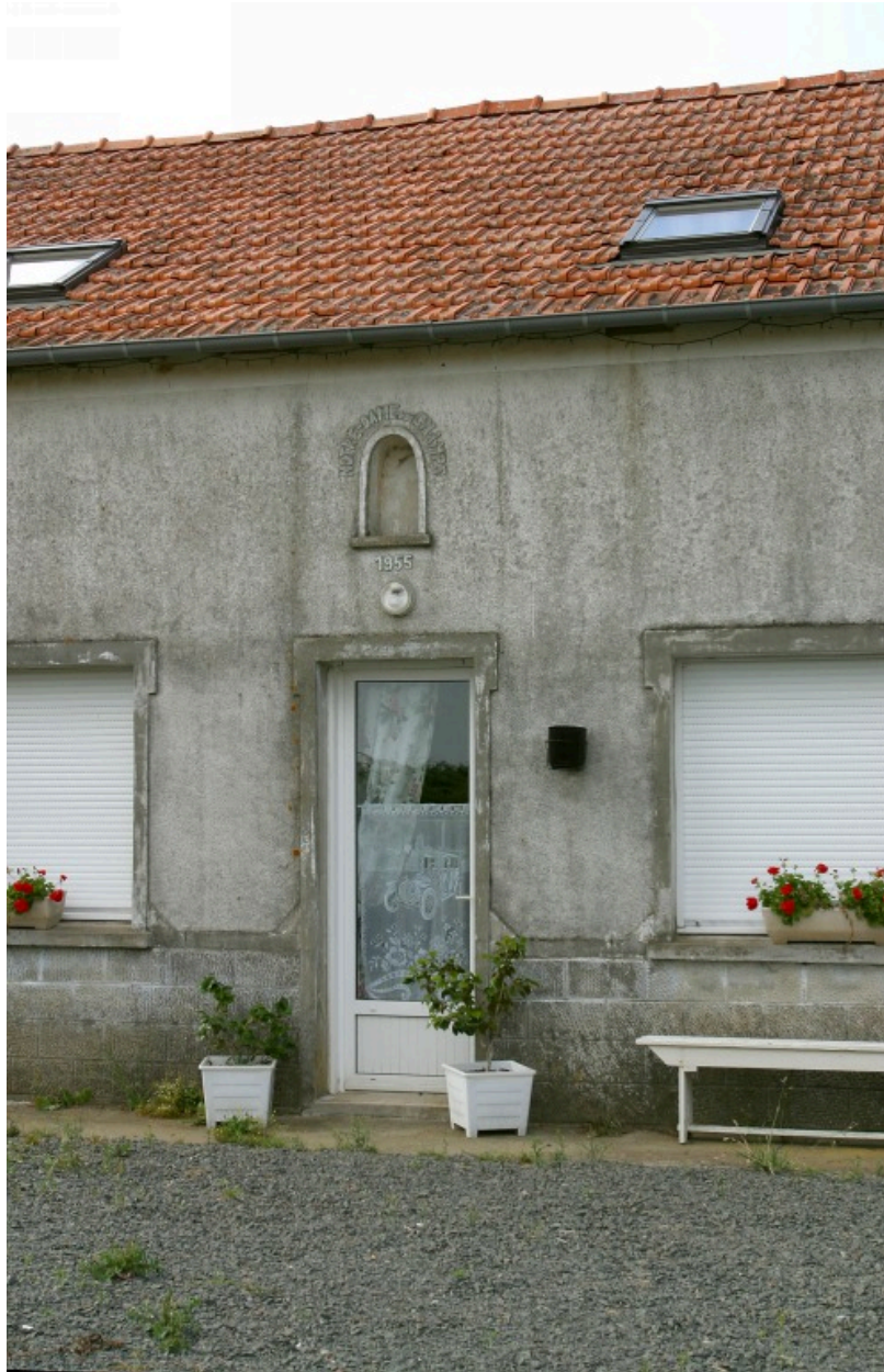
La partie centrale de la façade.