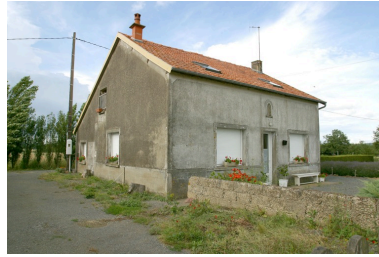
Vue d'ensemble depuis la route au sud-ouest. IVR52_20035302244NUCA