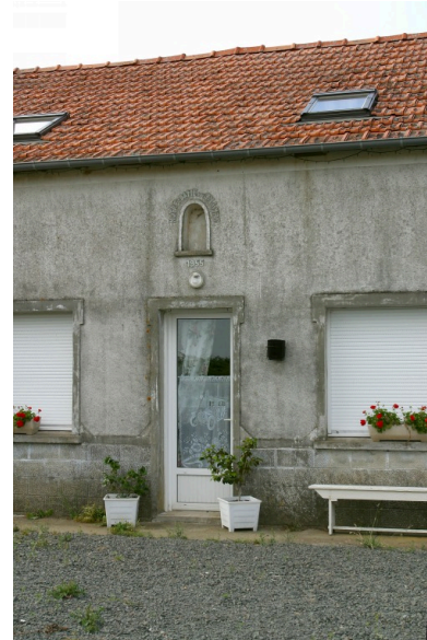
La partie centrale de la façade. IVR52_20035302245NUCA