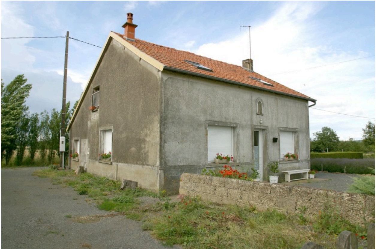
Vue d'ensemble depuis la route au sud-ouest.