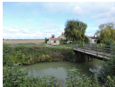
La cabane et sa passerelle sur le canal de Vix vue depuis le sud-ouest.