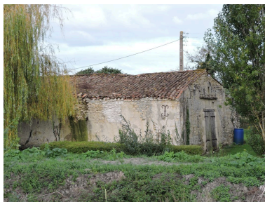
La grange-étable vue depuis le sud-est.