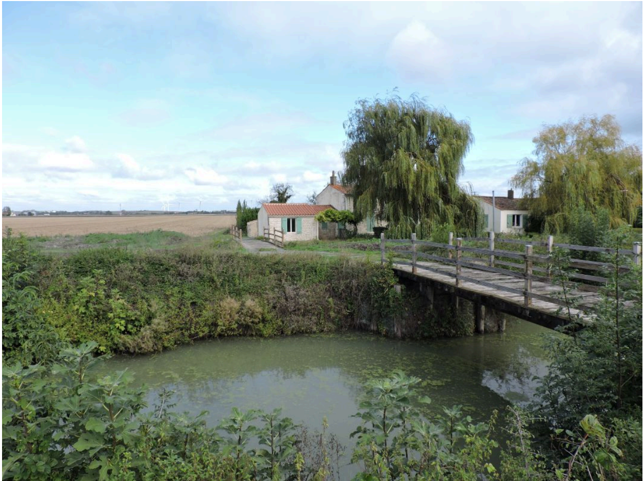
La cabane et sa passerelle sur le canal de Vix vue depuis le sud-ouest.