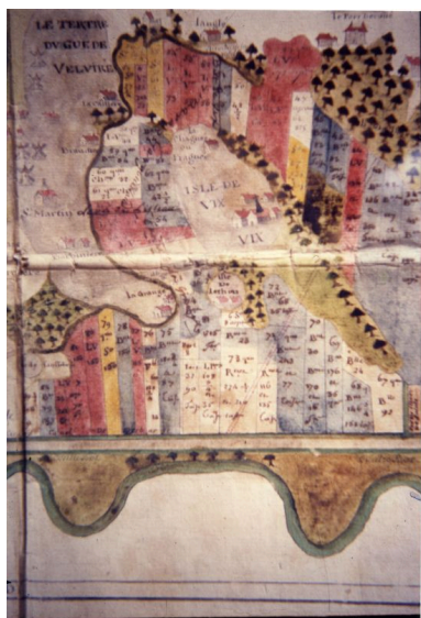
Le carreau 75, en bas au centre, sur le plan de partage des marais desséchés de Vix-Maillezais en 1663.

IVR52_20198502817NUCA