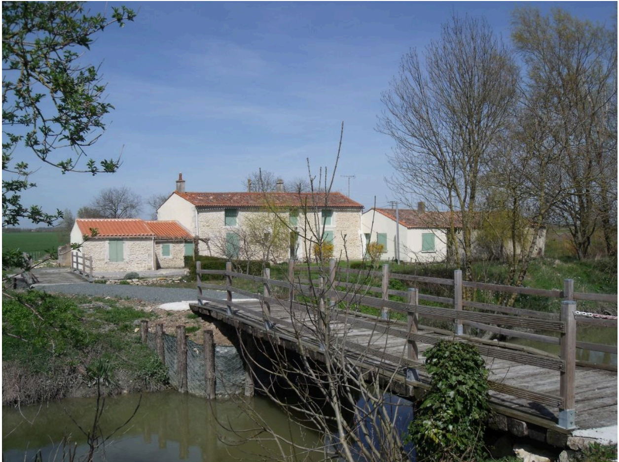
La Millenchère vue depuis le sud-ouest vers 2000.