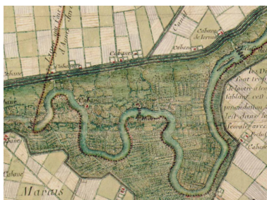
La cabane, en haut, sur la carte de la région par Claude Masse en 1720.

Repro. Yannis Suire IVR52_20198502817NUCA