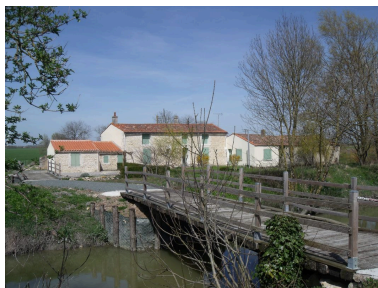
La Millenchère vue depuis le sud-ouest vers 2000.