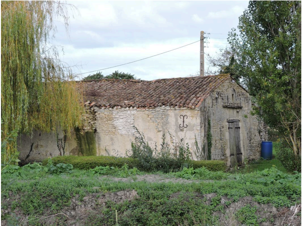
La grange-étable vue depuis le sud-est.