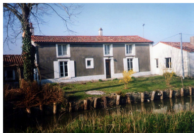
Le logis vers 1990. IVR52_20198503711NUCA