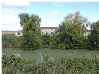
La cabane vue depuis le sud.