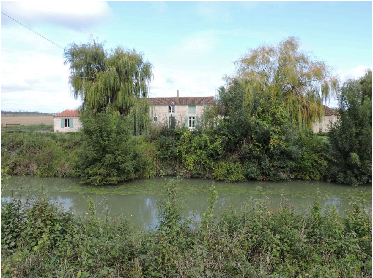
La cabane vue depuis le sud.