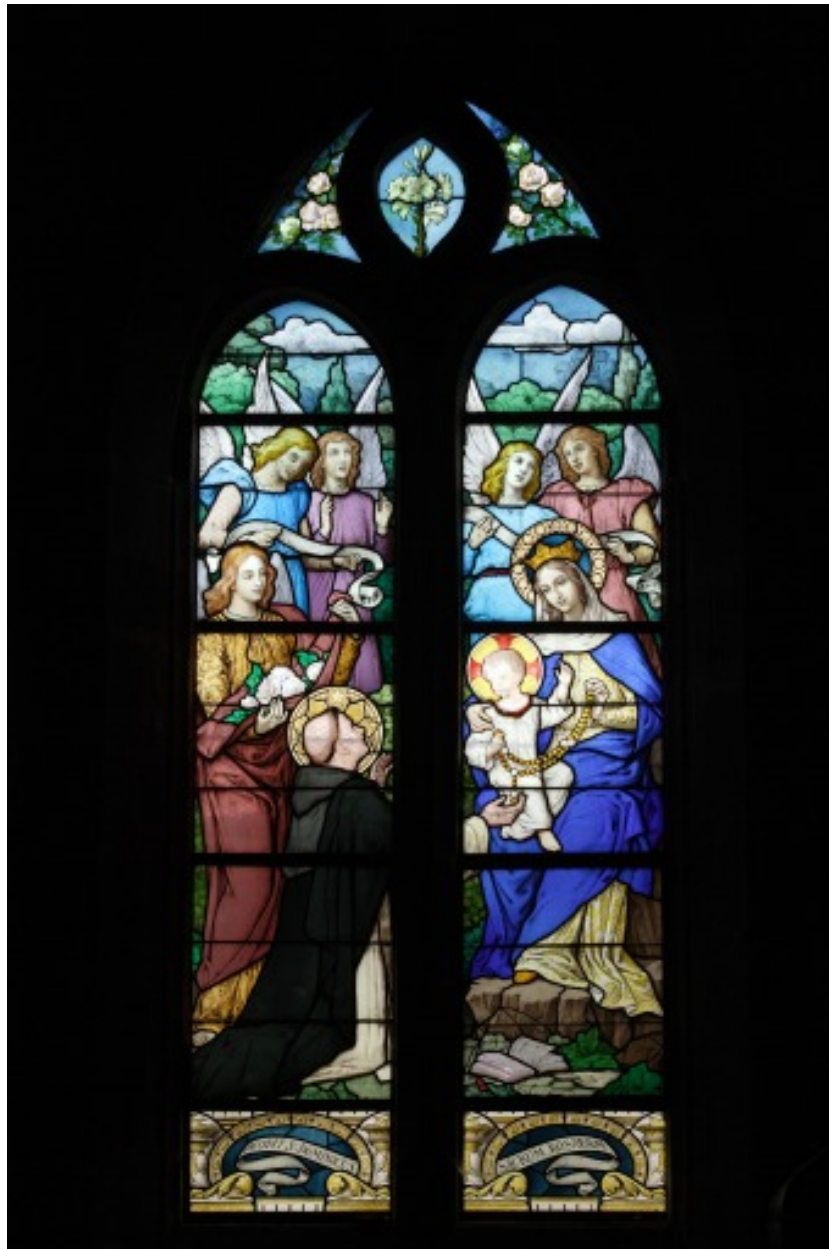
Verrière 1 : apparition de la Vierge à saint Dominique.