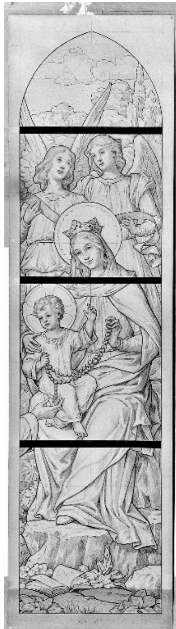
Carton de la lancette droite de la verrière 1.