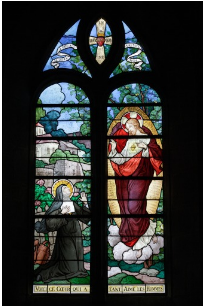
Verrière 3 : apparition du Sacré-Cœur à sainte Marguerite-Marie Alacoque.