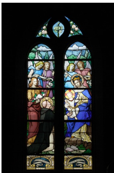
Verrière 1 : apparition de la Vierge à saint Dominique.