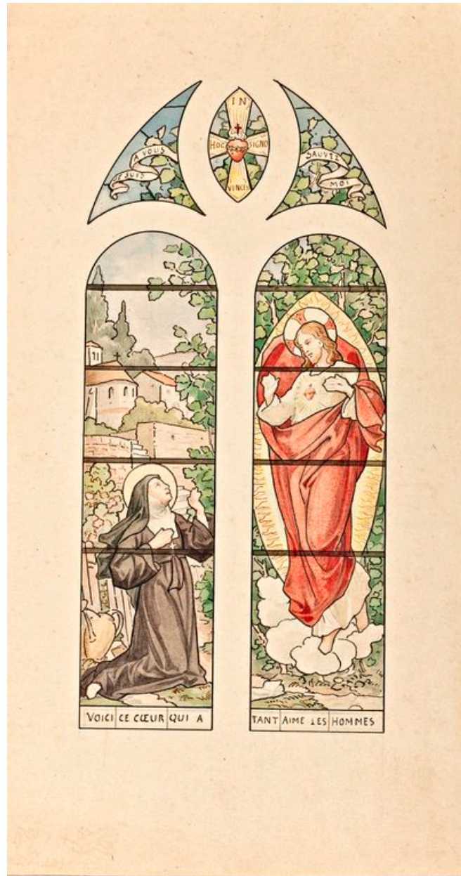
Maquette de la verrière 3 : apparition du Sacré-Cœur à sainte Marguerite-Marie Alacoque.