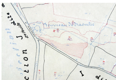
Extrait du plan cadastral de 1936, section I1.