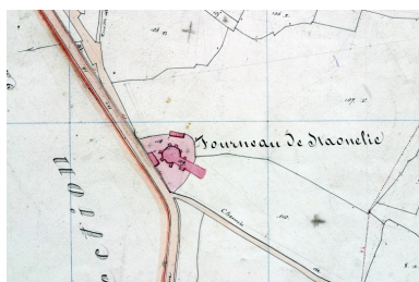
Extrait du plan cadastral de 1842, section I1. IVR52_20045301193NUCA