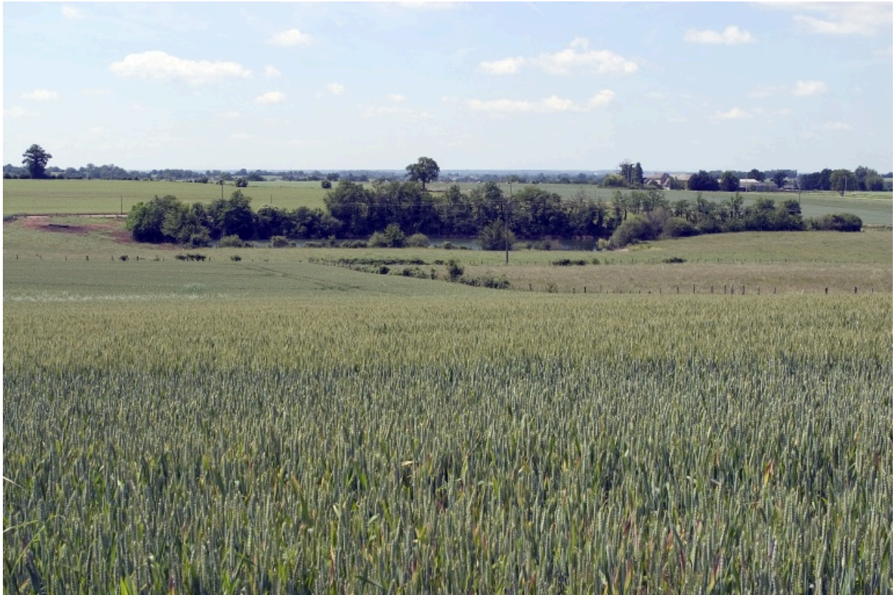
Vue d'ensemble du site des fours détruits depuis la route de Saint-Pierre au nord.