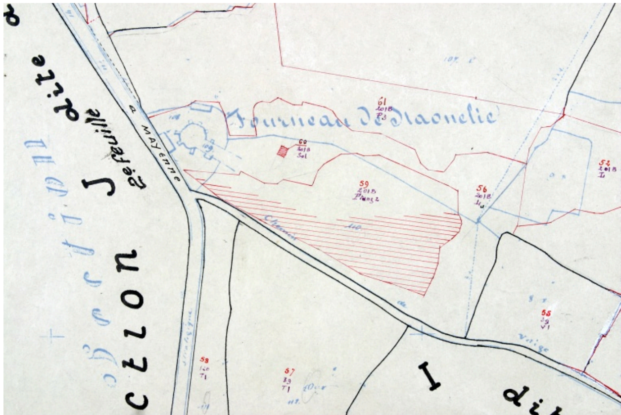
Extrait du plan cadastral de 1936, section II.