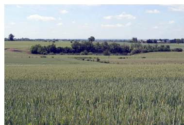
Vue d'ensemble du site des fours détruits depuis la route de Saint-Pierre au nord. IVR52_20045301765NUCA