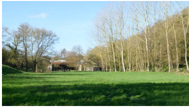
Site des moulins à eau de Châteaupanne, vue de l'est, Montjean-sur-Loire.