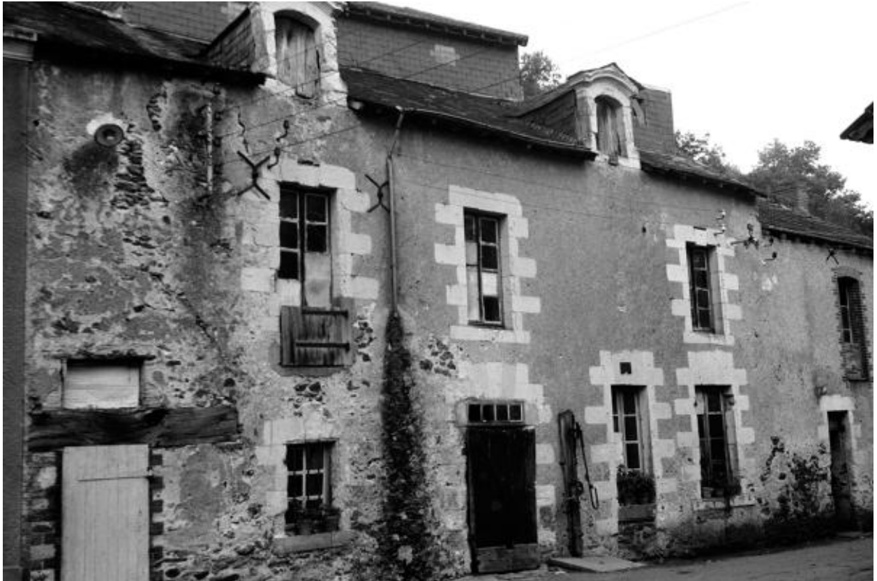
Façade principale du logis du moulin à eau de Châteaupanne, Montjean-sur-Loire.