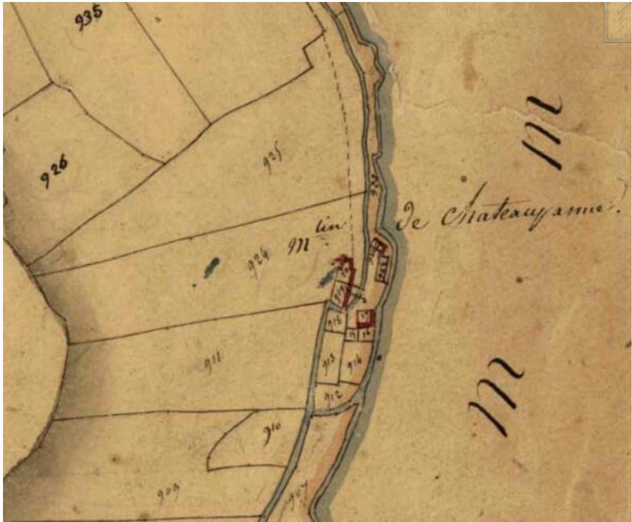
Moulins à eau de Châteaupanne. Extrait du plan cadastral de 1827, section E2, parcelle 919. (AD Maine-et-Loire, 3 P 4/220/15).