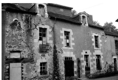
Façade principale du logis du moulin à eau de Châteaupanne, Montjean-sur-Loire. IVR52_19724900389Z