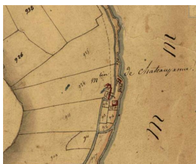
Moulins à eau de Châteaupanne. Extrait du plan cadastral de 1827, section E2, parcelle 919. (AD Maine-et-Loire, 3 P 4/220/15). IVR52_20244900706NUCA