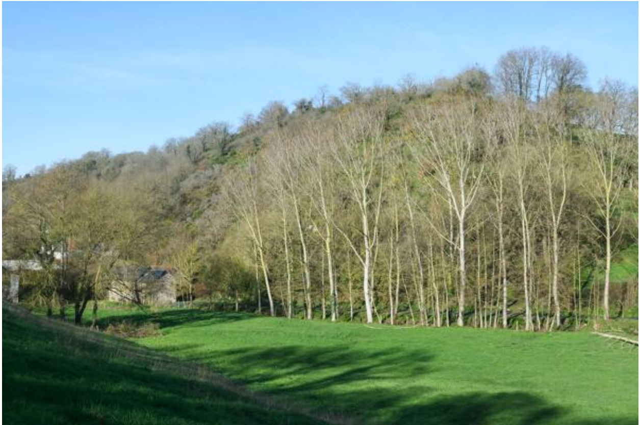
Vue d'ensemble du site des moulins à eau de Châteaupanne, Montjean-sur-Loire.