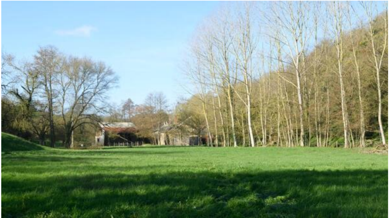
Site des moulins à eau de Châteaupanne, vue de l'est, Montjean-sur-Loire.