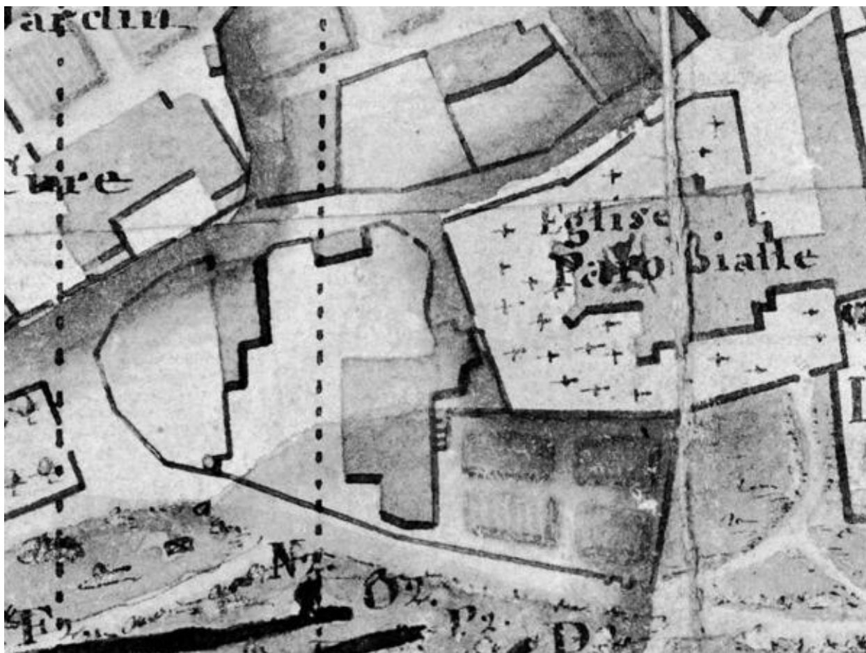
"Plan général de Montjean et des veines de charbon de terre qui y sont connues..." (détail), 4e quart du XVIIIe siècle, vers 1775-1780. (AM Montjean-sur-Loire ; sans cote).