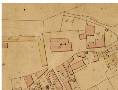
Plan cadastral (détail), 1827, section D1, parcelle 434. IVR52_20244900699NUCA

IVR52_20244900907NUCA