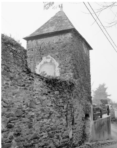
Pavillon, 1972. IVR52_19854902245X