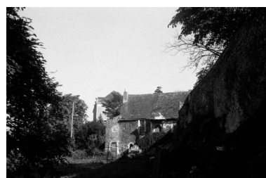
Façade principale, 1972. IVR52_19724900356Z