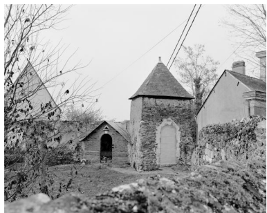
Communs, 1972.