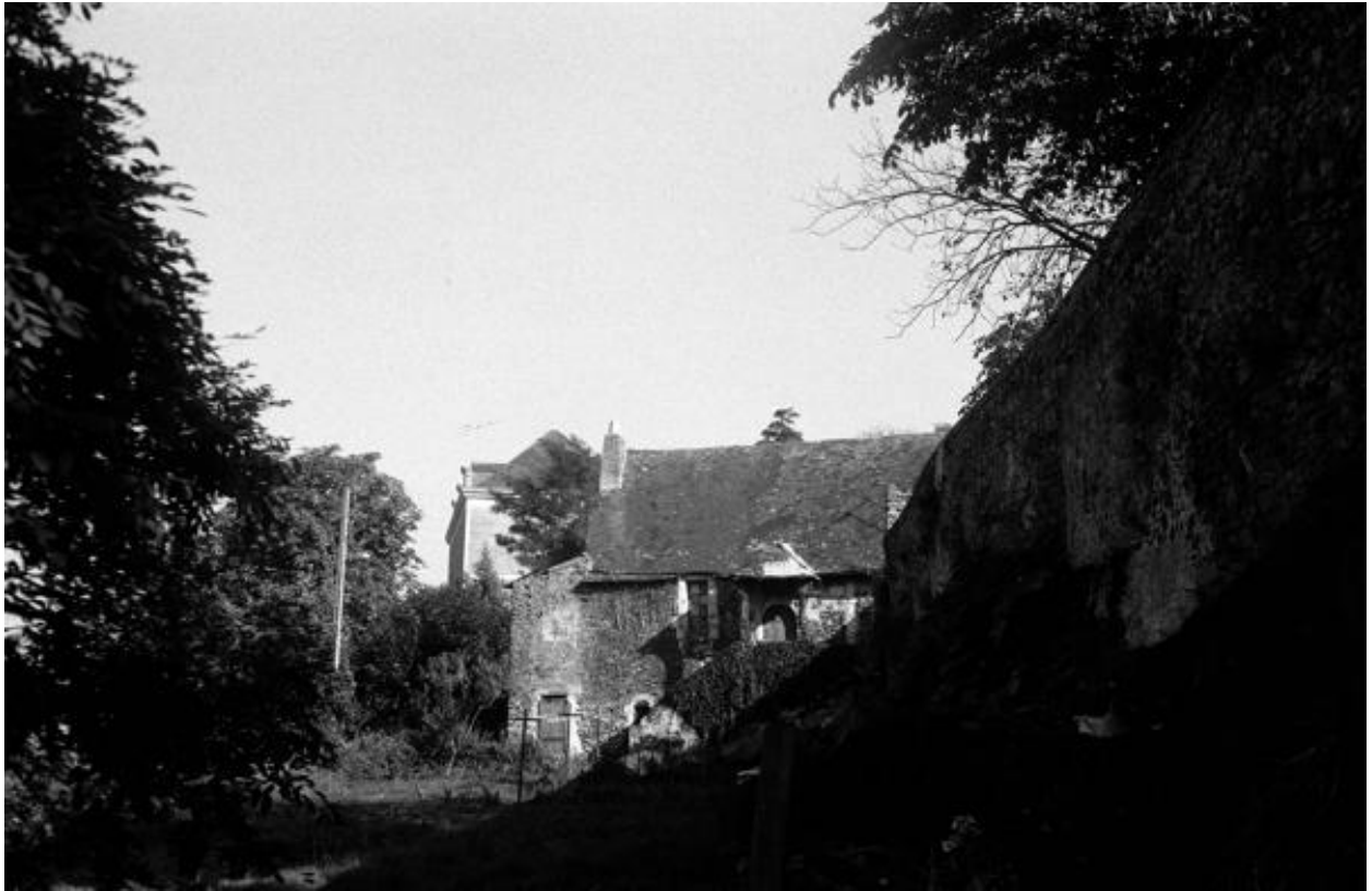
Façade principale, 1972.