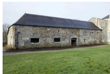
L'aile sud, remaniée au 19e siècle. Le passage charretier date du 18e siècle.