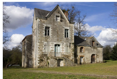
La maison du régisseur, 18e siècle. IVR52_20114400102NUCA