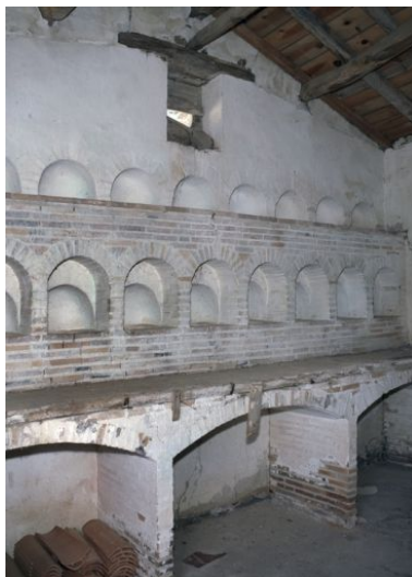
Le poulailler : aménagement intérieur.

Phot. Yves Guillotin IVR52_20114400105NUCA