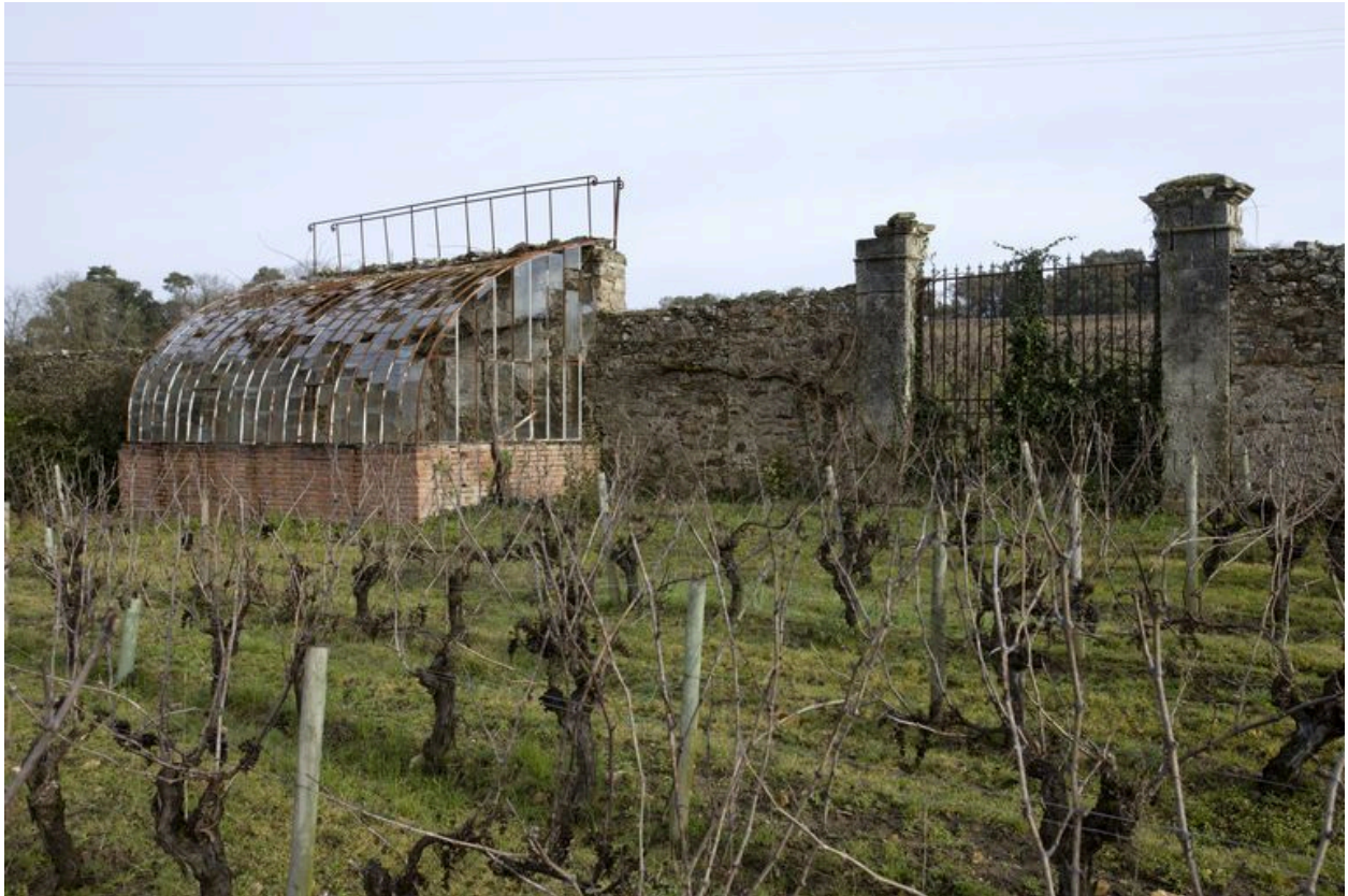
L'ancien potager : la serre adossée et un des deux portails.