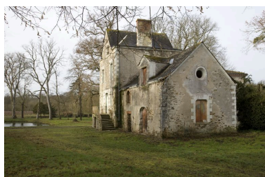
Vestige de la longère, partiellement abattue à la fin du 19e siècle.