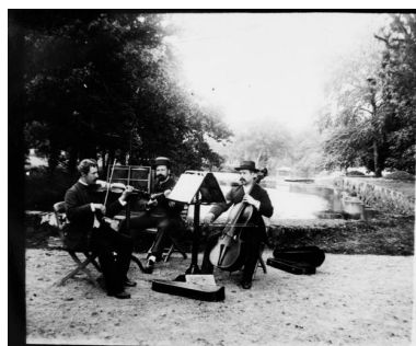
Ancienne "baillée" du Coin, vers 1910.