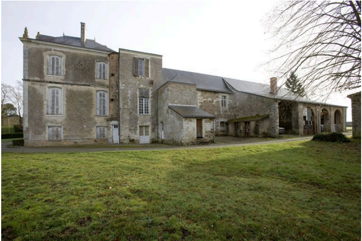
L'aile sud, côté cour des communs, avec l'orangerie : 18e siècle et remaniement 19e siècle.