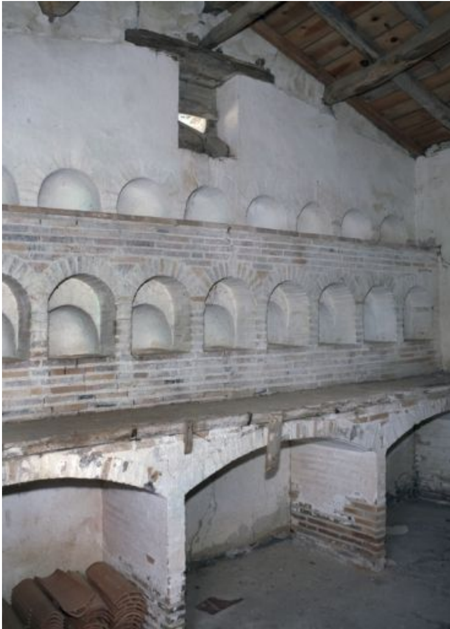
Le poulailler : aménagement intérieur.