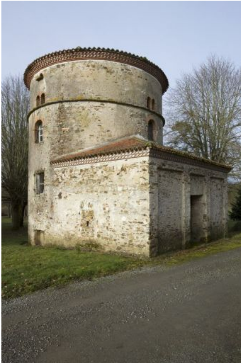
Au pied du pigeonnier, le four à pain et la buanderie 18e siècle, remaniés début 19e siècle.