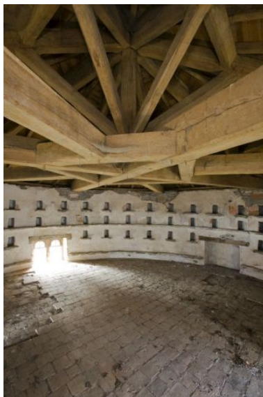
Le pigeonnier : détail des trous de boulin et de la charpente. IVR52_20114400108NUCA