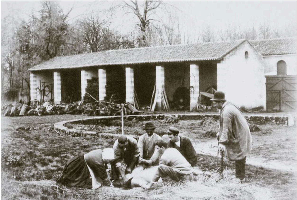
La seconde cour des communs : le hangar, vers 1910.