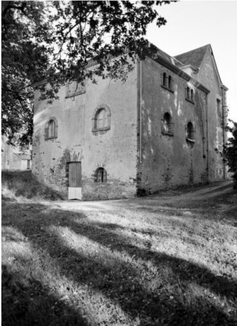
La grange : détail des ouvertures et porte fanière murée.