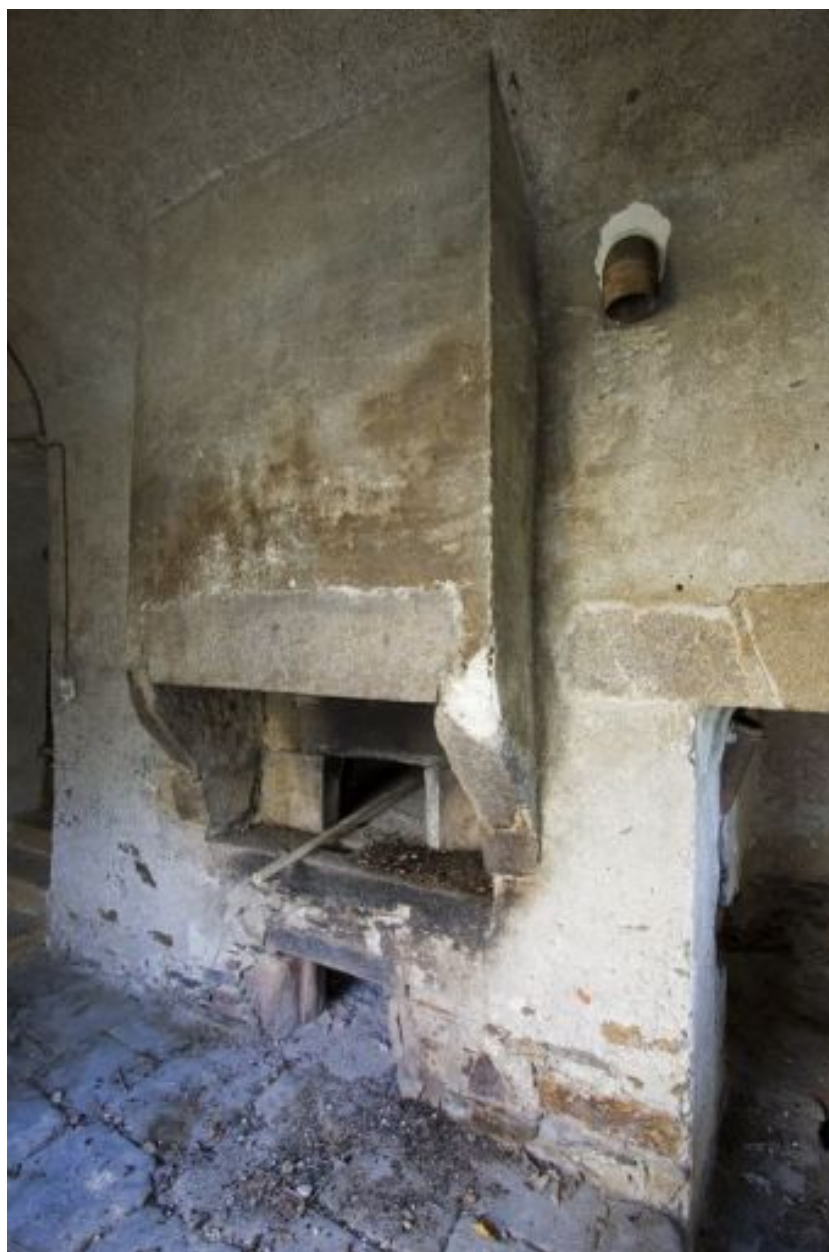
Le four à pain : intérieur.