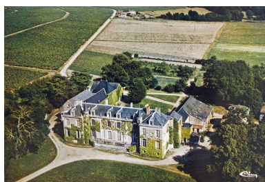
Le château du Coin : vue aérienne, vers 1960. IVR52_20104401563NUCAB