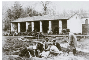
La seconde cour des communs : le hangar, vers 1910.

IVR52_20104401596NUCAB