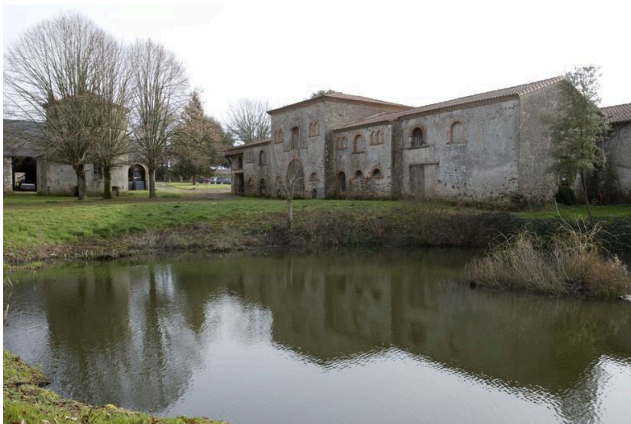
Bâtiment des écuries : vue d'ensemble de la façade ouest.