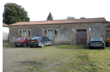
La seconde cour des communs : le poulailler et la porcherie. 2e moitié du 19e siècle.