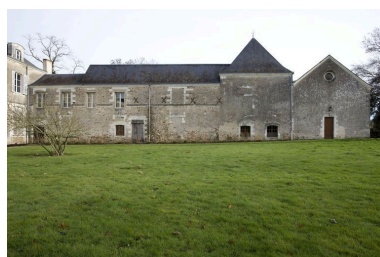
L'aile nord, 18e siècle, agrandie au 19e siècle.