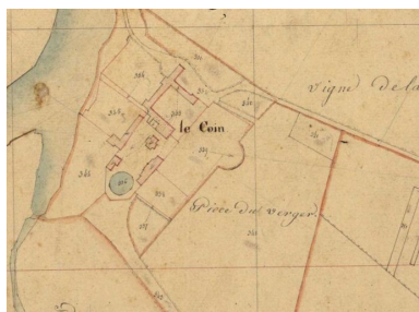
Cadastré 1827. IVR52_20104402953NUCA