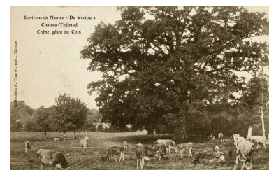
Le chêne géant du Coin, vers 1910.