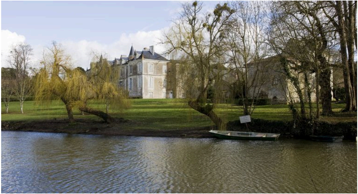
Le logis et la cour des communs vus à partir du sud-ouest.