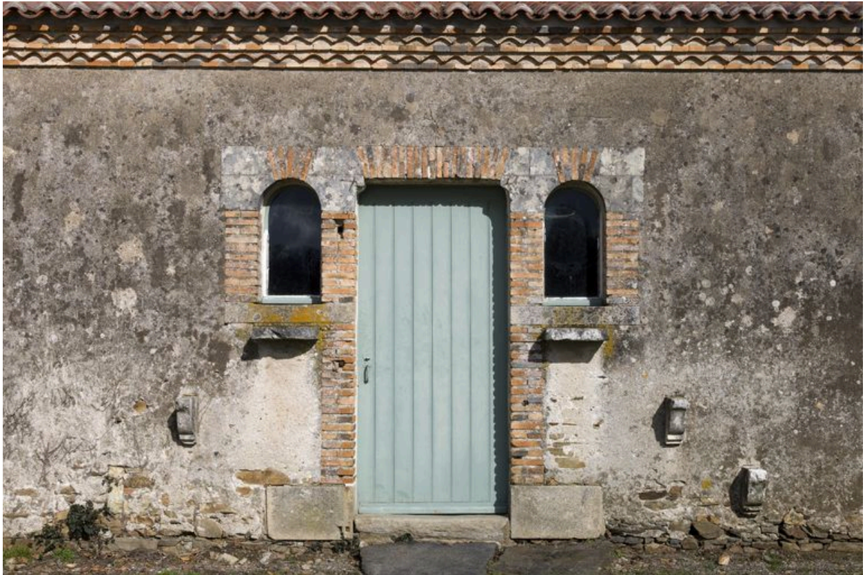
Le poulailler : détail des ouvertures.