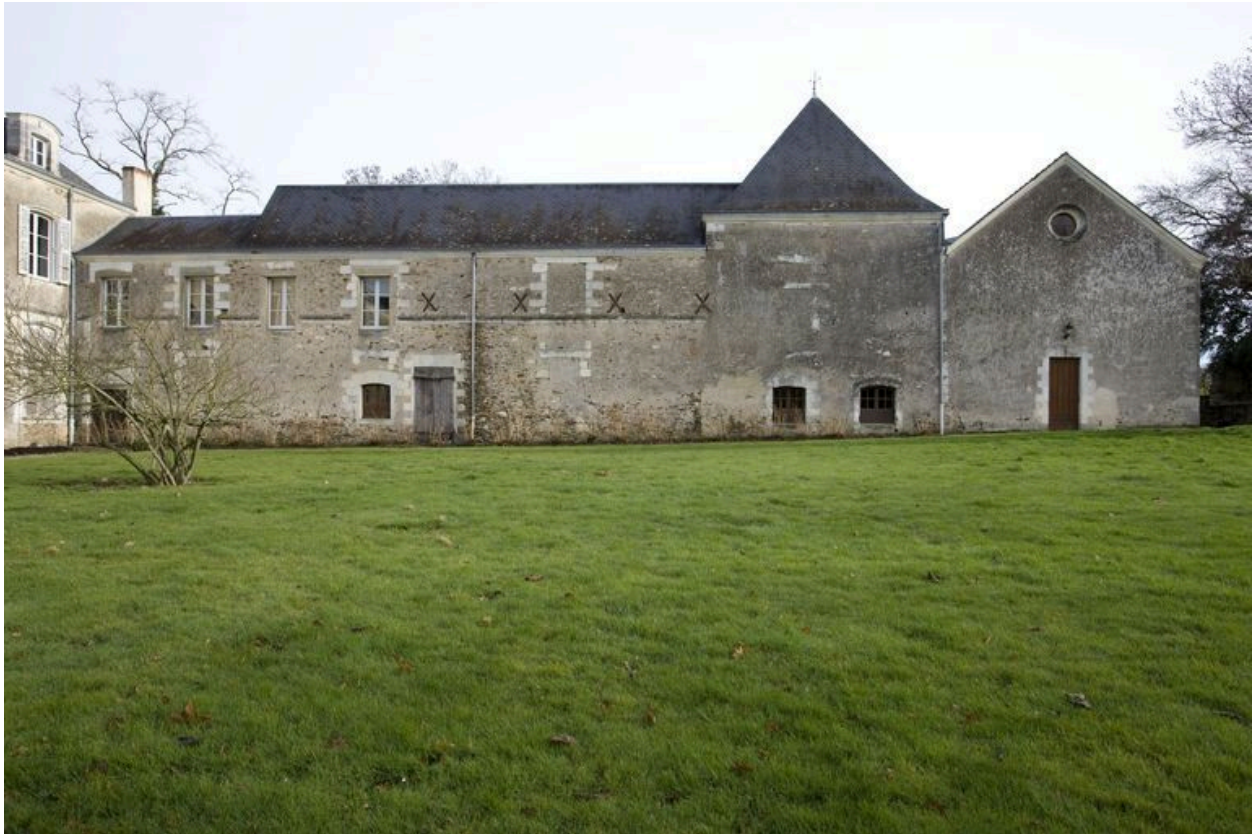
L'aile nord, 18e siècle, agrandie au 19e siècle.