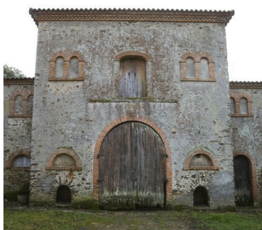
Bâtiment des écuries, partie centrale : jeu des ouvertures. Deux niches à chiens encadrent le portail.