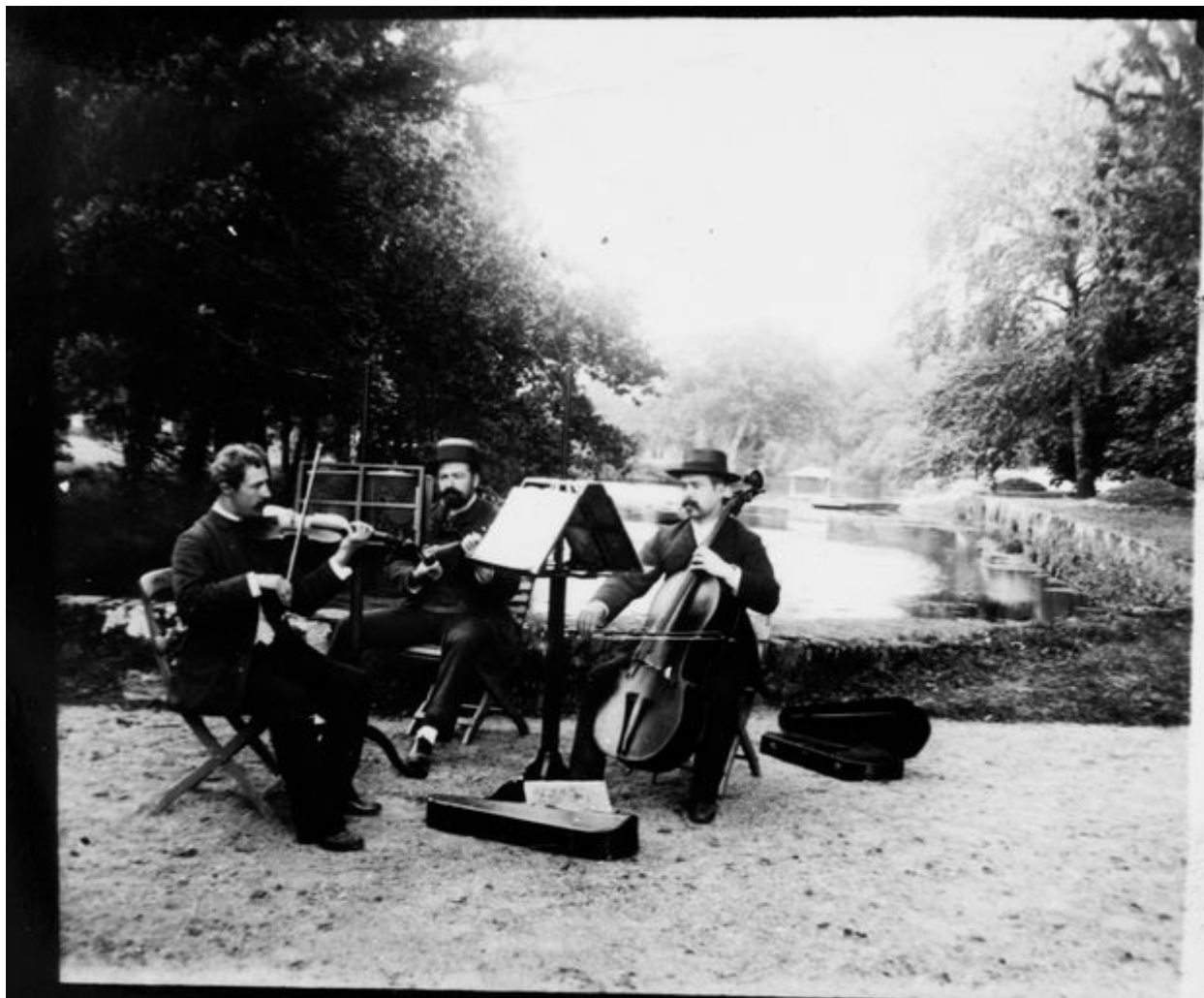
Ancienne "baillée" du Coin, vers 1910.