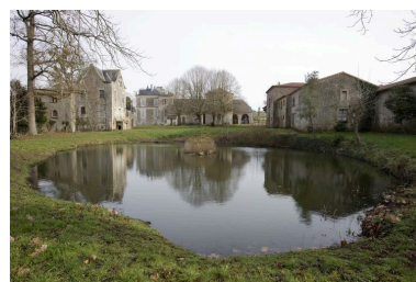
La cour des communs : vue d'ensemble à partir du sud. IVR52_20114400092NUCA