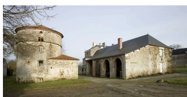
Le pigeonnier et l'orangerie. 19e siècle. IVR52_20114400084NUCA