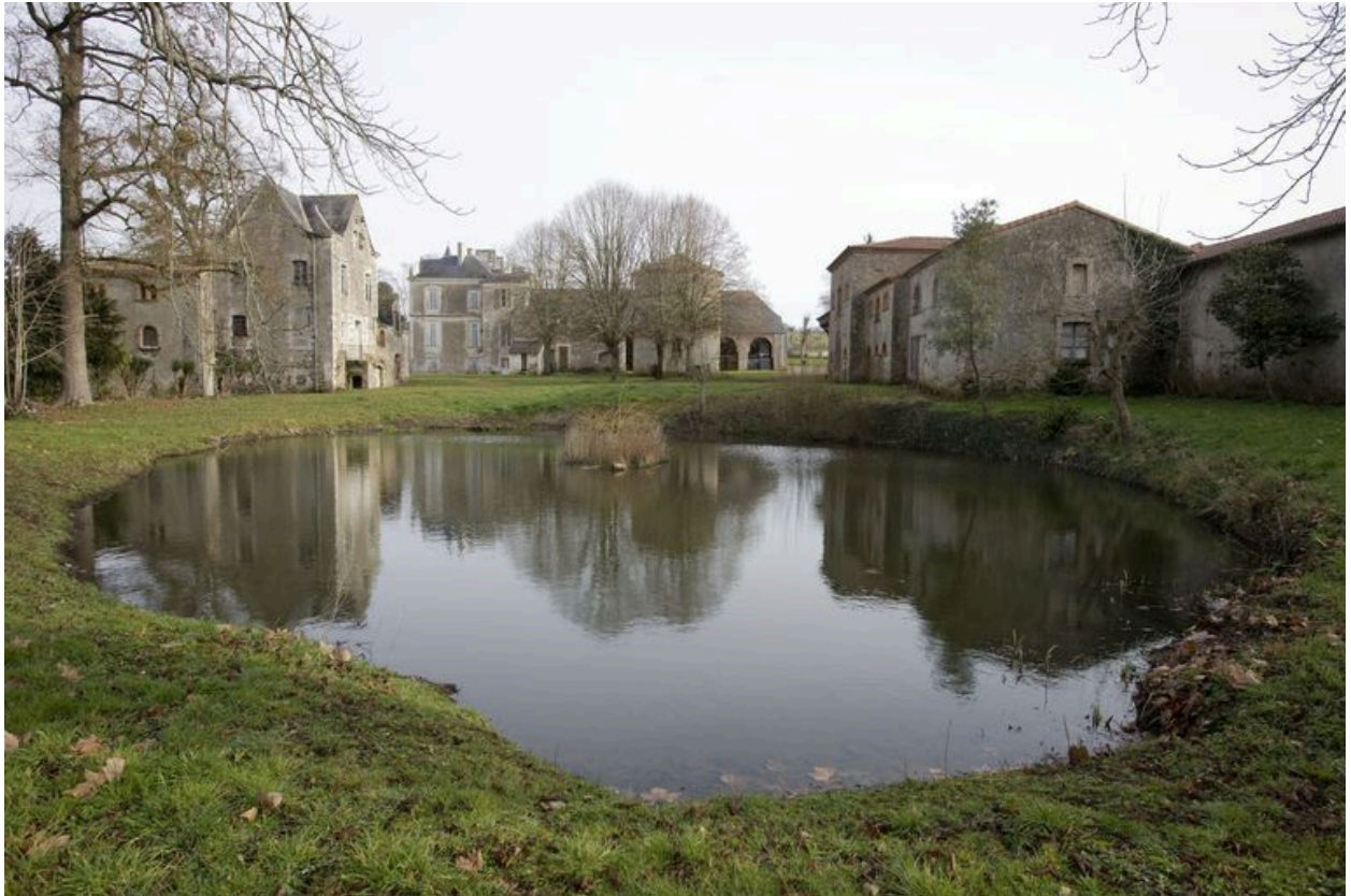
La cour des communs : vue d'ensemble à partir du sud.