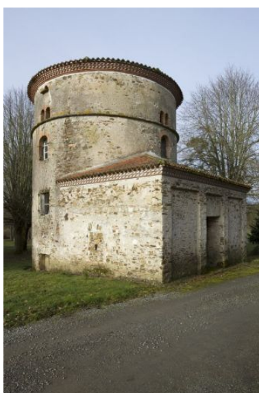
Au pied du pigeonnier, le four à pain et la buanderie 18e siècle, remaniés début 19e siècle.