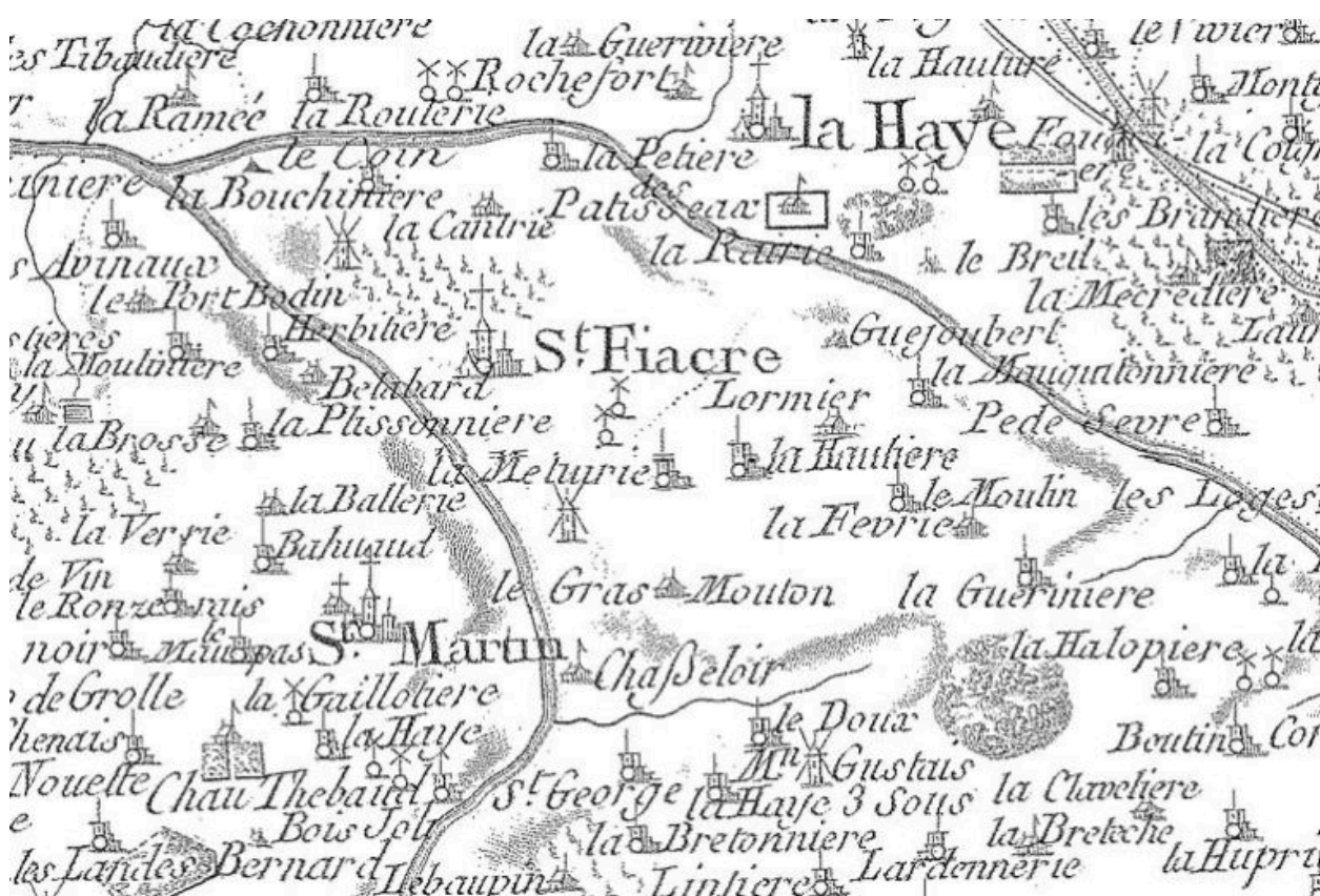
Carte de Cassini, 18e siècle.