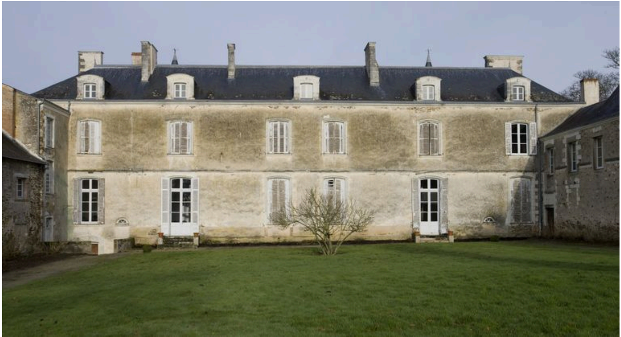
Le corps de logis : façade est, 18e siècle.