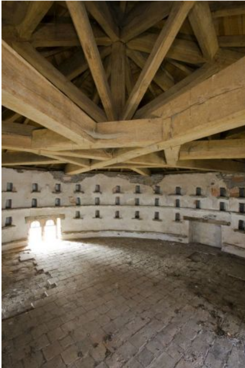
Le pigeonnier : détail des trous de boulin et de la charpente.