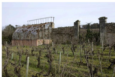
L'ancien potager : la serre adossée et un des deux portails.

Phot. Yves Guillotin IVR52_20104401596NUCAB