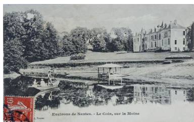
Le château du Coin, vers 1910. IVR52_20104401569NUCA