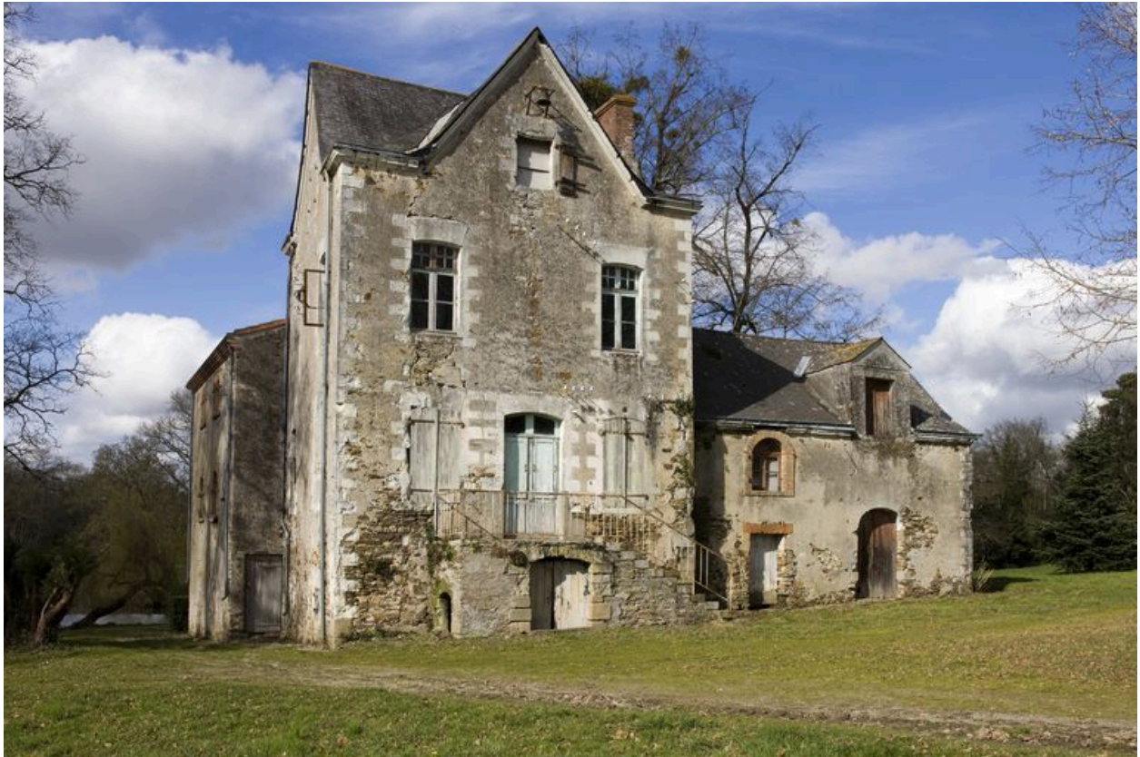
La maison du régisseur, 18e siècle.