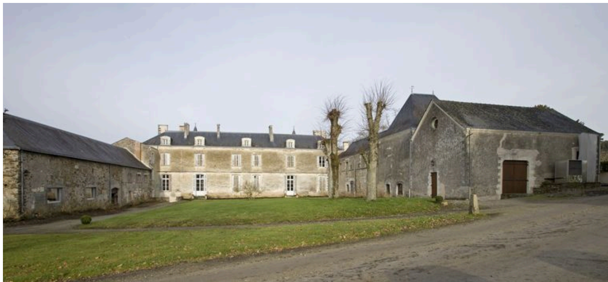
La cour : vue d'ensemble à partir de l'est.