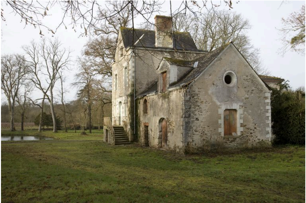
Vestige de la longère, partiellement abattue à la fin du 19e siècle.