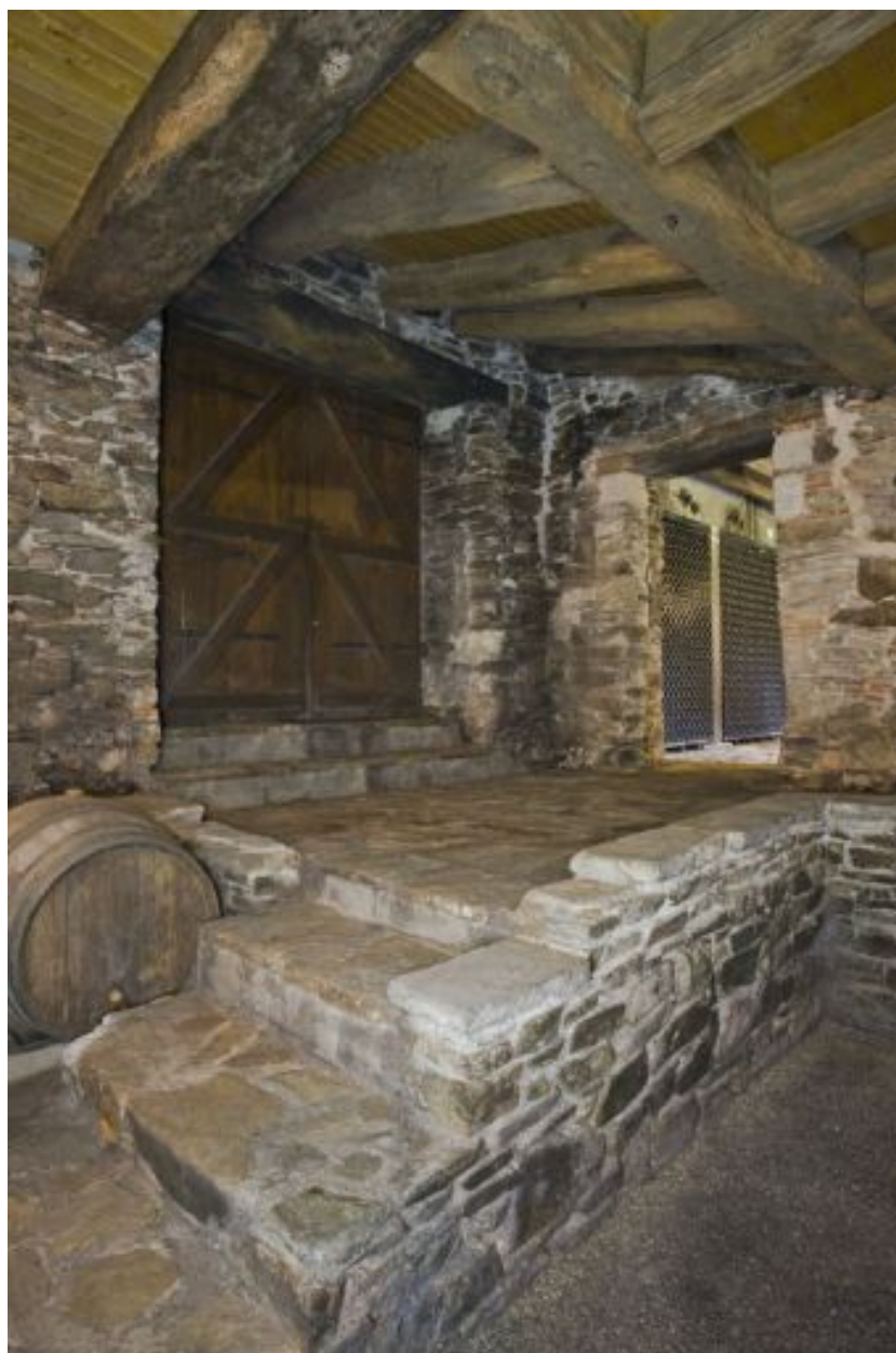
L'aile nord : accès au chai et détail de la poutraison.