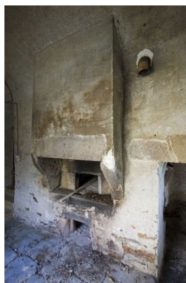
Le four à pain : intérieur.