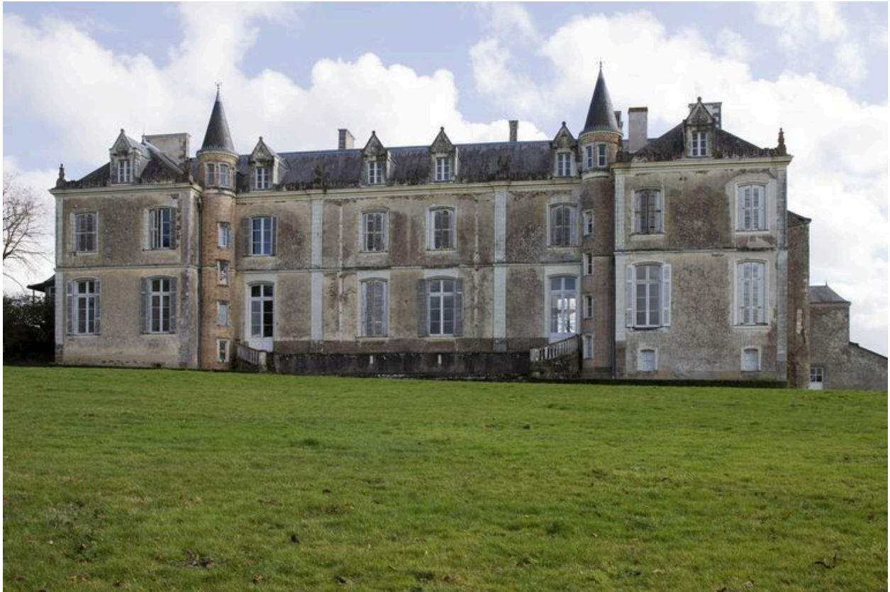
Le corps de logis : façade ouest, 18e siècle, castellisée au 19e siècle.