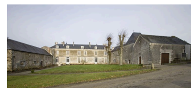
La cour : vue d'ensemble à partir de l'est.