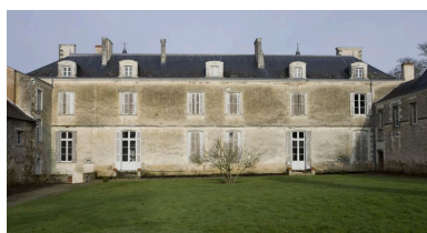
Le corps de logis : façade est, 18e siècle.