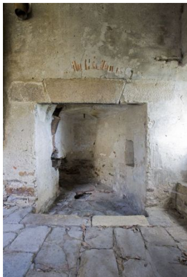
La buanderie : intérieur. IVR52_20114400107NUCA