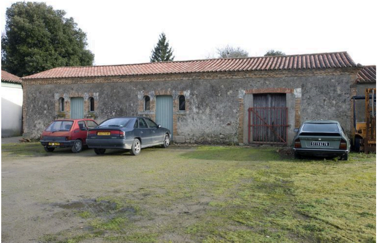
La seconde cour des communs : le poulailler et la porcherie. 2e moitié du 19e siècle.