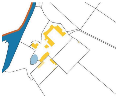
Cadastré 2011. IVR52_20104402920NUCA