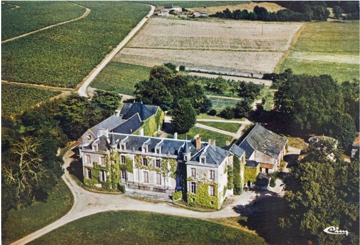
Le château du Coin : vue aérienne, vers 1960.