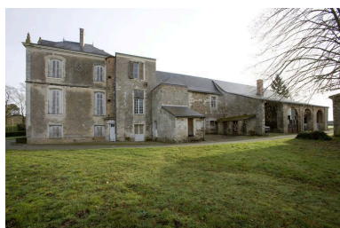
L'aile sud, côté cour des communs, avec l'orangerie : 18e siècle et remaniement 19e siècle.