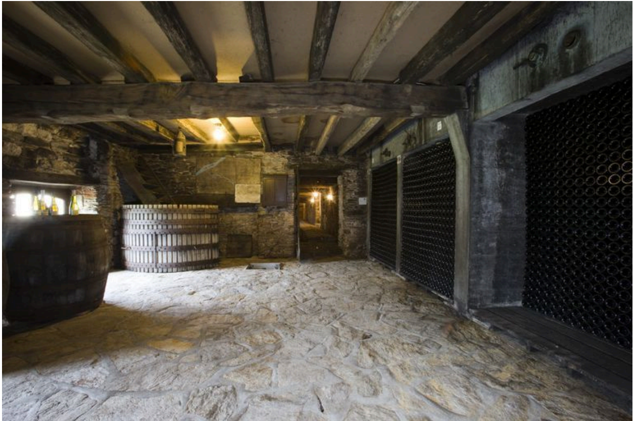
L'aile nord : ancienne salle du pressoir, 18e siècle.