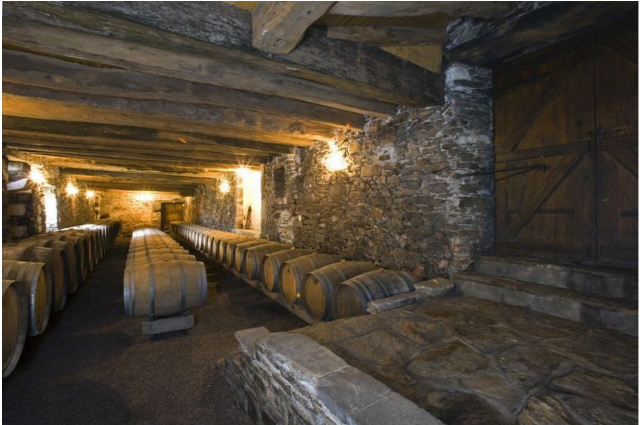
L'aile nord : le chai.