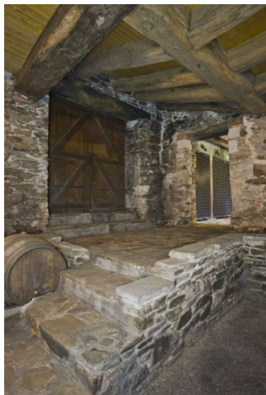
L'aile nord : accès au chai et détail de la poutraison.