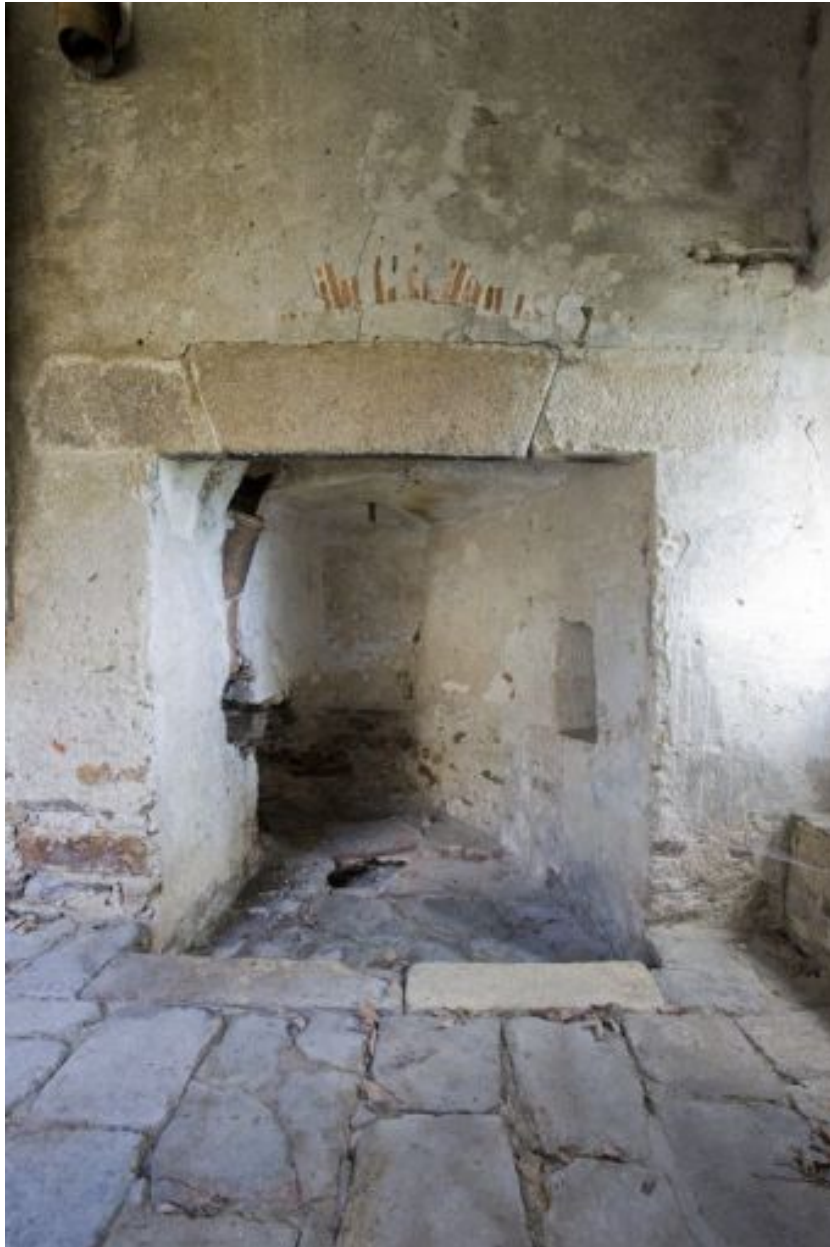
La buanderie : intérieur.