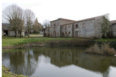
Bâtiment des écuries : vue d'ensemble de la façade ouest. IVR52_20114400093NUCA