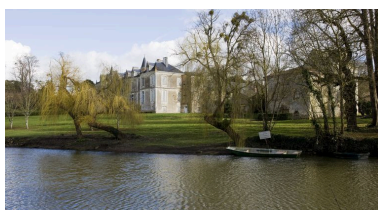
Le logis et la cour des communs vus à partir du sud-ouest. IVR52_20114400103NUCA