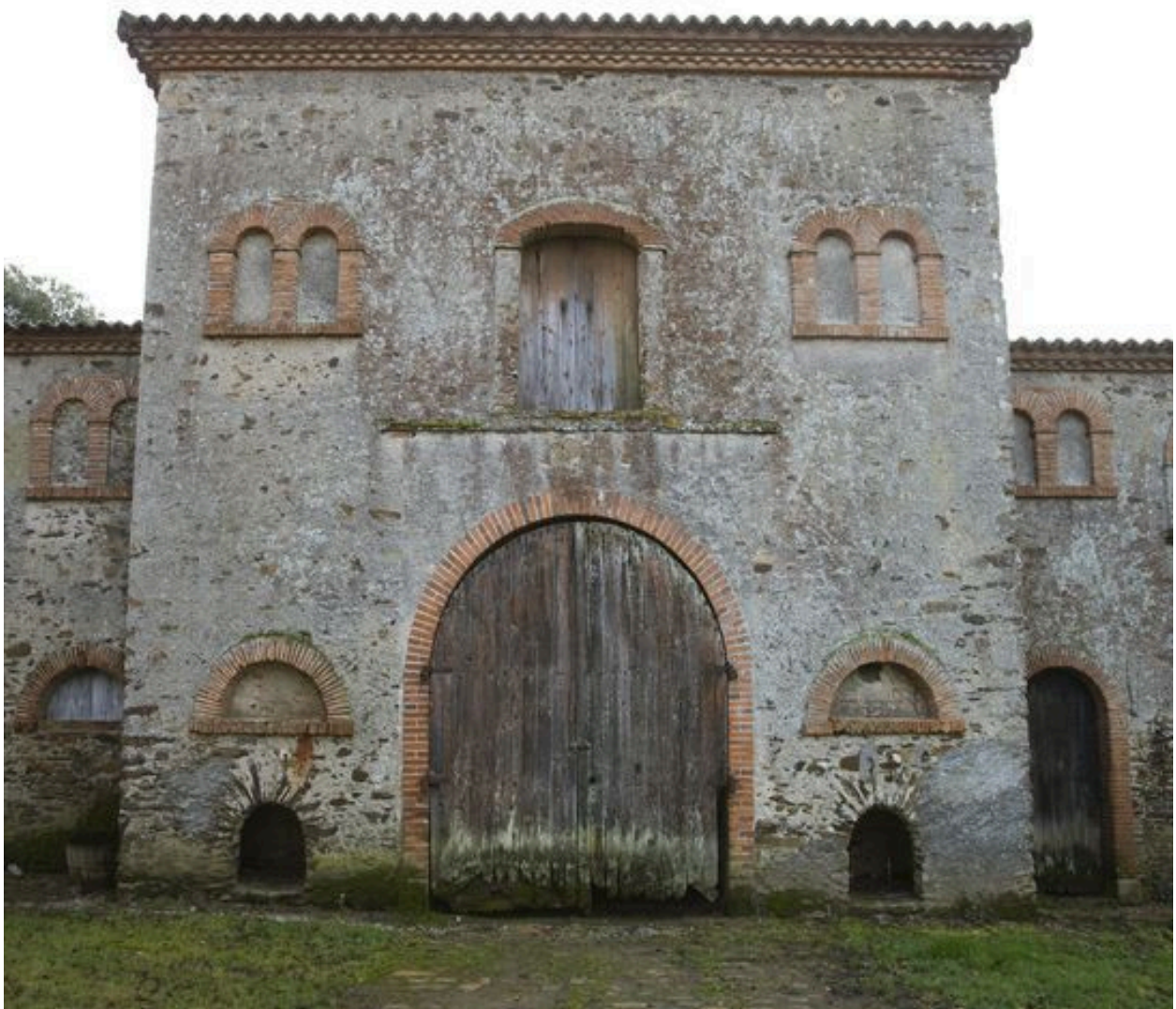
Bâtiment des écuries, partie centrale : jeu des ouvertures. Deux niches à chiens encadrent le portail.