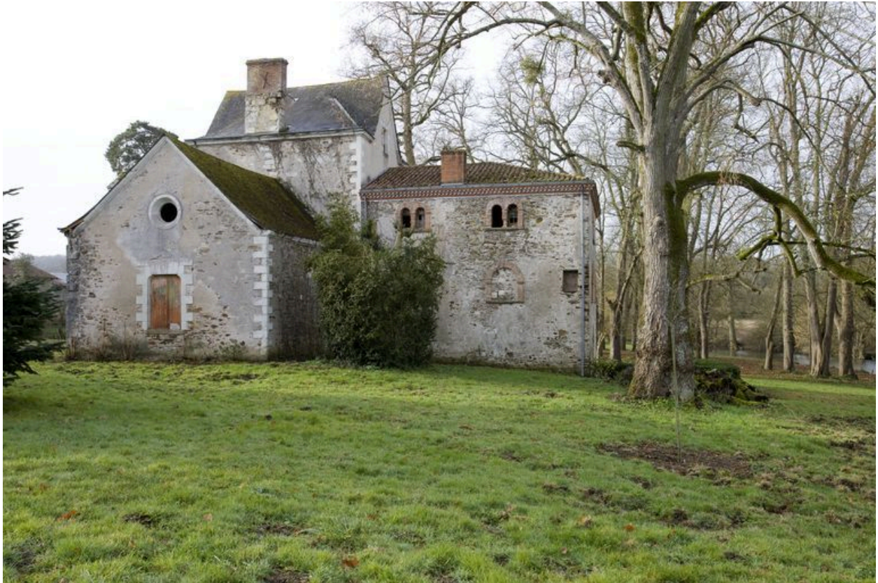
La grange adossée à la maison du régisseur : façade nord.