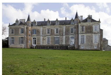
Le corps de logis : façade ouest, 18e siècle, castillée au 19e siècle. IVR52_20114400104NUCA