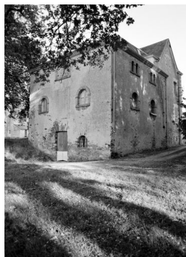
La grange : détail des ouvertures et porte fanière murée. IVR52_19974402971X