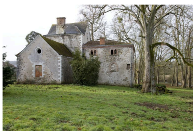
La grange adossée à la maison du régisseur : façade nord.