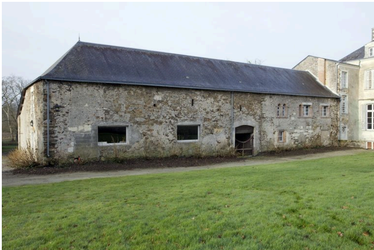
L'aile sud, remaniée au 19e siècle. Le passage charretier date du 18e siècle.