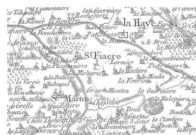
Carte de Cassini, 18e siècle. Autr. César-François de Cassini de Thury IVR52_20104402932NUCA