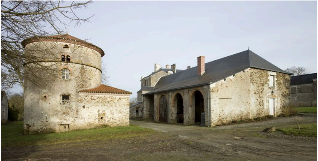
Le pigeonnier et l'orangerie. 19e siècle.