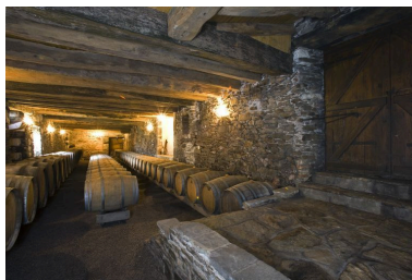
L'aile nord : le chai. IVR52_20114400088NUCA