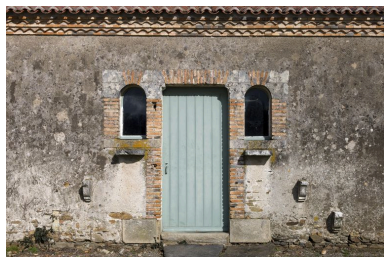
Le poulailler : détail des ouvertures.

Phot. Yves Guillotin IVR52_20114400096NUCA