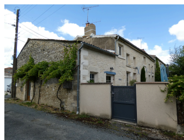
L'ancienne ferme vue depuis le sud-ouest.

IVR52_20228501685NUCA