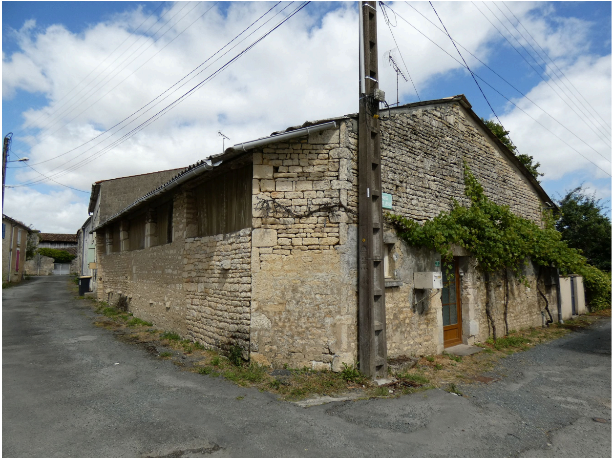
L'ancienne dépendance, probablement une étable, surmontée de fenils, vue depuis l'ouest.