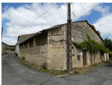
L'ancienne dépendance, probablement une étable, surmontée de fenils, vue depuis l'ouest.

Repro. Yannis Suire IVR52_20228501404NUCA