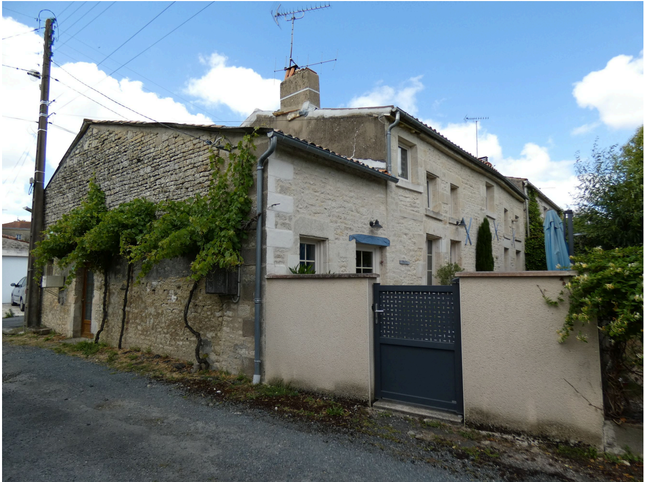
L'ancienne ferme vue depuis le sud-ouest.