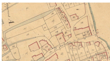
Les parcelles 120 à 124, en haut, sur le plan cadastral de 1835.

IVR52_20228501404NUCA