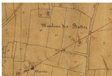
Le Moulin-Martin. Extrait du plan cadastral de 1827, section C (unique), parcelle n° 583. IVR52_20254900080NUCA