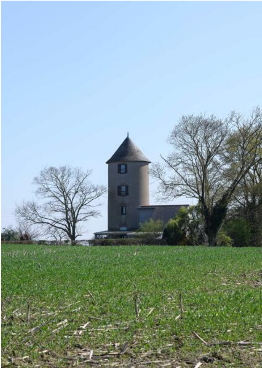
Moulin à farine dit le Moulin-Martin. Vue d'ensemble depuis le nord.