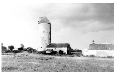
Vue du Moulin-Martin (au centre), du moulin des Buttes (n°1) (au second plan, à gauche) et du moulin du Chêne-Vert (au troisième plan, à droite) au début du XXe siècle.