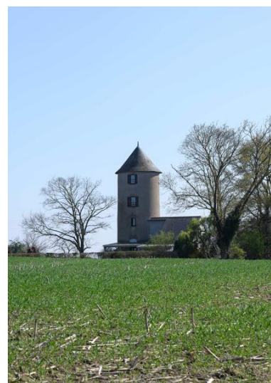
Moulin à farine dit le Moulin-Martin. Vue d'ensemble depuis le nord. IVR52_20254900393NUCA