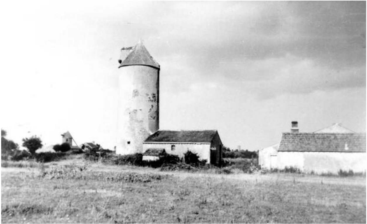
Vue du Moulin-Martin (au centre), du moulin des Buttes (n°1) (au second plan, à gauche) et du moulin du Chêne-Vert (au troisième plan, à droite) au début du XXe siècle. (Coll. part).