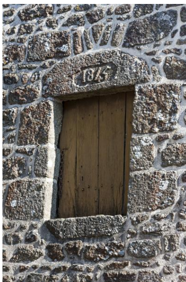
Date portée 1845 sur une fenêtre. IVR52_20185300464NUCA