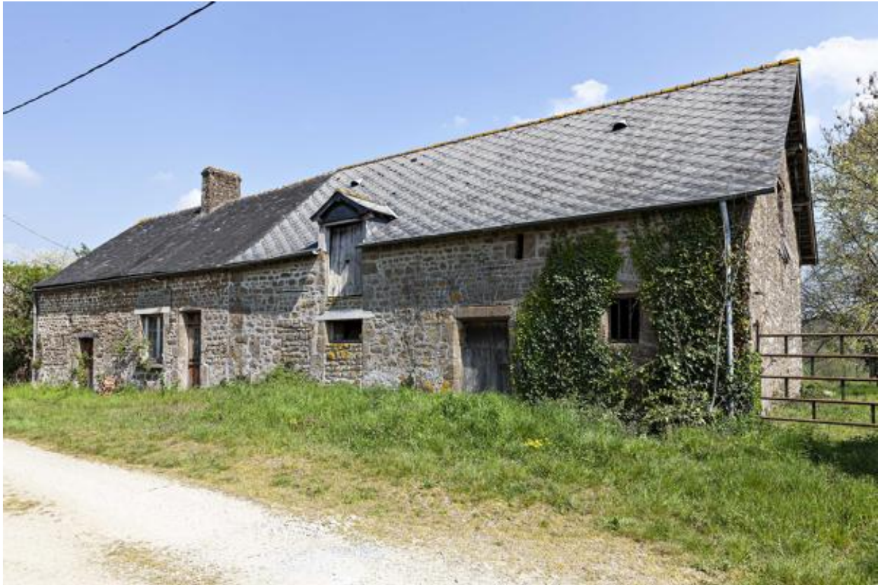
Alignement (223 ZC 21).