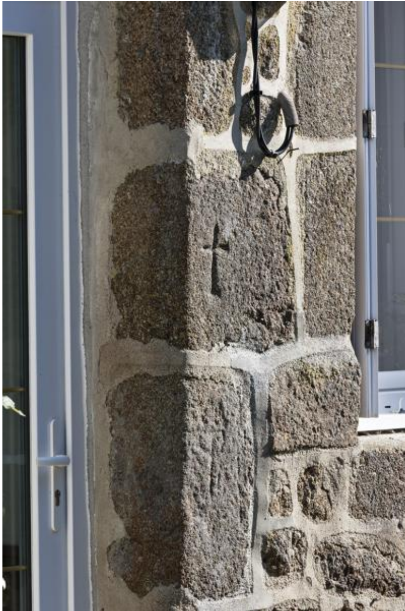
Maison (2023 ZC 90), croix gravé dans l'encadrement de porte.