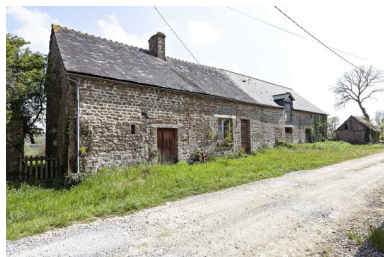
Alignement (223 ZC 21). IVR52_20215300260NUCA