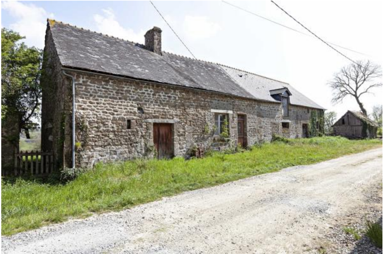
Alignement (223 ZC 21).