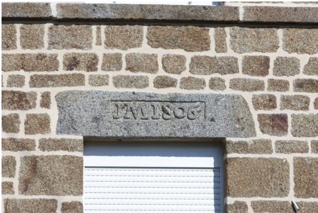
Maison (2023 ZC 105), linteau portant l'inscription "IM 1806".