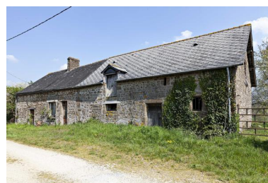
Alignement (223 ZC 21). IVR52_20215300259NUCA