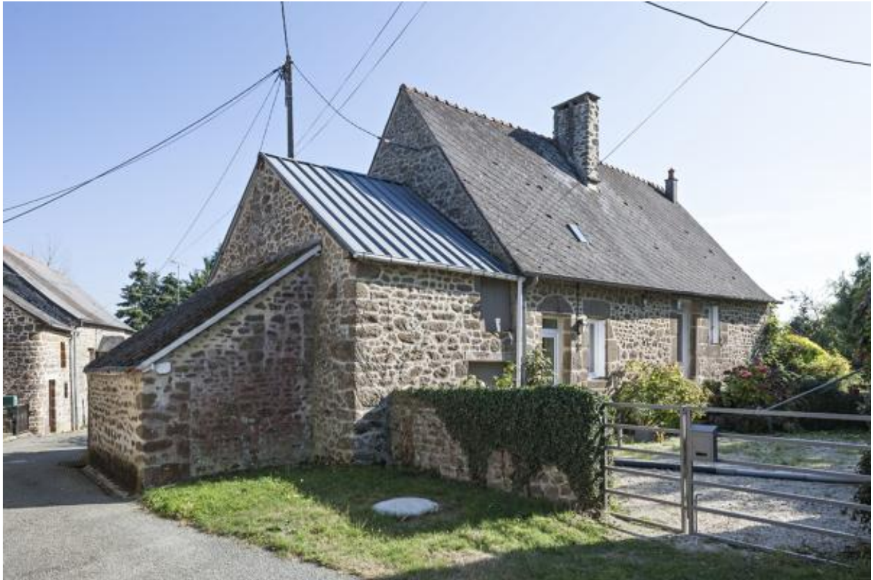
Maison (2023 ZC 90).