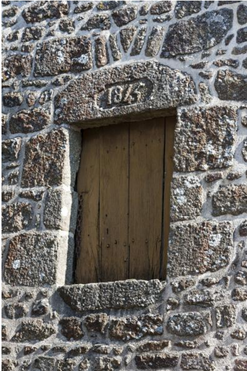
Date portée 1845 sur une fenêtre.