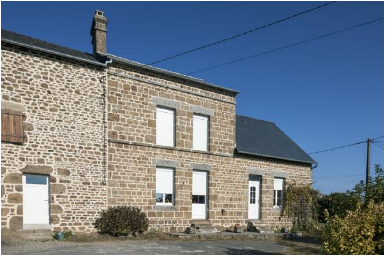
Maison (2023 ZC 105).