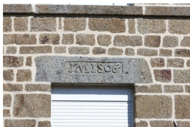
Maison (2023 ZC 105), linteau portant l'inscription "IM 1806". IVR52_20185300437NUCA