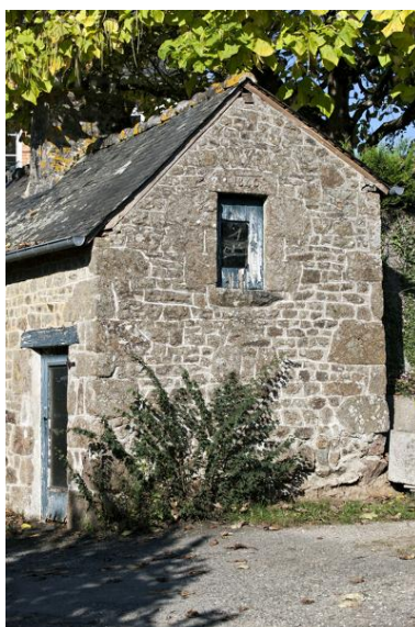
Fournil (2023 ZC 40). IVR52_20185300439NUCA