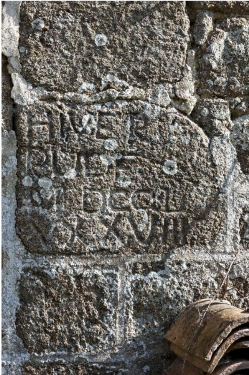
Inscriptions sur l'encadrement de la porte du logis gauche de l'alignement sud du village (2023 ZC 21) : "HIVER RUDE 1788".