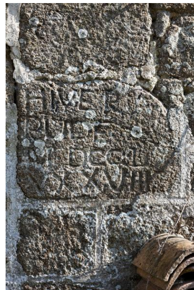
Inscriptions sur l'encadrement de la porte du logis gauche de l'alignement sud du village (2023 ZC 21) : "HIVER RUDE 1788".