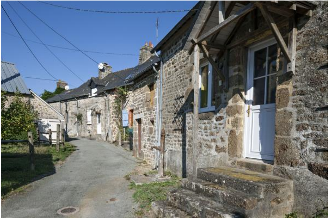
Alignement de trois maison (ZC 28-30).