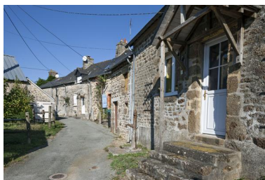
Alignement de trois maison (ZC 28-30). IVR52_20185300441NUCA