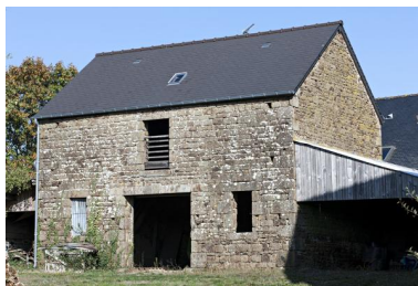
Etable-fenil (2023 ZC 104). IVR52_20185300443NUCA