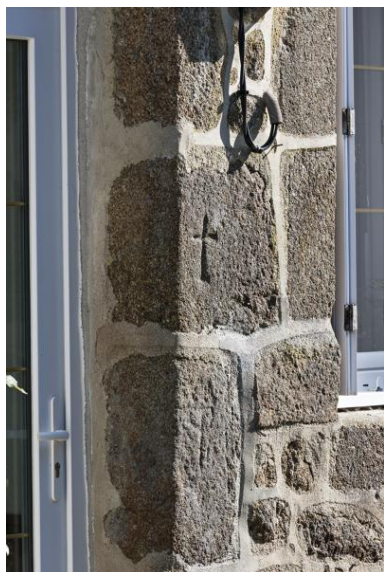
Maison (2023 ZC 90), croix gravé dans l'encadrement de porte.