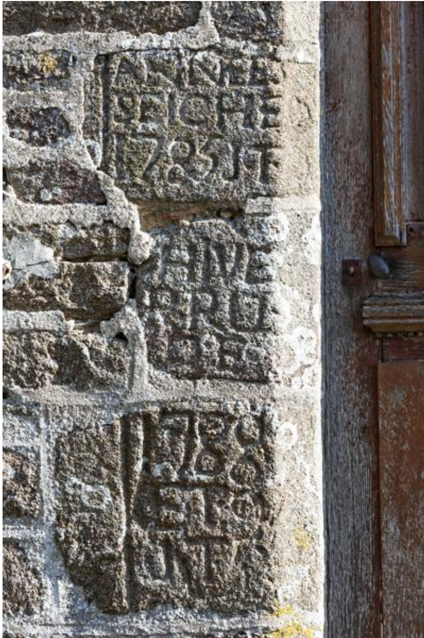
Inscriptions sur l'encadrement de la porte du logis gauche de l'alignement sud du village (2023 ZC 21) : "ANNEE SEICHE 1785 JF / HIVER RUDE / 1788 ETE ?".