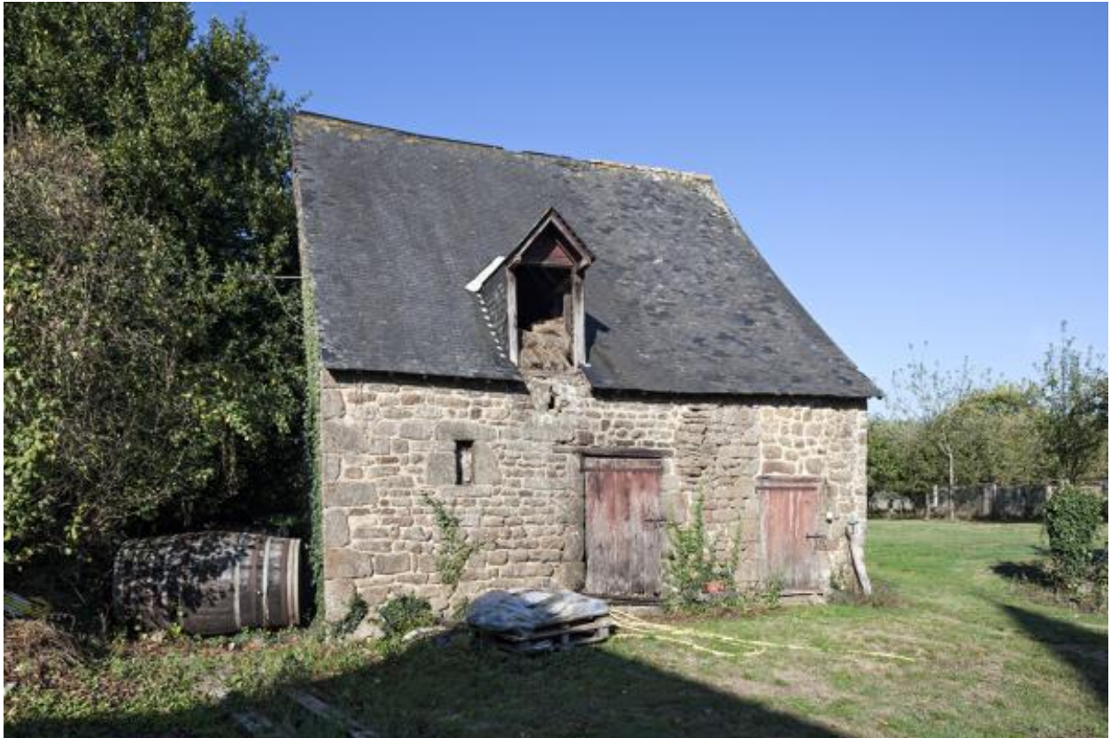
Etable-fenil (2023 ZC 132).