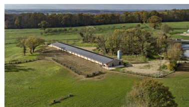
Poulailler. IVR52_20205300586NUCA