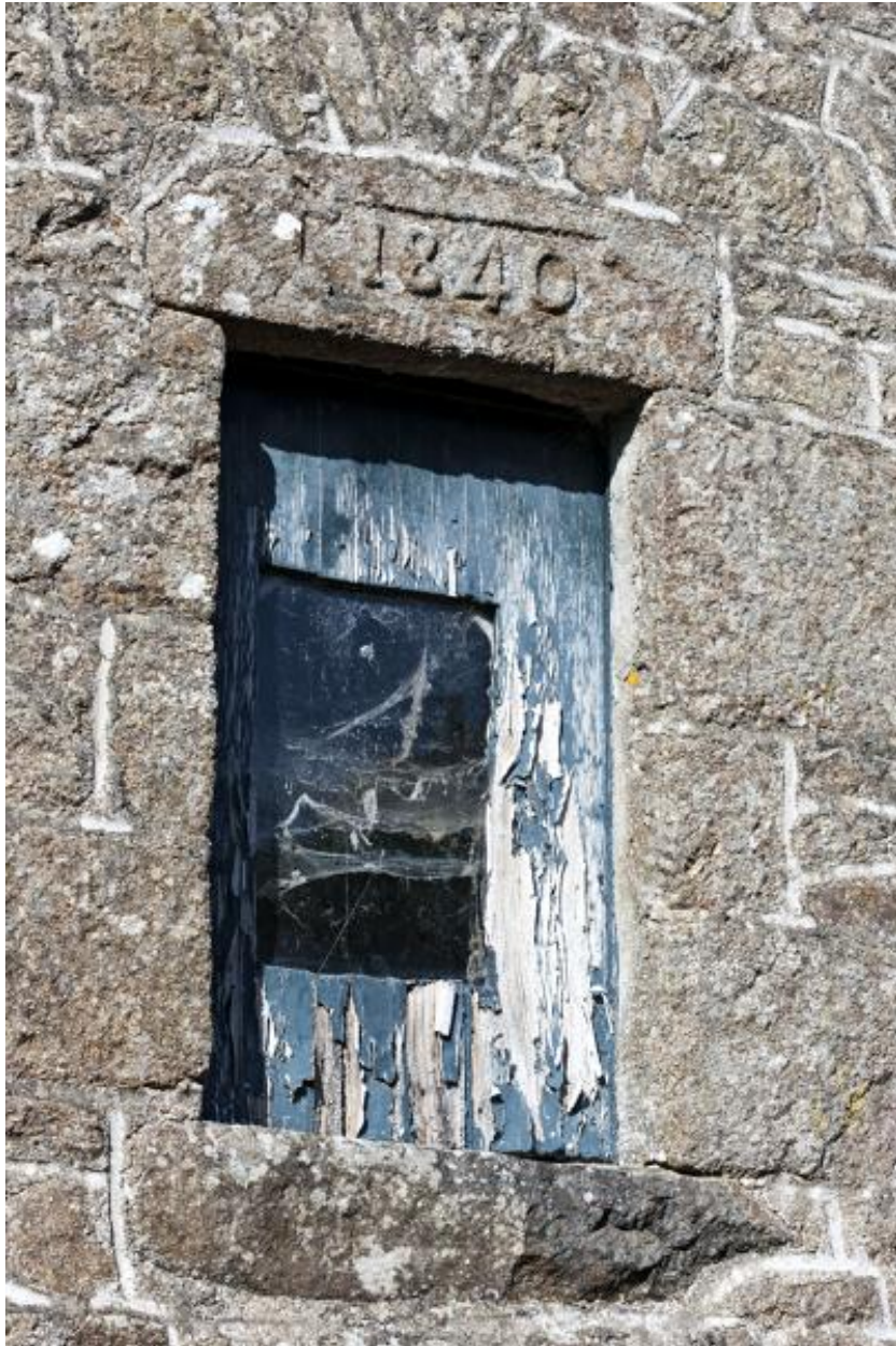
Linteau portant la date 1840, baie fenière du fournil (2023 ZC 40).