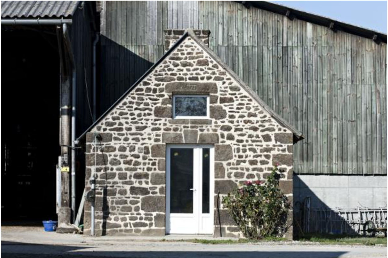
Remise (2023 ZC 132).