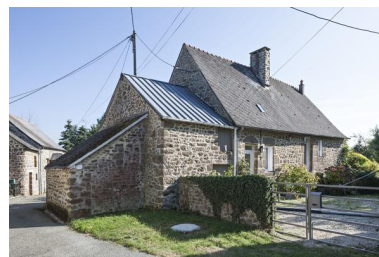
Maison (2023 ZC 90).