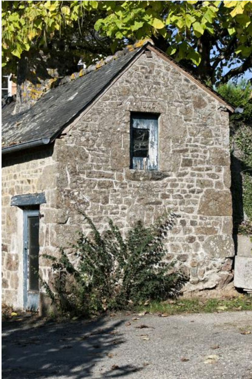
Fournil (2023 ZC 40).