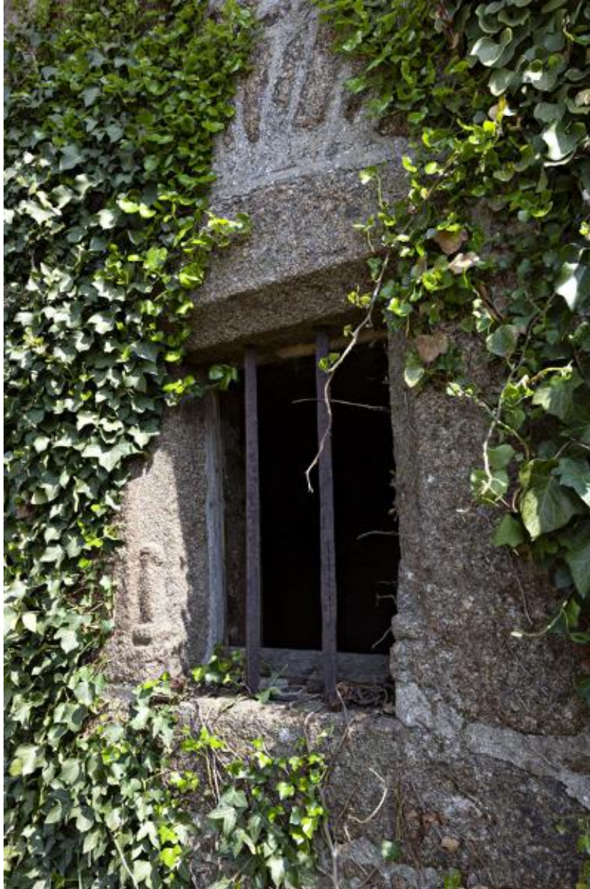
Alignement (223 ZC 21), fenêtre du logis sud.