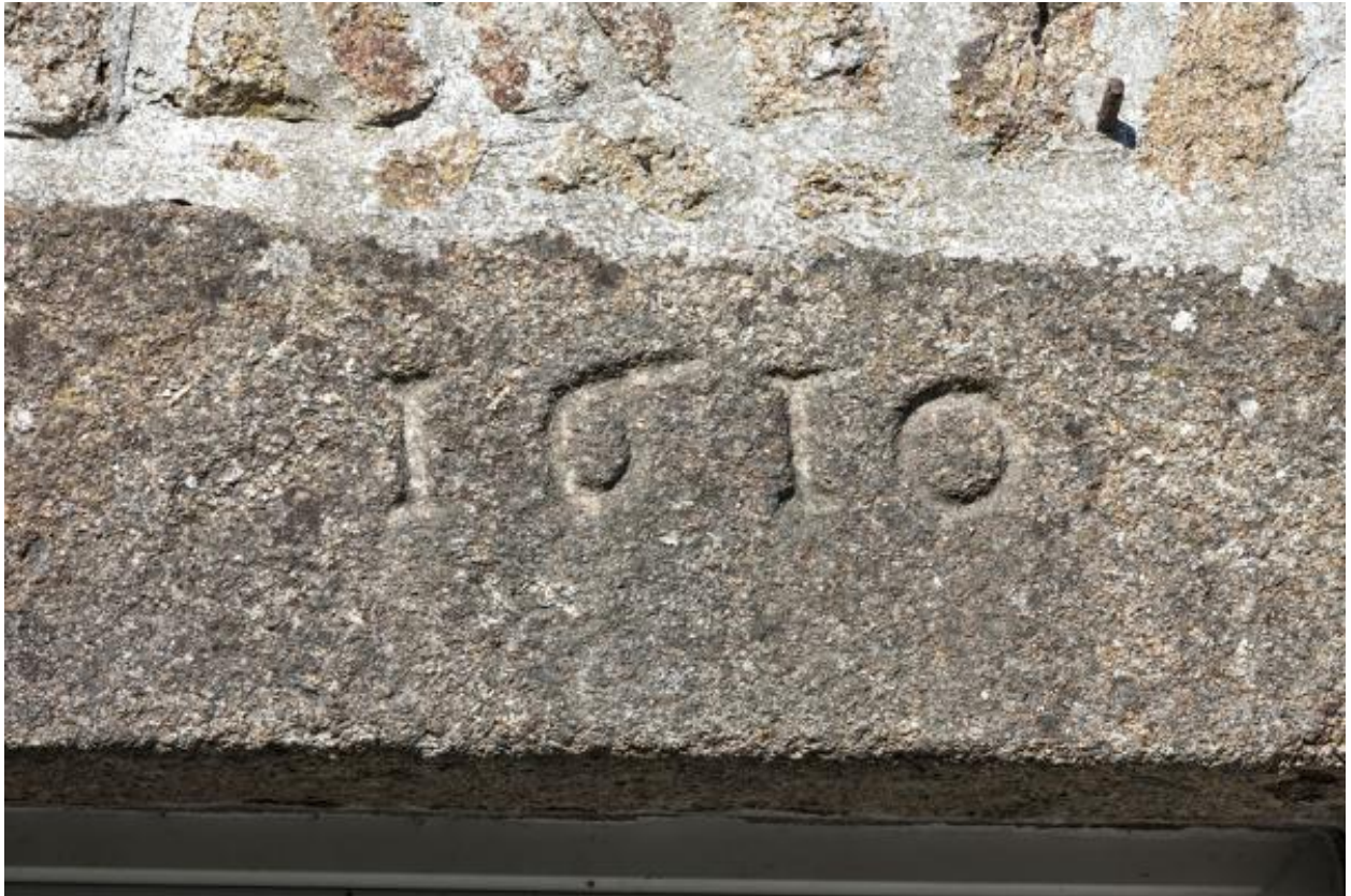
Alignement de trois maison (ZC 28-30), date portée 1610 sur le linteau de la maison ouest.