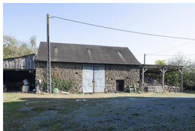
Remise (2023 ZC 132).