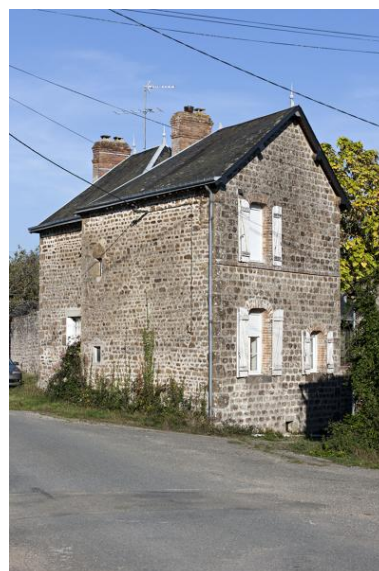
Maison (2023 ZC 40). IVR52_20185300467NUCA