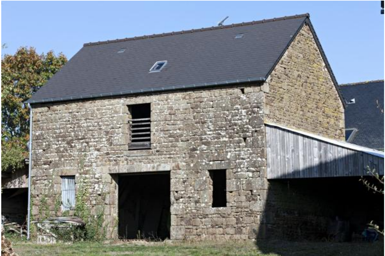
Etable-fenil (2023 ZC 104).