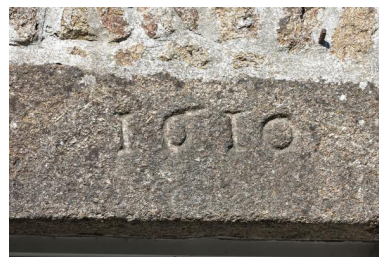
Alignement de trois maison (ZC 28-30), date portée 1610 sur le linteau de la maison ouest.