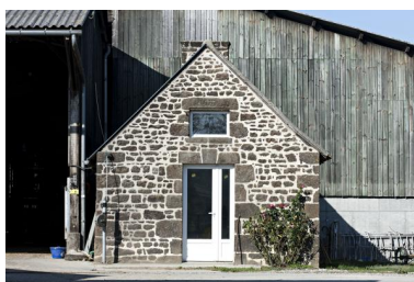
Remise (2023 ZC 132). IVR52_20185300444NUCA