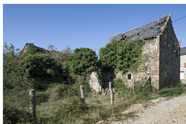
Etable-grange en ruines.