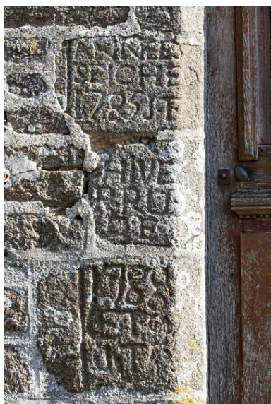
Inscriptions sur l'encadrement de la porte du logis gauche de l'alignement sud du village (2023 ZC 21) : "ANNEE SEICHE 1785 JF / HIVER RUDE / 1788 ETE ?".