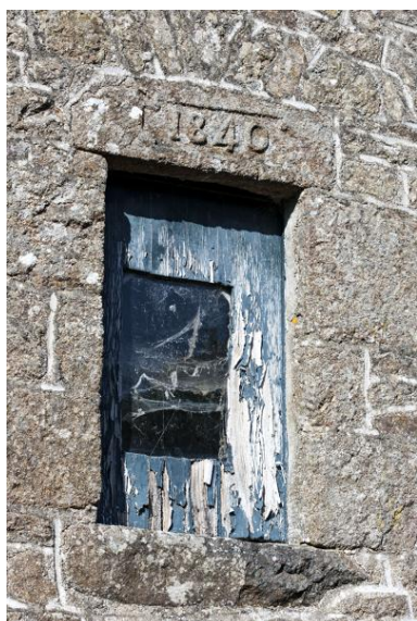
Linteau portant la date 1840, baie fenière du fournil (2023 ZC 40). IVR52_20185300440NUCA