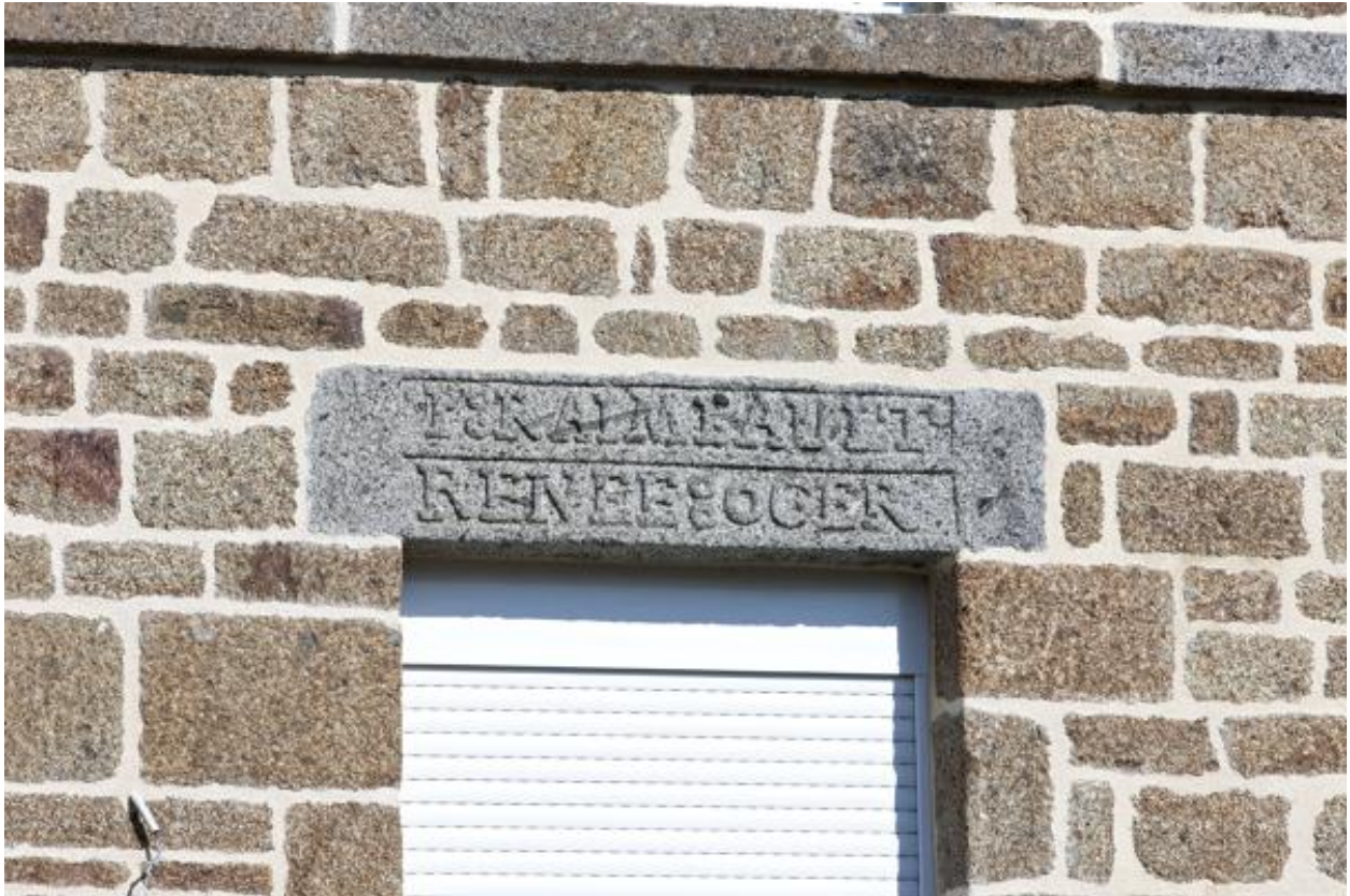
Maison (2023 ZC 105), linteau portant l'inscription "I RAIMBAULT RENE E OGER".