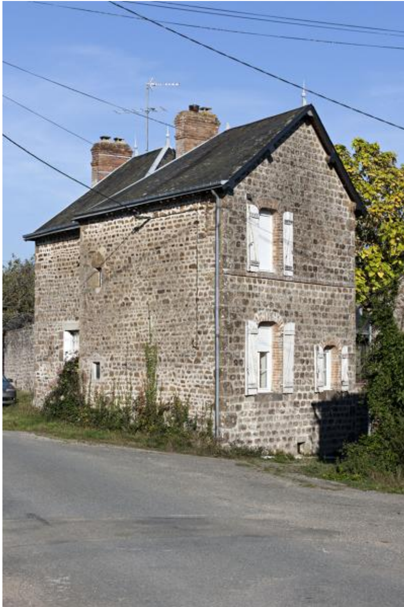
Maison (2023 ZC 40).