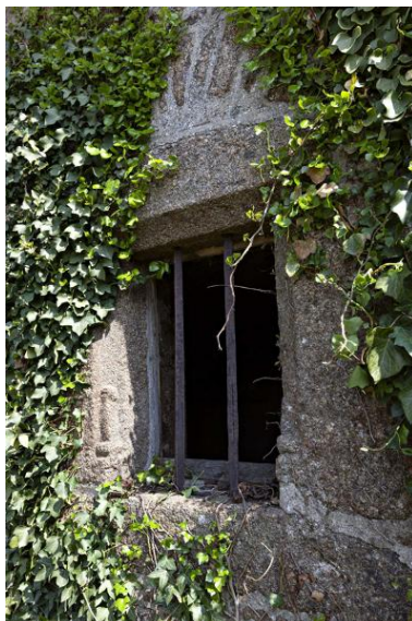
Alignement (223 ZC 21), fenêtre du logis sud.