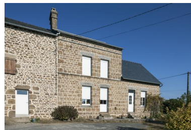
Maison (2023 ZC 105).