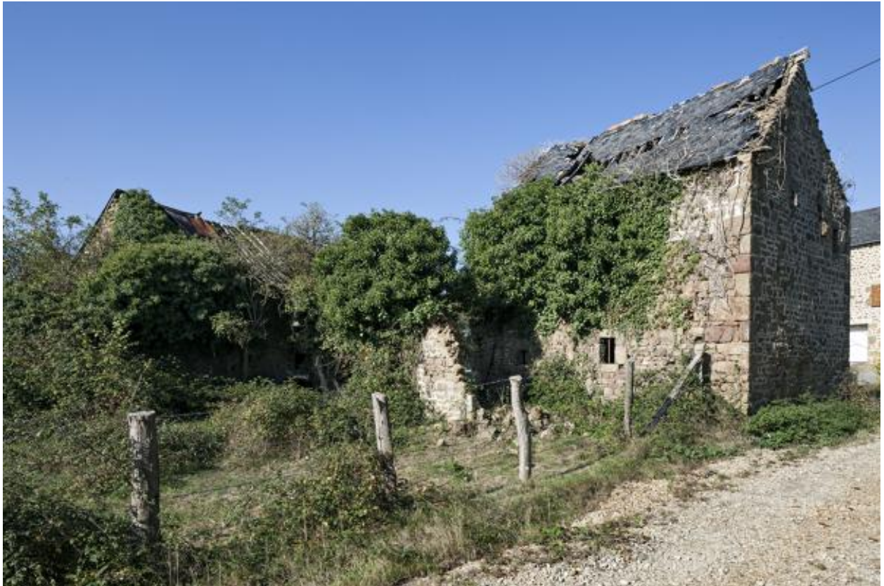
Etable-grange en ruines.