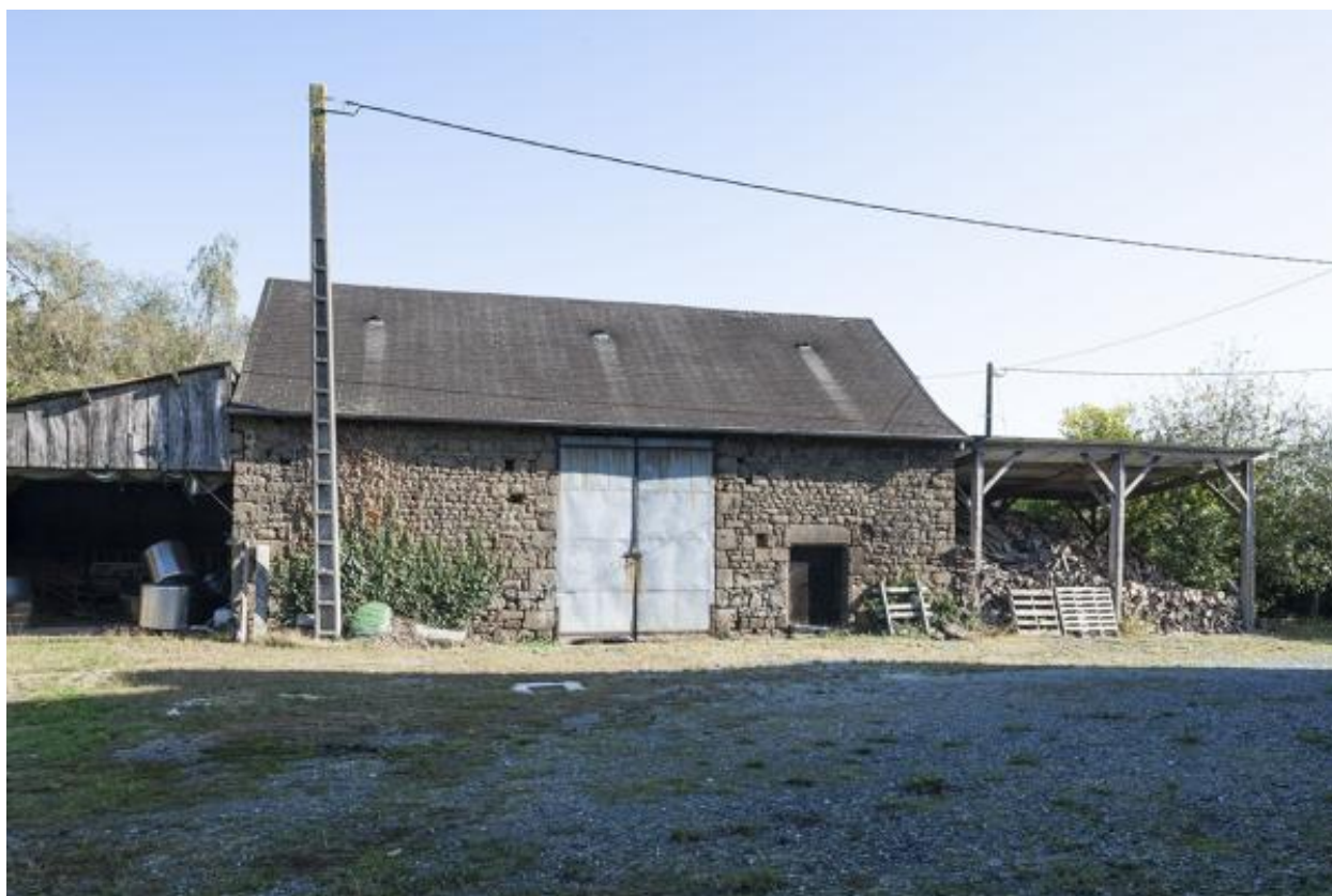
Remise (2023 ZC 132).