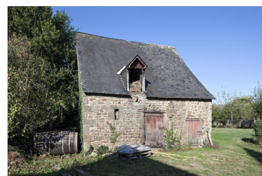
Etable-fenil (2023 ZC 132). IVR52_20185300426NUCA