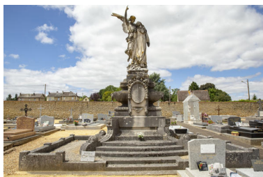
Le monument funéraire. IVR52_20207200446NUCA