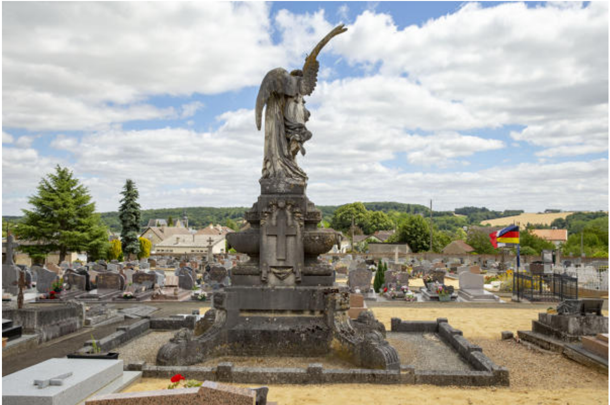
Le monument funéraire.