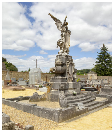
Le monument funéraire. IVR52_20207200445NUCA