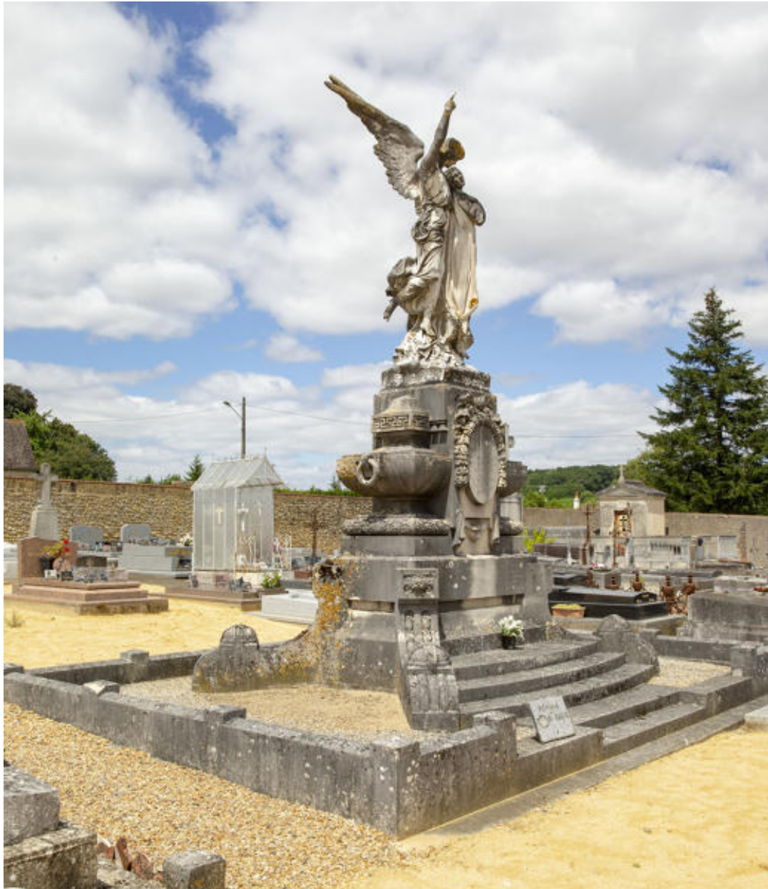
Le monument funéraire.