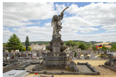
Le monument funéraire. IVR52_20207200448NUCA