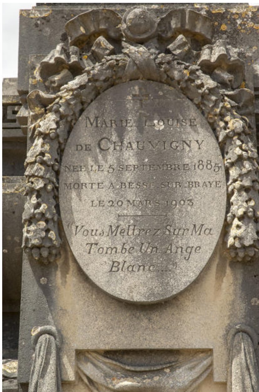
Un détail de l'épithaphe.