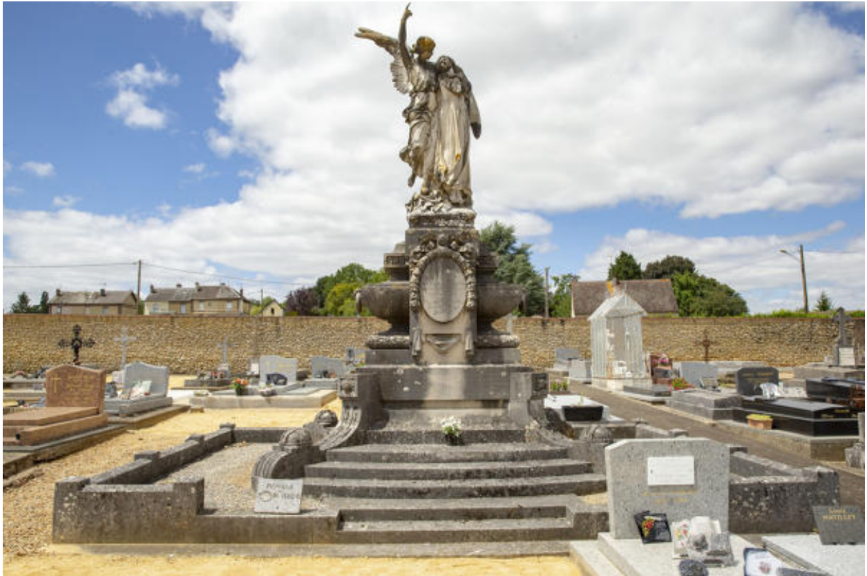
Le monument funéraire.