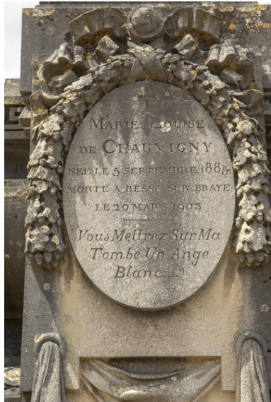
Un détail de l'épithaphe.