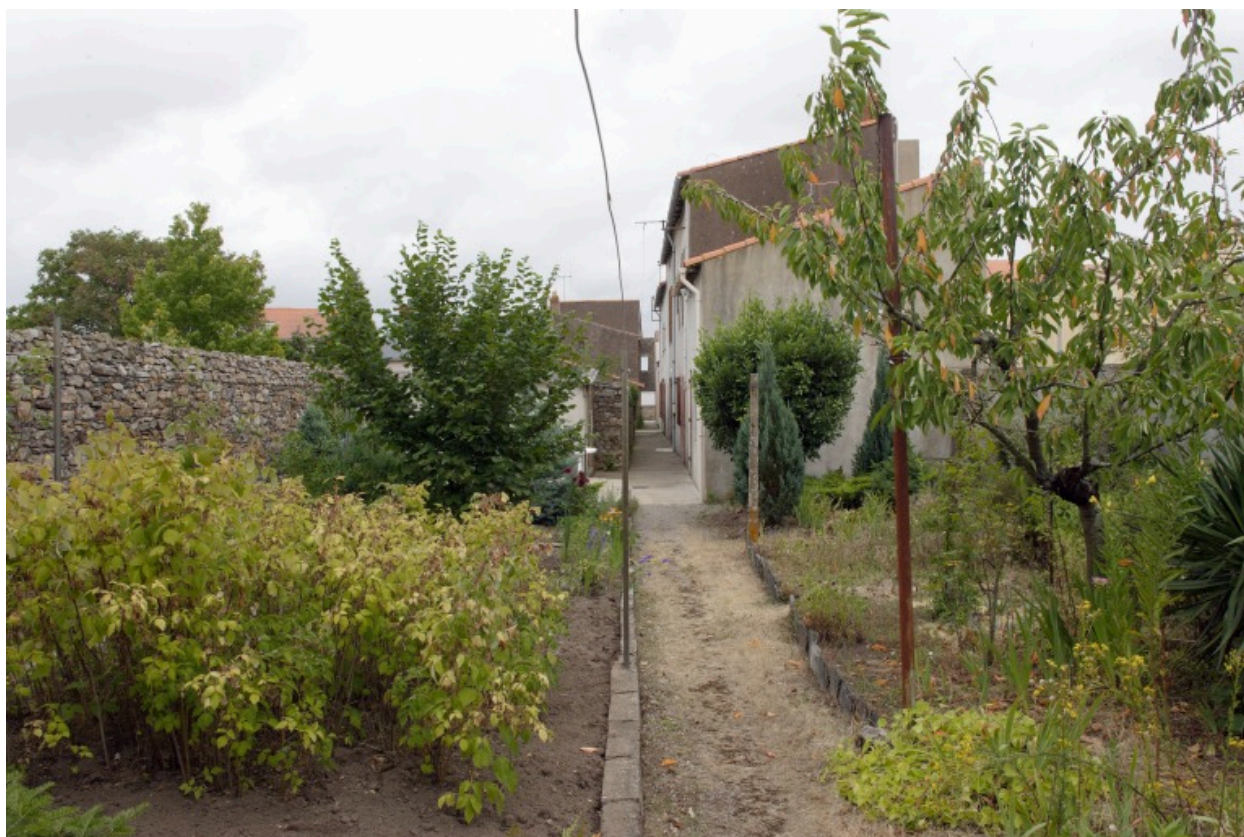
Vue d'ensemble depuis le jardin vers la Loire.