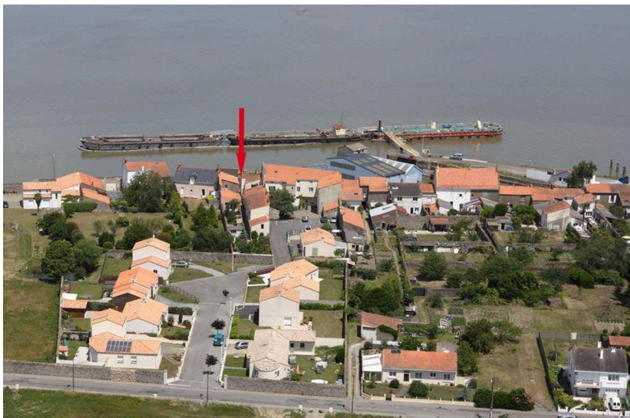
Situation sur la vue aérienne, 2010.