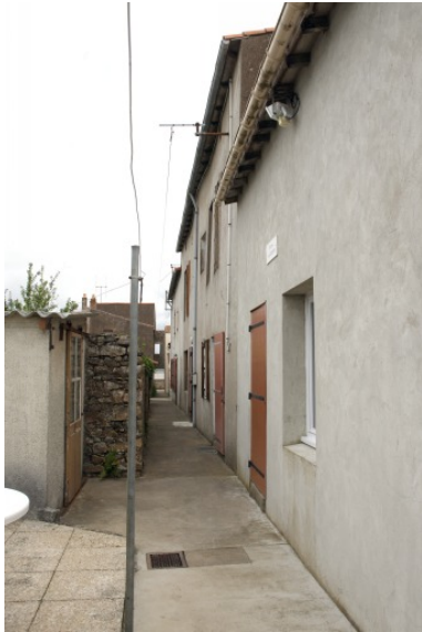
Vue d'ensemble prise depuis la ruelle vers la Loire.