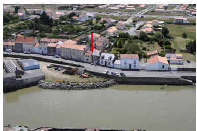
Situation sur la vue aérienne, 2010. IVR52_20104402768NUDA