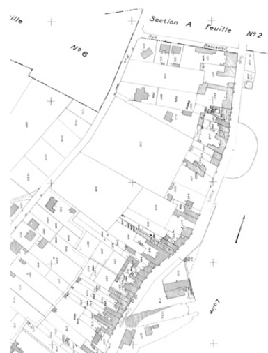
Plan cadastral, 1999, extrait. IVR52_20034400118NUCA