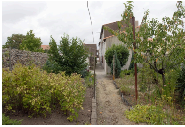
Vue d'ensemble depuis le jardin vers la Loire.