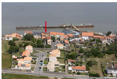
Situation sur la vue aérienne, 2010. IVR52_20104402769NUDA