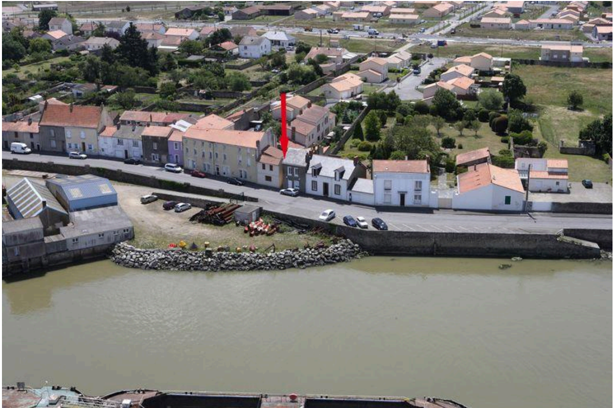
Situation sur la vue aérienne, 2010.