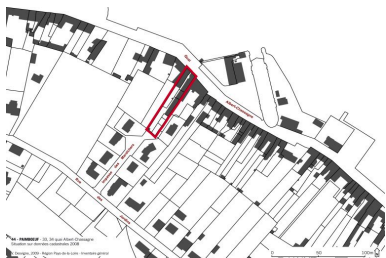
Situation sur les données cadastrales 2008. IVR52_20094400296NUDA