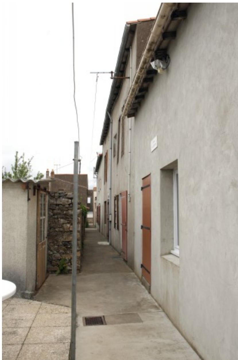
Vue d'ensemble prise depuis la ruelle vers la Loire.