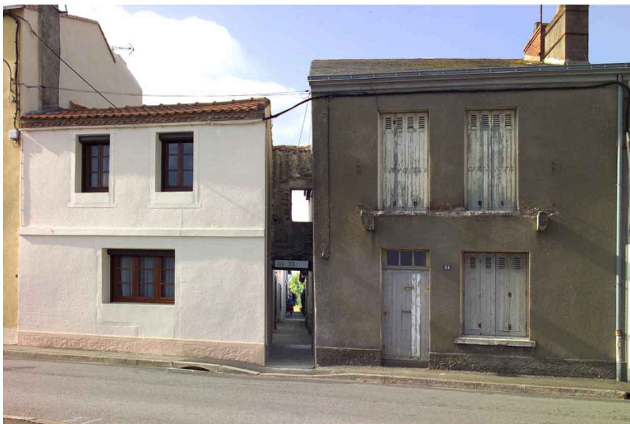
Vue d'ensemble des façades et de la ruelle depuis le quai.