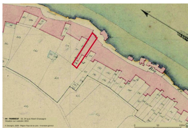
Situation sur cadastre 1810.