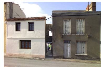
Vue d'ensemble des façades et de la ruelle depuis le quai.