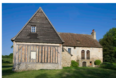
Logis : ensemble depuis l'est. IVR52_20117200583NUCA