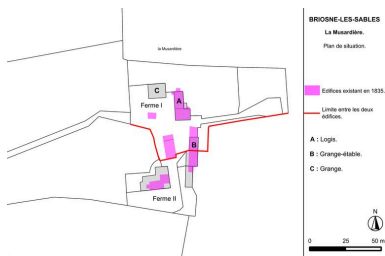
Plan de situation. IVR52_20127200039NUDA