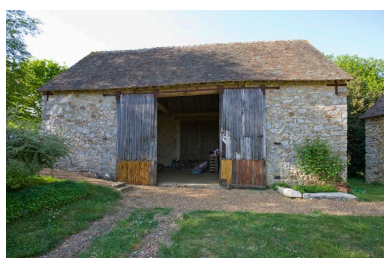
Grange : élévation antérieure. IVR52_20117200573NUCA