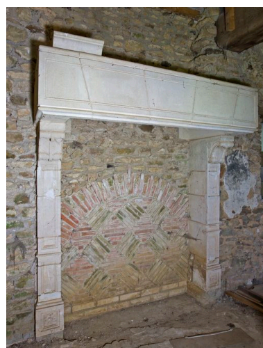
Logis, aile en retour : cheminée, 4e quart du XXe siècle. IVR52_20117200572NUCA