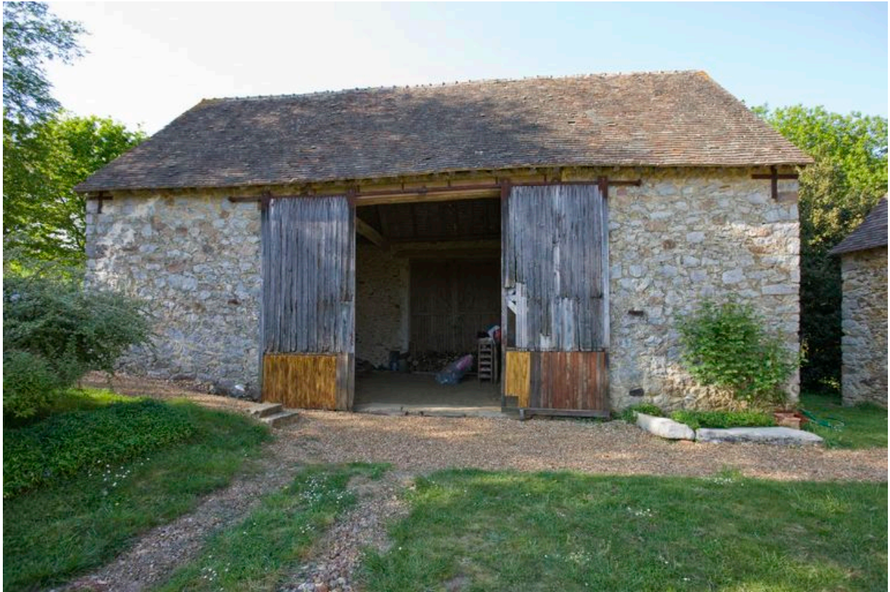
Grange : élévation antérieure.