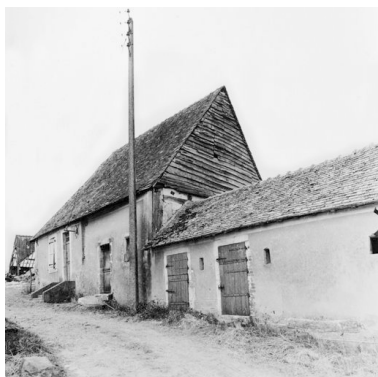
Le logis vu du sud-est : état vers 1979. Les porcheries prolongeant l'aile en retour sont détruites.