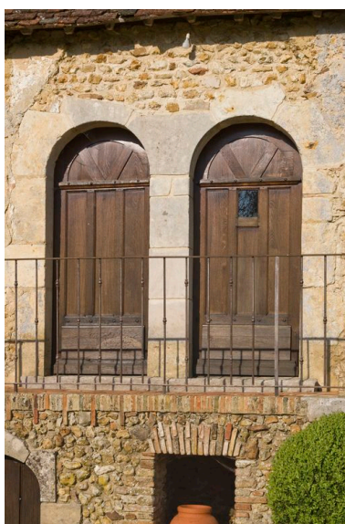
Logis : portes jumelles de l'élévation postérieure du corps principal. IVR52_20117200584NUCA