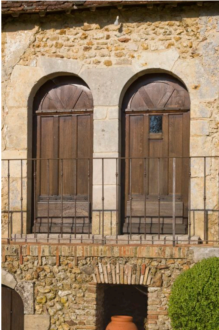
Logis : portes jumelles de l'élévation postérieure du corps principal.