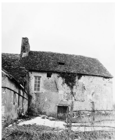
Logis, élévation postérieure du corps principal : état vers 1979.