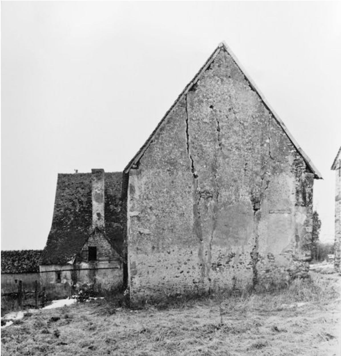
Logis vu depuis le nord : état vers 1979.