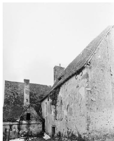
Logis vu depuis le nord-est : état vers 1979. A noter l'essentage en bardeaux du four à pain.