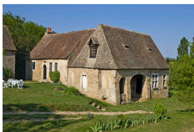
Logis, vue d'ensemble depuis le sud-ouest.