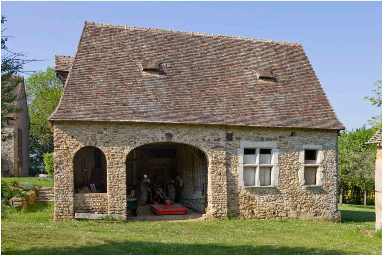
Logis : élévation antérieure de l'aile en retour.