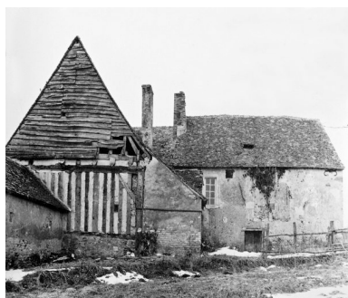
Logis vu depuis l'est : état vers 1979. IVR52_20117200575NUCA