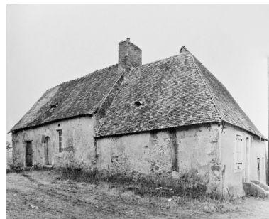
Vue du logis depuis le sud-ouest : état vers 1979. IVR52_20117200577NUCA