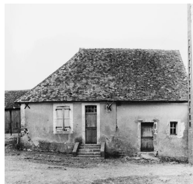
Logis, élévation antérieure de l'aile en retour : état vers 1979.