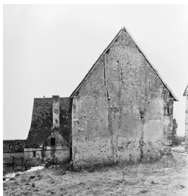
Logis vu depuis le nord : état vers 1979.