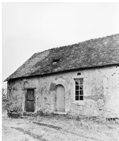
Logis, élévation antérieure du corps principal : état vers 1979. IVR52_20117200580NUCA