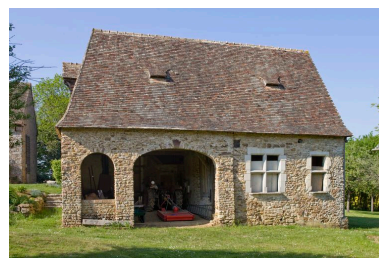
IVR52_20117200579NUCA Logis : élévation antérieure de l'aile en retour. IVR52_20117200570NUCA