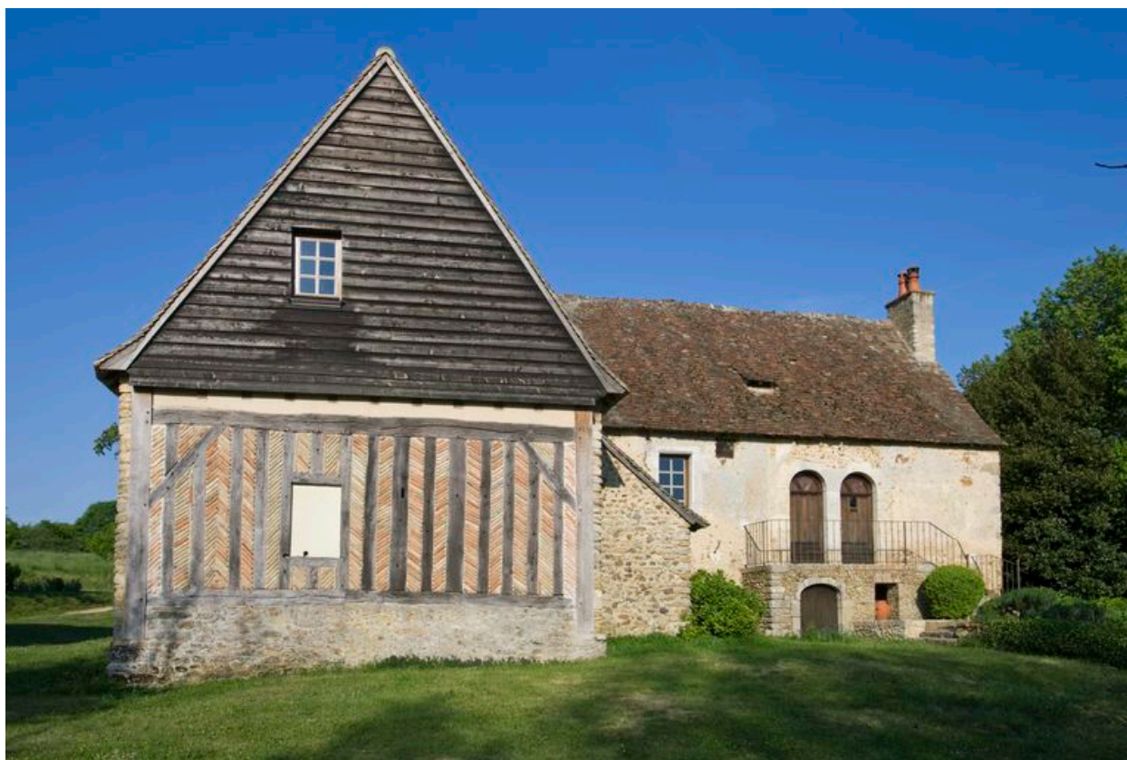
Logis : ensemble depuis l'est.