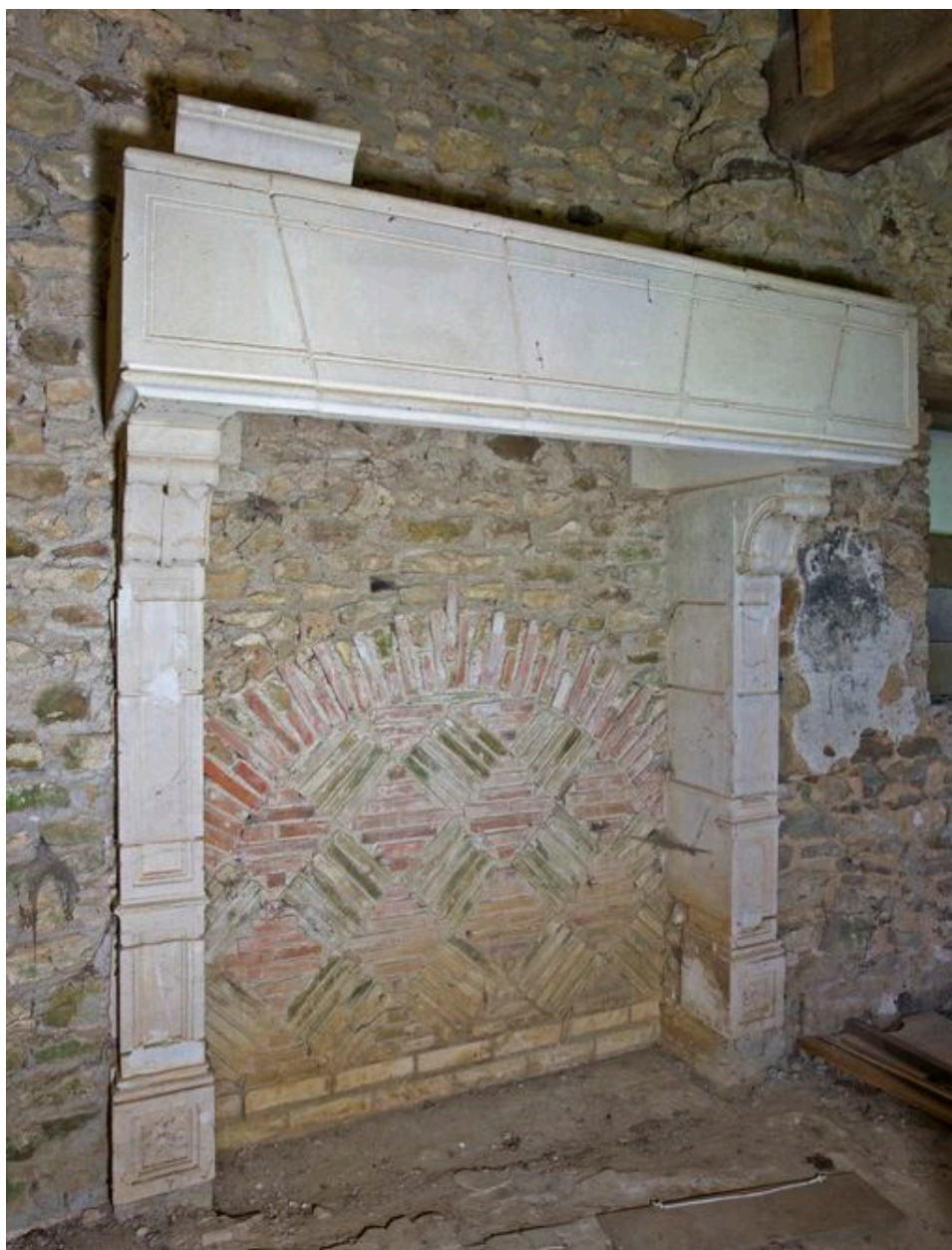
Logis, aile en retour : cheminée, 4e quart du XXe siècle.