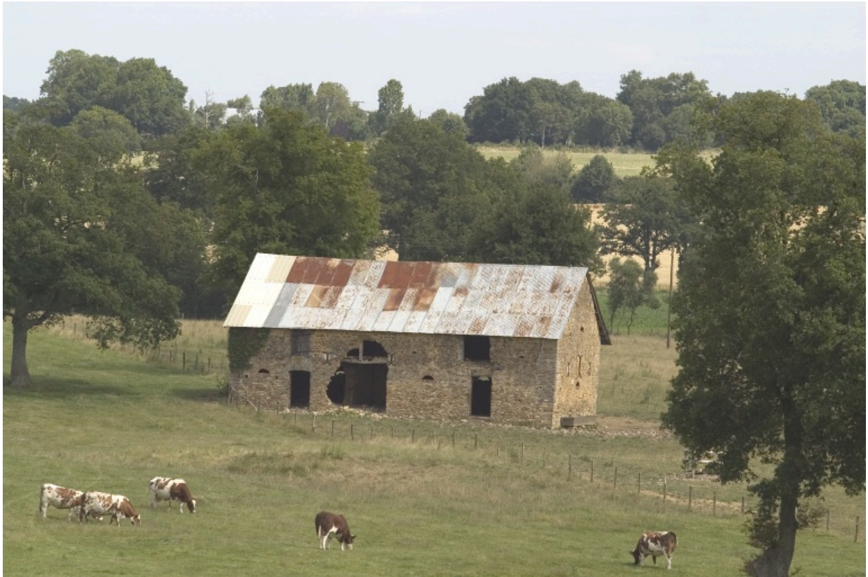
L'étable-grange vue depuis le sud.