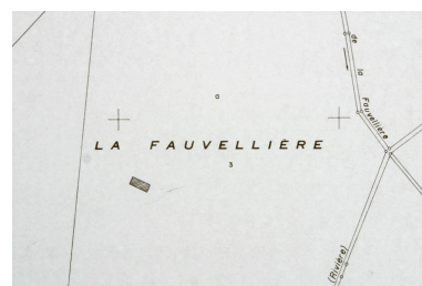
Extrait du plan cadastral renouvelé en 1982 et régulièrement mis à jour entre 1982 et 2002, section YB. IVR52_20045302342NUCA