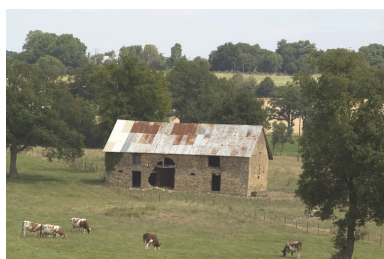
L'étable-grange vue depuis le sud. IVR52_20045302175NUCA