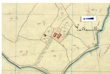
Extrait du plan cadastral de 1842, section F2. IVR52_20045301154NUCA