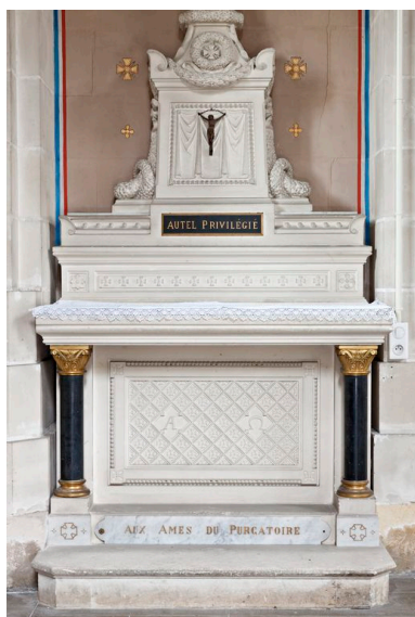
Chœur, côté nord. Chapelle des âmes du Purgatoire : monument aux morts, détail de l'autel.