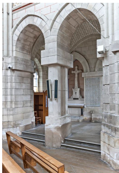
Chœur, côté nord. Chapelle des âmes du Purgatoire : vue d'ensemble. IVR52_20134900902NUCA