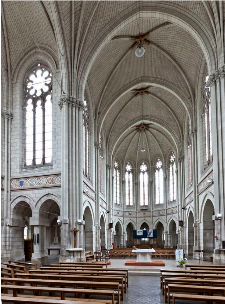
Vue d'ensemble vers le chœur.