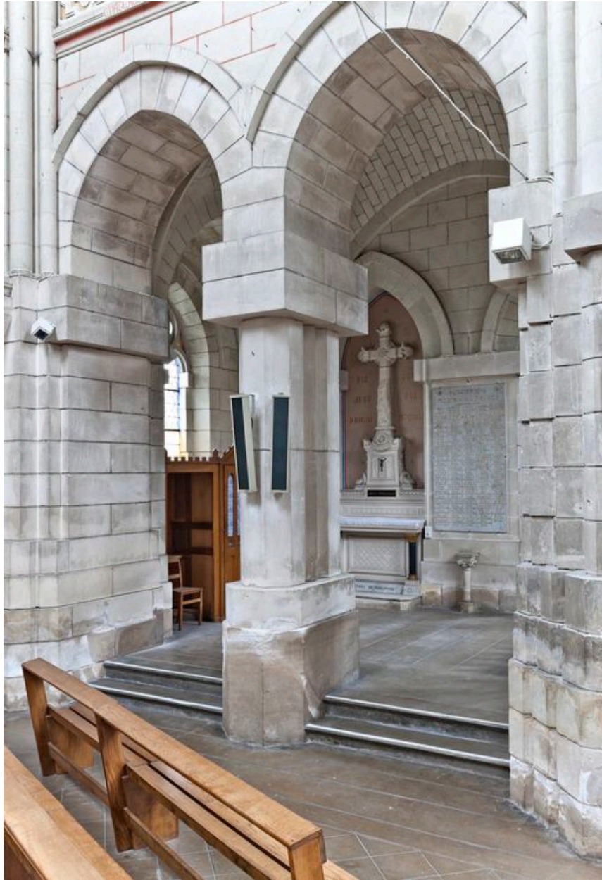
Chœur, côté nord. Chapelle des âmes du Purgatoire : vue d'ensemble.