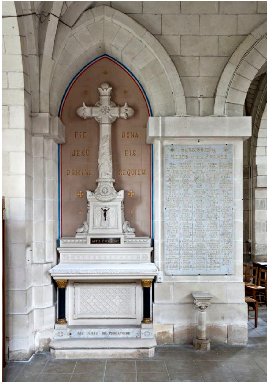
Chœur, côté nord. Chapelle des âmes du Purgatoire : vue d'ensemble du monument aux morts.