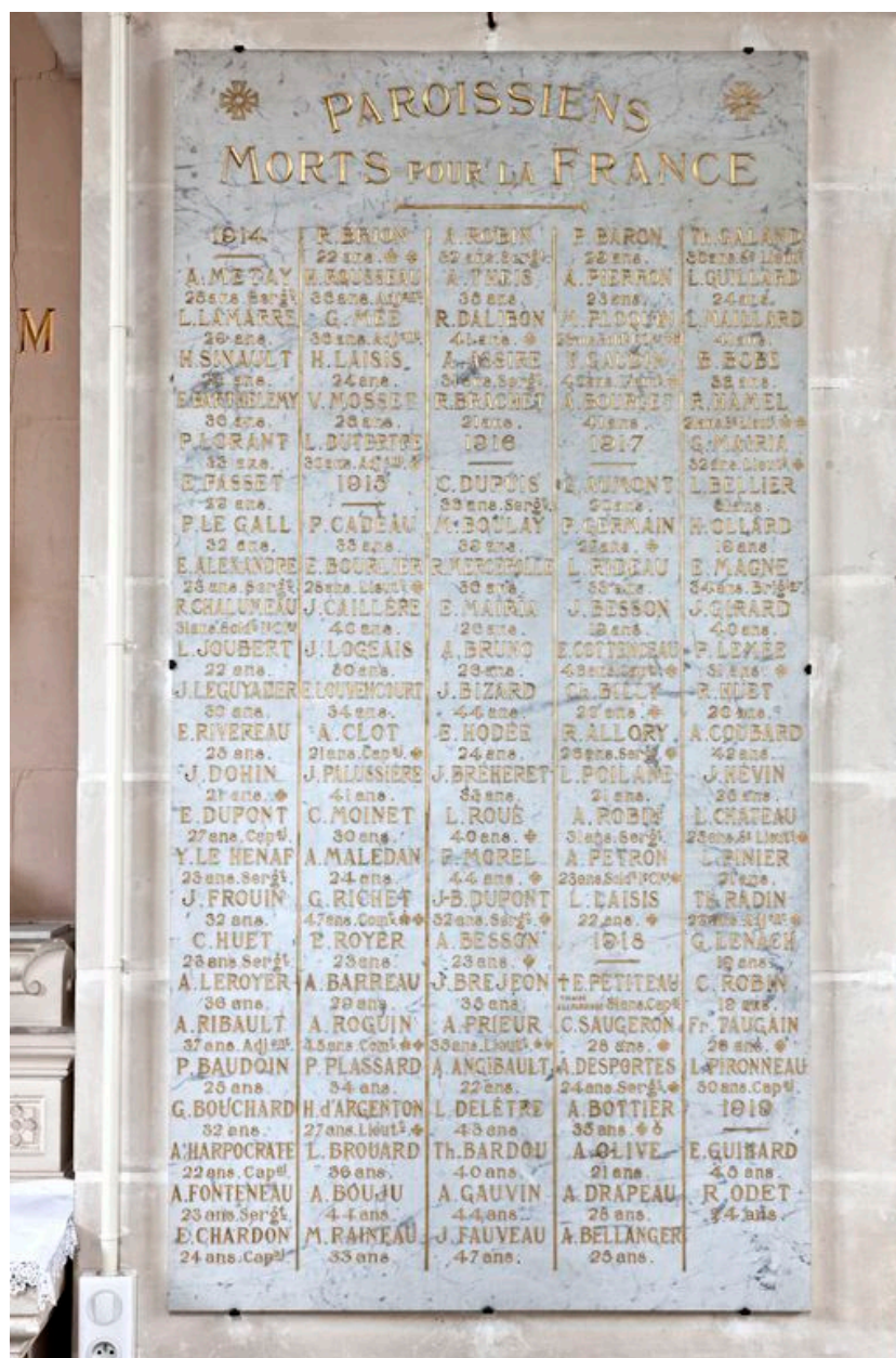
Chœur, côté nord. Chapelle des âmes du Purgatoire : monuments aux morts, détail de la plaque de marbre des noms des soldats tués au cours de la Grande Guerre.