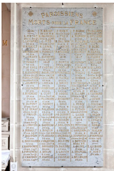
Chœur, côté nord. Chapelle des âmes du Purgatoire : monuments aux morts, détail de la plaque de marbre des noms des soldats tués au cours de la Grande Guerre. IVR52_20134900899NUCA