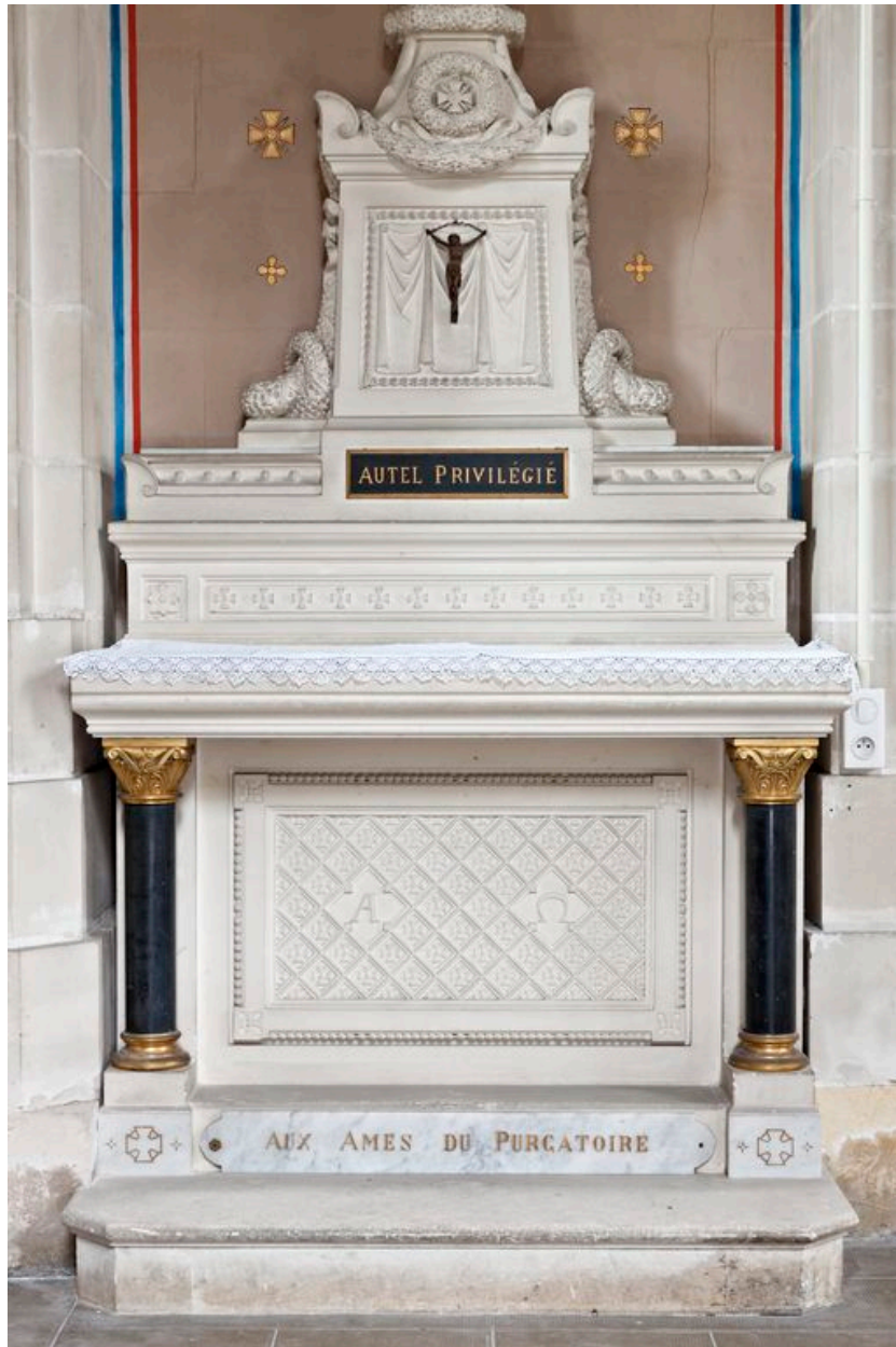
Chœur, côté nord. Chapelle des âmes du Purgatoire : monument aux morts, détail de l'autel.