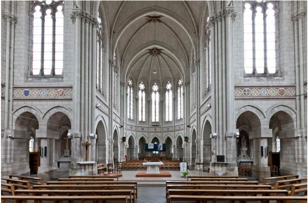
Vue d'ensemble du chœur et des chapelles. Le monument aux morts est situé dans la chapelle du Purgatoire, côté nord.