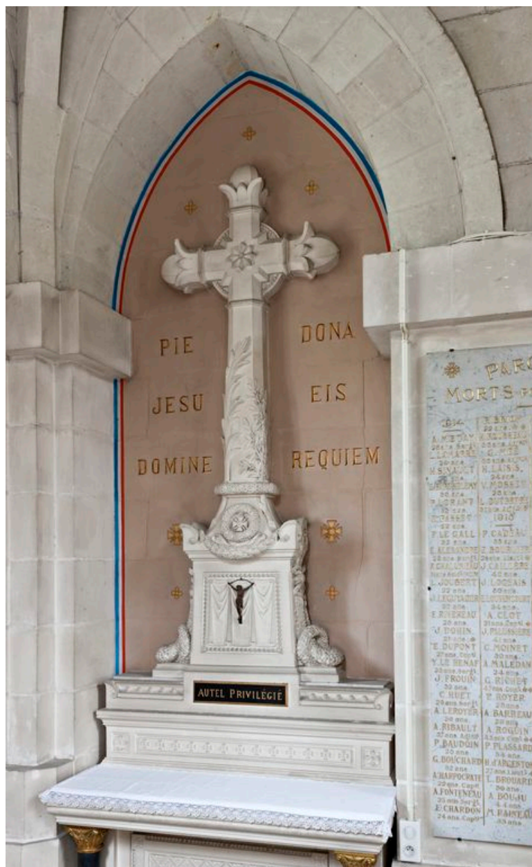
Chœur, côté nord. Chapelle des âmes du Purgatoire : monument aux morts, détail de la croix.