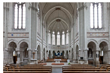
Vue d'ensemble du chœur et des chapelles. Le monument aux morts est situé dans la chapelle du Purgatoire, côté nord.