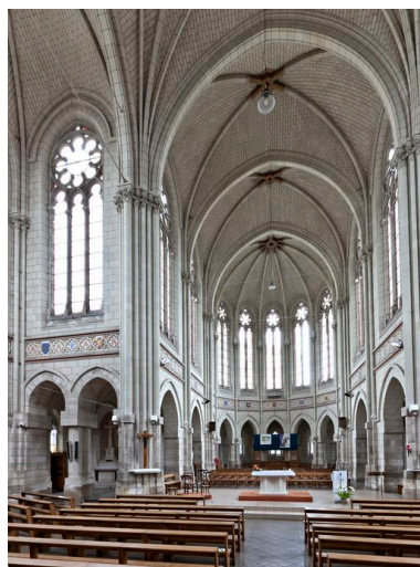
Vue d'ensemble vers le chœur.