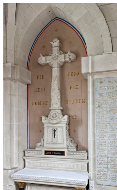
Chœur, côté nord. Chapelle des âmes du Purgatoire : monument aux morts, détail de la croix.