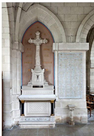
Chœur, côté nord. Chapelle des âmes du Purgatoire : vue d'ensemble du monument aux morts.